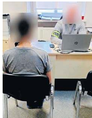
29-letniej matce grozi kara więzienia

Na miejsce natychmiast skierowano patrol. 29-letnia obywatelka Ukrainy szarpała się z inną kobietą, próbując wyrwać jej z rąk swoje dziecko. Interweniujący policjanci natychmiast podjęli zdecydowane działania i obezwładnili agresywną kobietę. Jak relacjonowała zgłaszająca, jadąc samochodem zauważyła kobietę prowadzącą za rękę małego chłopca. W pewnym momencie oboje upadli