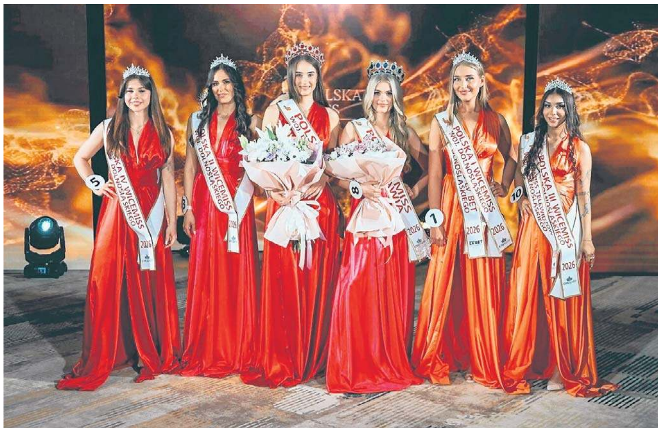
Oto najpiękniejsze Dolnoślązaczki. Zdobyczynie głównych tytułów finału wojewódzkiego konkursu Miss Polski, który się odbył 19 kwietnia we Wrocławiu