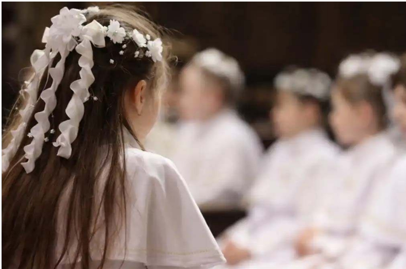
Organizacja Pierwszej Komunii to proces wymagający uporządkowania i umiejętności przewidywania. To nie pojedynczy dzień, lecz ciąg przemyślanych decyzji