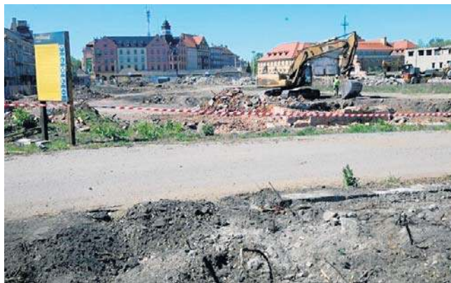
Powstanie tu centrum przesiadkowe, które ułatwi korzystanie z pociągów i autobusów