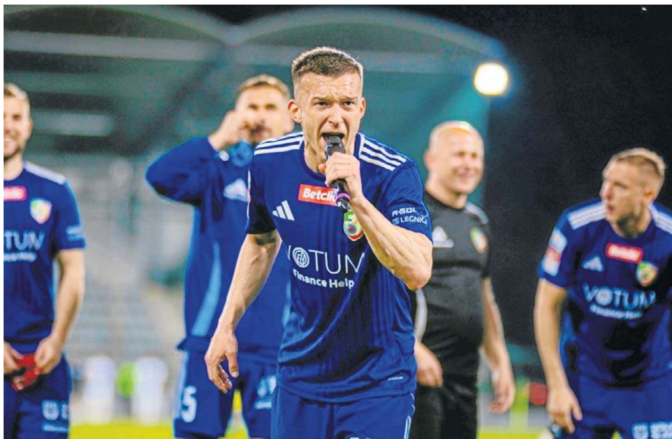
Po sobotniej wygranej Miedzianka wciąż ma szanse na zakwalifikowanie się do baraży

PIŁKA NOŻNA TERAZ PRZED MIEDZIANKĄ OSTRY EGZAMIN Z WIECZYSTĄ