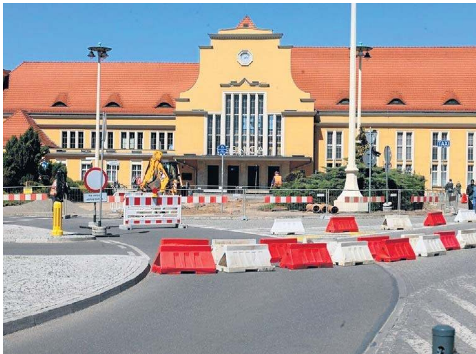
Roboty przy dworcu poważnie utrudniły dojazd podróżnych

Nowe rozwiązania znajdują się też na bezpośrednio przy-