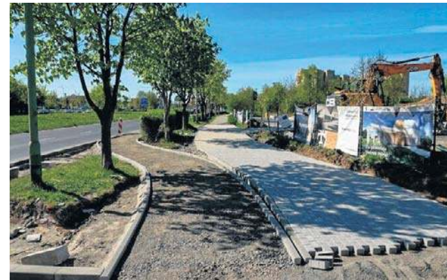
Dobiega końca przebudowa chodnika i ścieżki rowerowej prowadzącej do żłobka

przed obiektem od strony południowej, gdzie będzie zlokalizowany plac zabaw. Zakończenie budowy zaplanowano na czerwiec 2026 roku.