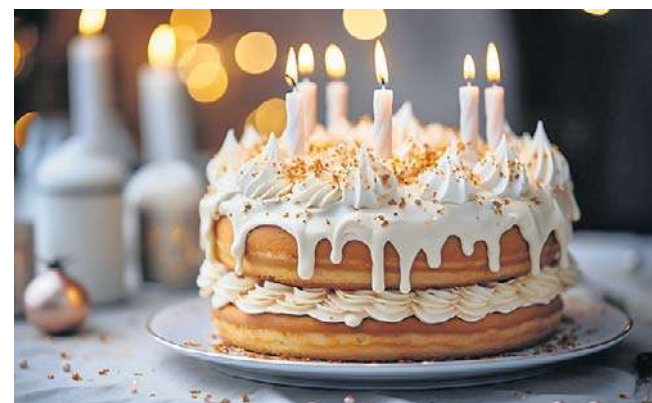
Prawo do świadczenia honorowego zostaje przyznane automatycznie, bez potrzeby składania wniosku.

Formularz wniosku o świadczenie honorowe (ESH) jest dostępny na stronie internetowej zus.pl i w każdej placówce Zakładu Ubezpieczeń Społecznych. ©