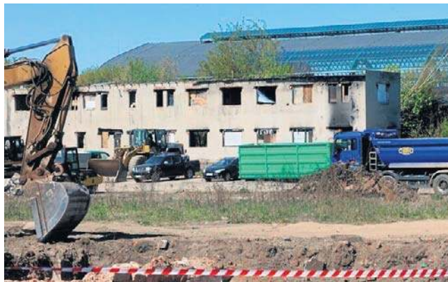
Roboty trwają już niemal na całej powierzchni przyszłego centrum przesiadkowego

ległym fragmencie ulicy Kartuskiej, która zyska dodatkowy pas ruchu i będzie odsunięta od kamienic.