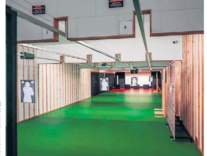
Znalazło się też miejsce na nowoczesną strzelnicę