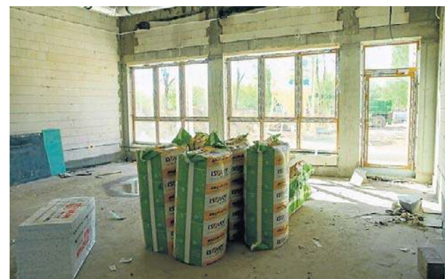
Po zakończeniu robót budowlanych przyjdzie czas na wyposażenie żłobka w sprzęt