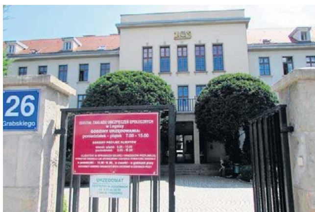
Linki do szkoleń on-line znajdziecie na stronie legnickiego ZUS.pl

25 maja - 10:00 - 12:00 - „Dyżur telefoniczny eksperta ZUS: Świadczenie wspierające - jak może mi pomóc?” - nr 76 876 41 03 (dyżur jest aktywny tylko w podanych godzinach).