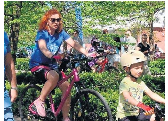
Na trasie Paradyzy Rowerowej, zorganizowanej w ramach majówki, pojawiły się wszystkie legnickie pokolenia