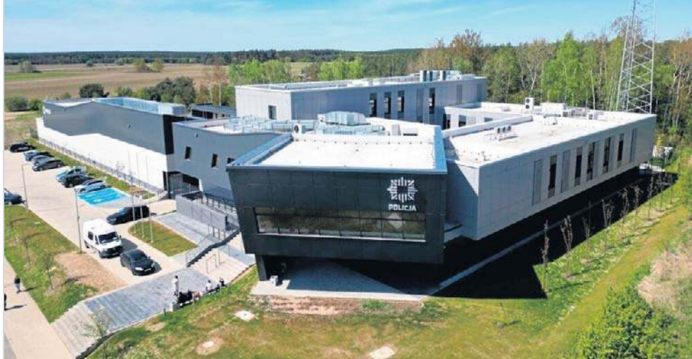
Nowy budynek komendy kosztował 55 mln zł. Budowa trwała trzy lata

W trzecim budynku mieszczą się m.in. strzelnica, kojce dla psów oraz siłownia dla funkcyj-