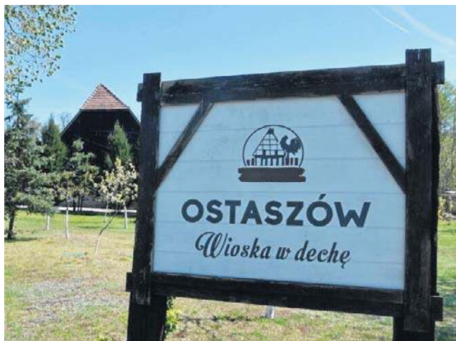
Wieś jest niezwykle zadbane. Obecnie liczy około 200 mieszkańców