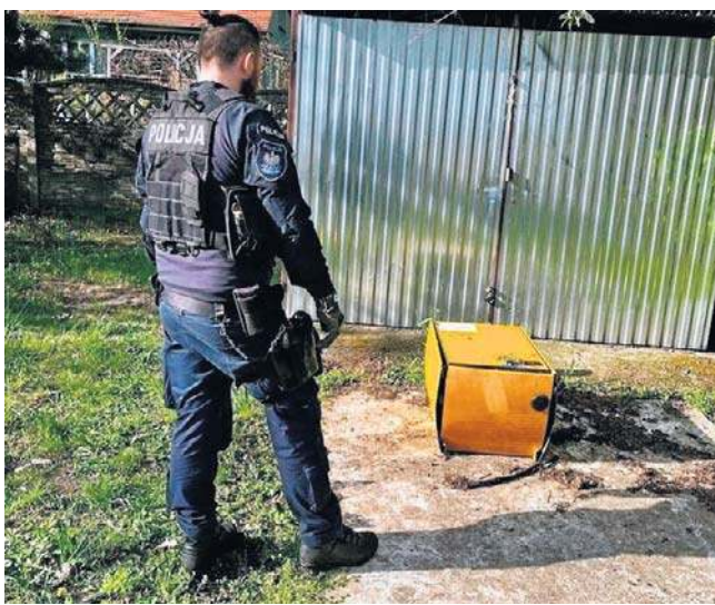
Policjanci znaleźli fotoradar porzucony koło świetlicy

- Dzielnicowi uzyskali informację o przedmiocie, który może pochodzić z przestępstwa. Przed garażem świetlicy wiejskiej zauważyli uszkodzony fotoradar - informuje Magdalena Wiaderek z KPP w Polkowicach.