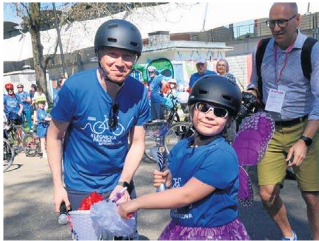
300 miłośników jazdy na rowerze wystartowało w Legnickiej Paradyze Rowerowej