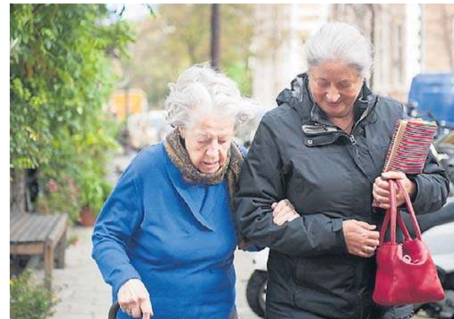
Świadczenie honorowe dla stulatków wynosi 6 938,92 zł brutto miesięcznie.

Dodatkowo refundacją objęto m.in. docetaksel w raku przełyku oraz paklitaksel w zaawansowanym raku żołądka. ©