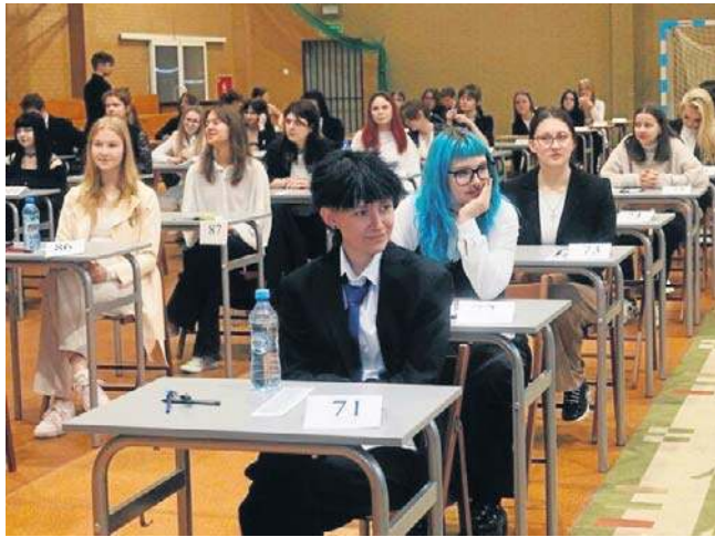
ZDJĘCIE ILLUSTRACYJNE