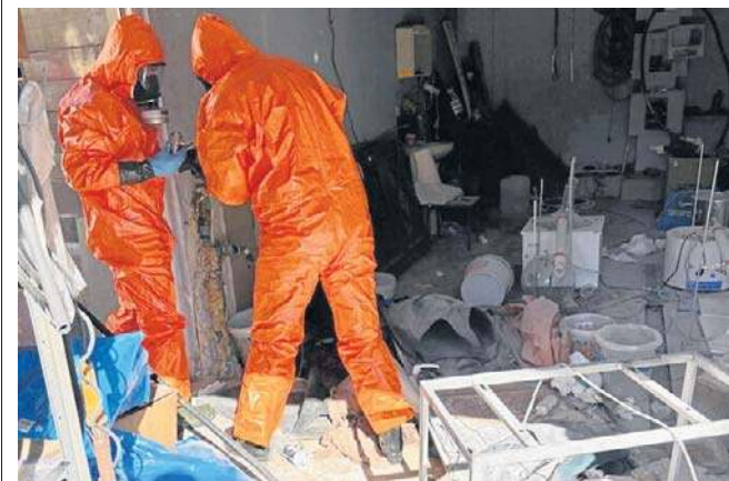
Wewnątrz budynku funkcjonariusze znaleźli aktywną linię produkcyjną metamfetaminy

Policjanci Komendy Miejskiej Policji w Legnicy w ciągu niespełna trzech lat zlikwidowali już łącznie 6 laboratoriów narkotykowych na terenie powiatu legnickiego. Wobec osób czerpiących zyski z produkcji i handlu narkotykami nie będzie żadnej taryfy ulgowej - zapewnia kom. Jagoda Ekiert.