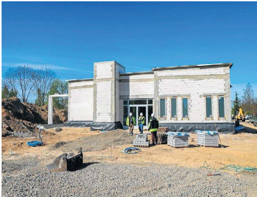
Obiekt jest zadaszony, stawiane są ostatnie ściany działowe i montowane instalacje

- Obiekt jest już zadaszony, wewnątrz stawiane są ostatnie ściany działowe i montowane instalacje. Na ukończeniu jest proces szklenia - informuje Maciej Kupaj, prezydent Legnicy.