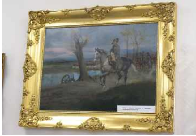
Na obrazie Jerzego Kossaka - Napoleon na Mazowszu