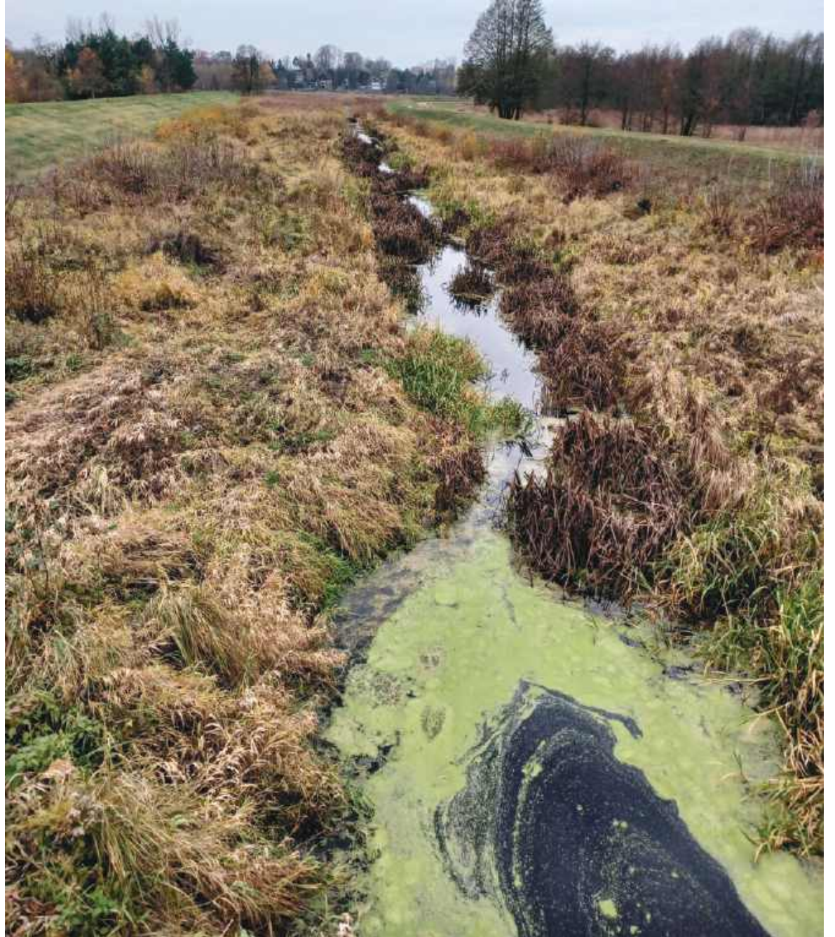
Prut przed rewitalizacją

Przyroda nie zawsze odradza się sama. Czasem potrzebuje ludzi, którzy zauważą problem, nazwą go po