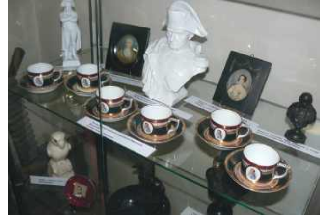
Serwis kawowy z podobizną Napoleona

NASIELSK. Wystawa o Napoleonie w 220. rocznicę pobytu cesarza w mieście.