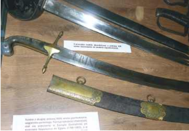
Na obrazie Jerzego Kossaka - Napoleon na Mazowszu