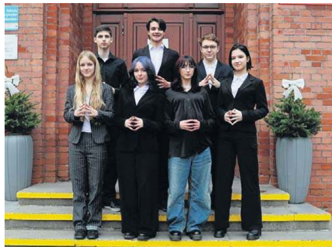
Twórcy projektu przed swoją szkołą

- „AEqualis” to międzynarodowy projekt społeczny realizowany w ramach olimpiady „Zwolnieni z Teorii” przez uczniów II Liceum Ogólnokształcącego im. Adama Mic-