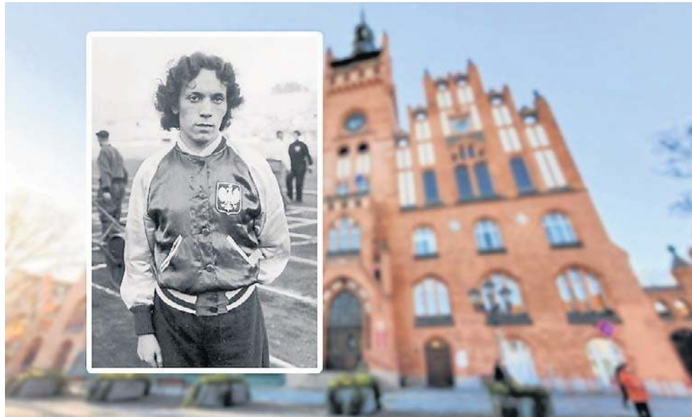
Stanisława Walasiewiczówna święciła triumfy m.in. w biegach sprinterskich i skoku w dal. Zdobyła m.in. złoty medal w biegu na 100 metrów na igrzyskach w 1932 r.

Wspomniana ulica pojawia się w dokumentach już w 1981 roku, kiedy to Miejska Rada Narodowa w Słupsku przydzieliła patronów ulicom, które zostały zaprojektowane do wybudowania. Jednak ostatecznie ulica Stanisławy Walasiewiczówny nigdy nie powstała.