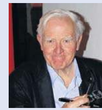
JOHN LE CARRÉ (1931-2020)

– powtórzyła, nadal wpatrując się w noc. – Zdecydowane „nie”. Pan Pine nie ma żadnych podejrzeń, jak ta informacja mogła dotrzeć do Londynu albo wpaść w ucho przyjaciół pana Ropera. Nie ma żadnych podejrzeń co do sejfu, papierów... – Nie. Nie ma. Przykro mi.