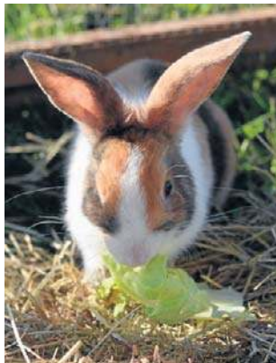
Maja Nymka: - Króliki są kupowane impulsywnie. Są trzecimi najczęściej porzucanymi zwierzętami w Polsce

Z bardzo różnych miejsc. Znajdowane w lasach, przy śmietnikach, w rowach. Ktoś wrzucił królika do kontenera na śmieci. Ktoś inny postawił klatkę w lasku Bródnowskim, otworzył drzwiczki i odszedł. Ten królik nie wyszedł - był tak sparaliżowany strachem, że siedział w środku. Był królik zostawiony na przystanku w terebecie prezentowej. Były zwierzęta wy-