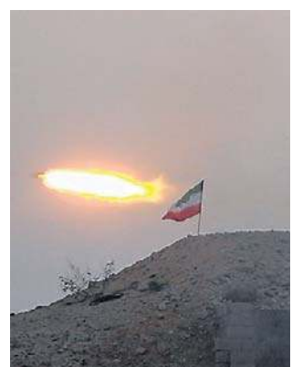
Ćwiczenia rakietowe sił wojskowych Iranu

Transakcja w cieniu groźby wojny Ewentualna sprzedaż broni miałaby miejsce w kontekście