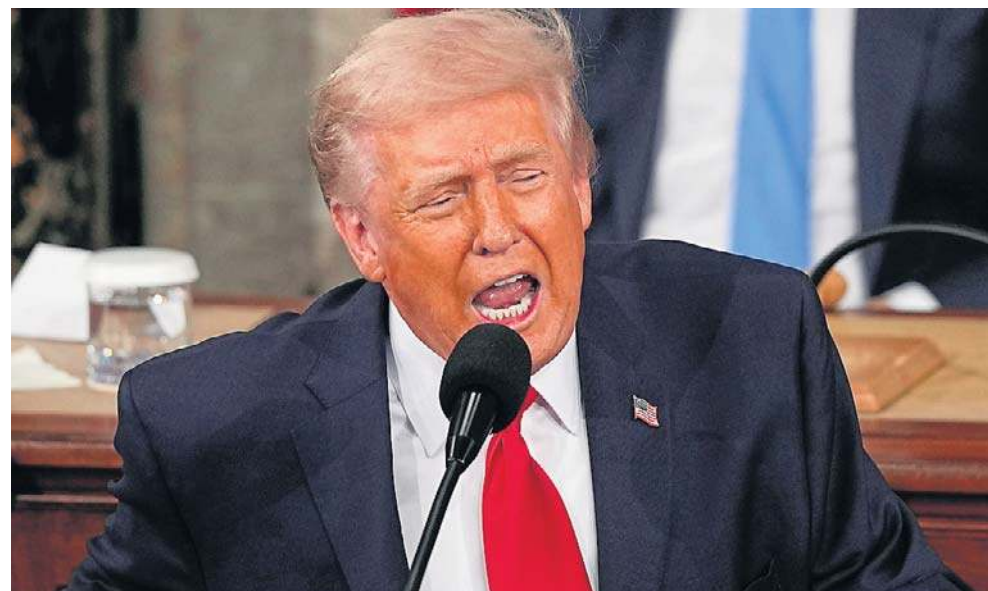
Przemawiając przez godzinę i 48 minut, Donald Trump mówił o wielkich chwilach, jakie czekają w najbliższej przyszłości Amerykę i krytykował Demokratów

Trump – mierzący się z podupadającymi notowaniami i gniewem wyborców z powodu wysokich kosztów życia – poświęcił większość przemówienia podkreślanemu świetnej jego zdaniem kondycji gospodarki, wielokrotnie w charakterystycznym stylu wyolbrzymiając statystyki i liczby. Wbrew faktom twierdził, że inflacja „pikuje” i – zgodnie z prawdą – że ceny benzyny są niższe niż za jego poprzednika. Twierdził też, że za jego rządów zagraniczne firmy zadeklarowały inwestycje w wysokości 18 bln dolarów, choć kwota ta