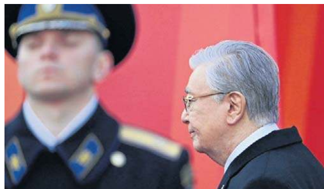
Prezydent Kazachstanu Kasym-Żomart Tokajew wraz z swoim rządem promuje tożsamość etniczną Kazachów

Proponowana zmiana odzwierciedla zmiany demograficzne w Kazachstanie. Kazachowie stanowią obecnie ponad 70% ogółu ludności, a etniczni Rosjanie mniej niż 15%.