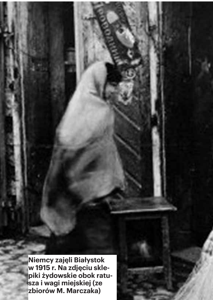
Niemcy zajęli Białystok w 1915 r. Na zdjęciu sklepiki żydowskie obok ratusza i wagi miejskiej (ze zbiorów M. Marcza)

dowska« u progu i na początku istnienia drugiej Rzeczypospolitej».