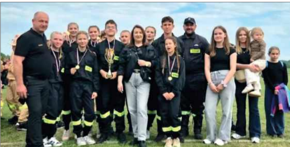
Wielkie emocje i zacięta walka w Żarówce. Młodzi druhowie dali z siebie wszystko.

Niedziela, 31 maja, stała w gminie Radomyśl Wielki pod znakiem wielkich, strażackich emocji. W Żarówce odbyły się Gminne Zawody Sportowo-Pożarnicze Młodzieżowych Drużyn Pożarniczych. Na torze zmierzli się najmłodszy adepci sztuki pożarniczej, którzy pokazali nie tylko imponujące umiejętności i świetne przygotowanie, ale przede wszystkim prawdziwego ducha walki fair play.