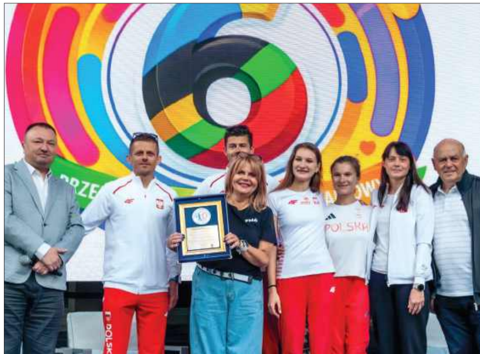
Gwiazdy polskiego sportu w wizytę w mieleckiej „Szóstce”. Przedszkolaki miały okazję spotkać m.in. Grzegorza Lato oraz wybitnych lekkoatletów.

Wydarzenie to udowodniło, że mielecka „Szóstka” od pół wieku nie tylko doskonale opiekuje się najmłodszymi, ale teraz oficjalnie stawia na wychowanie w duchu sportowej rywalizacji, zdrowego stylu życia i uniwersalnych wartości olimpijskich. MW