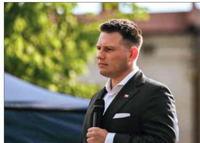
Polityk odpowiedział na pytania w ramach trasy „Zapytaj Mentzena”.