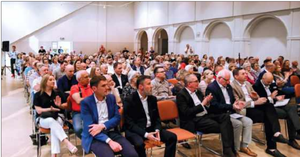
Sala wypełniła się po brzegi