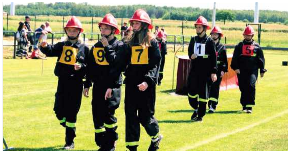
Rodzice pękali z dumy, a kibice bili brawa.