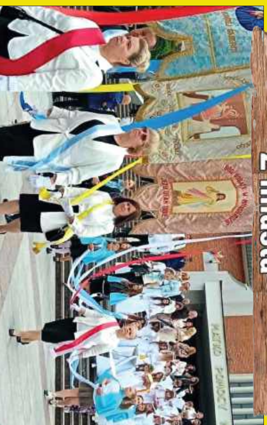
Barwne procesje Bożego Ciała przeszły ulicami Mielca.