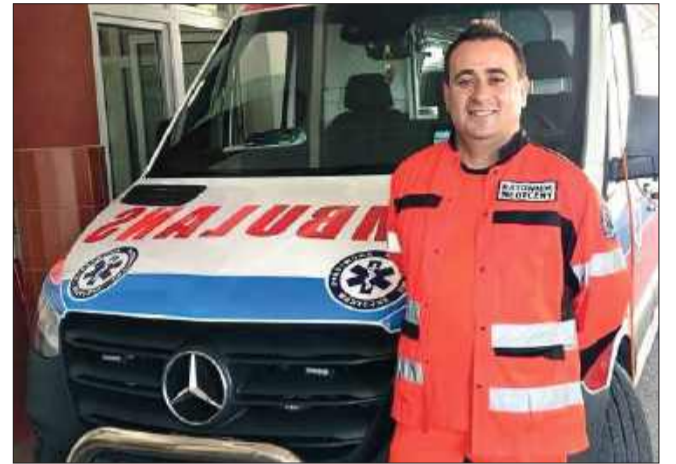
Tragedia wisiała na włosku. Butla z gazem wybuchła tuż po tym, jak wyprowadził seniorów.

Po dramatycznych minutach seniorzy podeszli do okna.