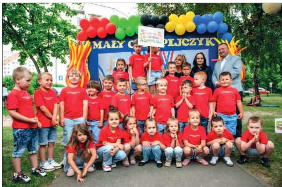
Każda grupa zyskała nową nazwę związaną ze zdrowiem.