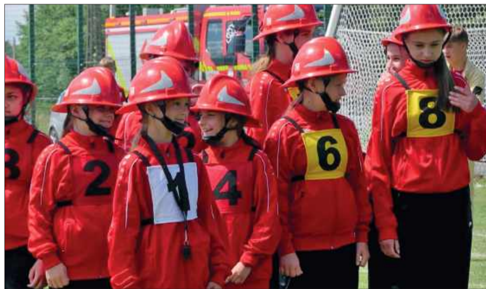
Strażacki bakcył opanował Wadowice Górne.