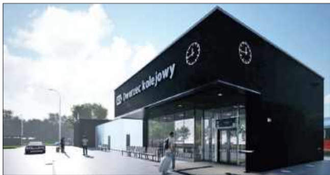
Kolejny krok do nowego dworca w Mielcu.

Zaplanowano nowoczesny hol główny, kasy biletowe, punkt informacji turystycznej/kolejowej, komfortowe toalety oraz specjalne pomieszczenie dla opiekuna z dzieckiem. Na parterze budynku powstaną lokale przeznaczone pod wynajem, co pozwoli na uruchomienie tam punktów handlowych lub usługowych. Wokół dworca powstaną czytelne ciągi pieszo-rowerowe, zadana wiata rowerowa wyposażona w stację naprawczą