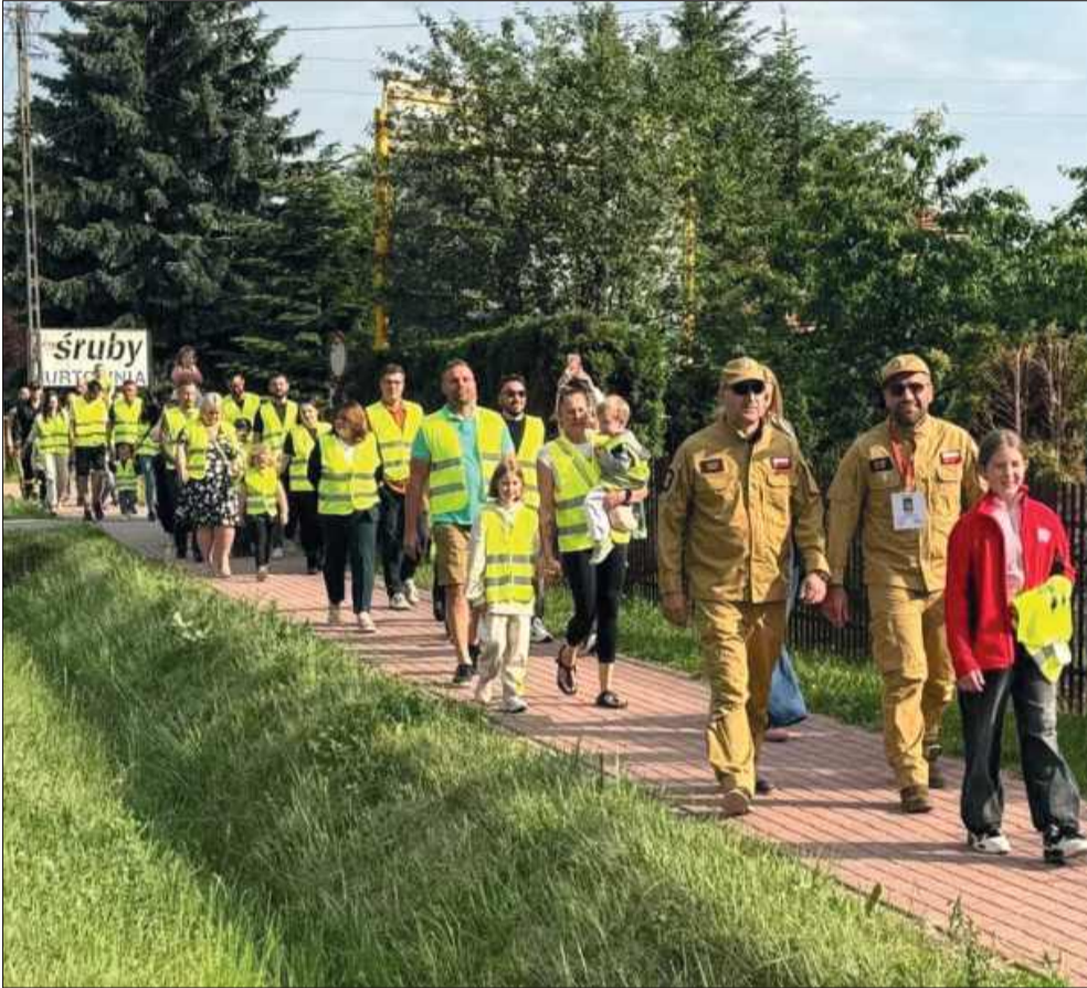
Wydarzenie zgromadziło wielu mieszkańców.

Mieszkańcy ul. Rzochowskiej przeprowadzili spokojną manifestację, ale zapowiadają, że jeśli nie zobaczą działań w ich sprawie, podejmą kolejny, ostrzejszy protest.