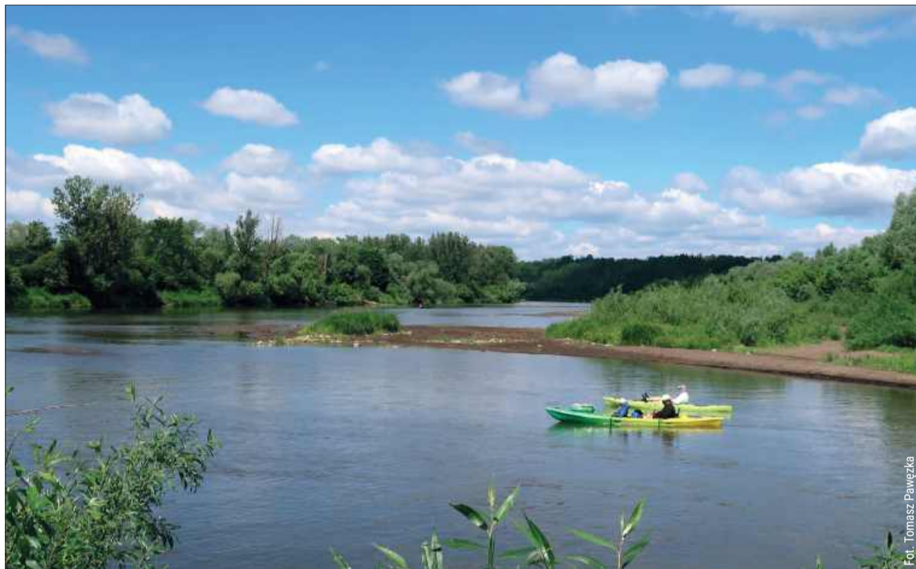
Cypel – zbieg rzek Sanu i Tanwi. Malowniczy i popularny punkt widokowy.