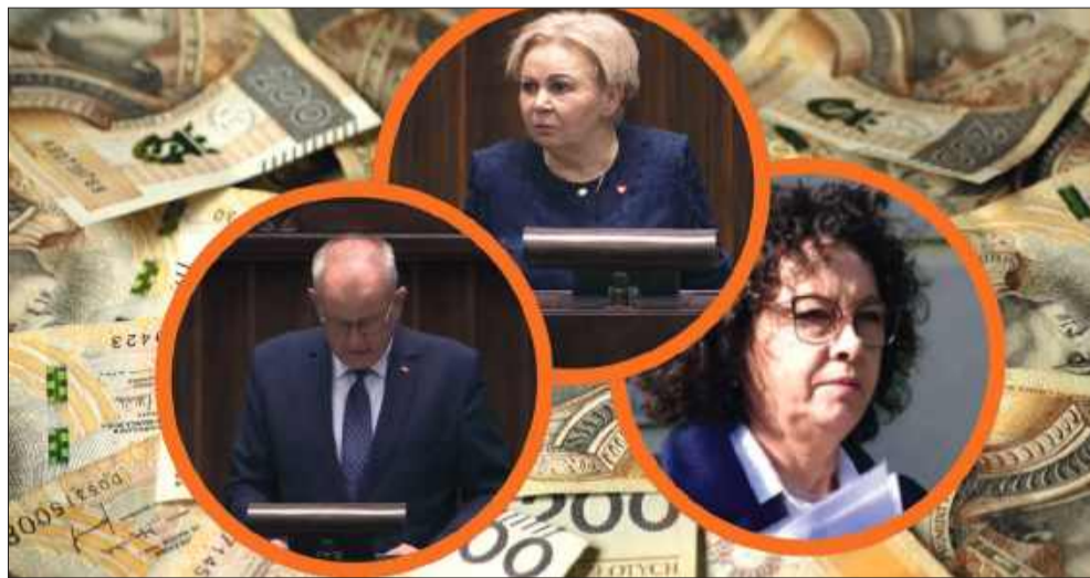
Ile zarabiają nasi parlamentarzyści?

Wśród udostępnionych dokumentów znalazły się formularze wypełnione przez posłów bezpośrednio związanych z Mielcem i powiatem mieleckim. Złożone korekty i raporty pokazują pełen przekrój majątkowy – od zgromadzonych oszczędności (zarówno w złotych, jak i w obcych walutach), przez metraże domów, mieszkań czy działek, aż po udziały w spółkach i osiągane dochody z tytułu pracy w parlamencie oraz innych aktywności zawodowych. Dokumenty zawierają także informacje o posiadanych samochodach i zobowiązaniach finansowych, takich jak kredyty.