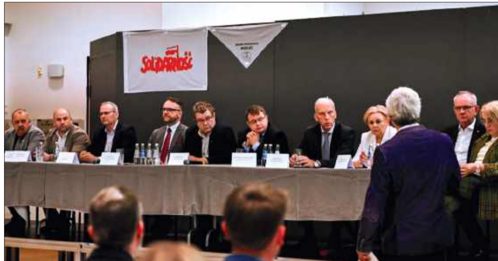
Na spotkaniu byli pracownicy służby zdrowia oraz samorządowcy