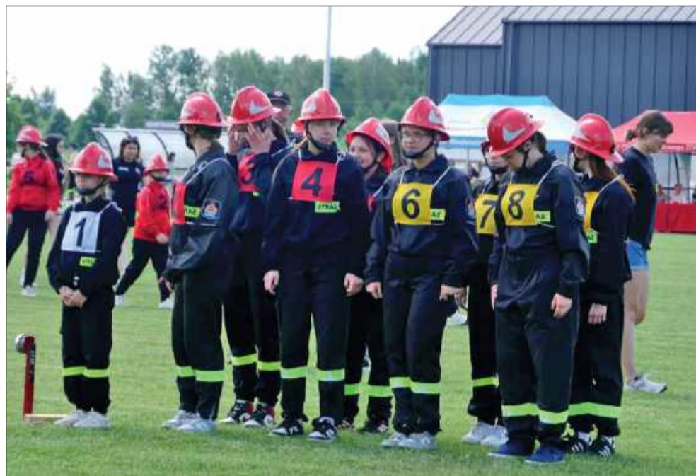
Rośnie nowe pokolenie ratowników.