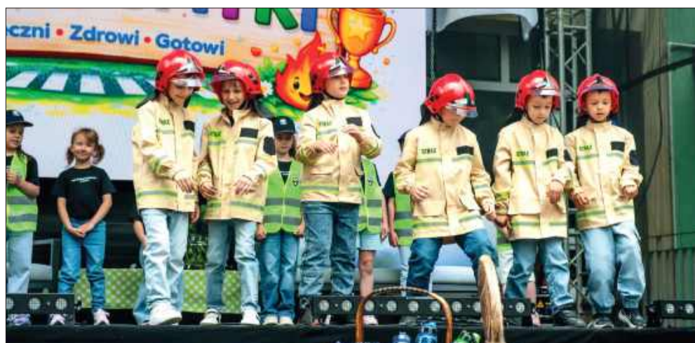
Przedszkolaki na scenie! Wszystkie grupy zaprezentowały wyjątkowe widowisko pt. „Halo, tu Szósteczka”.