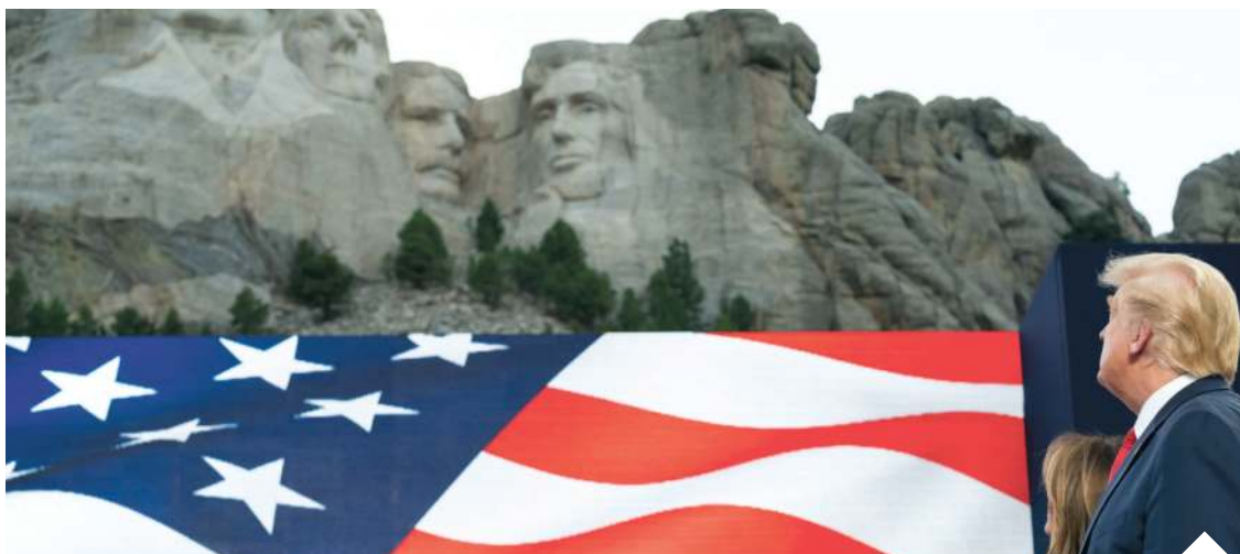
Przemawiając w Keystone w Dakocie Południowej 3 lipca, na tle góry Rushmore, Trump ostro potępił komunizm i wezwał naród amerykański do patriotyzmu

Być może w ocenie konserwatywnego publicysty jest trochę przesady, ale trudno nie dostrzec negatywnych skutków politycznej i ideologicznej presji na społeczeństwo amerykańskiej lewicy.