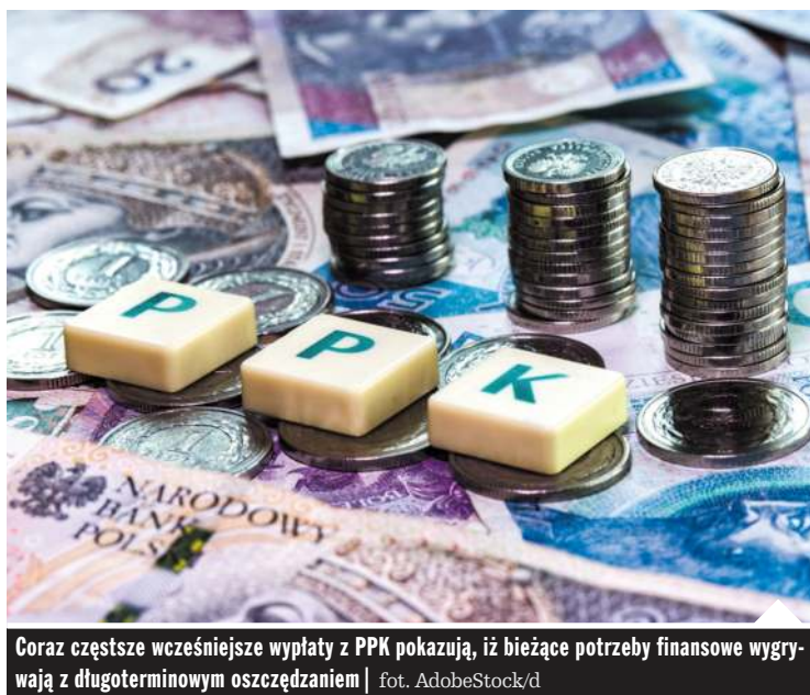
Coraz częstsze wcześniejsze wypłaty z PPK pokazują, iż bieżące potrzeby finansowe wygrywają z długoterminowym oszczędzaniem

Paradoks polega na tym, że uczestnicy wypłacają pieniądze mimo bardzo wysokich stóp zwrotu. Według danych KNF osoby regularnie oszczędzające od początku funkcjonowania programu osiągnęły na koniec 2025 r. zysk wynoszący średnio od 107 do nawet 205 proc. wpłaconych przez siebie środków. Oznacza to, że wartość zgromadzonych oszczędności przekroczyła dwukrotność własnych wpłat.