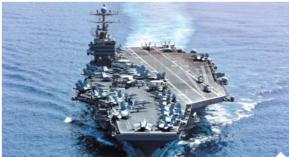
CENTCOM poinformował, że w odpowiedzi na prowokacje reżimu w Teheranie dokonało „potężnych uderzeń” na Iran

Amerykańskie Dowództwo Centralne (CENTCOM) poinformowało, że w odpowiedzi na te prowokacje dokonało „potężnych uderzeń” na Iran. Zniszczono w nich ponad 80 celów. Mniej więcej 60 z nich to były szybkie kutry używane przez Korpus Strażników Rewolucji. Oprócz nich zaatakowano