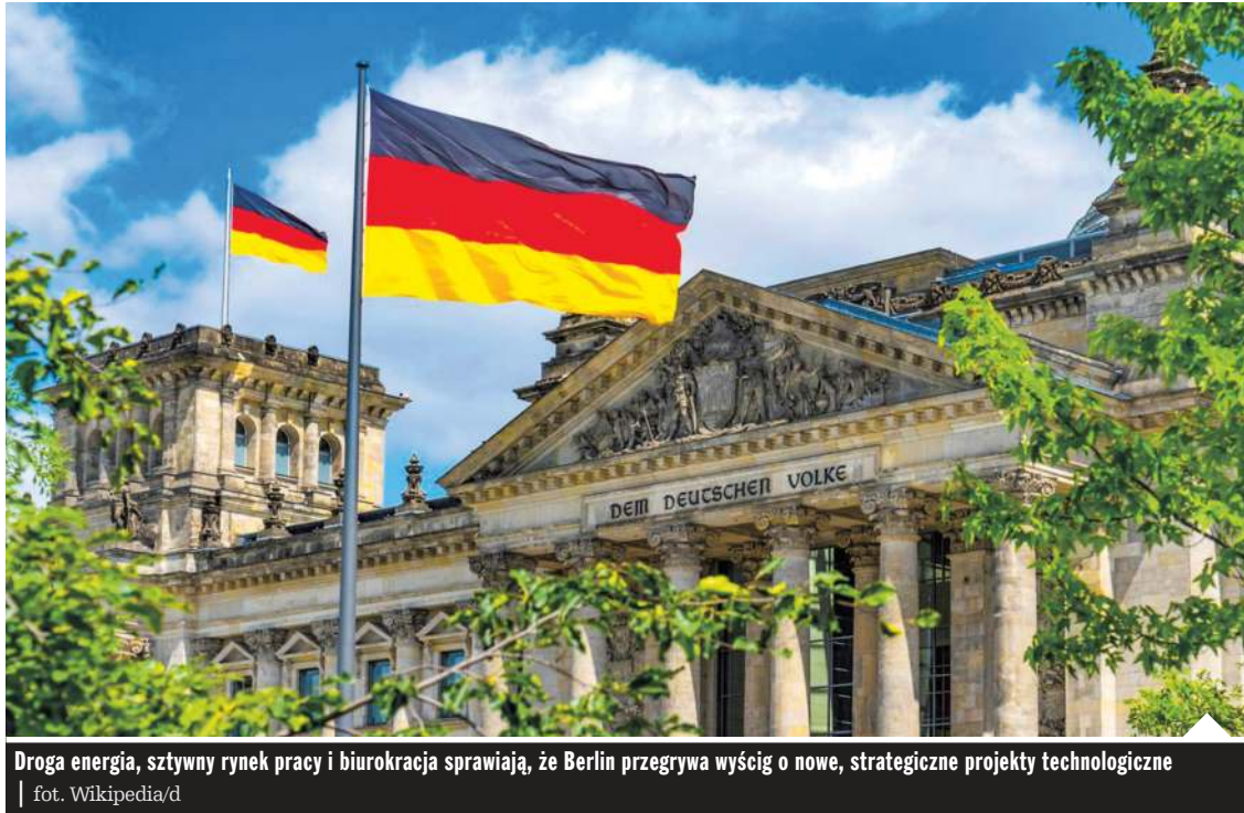
Droga energia, sztywny rynek pracy i biurokracja sprawiają, że Berlin przegrywa wyścig o nowe, strategiczne projekty technologiczne

Z drugiej strony barykady znalazły się branże, które wyraźnie tracą i pozostają pod ogromną presją. Należą do nich duma niemieckiej gospodarki, motoryzacja, a także produkcja maszyn, urządzeń elektrycznych oraz sektory energochłonne, takie jak przemysł chemiczny i papierniczy,