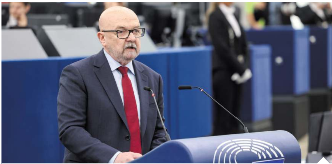
PiS w ubiegłym tygodniu rozesłał do wszystkich polskich szefów delegacji propozycję poprawki zakładającą, że bez rozliczenia się Ukrainy z własną przeszłością UE nie będzie otwierać kolejnych kłastrów negocjacyjnych

– Dlatego absolutnie jako nieakceptowalną przyjęliśmy decyzję o nadaniu elitarnej jednostce Sił Zbrojnych Ukrainy