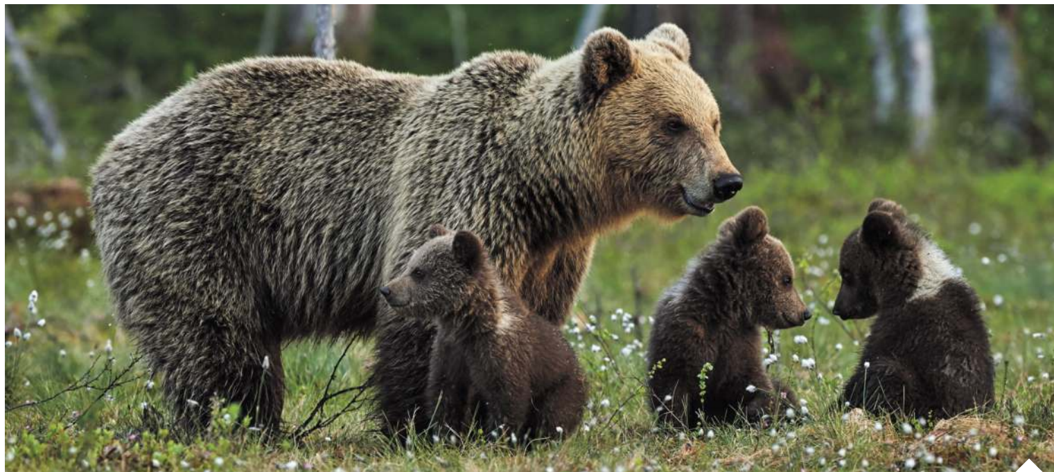
Samorzady jeszcze w ubiegłym roku wnosili o odstrzał pięciu niedźwiedzi zagrażających ludziom. GDOŚ wycofała zgodę po protestach aktywistów

„W czasie od końca wojny światowej po lata ostatnie dokonały się na Turnicy głębokie przemiany, najpiękniejsze drzewostany padły pod siekierami drwali, miejsce lasów wysokopiennych zajęły rozległe zręby i młodniki, przeważnie z wprowadzonych, obcych dla Turnicy gatunków, jak: świerki, sosny, modrzewie, dęby i wiązy, bór karpacki w swej naturalnej, pierwotnej postaci zachował się jedynie w nielicznych zakątkach. Zabezpieczenie ocalałego od zagłady pierwoboru w formie rezerwatu, przynajmniej na jednym z najbardziej charakterystycznych stanowisk, ułatwia do pewnego stopnia okoliczność, że obszar ten, dochodzący 25 km kw., w przeważnej większości jest własnością