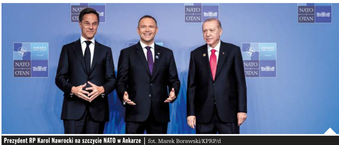
Prezydent RP Karol Nawrocki na szczycie NATO w Ankarze

Przed rozpoczęciem obrad Prezydent RP Karol Nawrocki spotkał się z mediami, wskazując na trzy kluczowe z punktu widzenia Polski cele geopolityczne: wzmocnienie solidarności