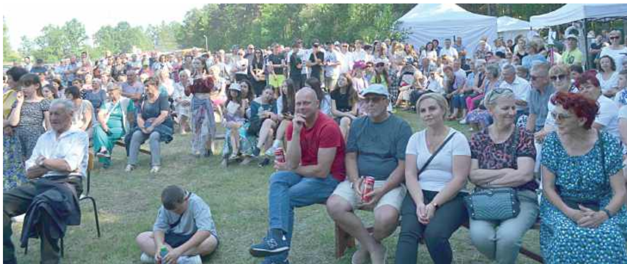
Motywem kolejnej edycji Turnieju Wsi był wątek cygański