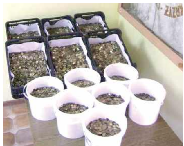
Dzieci zebrali górę grosza dla potrzebujących

W Biłgoraju zakończyła się kolejna edycja akcji „Gorączka Złota PCK”. Inicjatywa prowadzona przez Polski Czerwony Krzyż spotkała się z dużym zaangażowaniem lokalnych placówek oświatowych, a jej efekty pozwolą na wsparcie dzieci z rodzin potrzebujących pomocy.