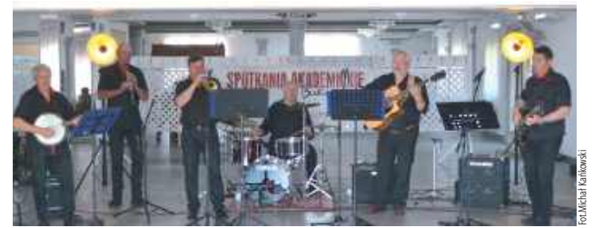
Zespół instrumentalno-wokalny Va-Bank z Biłgoraja