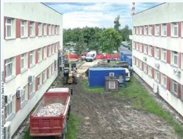
Przebudowa w zamojskim szpitalu potrwa do 2027 roku

Poważne zmiany czekają Samodzielny Publiczny Szpital Wojewódzki im. Papieża Jana Pawła II w Zamościu. Chodzi o roboty budowlane w ramach projektu „Poprawa dostępu do Ambulatoryjnej Opieki Specjalistycznej”. Spory projekt, bo wart ponad 5,7 mln złotych. Co czeka pacjentów?