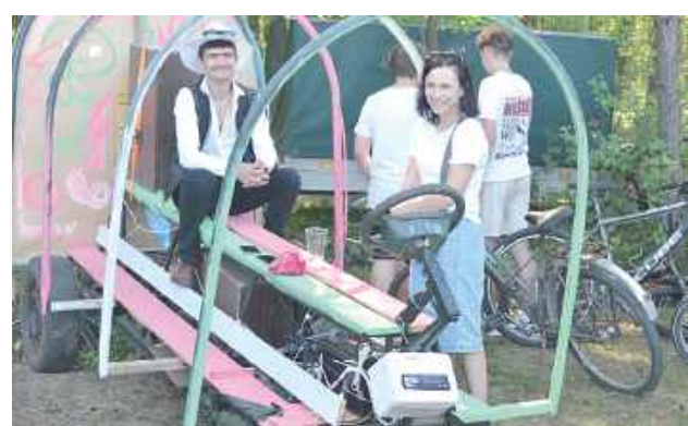
Motywem kolejnej edycji Turnieju Wsi był wątek cygański. Niestety, chyba temu Cyganowi uciekł koń