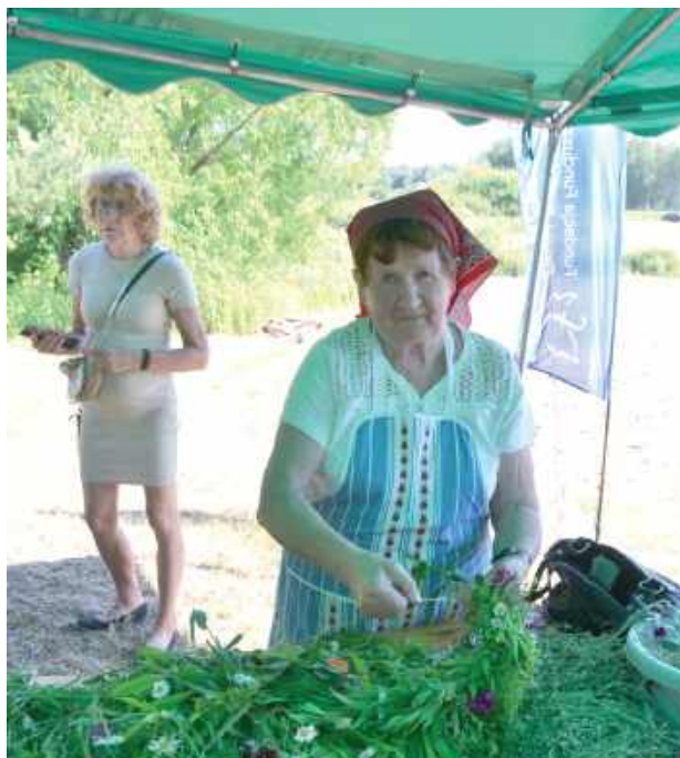
Warsztaty rękodzieła tradycyjnego były jedną z atrakcji tego festiwalu