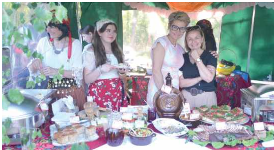
Motywem kolejnej edycji Turnieju Wsi był wątek cygański