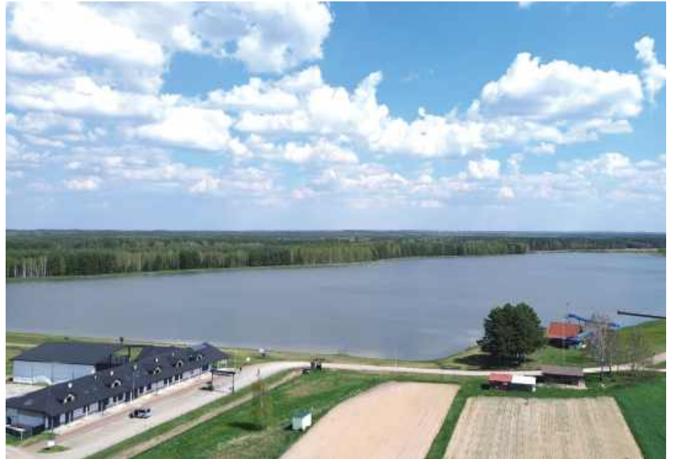
Wśród atrakcji, którymi Biszcza chce przyciągnąć turystów, jest m.in. zalew Biszcza-Żary oddany do użytku w 2008 roku