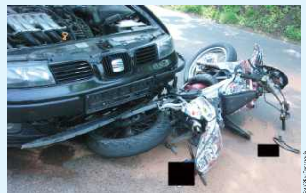
Motorowerzysta przewrócił się na jezdnię i zderzył czołowo z autem

Na miejsce udali się policjanci Wydziału Ruchu Drogowego. Ze wstępnych ustaleń wynika,