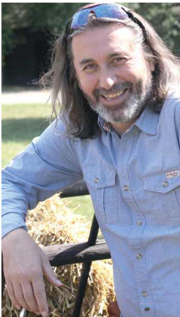
Znany bard wystąpi 22 czerwca w GOK w Goraju

- Chcę przypomnieć, że jest taka książka Izaaka Bashevisa Singera „Szatan w Goraju”. A propos Goraja. Będę tam grał koncert z piosenkami Leonarda Cohena, Bułata Okudźawy, Edwarda Stachury i własnymi. Bardzo gorąco zapraszam do Goraja - mówię artysta.