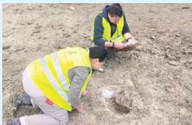
W czasie prac archeologicznych w gminie Łabunie udało się znaleźć szczątki mamuta

Miejsce zostało wytypowane przez Lubelskiego Wojewódzkiego Konserwatora Zabytków do przeprowadzenia badań jeszcze na etapie przygotowania dokumentacji dla tej inwestycji. Prace w terenie rozpoczęły się jesienią ubiegłego roku, a prowadzi je na nasze zlecenie firma APB THOR. W trakcie badań archeolodzy znaleźli m.in. cios mamuta oraz fragment miednicy, który należał do mamuta lub słonia leśnego. Szczątki te zostały podjęte we współpracy z naukowcami z UMCS w Lublinie (z