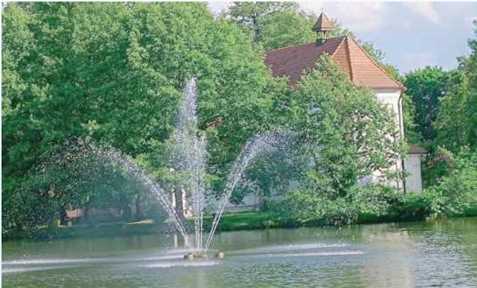
Na taki widok w Zwierzyńcu trzeba będzie jeszcze poczekać

- Łabędź niemy (Cygnus olor) jest w Polsce gatunkiem objętym ścisłą ochroną - zakazane jest płoszenie, niepokojenie lub ingerencja w miejsca lęgowe.