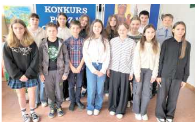
Młodzież przygotowała niezwykłą uroczystość

W Szkole Podstawowej im. Jana Pawła II w Księżpolu odbyły się uroczystości poświęcone pamięci Papieża Polaka. W ramach obchodów zorganizowano konkursy oraz część artystyczną, które miały na celu uczczenie jego osoby oraz pogłębienie wiedzy uczniów na temat jego życia i nauczania.