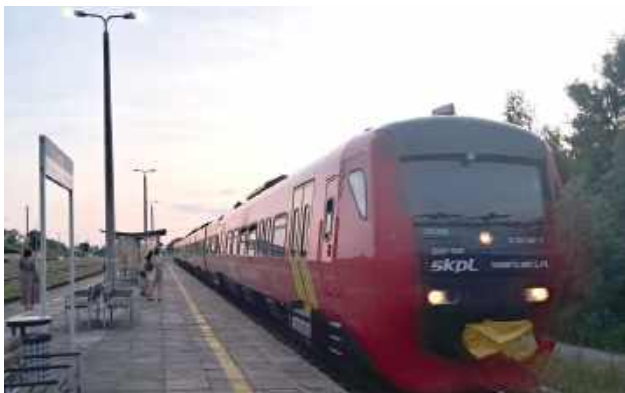
Taki skład na szczęście będzie kursować na IC Hetmanie od 15 czerwca...

Zmiany weszły od 15 czerwca. IC Hetman, który do tej pory kursował w składzie SD85, będzie obsługiwany przez lokomotywę i wagony. Jak na złość, będzie tylko...4 wagonów, czyli o jednego wagonu mniej. Natomiast Biłgoraj otrzyma nowe, dodatkowe połączenie do Krakowa.