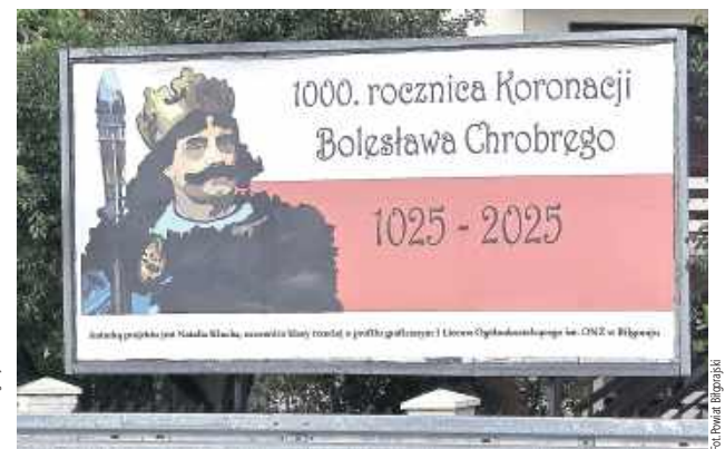
Ulice Biłgoraja tętnią historią

W Biłgoraju, na bilbordach użytkowanych przez samorząd powiatu biłgorajskiego, pojawiły się prace graficzne uczennic I Liceum Ogólnokształcącego im. ONZ. Projekty te zostały nagrodzone w konkursie zorganizowanym z okazji 1000-lecia Królestwa Polskiego oraz