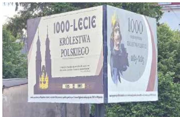
Talent młodych grafików można podziwiać na ulicach Biłgoraja

Na bilbordach w Biłgoraju pojawiły się prace młodych artystek, które zwyciężyły w konkursie graficznym upamiętniającym ważne wydarzenia z historii Polski. To wyjątkowe połączenie sztuki, edukacji i patriotyzmu.