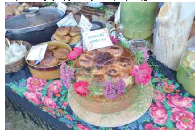
W konkursie kulinarnym dominowały tradycyjne potrawy i wypieki