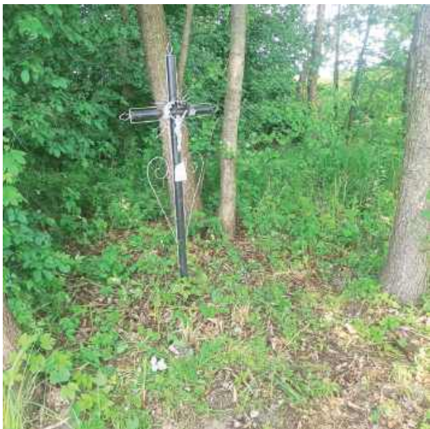
Niemiecka mogiła z 1939 roku w Dereźni Zagrody przed ekshumacją