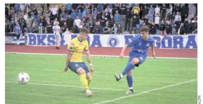
Wystarczyła wizyta piłkarskiego trzecioligowca i stadion w Biłgoraju szczelnie się wypełnił

W nagrodę, oprócz trofeum i czeku na 50 tys. zł złotonoścy otrzymali możliwość gry na szczeblu centralnym piłkarskiego Pucharu Polski.