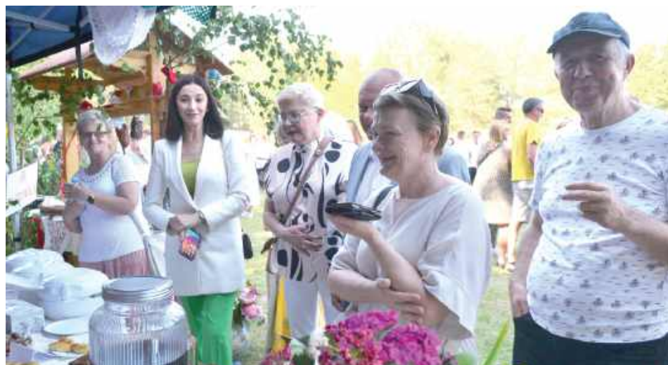
Degustacja smaków przy stoiskach KGW