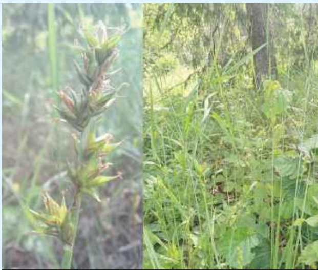
To gatunek rośliny, który nie był dotąd odnotowywany na południowym wschodzie Polski i w Roztoczańskim Parku Narodowym

- Turzyca rozsunięta preferuje słoneczne lub lekko zacienione miejsca z przepuszczalną, żyzną i umiarkowanie wilgotną glebą. Ze względu na przekształcanie siedlisk i bar-