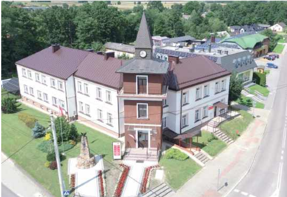
Gmina Biszcza ma być teraz jeszcze bardziej znana i promowana w Polsce, ale też na zagranicznych targach

Gmina Biszcza została właśnie nowym członkiem Lubelskiej Regionalnej Organizacji Turystycznej. Mają być z tego korzyści zarówno dla samorządu, ale też dla lokalnych przedsiębiorców i mieszkańców.