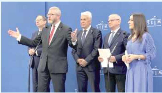
Posel z Zamościa po 20 latach postanowił zmienić polityczne barwy

To wybór uczciwy - wobec własnego sumienia, wobec wspierających mnie od lat wyborców, wobec Polski. Wynika z mojego światła-