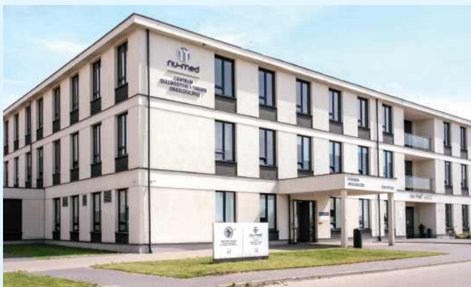
Studenci KUL będą teraz odbywać praktyki w tym zamojskim ośrodku