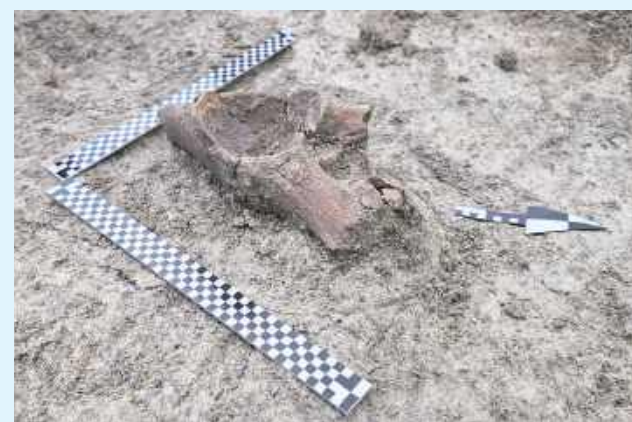
Szczątki mamuta zostały już przekazane do dalszych badań

i przebadali około 650 nieruchomości archeologicznych, datowanych wstępnie na wczesne oraz późne średniowiecze. Odkryli pozostałości obiektów mieszkalnych wraz z towarzyszącymi im dołami postłupowymi i jamami gospodarczymi oraz dwie studnie z obudowami z drewnianych desek. Badania także pozwoliły odkryć kilkadziesiąt fragmentów na-