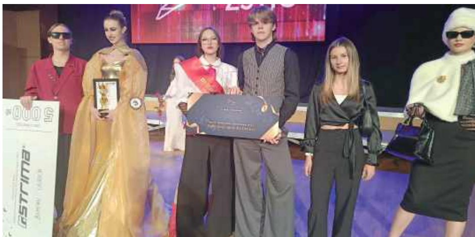
Te stroje pozwoliły im zająć wysokie miejsce

Talent, wiedza i doświadczenie to klucz do sukcesu –