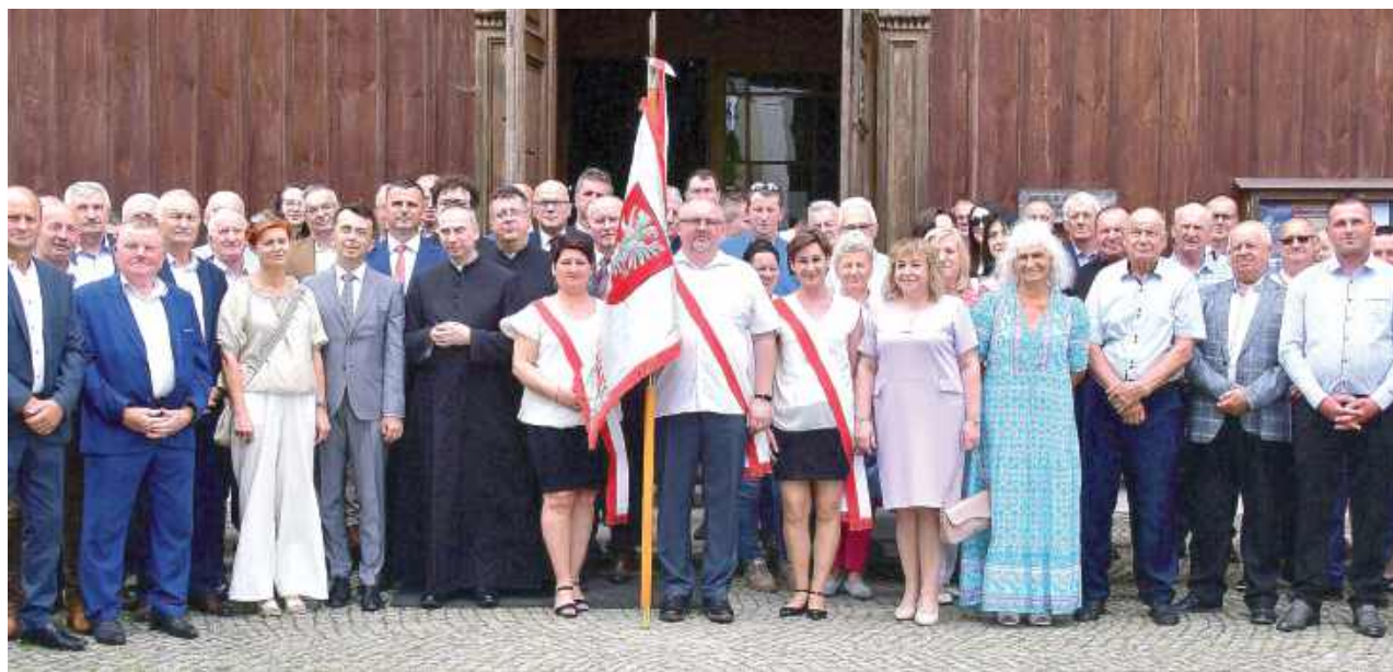
Samorządowcy modlili się o pomyślność