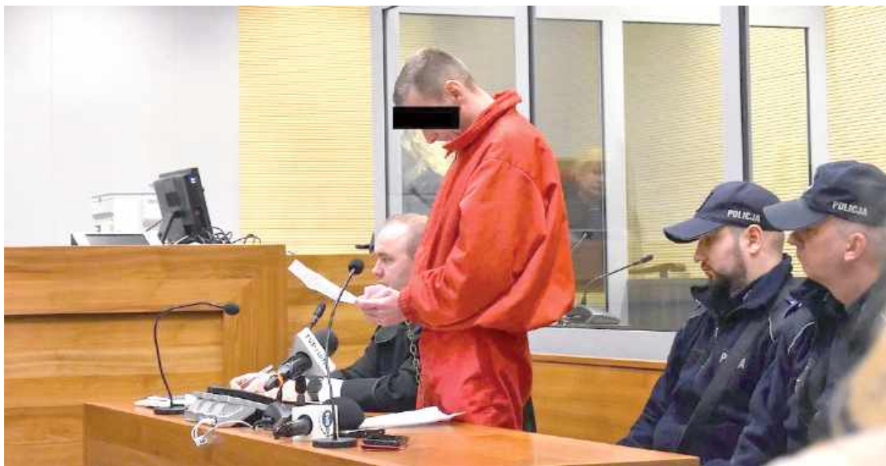
Bartłomiej B. został skazany na 30 lat więzienia. O warunkowe zwolnienie mężczyzna będzie mógł się ubiegać po odsiedzeniu 20 lat