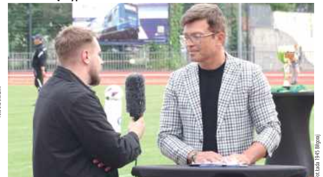
Finałowy mecz w Biłgoraju skomentował znany dziennikarz Polsatu - Bożydar Iwanow