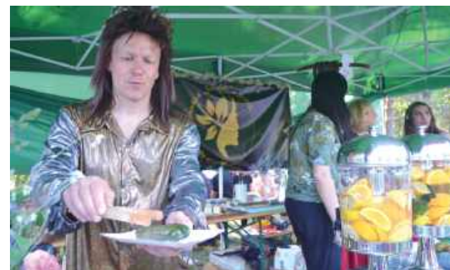
Motywem kolejnej edycji Turnieju Wsi był wątek cygański