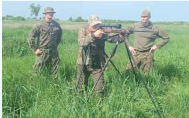
Myśliwi z Zamościa razem z żołnierzami na wspólnym szkoleniu

W lasach w okolicach Zamościa zaroilo się od żołnierzy i myśliwych. Na miejscu pojawili się żołnierze 25. Batalionu Lekkiej Piechoty wspólnie z myśliwymi z Koła Łowieckiego nr 60 RYŚ w Zamościu. Uspokajamy. - Tematem szkolenia były działania niekonwencjonalne z zakresu sztuki przetrwania - wyjaśniają myśliwi.