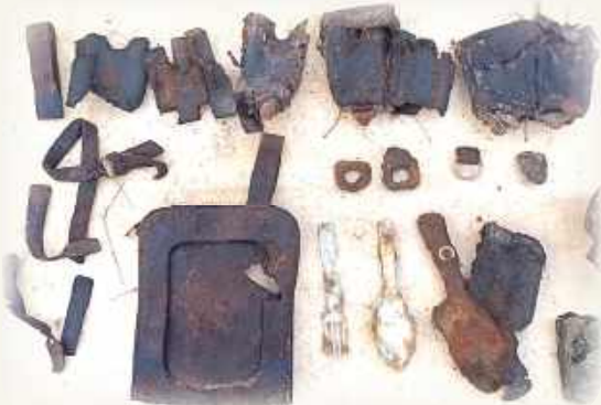
Rzeczy osobiste niemieckich żołnierzy