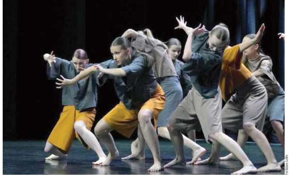
Ich sukces został doceniony!

W najmłodszej kategorii wiekowej, w której rywalizowało 10 zespołów, grupa Ada II zajęła drugie miejsce. W kategorii średniej, spośród 18 zespołów, grupa