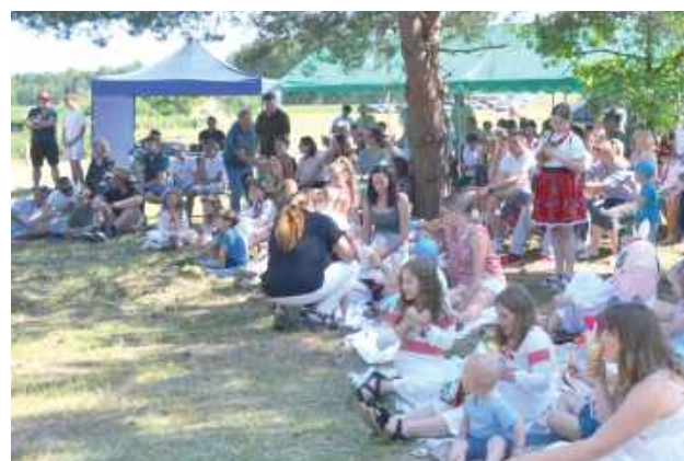
Rodziny i widzowie kibicowały poczynaniom najmłodszych