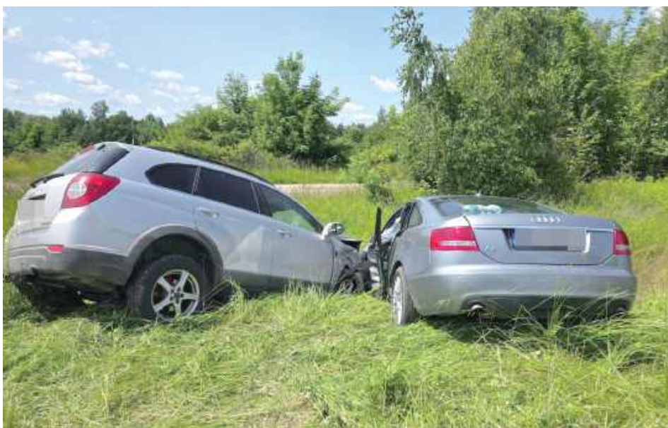
Na skutek zderzenia oba pojazdy wypadły z jezdni i znalazły się w przydrożnym rowie

Na skutek zderzenia oba pojazdy wypadły z jezdni i znalazły się w przydrożnym rowie. W Chevroletcie podróżowały cztery osoby, w tym dwoje małych dzieci w wieku 1 roku oraz