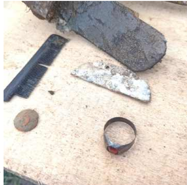
Rzeczy osobiste niemieckich żołnierzy

Grupa Poszukiwawcza informuje, iż w minioną sobotę, 7 czerwca przeprowadzała prace ekshumacyjne w Dereźnia-Zagrody gm. Biłgoraj. W ich wyniku odnaleziono szczątki dwóch żołnierzy niemieckich z 5 kompanii Infanterie Regiment 38.