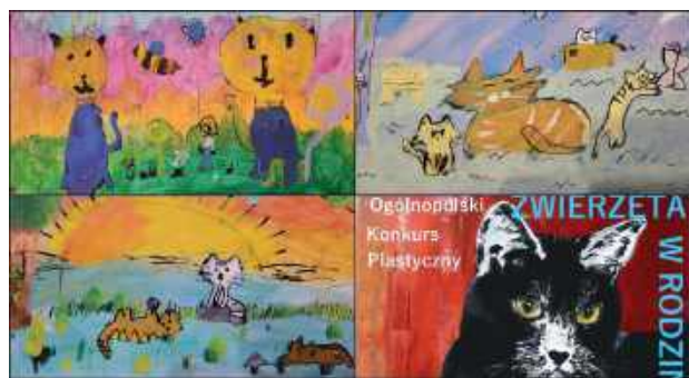
Namalowali sobie sukces i to w Krakowie

Wychowanki Młodzieżowego Domu Kultury w Biłgoraju odniosły kolejne sukcesy w ogólnopolskim konkursie plastycznym. Młode artystki zdobyły wyróżnienia oraz kwalifikacje do wystawy, potwierdzając wysoki poziom swoich umiejętności twórczych.