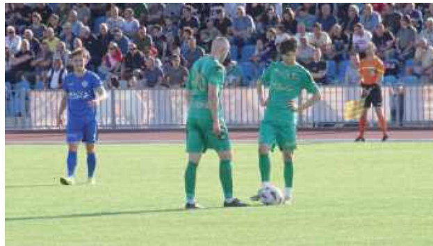
Mecz z Hetmanem został rozegrany przy szczelnie wypełnionym stadionie w Biłgoraju. Na trybuny nie zostali wpuszczeni kibice z Zamościa, choć pojawili się w Biłgoraju wspólnie z zaprzyjaźnionymi fanami Motoru Lublin

- Jeśli chodzi o przebieg meczu, to przede wszystkim chcę po raz kolejny docenić podejście moich piłkarzy. Środowy mecz