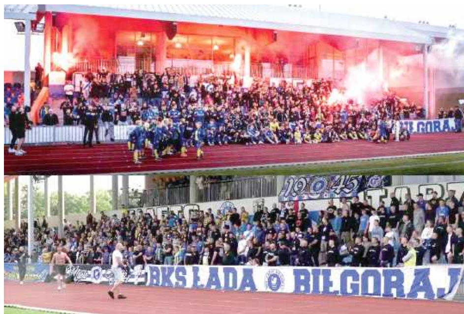
Kibice Łady i Avii wspierają się od dawna, wspólnie wspierali też oba zespoły

I mimo, że mecz był w środę to na stadionie przy Targowej w Biłgoraju, pojawiło się całkiem sporo ludzi. Łada nie była faworytem, choć w tym sezonie na swoim boisku jeszcze nie przegrała. Ale przecież mecze pucharowe rządzą się swoimi prawami i często niżej