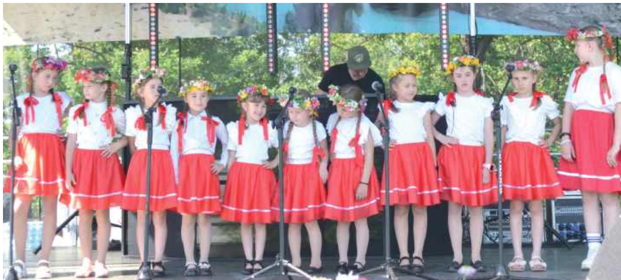
TANWISKA od lat cieszy się niezwykłą popularnością wśród dzieci i młodzieży

15 czerwca w miejscowości Kucy w gminie Księżpól odbył się Festiwal Tradycji Tanwiska. Natura - Muzyka - Folklor. Jest to konkurs skierowany do dzieci i młodzieży do lat 20. Celem tego wydarzenia jest popularyzacja muzyki ludowej i zachowanie