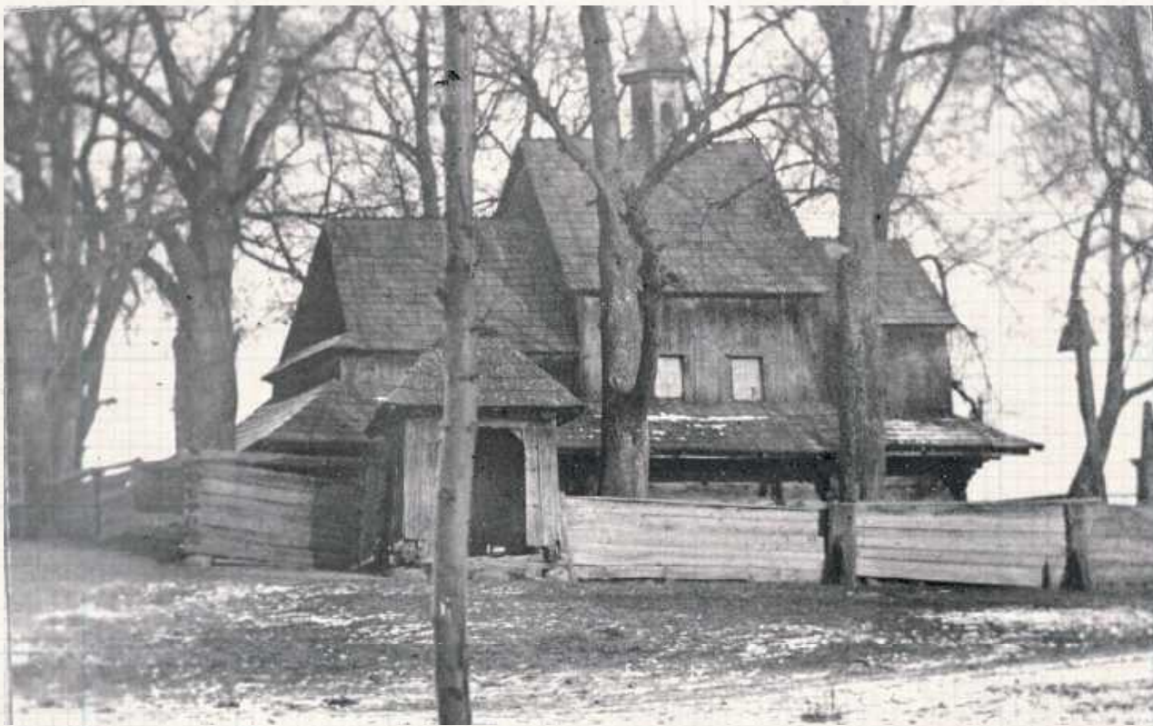
Cerkiew unicka, później prawosławna. Zdjęcie wykonano w 1902 r. przez Ludwika Rogowskiego, który był rządcą klucza księżpolskiego (Muzeum Narodowe w Lublinie)

Majdanów jest w Polsce ok. 70. Początkowo należał do franciszkańskiej parafii św. Marii Magdaleny w Puszczy Solskiej, jednak od 1919 roku erygowano obecną parafię św. Piotra i Pawła. Mieszkańcy byli wyznania unickiego (ich cerkiew była w Majdanie), natomiast katolicy musieli chodzić do wspomnianej