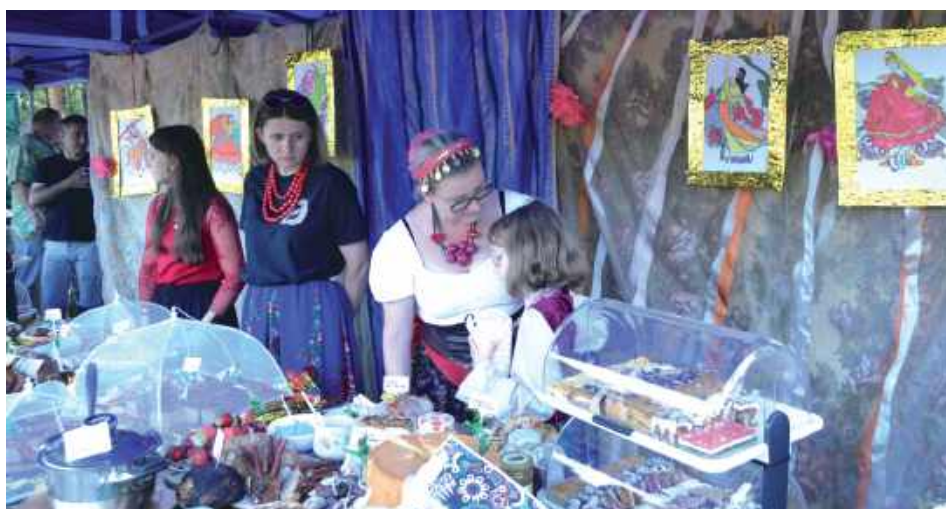
Było pięknie, kolorowo i cygańsko!