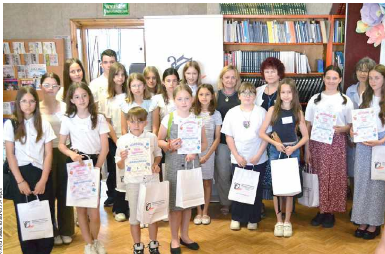
Czytanie sprawia wiele radości, oni o tym wiedzą!

W piątek, 6 czerwca w Miejskiej i Powiatowej Bibliotece Publicznej im. prof. Jerzego Markiewicza w Biłgoraju odbyła się XXIV edycja powiatowego konkursu czytelniczego „Radość czytania”.