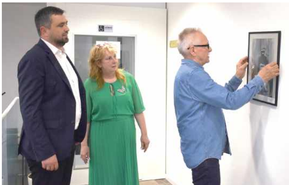
Biłgorajanie osobiście przymocował obraz w bibliotece w Tarnogrodzie