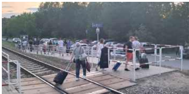
Jak widać, na Hetmanie jest całkiem niezła frekwencja. Pilnie potrzebujemy powrotu do Wrocławia! Zwłaszcza że właśnie rozkręcają się prace modernizacyjne nie tylko w Katowicach, ale także na odcinku Stalowa Wola - Tarnobrzeg - Padew. I coraz trudniej będzie w tych warunkach utrzymywać skomunikowania w Krakowie

Natomiast od 15 czerwca Biłgoraj uzyska całkiem nowe