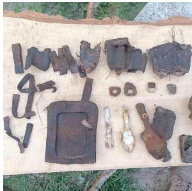
Rzeczy osobiste niemieckich żołnierzy