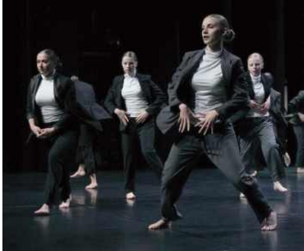
Wytańczyli sobie sukces!

W czwartek, 5 czerwca, zespoły taneczne Ada II, Ada Młodsza i Ada Starsza wzięły udział w Ogólnopolskim Festiwalu Tańca Balans, który odbył się w Centrum Spotkania Kultur w Lublinie. W wydarzeniu uczestniczyły aż 42 zespoły z całej Polski, reprezentujące m.in. Kraków, Warszawę, Opole, Lublin, Stalową Wolę, Biłgoraj, Tarnobrzeg, Świdnik, Puławę, Mielec, Dęblin i Dominów. Festiwal odbywał się w trzech