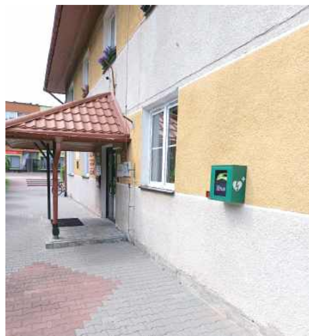
Urządzenie, które ratuje ludzkie życie, jest już zamontowane na ścianie UM w Turobinie

Nowe urządzenie pojawiło się właśnie w Turobinie. To defibrylator, który gmina zakupiła z własnych środków. Został zamontowany na budynku Urzędu Miejskiego.