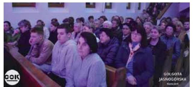
Koncert cieszył się sporym zainteresowaniem