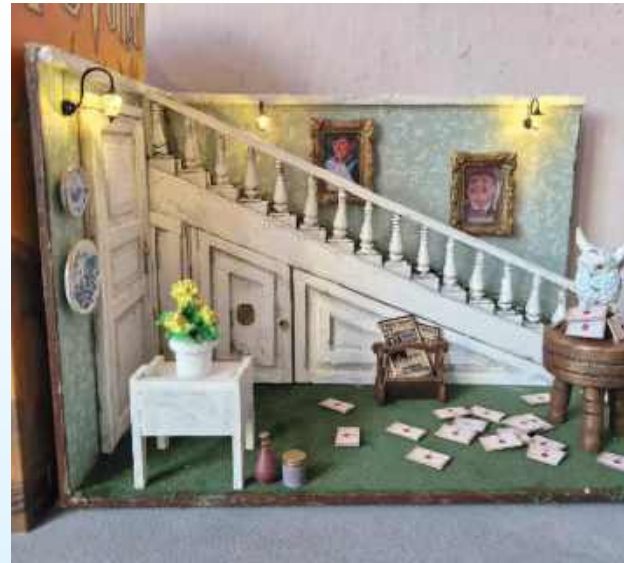
Decoupage to pracochłonna pasja, ale efekty robią wrażenie

Tak naprawdę jest to uzależnione od tego, jaki efekt chcemy uzyskać. Jeśli chodzi nam o ozdobienie prostej formy, np. zakładki do książki w niezbyt skomplikowany sposób, to udekorowanie takiego przedmiotu nie wymaga angażu bardzo dużej ilości czasu. Natomiast prace