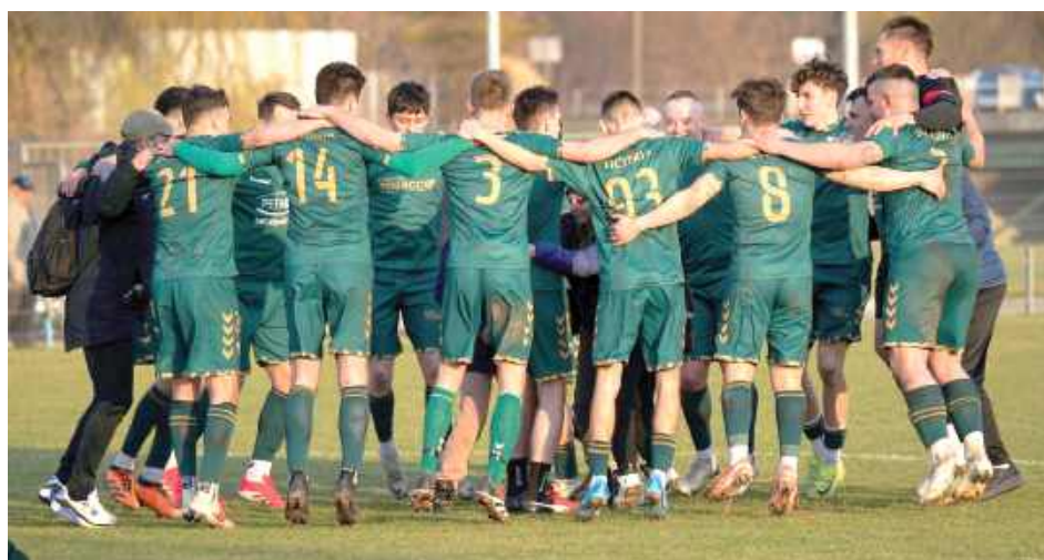
Victoria Łukowa pokonała wicelidera i wskakuje na trzecie miejsce w tabeli piłkarskiej okręgówki