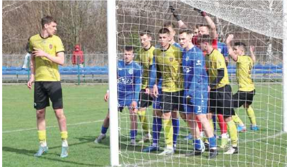
Na boisku w Rożdżałowiu dosłownie kotłowało się pod bramką gospodarzy. Piłkarze Łady cztery razy znaleźli drogę do bramki

- Cieszy kolejny komplet punktów oraz trzecie z rzędu czyste konto z tyłu. Nieważne, czy gramy z drużyną z dołu tabeli, czy z góry - zespół konsekwentnie trzyma się zasad na boisku. Jesteśmy drużyną, która pragnie od początku do końca meczu grać z nastawieniem na tworzenie kolejnych sytuacji i zdobywanie bramek. Bardzo dobrym elementem było uwolnienie piłki zaraz po jej odbiorze, co pomogło nam utrzymać płynność w grze. Początek rundy uważam za uda-