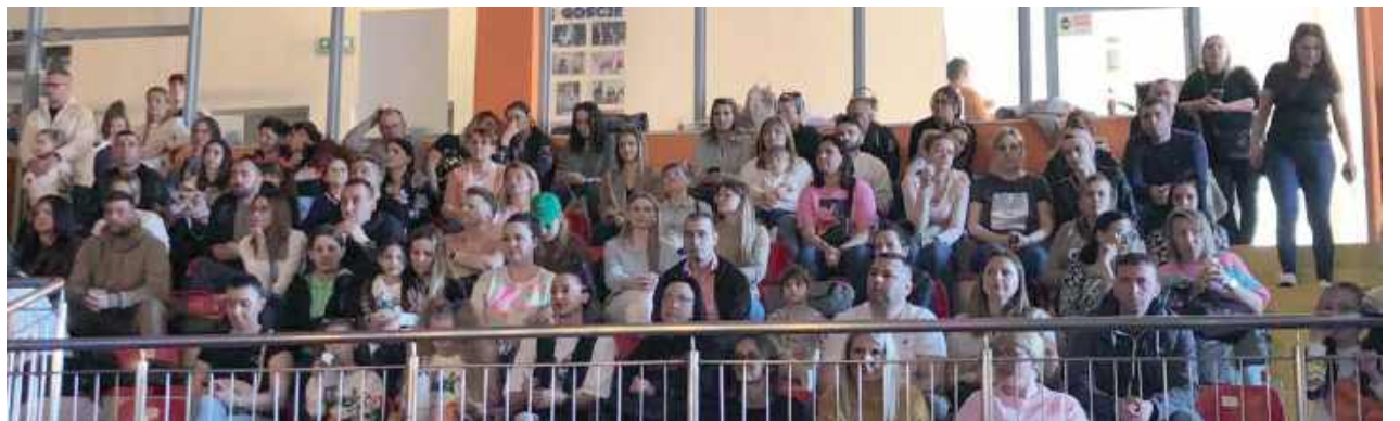
Widownia OSiR wypełniona była po brzegi