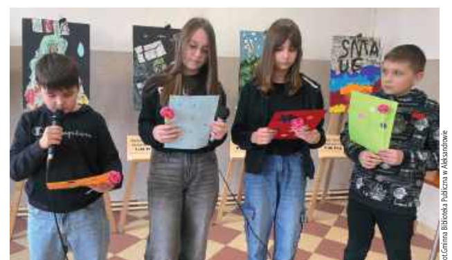
Podsumowanie projektu odbyło się 2 kwietnia, w Międzynarodowy Dzień Książki dla Dzieci. W jego trakcie uczniowie zaprezentowali drugie zadanie projektowe, polegające na głośnym czytaniu fragmentów książek nawiązujących do wykonanych kolaży

Podsumowanie projektu odbyło się 2 kwietnia, w Między-