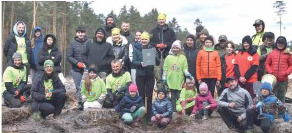
Pamiątkowe zdjęcie na zakończenie ciężkiej, ale jakże pozytywnej pracy

- Spotkaliśmy się w leśnictwie Wola na sadzeniu lasu w ramach społecznej akcji „Lasy na nowe stulecie”. Ten rok rozpoczyna nowe stulecie Lasów Państwowych i z tej okazji zapraszamy lokal-