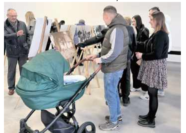
Relacje i wspomnienia, które narodziły się podczas tego wernisazu, z pewnością pozostaną w sercach uczestników na długie lata