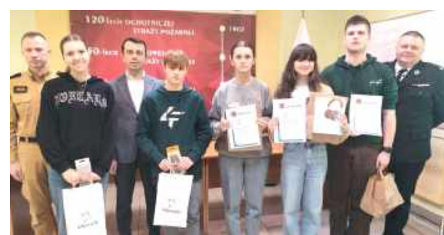
Na koniec turnieju pięć pierwszych miejsc w każdej kategorii zostało uhonorowanych dyplomami oraz nagrodami rzeczowymi, a wszyscy uczestnicy otrzymali upominki. Nagrody zostały ufundowane przez powiat biłgorajski