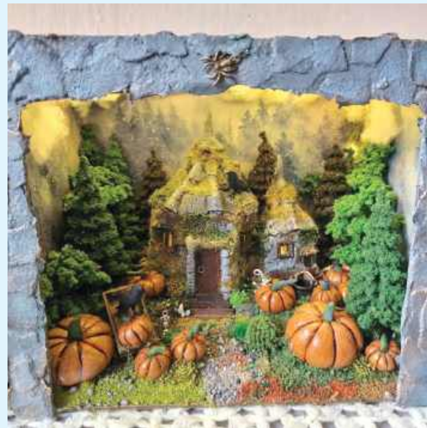
Takie cuda potrafi wyczarować mieszkanka Zamościa

w technikach mix-medio- wch są niezwykle pracochłonne, ponieważ zwykle są one bardzo zaawansowane w ilości użytych materiałów i łączonych technik. Tutaj mówimy już o kilkunastu godzinach tworzenia. Na stworzenie niektórych book nooków potrzeba ponad 20 godzin. Nie licząc w tym chodzenia i obmyślenia projektu w głowie, co niejednokrotnie zajmuje jeszcze więcej czasu niż sam fizyczny proces tworzenia.