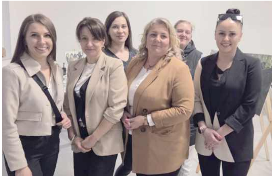
Koło Gospodyń Wiejskich Jarzębinki Stanisławów po raz kolejny udowodniło, że jego działalność wykracza poza organizację wydarzeń kulturalnych

Wystawa unikatowych fotografii przedstawiających dawnych mieszkańców oraz historię wsi przyciągnęła licznych gości. Wydarzenie stało się okazją do międzypokoleniowych spotkań, podczas których uczestnicy dzielili się swoimi wspomnieniami i aneg-