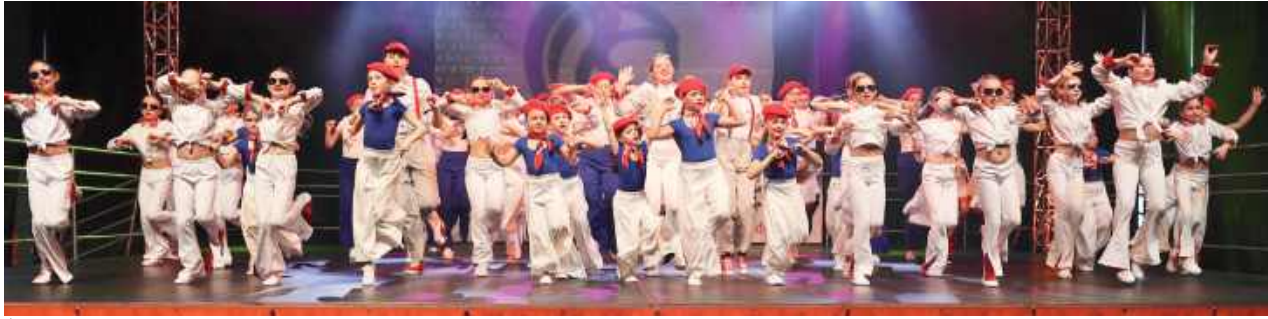
Święto tańca w Biłgoraju

W Biłgoraju odbyło się jedno z najważniejszych spotkań środowiska tanecznego w Polsce! Pasjonaci tańca nowoczesnego i współczesnego przyjechali do naszego miasta na „Taneczne Inspiracje”