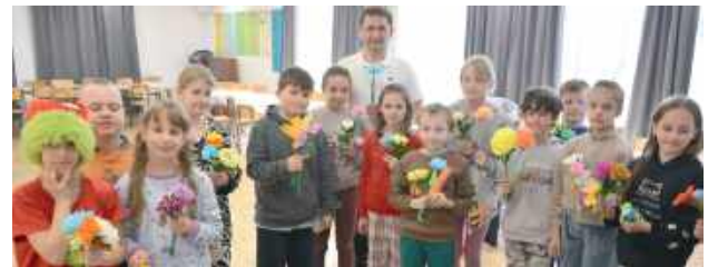
Przy okazji warsztatów powstały również piękne kwiaty