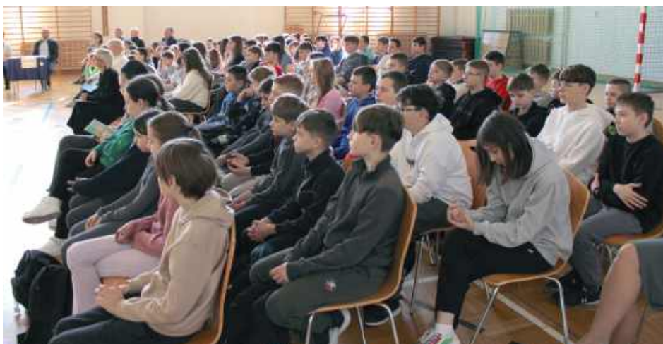
Dzięki zaangażowaniu uczniów i przedsiębiorców wydarzenie nie tylko wzbogaciło wiedzę młodzieży, ale także pokazało, jak ważna jest pomoc potrzebującym i łączenie edukacji z działaniami na rzecz społeczności