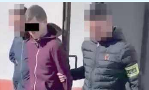
Z zabezpieczonych środków odurzających można byłoby wytworzyć blisko 900 porcji dilerskich tego narkotyku

W trakcie czynności kryminalni wspólnie z funkcjonariuszami Straży Granicznej w Chłopiach nie ujawnili ukryte w zaroślach, przy jego domu środki odurzające. Było to prawie 140 gramów haszyszu. Nielegalna substancja została zabezpieczona. Mężczyzna tłumaczył, że narkotyki posiadał na własny użytek, a znalazł je na terenie ogródków działkowych. W trakcie prowa-