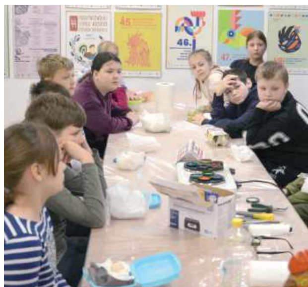
Młodzi artyści w akcji