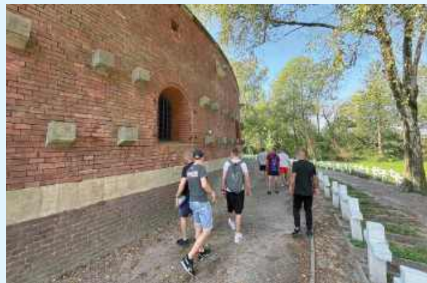
Osadzeni w Zakładzie Karnym w Zamościu m.in. zwiedzają

historycznej i przyrodniczej. Dzięki współpracy zamojskiej jednostki i Muzeum Zamojskiego wychowawcy ds. kulturalno-oświatowych z grupą skazanych cyklicznie odwiedzają między zamojskie muzea, fortyfikację Twierdzy Zamość, Rotundę Zamojską. Skazani pamiętają, odwiedzają i porządkują zamojskie miejsca martyrologii z okresu II Wojny Światowej. Podczas zajęć osadzeni zwiedzają również miejsca kultu religijnego gdzie mogą spędzić czas na modlitwie