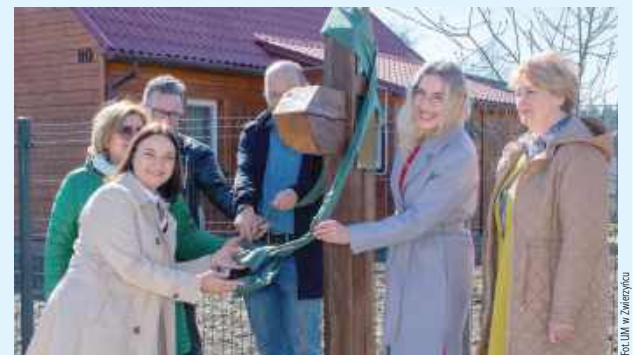
Specjalnie oznakowany południk 23 ma być nową atrakcją Zwierzynca

Nowość w Zwierzyncu. Przy ulicy Rudka został oficjalnie i uroczystie oznaczony południk 23°E. - To doskonałe miejsce dla miłośników geografii, podróżników i wszystkich, którzy lubią odkrywać unikalne lokalizacje - teraz możecie stanąć dokładnie na 23. południku! - pokazuje Urząd Miejski w Zwierzyncu.