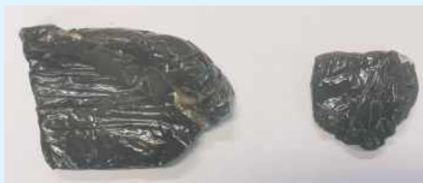
Z zabezpieczonych środków odurzających można byłoby wytworzyć blisko 900 porcji dilerskich tego narkotyku

TOMASZÓW LUBELSKI: Zatrzymany został 24-latek, który w zaroślach obok swojego domu ukrywał znaczną ilość narkotyków. Złapano też jego rówieśnika, który dostał haszysz od 24-latka.