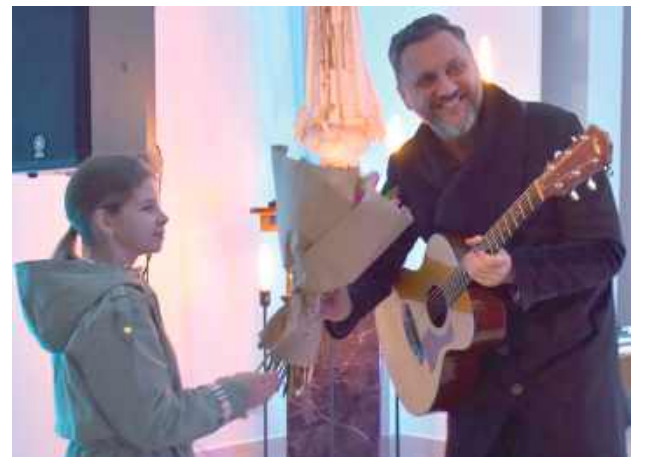
Na koniec były kwiaty i podziękowania dla artystów