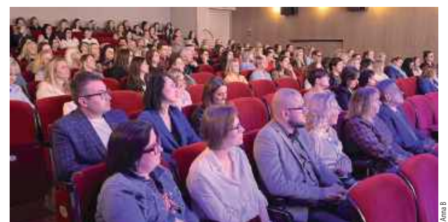
Od pierwszej edycji konferencja cieszy się ogromnym zainteresowaniem