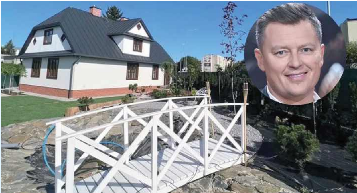
Rafał Brzozowski odniósł się do krytycznych głosów pod adresem prowadzonej przez niego rezydencji w Zamościu

Kilka dni temu portale plotkarskie wzięły na tapetę rezydencję „Brzozowy Dwór” w Zamościu należąca do piosenkarza i celebryty Rafała Brzozowskiego. Rezydencję, która rzekomo znalazła się w ogniu krytyki po nieprzychylnych komentarzach gości. Teraz do sprawy odniósł się sam właściciel.