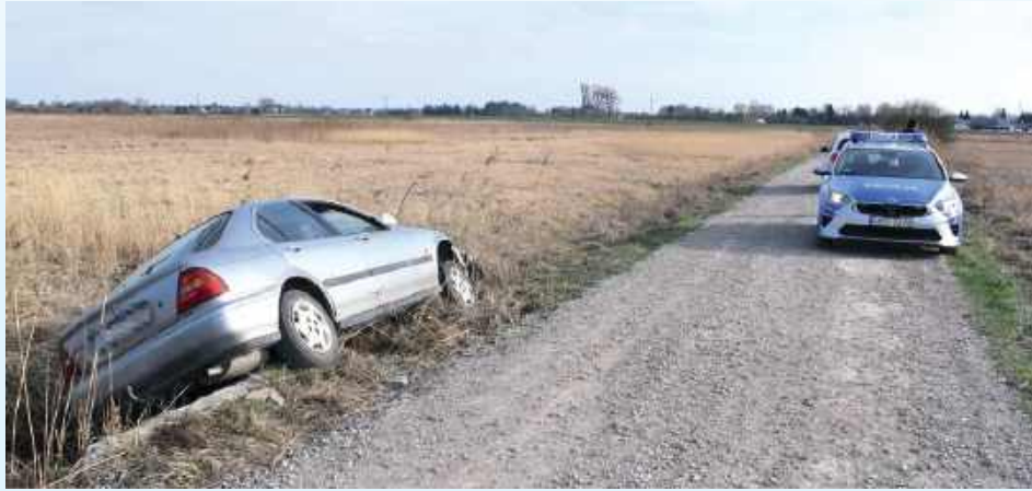
Kompletnie pijany mężczyzna uderzył w przepust w gminie Zamość

Dyżurny zamojskiej komendy otrzymał zgłoszenie o kierującym pojazdem marki Honda, który w jednej z miejscowości gminy Zamość wjechał do przydrożnego rowu i uderzył w betonowy przepust. Zgłaszająca przypuszczała, że kierowca może być nietrzeźwy. Wskazała również, że kierujący jechał asfaltową drogą gminną, poruszając się środkiem jezdni, następnie skręcił w drogę o nawierzchni szutrowej, gdzie stracił panowa-