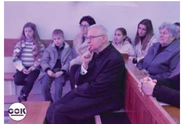
Parafianie i goście w zadumie wysłuchali koncertu