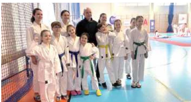
To oni wrócili z medalami!

W zawodach wzięło udział ponad 300 zawodników, a biłgorajski klub reprezentowało 17 karateków. Po wyrównanych pojedynkach na matach zawodnicy Klubu Karate Tradycyjnego Biłgoraj wywalczyli w sumie 22 medale. Oto wyniki: