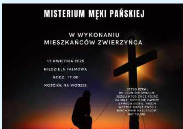
W Niedzielę Palmową na ulicach Zwierzynca Misterium Męki Pańskiej

Matka Boska, ale też Szymon z Cyreny, św. Weronika ocierająca twarz Jezusowi i płaczące niewiasty. To nie jakiś religijny obrazek, ale widok z ulic w Zwierzynca. 13 kwietnia, czyli Niedzielę Palmową, będziemy uczestnikami Misterium Męki Pańskiej na ulicach miasta. W roli głównej niezawodni mieszkańcy.