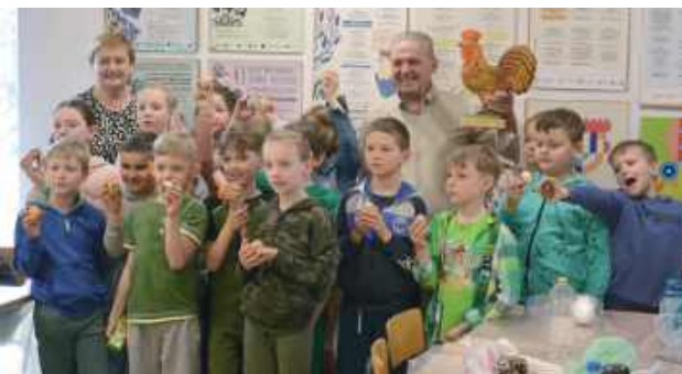
Oto efekty ciężkiej pracy podczas warsztatów

3 i 4 kwietnia w Tarnogrodzie, już po raz 18 odbyły Regionalne Warsztaty Zdobienia Pisanek. Zainteresowanie było spore, a dzieci chętnie uczyły się tradycyjnych metod zdobienia wielkanocnych jajek. Uczestni-