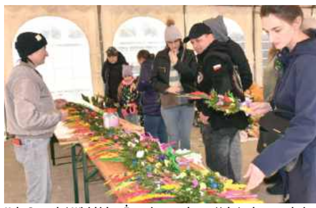
Kół Gospodyń Wiejskich w Żurawiu to społeczność, która łączy tradycję z chęcią niesienia pomocy. W tym roku członkinie KGW postanowiły stworzyć piękne, ręcznie wykonane palmy wielkanocne, aby wesprzeć Oliwierka