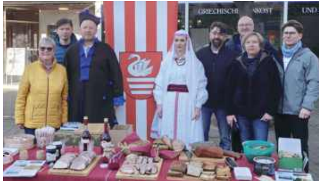
Delegacja z Biłgoraja zaprezentowała w Niemczech to, co w Biłgoraju najpiękniejsze

W ramach obchodów z okazji ćwierćwiecza współpracy pomiędzy miastami partnerskimi odbyły się liczne wydarzenia, które podkreśliły siłę wieloletnich więzi i wspólnego zaangażowania w budowanie międzynarodowej współpracy. Delegacje z Polski