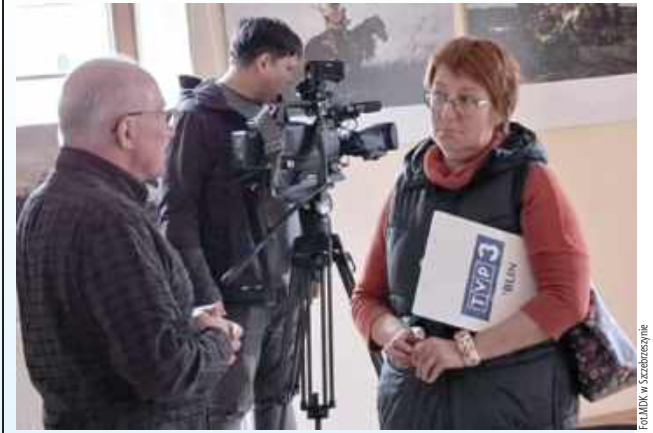
Wkrótce w TVP Lublin reportaż o znanym mieszkańcu Szczebrzeszyna