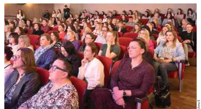
Podczas konferencji sala BCK była wypełniona po brzegi