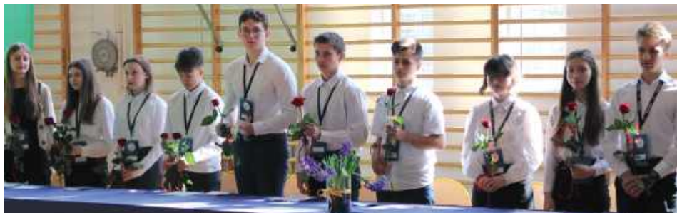
Podczas forum odbyła się debata zorganizowana przez Drużynę Ambasadorów Edukacji Ekonomicznej