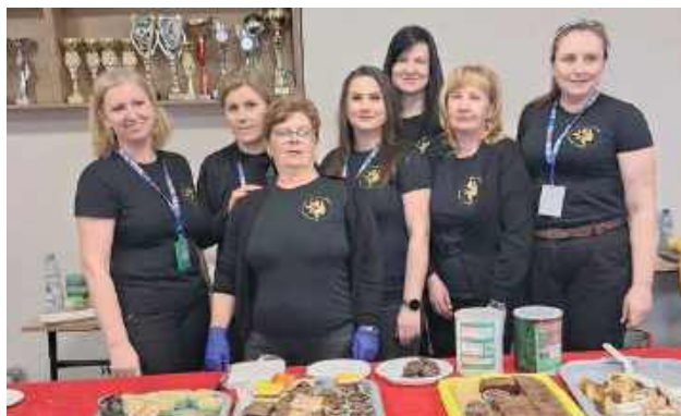
Lokalne Koło Gospodyń zadbało, by nikt nie wyszedł z imprezy głodny