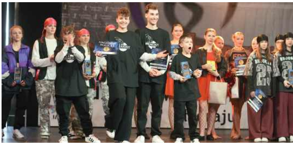
„Taneczne inspiracje 2025” w Biłgoraju

- Celem festiwalu jest popularyzacja tańca jako formy ekspresji artystycznej, prezentacja dorobku