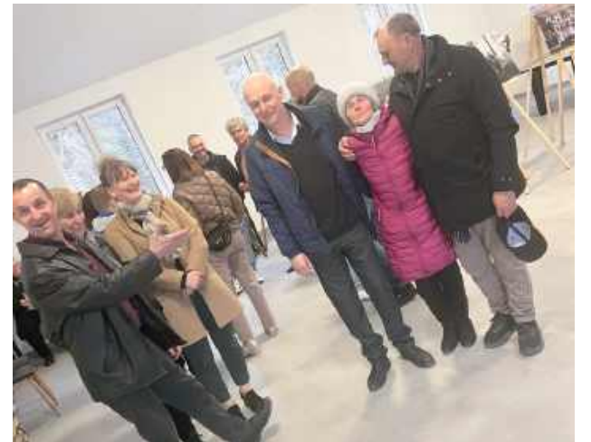
Zainteresowanie mieszkańców wernisazem było bardzo duże