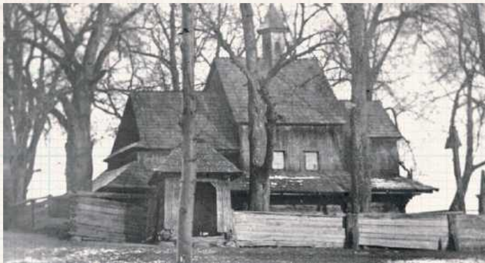
Cerkiew unicka w Majdanie Księżpolskim z przełomu XVII/XVIII wieku

W liście do ordynata Zamoyskiego, dziedzica i Pana na Zamościu, legitymującego się, podkreślam – legitymacją szlachecką z lat 80. XVIII wieku wydaną przez władze austriackie, właściciela nie tylko wsi, folwarków, ale i także parafii rzymskokatolickich czy unickich, zrozpaczeni i zdesperowani mieszkańcy bardzo żalili się na ówczesną sytuację związaną z praktyką wyzwania swej wiary. Niezwykle ciekawy list rozpoczyna się owymi słowami: