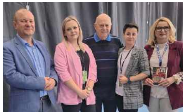
Na imprezę do Soli przyjechał Grzegorz Lato, legenda polskiego futbolu, mistrz olimpijski z 1972 r. i król strzelców Mistrzostw Świata w 1974 r.

Jednym z najbardziej wyczekiwanych momentów wydarzenia było pojawienie się Grzegorza Lato - legendy polskiego futbolu, mistrza olimpijskiego z 1972