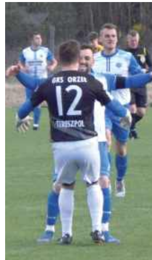
Orzeł Tereszpol w końcu może się cieszyć. Zwycięstwo ze Spartą Woźuczyn to pierwsza wygrana w sezonie