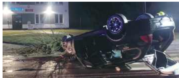
Sprawcy wypadku nie trzeba było długo szukać. 20-letni kierowca BMW, jadąc na łuku drogi, stracił panowanie nad pojazdem, uderzył w drzewo, a następnie dachował

W miniony weekend w Modliborzycach doszło do groźnej kolizji drogowej. 20-letni mężczyzna stracił panowanie nad pojazdem, w wyniku czego jego auto dachowało. Po zdarzeniu oddalił się z miejsca wypadku.