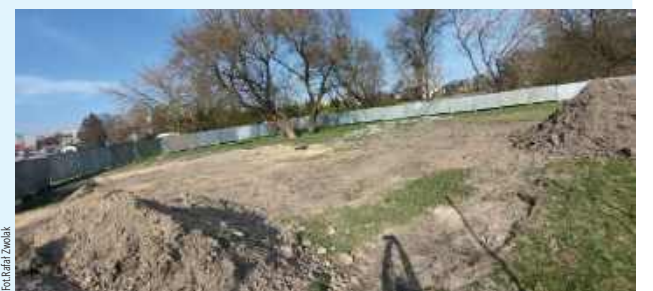
Tężnia solankowa w Zamościu ma być gotowa za pięć miesięcy