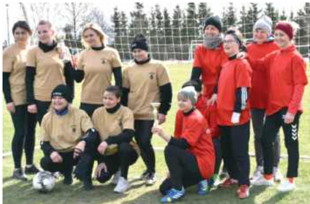
W turnieju udział wzięły dwie drużyny kobiece

- Zmagania sportowe, zaangażowanie Klubu Tur Turobin, Kół Gospodyń, Straży, szkół, uczniów i mieszkańców to coś, co scala nasze społeczeństwo. Pokazuje to, że jesteśmy pełni