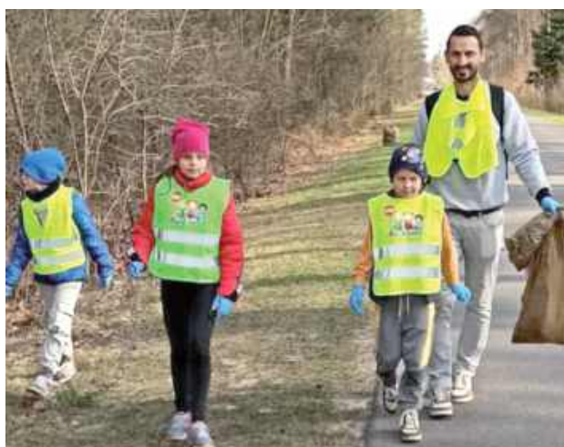
W Lipowcu dbania o swoje otoczenie uczą od najmłodszych lat

- Jesteśmy dumni z naszych małych dzieci, które były bardzo zaangażowane! Niestety nie jesteśmy dumni z takiej ilości śmieci. To, co znaleźliśmy tylko przy drodze