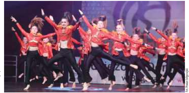
Na scenie była moc