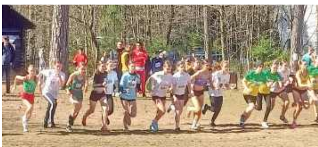
Wybiegali sobie sukces!

Młodzi lekkoatleci z Biłgoraja zmierzili się z rywalami z dwóch województw podczas zawodów biegowych w Supraślu. Na wymagających trasach pokazali swoje umiejętności, osiągając bardzo dobre wyniki.