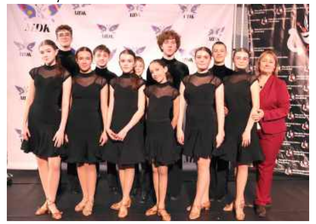
Organizatorem wydarzenia był MDK w Biłgoraju