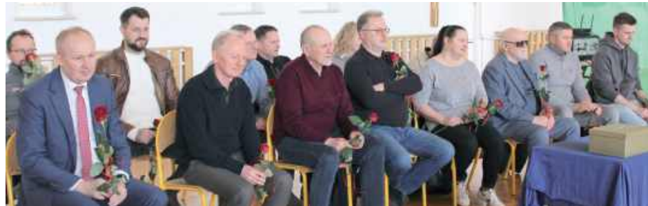
W wydarzeniu uczestniczyli lokalni przedsiębiorcy z Majdanu Starego i Nowego