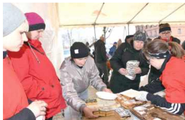
KGW Zakościelanki przygotowały domowe ciasta, deserki z galaretki oraz gorącą herbatę i kawę