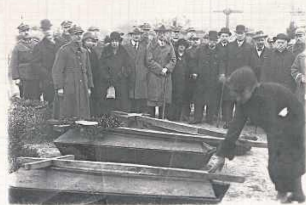
Wybór zwłok Nieznanego Żołnierza we Lwowie

Linia kolejowa nr 69 (LK69) to część dawnej, przedwojennej trasy łączącej Warszawę ze Lwowem. Pierwszy odcinek linii kolejowej z Rawy Ruskiej do stacji Bełzec został otwarty w 1887 roku. W 1916 roku został ukończony dalszy odcinek do Rejowca, a i więc został w okolicach Józefowa w tym roku wybudowana. W okresie międzywojennym, między Warszawą a Lwowem, kursowały pociągi pasażerskie Co ciekawie, Józefów ma swą stację PKP pod nazwą Józefów Rozto-