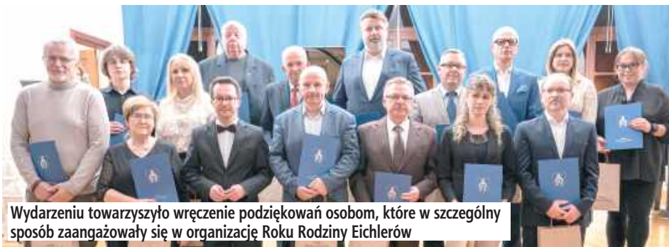
Wydarzeniu towarzyszyło wręczenie podziękowań osobom, które w szczególnie sposób zaangażowały się w organizację Roku Rodziny Eichlerów