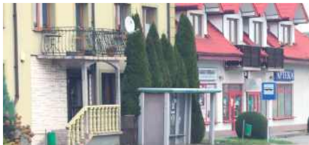
Do zdarzenia doszło na tym przystanku w centrum miasta, w pobliżu apteki i innych punktów handlowo-usługowych

58-latek wykręcał starszej kobiecie palce, chcąc wyrwać jej torebkę. Plany pokrzyżowała mu przypadkowa osoba, która akurat nadeszła i usłyszała krzyki napadniętej staruszki.