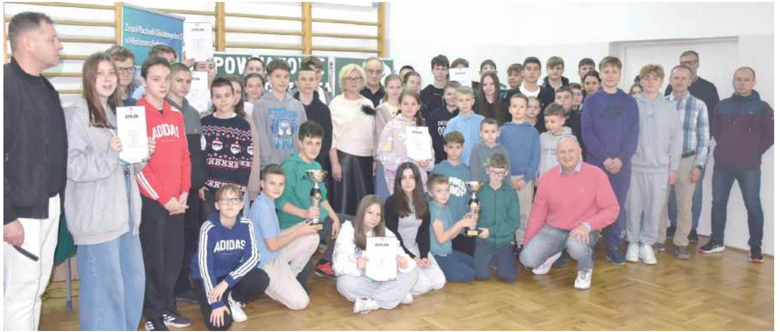
Pamiątkowe zdjęcie wszystkich uczestników rywalizacji

Po emocjonujących pojedynkach najlepsza okazała się Szkoła Podstawowa nr 2 z Międzyrzecza Podlaskiego,