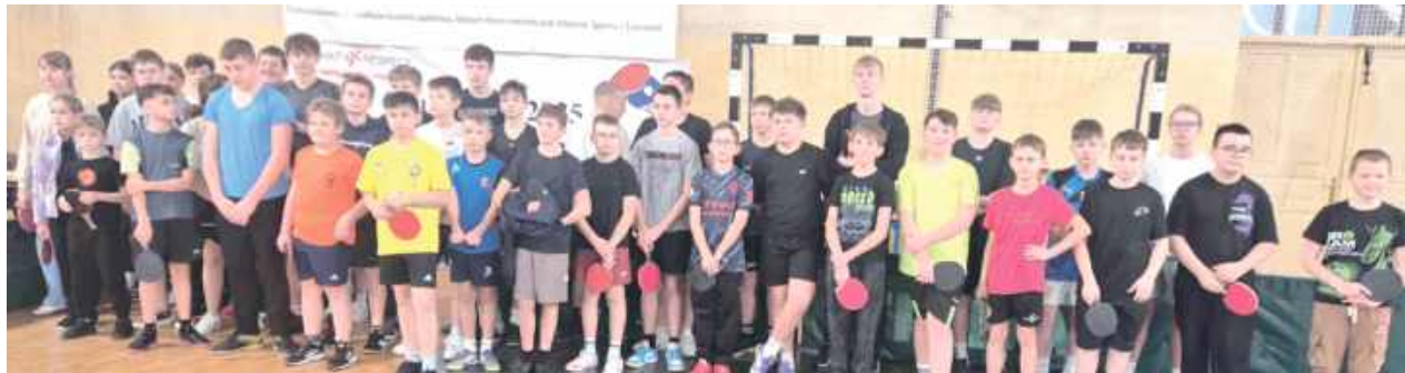
Do turnieju zgłosiło się łącznie 95 zawodników i zawodniczek, którzy rywalizowali w czterech kategoriach wiekowych, z podziałem na dziewczęta/kobiety oraz chłopców/mężczyzn