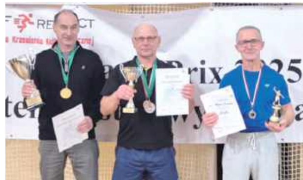
Najlepsi seniorzy zmagani