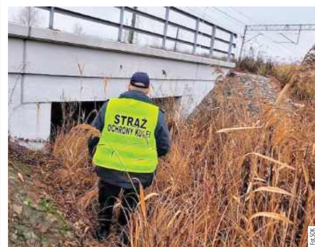
Zgłoszenie wskazywało na obecność osób postronnych w okolicach torów kolejowych, poruszających się samochodem osobowym

W piątek, 12 grudnia funkcjonariusze Straży Ochrony Kolei (SOK) ujęli dwóch mężczyzn na gorącym uczynku podczas nielegalnego opalania kabli przy torowisku w Chełmie. Mieszkańcy miasta, którzy usiłowali odzyskać miedź poprzez spalanie kabli, zostali schwytani dzięki fotoruśce zamontowanej w tym rejonie.