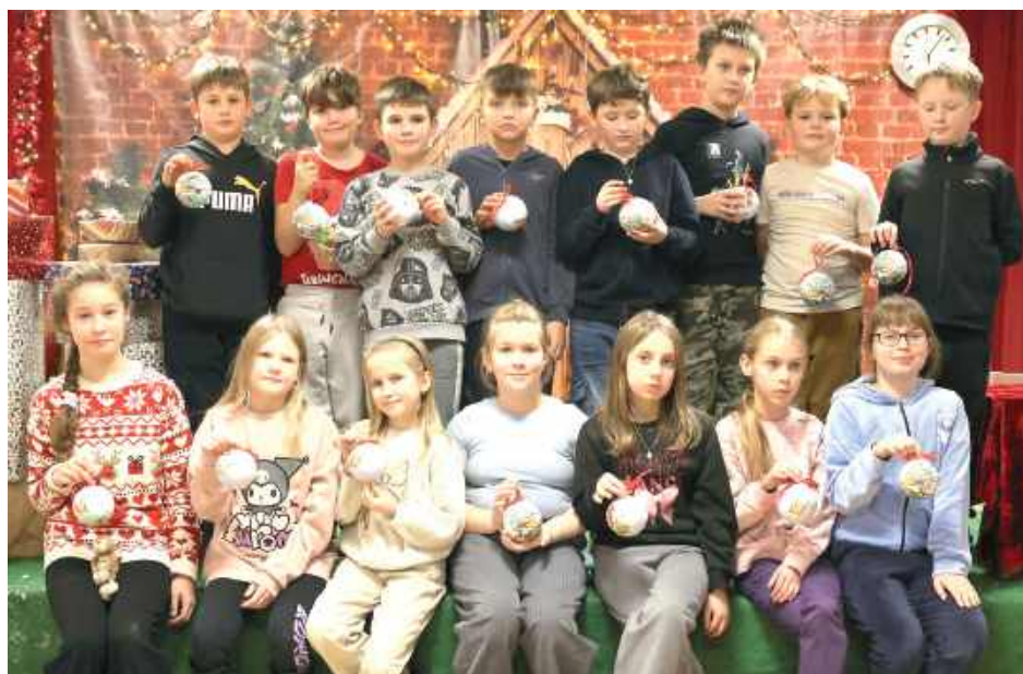
Z warsztatów każdy wyszedł z własnoręcznie wykonaną ozdobą