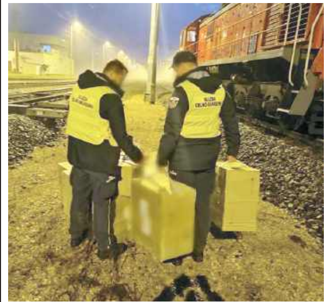
Z kontenera funkcjonariusze wydobyli pudła z papierosami

Ponad ćwierć miliona złotych warte były papierosy, które Służba Celno-Skarbowa wydobyla z kontenera wjeżdżającego w transporcie kolejowym do Polski.