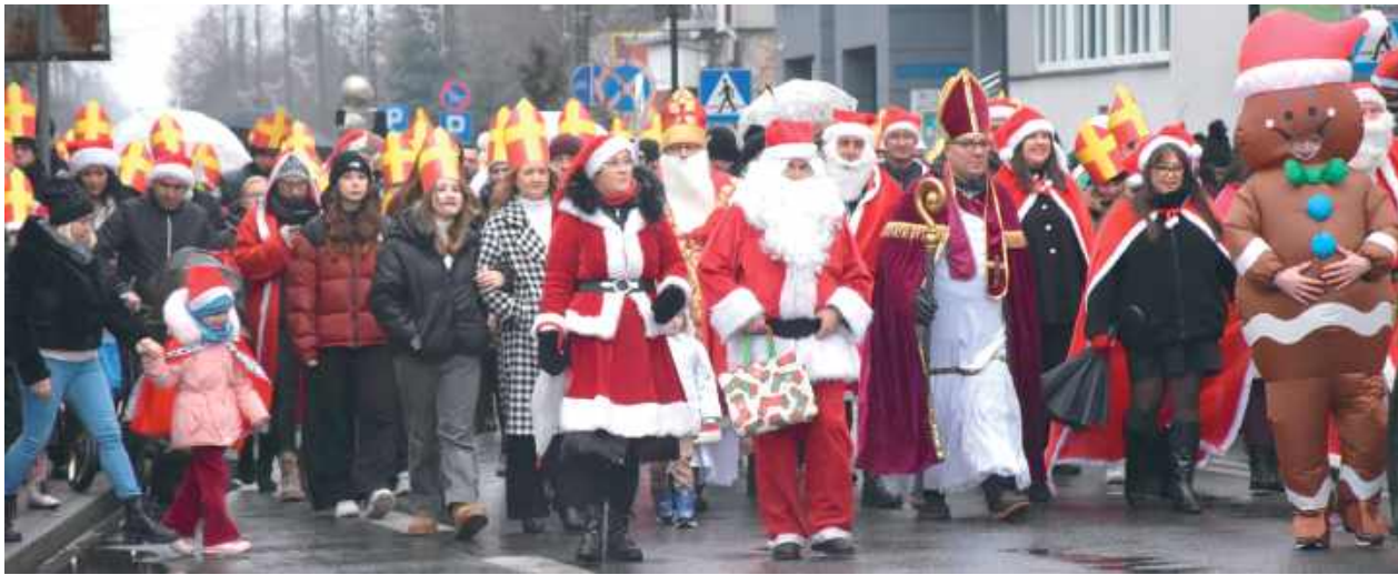
Setki mieszkańców wzięły udział w Orszaku Świętego Mikołaja

Barwny Orszak Świętego Mikołaja, który odbył się w niedzielę 7 grudnia, przyciągnął setki mieszkańców – dzieci, rodziców oraz seniorów.