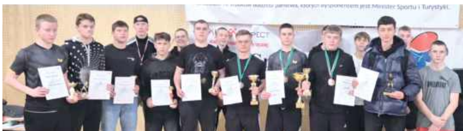
Turniej został zrealizowany w ramach zadania Aktywni Lokalnie, finansowanego z programu Aktywność dla Każdego