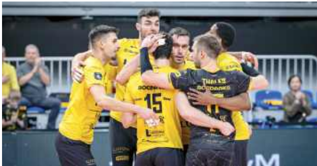
Siatkarze są w dobrej formie