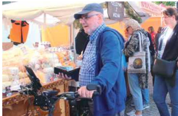
Tradycyjnie na bialskich jarmarkach pojawiają się stoiska z góralami i oscypkami oraz sprzedawcami pieczywa z Wilna