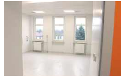
Sala chorych po remoncie

konieczności przemieszczania się po zewnętrznym dziedzińcu.