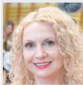
Ka pomostodawczyni i prowadząca wydarzenie

Celem konferencji było wspieranie rozwoju zawodowego nauczycieli oraz wymiana doświadczeń edukacyjnych, w trosce o jeszcze skuteczniejszą pracę na