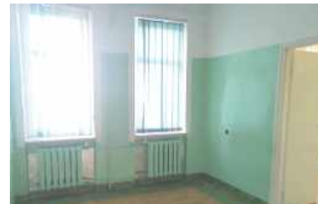
Sala chorych przed remontem