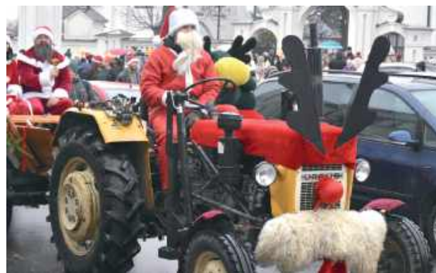
Na czele pochodu znalazł się Święty Mikołaj, który jechał na swoim reniferze – Ursusie

Świętego Mikołaja. Na stoiskach można było znaleźć wyjątkowe ozdoby, rękodzieło, lokalne produkty oraz inspiracje na prezenty dla najbliższych. Jarmark przyciągnął zarówno kupujących, jak i tych, którzy chcieli poczuć świąteczną atmosferę i spędzić czas w gronie mieszkańców.