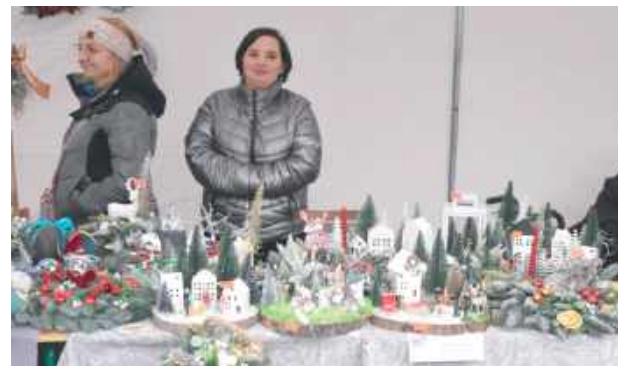
Równoległe na Placu Jana Pawła II odbywał się Jarmark Świętego Mikołaja

Nie zabrakło również Motomikołajów na motocyklach.