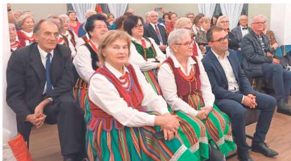
Wydarzenie umożliwiło wymianę doświadczeń w zakresie dziedzictwa Południowego Podlasia

W Centrum Aktywności i Integracji Społecznej w Strzakłach 25 listopada odbył się „Mini Festiwal Kultury Ludowej”. Projekt nosi nazwę „Od haftu do melodii”. Międzyrzecka Spółdzielnia Socjalna „Razem” uszyła reprezentacyjne