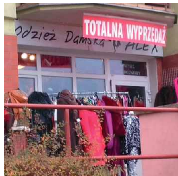
Utrafione w czas

Właściciele sklepu przy białskiej ul. Terebelskiej dobrze czują obecny czas. Nieoficjalnym słowem kończącego się roku dorosłych może być uznane „totalne”. Zagrożenia,