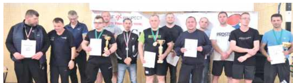
Pierwszych trzech uczestników w każdej kategorii nagrodzono medalami, natomiast najlepsi czterej zawodnicy otrzymali pamiątkowe dyplomy

Pod honorowym patronatem wójta gminy Rossosz odbył się VIII Turniej Grand Prix 2025 w tenisie stołowym amatorów. Organizatorem wydarzenia była Mobilna Akademia Krzewienia Kultury Fizycznej Respect.