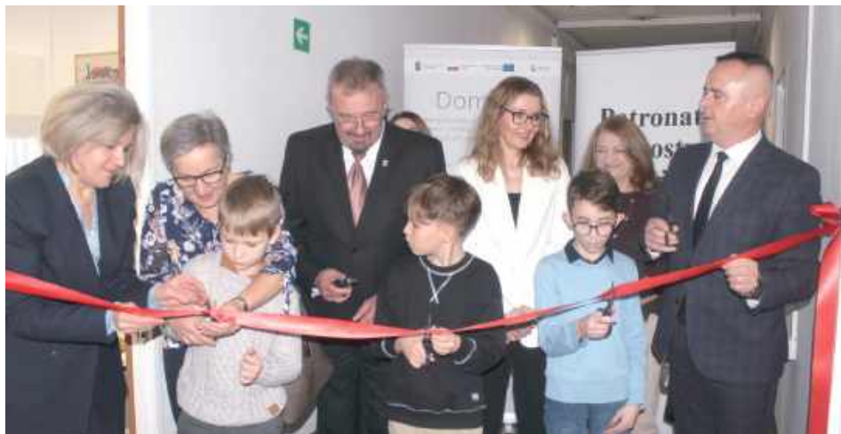
Tak wyglądało przecięcie symbolicznej wstęgi na korytarzu budynku Starostwa Powiatowego. Po obu stronach korytarza pomieszczenia służą Rodzinnemu Punktowi Wsparcia

Jeden z chłopców – Marcelek przejmując i wyraziście zaśpiewał wrzeszczący „List do świętego Mikołaja” wykonywany przez Małą Orkiestrę Dni Naszych. Jemu i innym dzieciom starosta wręczył upominki. Mogły one wraz z dorosłymi przeciąć symboliczną wstęgę Rodzinnego Punktu Wsparcia.