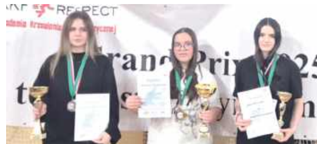
Najlepsze dziewczęta ze szkół ponadpodstawowych

Dodatkową atrakcją turnieju była klasyfikacja mieszkańców Gminy Rossosz. Zwycięzcy poszczególnych kategorii otrzymali statuetki wójta gminy Rossosz, natomiast