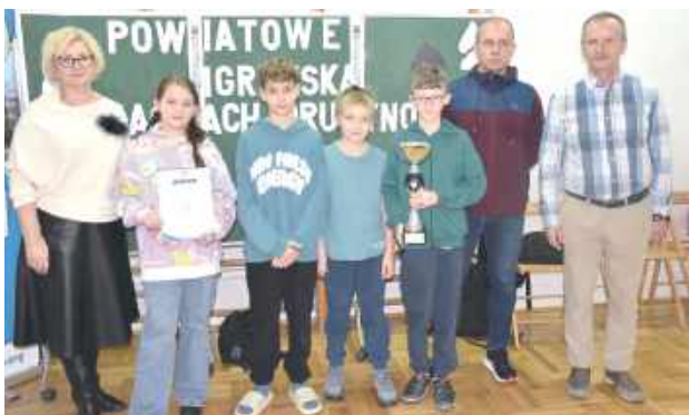
Mistrzowska ekipa z Terespola

W hali Szkoły Podstawowej nr 3 w Międzyrzecu Podlaskim odbył się finał Powiatu Białskiego w Szachach Drużynowych Igrzysk Dzieci. Zawody zostały sfinansowane ze środków Powiatu Białskiego.