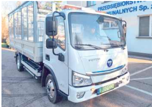
Zakup nowej śmieciarki został całkowicie sfinansowany ze środków własnych spółki

Nowy pojazd ma w pełni elektryczny napęd, dzięki czemu nie emituje spalin i pracuje wyjątkowo cicho, co z pewnością odczują mieszkańcy podczas porannych odbiorów odpadów. Elektryczna śmieciarka ładowana jest z własnej instalacji fotowoltaicznej PUK, co pozwala znacząco zredukować koszty eksploatacji.