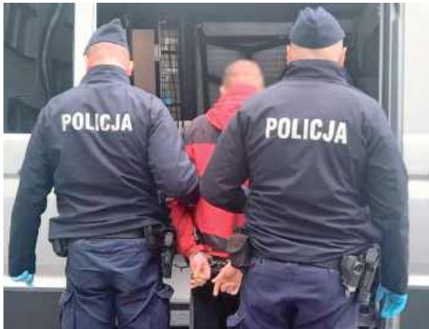
Działania ukierunkowane były na zatrzymywanie osób ukrywających się przed wymiarem sprawiedliwości