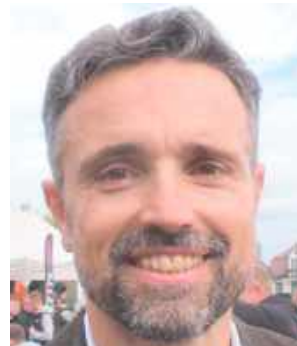
Michał Litwiniuk , prezydent Białej Podlaskiej

Nie jesteśmy zadowoleni, gdyż pan prezydent nie wykorzystał propozycji inwestycyjnych naszego klubu na 2026 rok. Złożyliśmy wnioski inwestycyjne w wielu obszarach. Przed sesją i na sesji będziemy pytać pana prezydenta o przyszłe plany, gdyż miasto się wyludnia, ubywa miejsc pracy i dzieci w szkołach. Ciekawi nas, czy przy decyzjach o budowie nowego licea brano pod uwagę liczbę rodzących się dzieci w tym osiedlu. Oby żłobki i przedszkola nie świeciły pustkami.