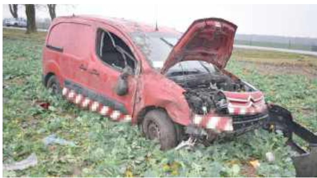
Mężczyzna, jadąc prostym odcinkiem drogi, zjechał na pobocze, a następnie do przydrożnego rowu, gdzie samochód dachował

W miejscowości Łuniew doszło do wypadku drogowego, w którym samochód dachował. W wyniku zdarzenia obrażeń ciała doznał pasażer pojazdu. Policja ustala okoliczności incydentu i apeluje o ostrożność na drogach.