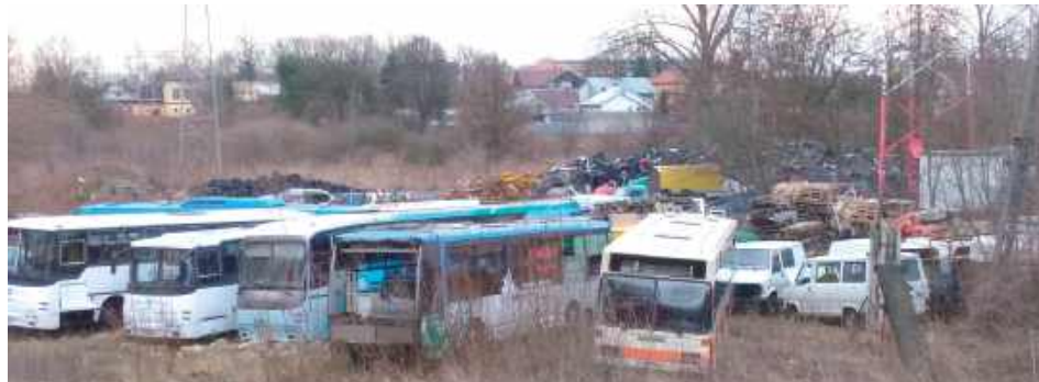
Przez lata na działce było właściwie cmentarzysko starych pojazdów i składowisko złomu. Obok widać linie energetyczne i maszty

W uzasadnieniu prezydent zaznaczył, iż rzeczoznawca majątkowy oszacował wartość wskazanej działki na 1,05 mln zł. Akurat na sesji 15 kwietnia panujące w mieście ugrupowanie chciało przeforsować kilka innych ważnych politycznie uchwał przed wiecem kandydata na prezydenta Rafała Trzaskowskiego m.in. o nadaniu imion ulicy i placom. Emocje nie dotyczyły zatem sprawy nabycia nieruchomości. Nie towarzyszyła jej dyskusja. W głosowaniu 14 radnych (głównie z klubu prezydenta) poparło uchwałę w tej sprawie, aż pięć osób (z klubu PiS) było przeciwnym, wstrzymało się dwie osoby. Dwoje radnych z grupy radnego Adama Chodźńskiego wcale nie głosowało.