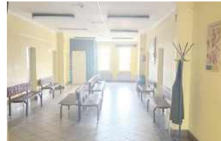
Korytarz przed remontem

Przestrzeń szpitalna, którą zwolni przeniesiony oddział rehabilitacyjny, zostanie wykorzystana na pomieszczenia oddziału chorób wewnętrznych, do tej pory funkcjonującego w obiekcie głównym szpitala od strony ul. Warszawskiej. Obecnie prowadzone są intensywne prace remontowe w tym zakresie. W miejscu obecnej interny powstanie oddział geriatryczny oraz łącznik pomiędzy zaplanowaną geriatrią, a budynkiem, w którym funkcjonuje izba przyjęć, bloki operacyjny, laboratoryjny i diagnostyczny (RTG, tomografia komputerowa) oraz inne oddziały szpitala. Zadaniem nowego łącznika będzie skomunikowanie wszystkich budynków szpitala w jedną całość, a tym samym zapewnienie pacjentom dostępu do świadczeń, bez