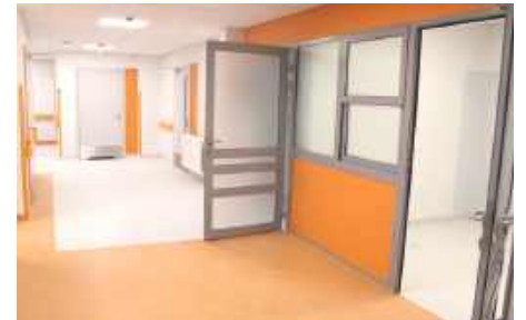
Korytarz po remoncie