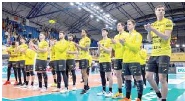
Pomimo porażki Bogdanka LUK nadal prowadzi w tabeli PlusLigi

Natomiast w niedzielę do hali Globus w ramach 18. kolejki PlusLigi przyjechał Jastrzębski Węgiel. Nieoczekiwanie żółto-czarni ulegli temu przeciwnikowi 0:3. W żadnym z setów mistrzowie Polski nie zagrali na poziomie, do którego przyzwyczaili swoich sympatyków. Ry-