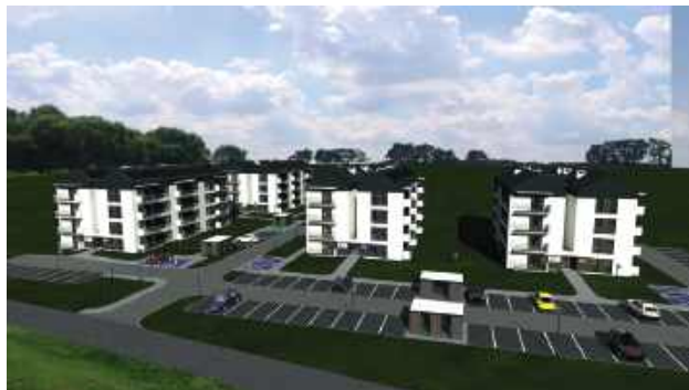
Mieszkania w ramach SIM Wschód

Inwestycja zostanie podzielona na dwa etapy, z których każdy zakłada oddanie do użytku 40 mieszkań. Lokale o powierzchni od 40 do 80 metrów kwadratowych będą przekazywane najemcom w standardzie