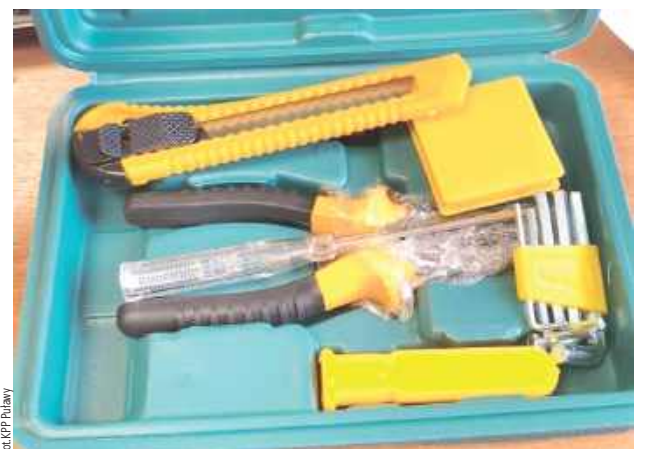
Mieszkaniec gminy Kazimierz dolny przecierał oczy ze zdumienia, gdy otworzył paczkę. Zamiast zamówionej nawigacji był w niej tandetny zestaw majsterkowicza

- Z relacji przedstawionej przez zawiadamiającego wynikało, że znalazł w Internecie