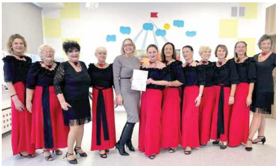
Zespół Olibabki działający przy Centrum Kultury w Łęcznej odwiedził progi Żłobka Publicznego

Tegoroczne obchody Dnia Babci i Dziadka w żłobku w Łęcznej zyskały wyjątkową, taneczną oprawę, która połączyła pokolenia i przyniosła mnóstwo uśmiechu najmłodszym mieszkańcom miasta.