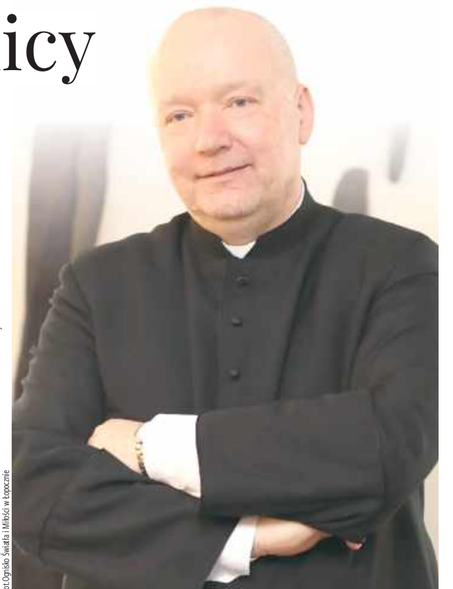
Nowy proboszcz Parafii pw. Św. Wojciecha w Wąwolnicy i kustosz Sanktuarium Matki Bożej Kębelskiej dotychczas pracował w Ognisku Światła i Miłości w Łopocznie w powiecie opolskim