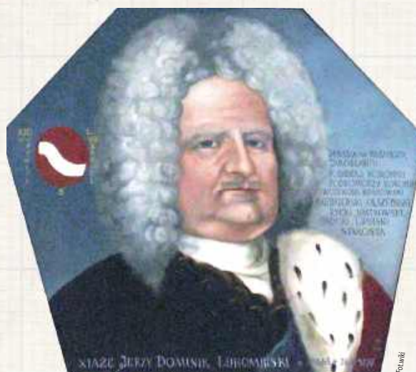
Portret trumienny Jerzego Dominika Lubomirskiego

Ryki, jako niewielka miejscowość, oczywiście była centrum starostwa niegrodzkiego. Wcześniej należały do starostwa stężyckiego, od początków XVII wieku zaś dzierżawili je kolejno Mikołaj Zebrzydowski (1607-1620), Krzysztof Dzierżek (1622), Jerzy Ossoliński (1630-1650), Aleksander Michał Lubomirski (1651-77),