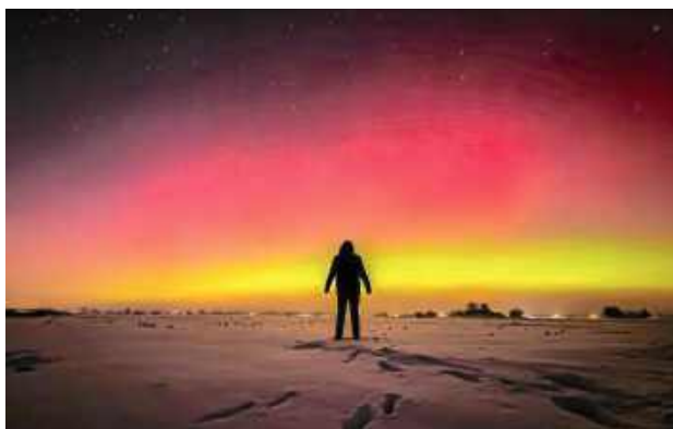
Noc rozbłysła niezwykłymi kolorami.

- Na tle rozświetlonego nieba pojawiły się sylwetki trzech osób, które połączyła wspólna obserwacja zjawiska, gesty radości i symboliczna „piątka” wykonana pod czerwono-zielonym łukiem światła. To były chwile, w których mroz