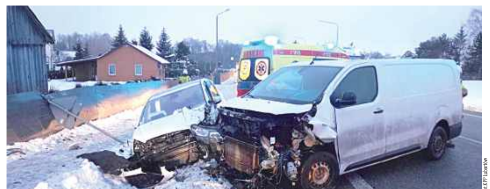
Citroen i Ford zderzyły się 23 stycznia w Trzcincu na pasie ruchu w kierunku Lublina. - Kierowca Citroena zjechał na przeciwny pas ruchu i doprowadził do czołowego zderzenia z jadącym z naprzeciwka Fordem. Kierujący z Forda został przewieziony do szpitala na badania. Obaj mężczyźni byli trzeźwi - informuje policja.