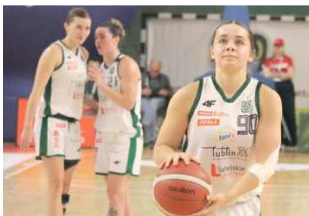
Lubelskie koszykarki przeszły do historii!