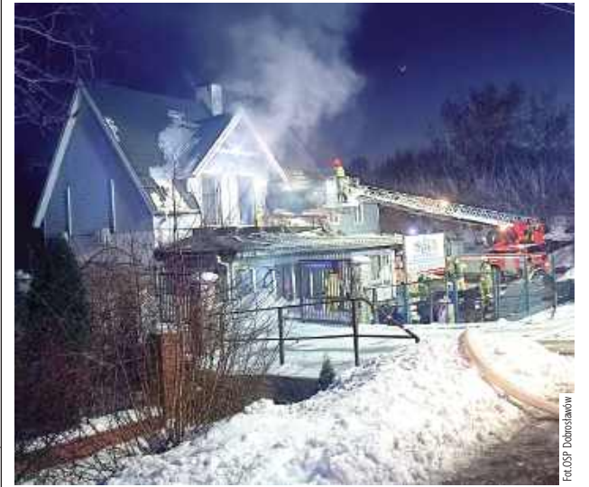
Mieszkańcy sami opuścili płonący budynek jeszcze przed przybyciem straży pożarnej. Na szczęście nikt nie ucierpiał

Blisko cztery godziny trwała akcja gaśnicza w Górze Puławskiej przy ul. Radomskiej, gdzie w minioną środę wybuchł pożar domu jednorodzinne. Na szczęście nikt nie ucierpiał.