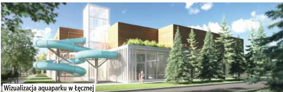
Wizualizacja aquaparku w Łęcznej

Budżet na 2026 rok to dla Łęcznej czas zmiany priorytetów i nadrabiania zaległości.