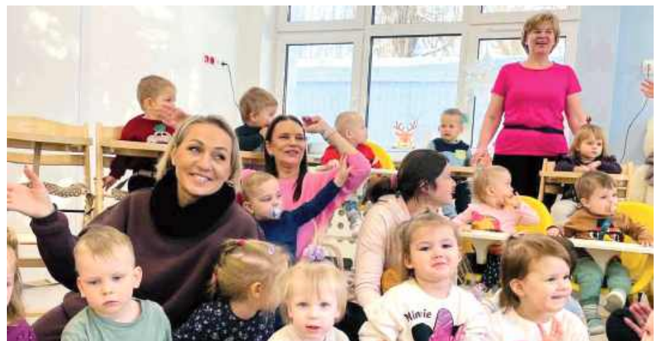
Wydarzenie przyciągnęło uwagę wszystkich maluchów, które z ogromnym zaciekawieniem śledziły każdy ruch tancerek

Radość i entuzjazm artystek z Centrum Kultury błyskawicznie udzieliły się małym widzom, spr-