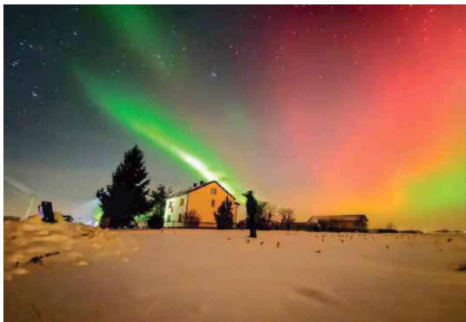
Kolory zorzy polarnej nad Paskudami.