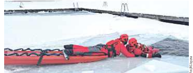
Ćwiczenia ratownicze na jeziorze Piaseczno

Takie szkolenia są niezwykle istotne, ponieważ czas przeżycia człowieka w lodowatej wodzie jest bardzo krótki. Profesjonalizm służb ratunkowych to jednak