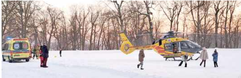
Śmigłowiec LPR musiał wylądować w Parku Czartoryskich. Załoga przetransportowała 12-latkę z ciężkimi obrażeniami głowy do szpitala w Lublinie

12-letni chłopiec z poważnymi obrażeniami głowy został przetransportowany przez załogę Lotniczego Pogotowia Ratunkowego do szpitala w Lublinie. Nastolatek uderzył głową w drzewo, zjeżdżając z góry na tzw. „jabłuszku”.