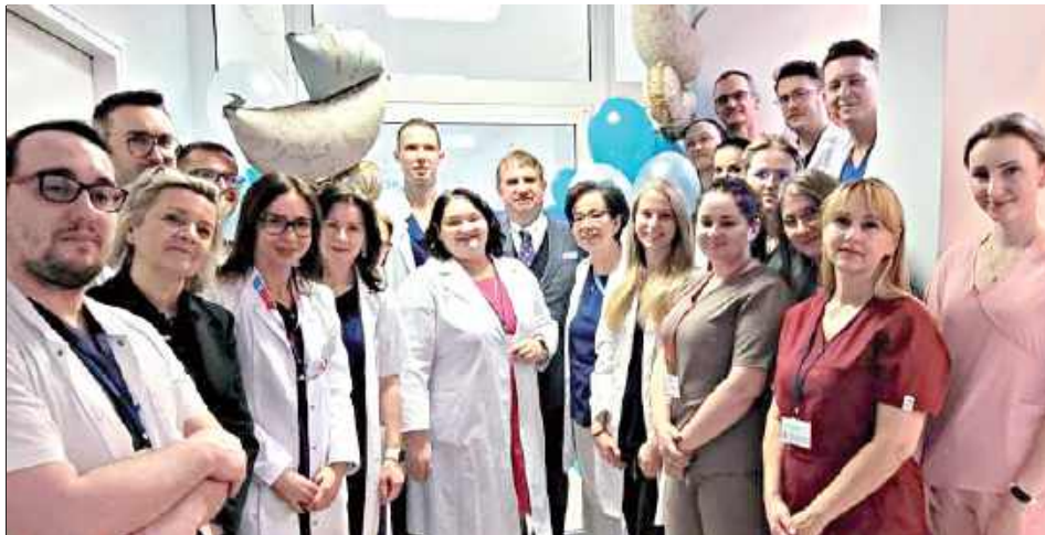
Poradnię otwarto 22 stycznia w USK nr 1, który mieści się przy ul. Staszica

- To dla mnie zaszczyt i przyjemność powitać Państwa w dniu szczególnym dla naszej Kliniki Położnictwa i Patologii Ciąży, w dniu oficjalnego otwarcia poradni przyklinicznej „Zdrowia Kobiety”, która stanowi ważny krok w rozwoju nowoczesnej, kompleksowej opieki nad kobietą w ciąży, jak i poza nią - takimi