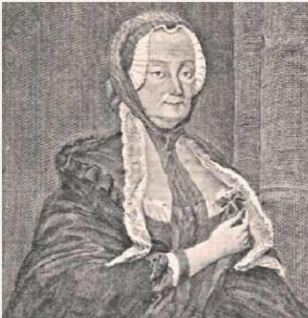
Słynęła z gościnności, której styl odbiegał od nader swobodnych obyczajów epoki. We Lwowie zapraszała w piątki i demonstracyjnie podawała postne potrawy, od odwiedzających ją pań wymagała umiaru w stroju (sama nieodmiennie w robionie i koronkami...)

Kilka z nich znajdujemy we wstępie Kunasiewicza do wyda-