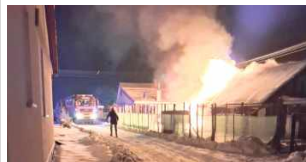
Pożar budynku postawił straż na nogi

Do pożaru w miejscowości Dragany, w powiecie lubelskim, doszło 23 stycznia, a straż pożarna otrzymała zgłoszenie o nim po godzinie 18. Na miejscu pierwsze pojawiło się OSP Dragany i zastało palący się budynek gospodarczo-mieszkalny o konstrukcji drewnianej. To od razu utrudniło sprawę, a do tego okazało się, że kolejnym utrudnieniem jest rozszczelniona butla z gazem.