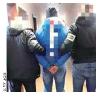
Grozi mu kara do 5 lat pozbawienia wolności

Łęczna: Na trzy miesiące do tymczasowego aresztu trafił 40-latek. Mężczyzna, trzymając w ręku siekiere, groził znajomej pozabawieniem życia. Zabrał jej telefon komórkowy, klucze do samochodu i do pracy oraz dowód osobisty.