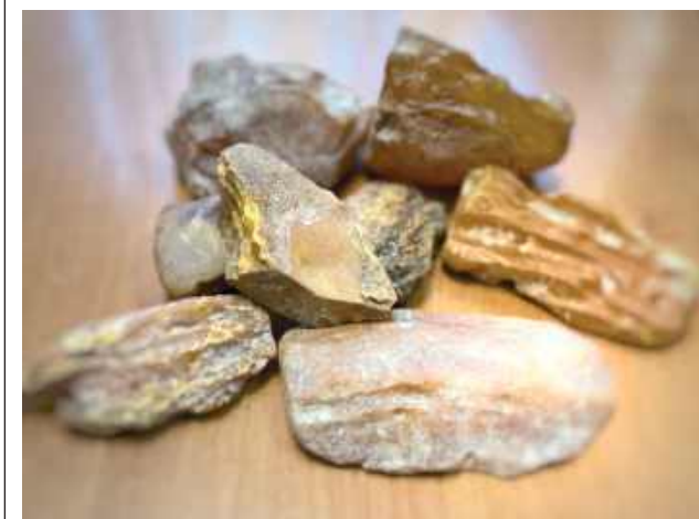
Za kradzież grozi im do 5 lat pozbawienia wolności

LUBARTÓW: Dzięki czujności pracowników kopalni odzyskanych zostało kilkanaście sztuk bryłek bursztynu o łącznej wartości blisko 4 tysięcy złotych.