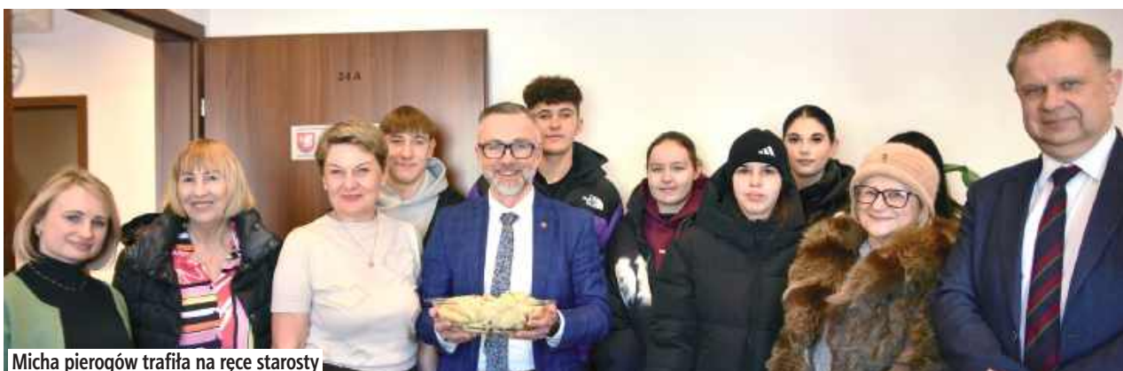
Micha pierogów trafiła na ręce starosty

W siedzibie Starostwa Powiatowego w Łęcznej zapachniało domowymi przysmakami, a wszystko to za sprawą wyjątkowej akcji integrującej najstarszych i najmłodszych mieszkańców naszego powiatu. Seniorzy z lokalnego Klubu Seniora oraz wychowankowie Bursy Szkolnej spotkali się, aby wspólnie przygotować tradycyjne pierogi z serem.