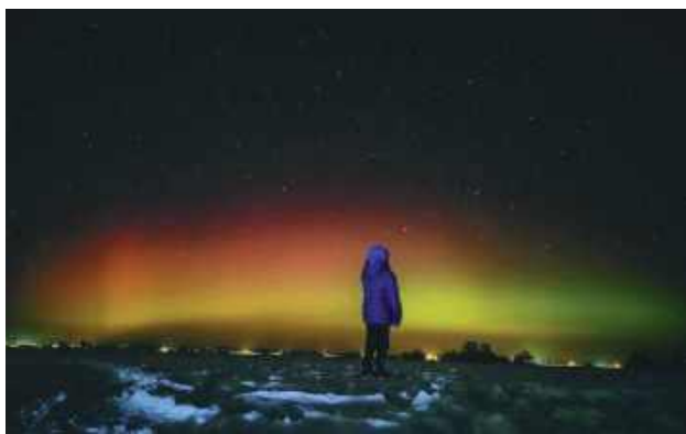
Syn pana Tomasza dzielnie trwał z tatą na fotograficznej wyprawie po zdjęcia zorzy.

- Niebo nad wsią rozbłysło intensywnymi kolorami. Dominowała głęboka czerwień, która płynnie przechodziła w zieleń