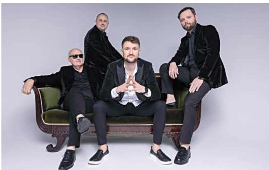
Defis nie dotarł na koncert. Na szczęście muzykom nic się nie stało

Zespół zmierzał na koncert. Muzycy wyruszyli z terenu naszego województwa. Jak udało się ustalić, warunki na drogach były wyjątkowo wymagające. Opady, śliska nawierzchnia