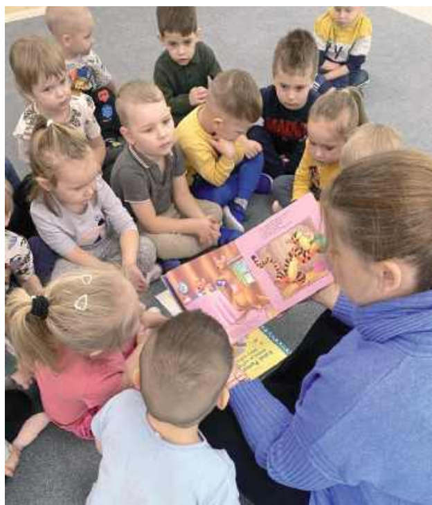
Bajkowy klimat w łęczyńskim przedszkolu

Centralnym punktem spotkania była lektura książki „Ale Zabawa”, która w niezwykle plastyczny i przystępny sposób opisuje zimowe perypetie