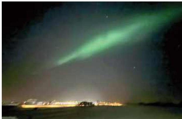
Zorza nad szpitalem w Łęcznej

Wielu mieszkańców powiatu chwyciło za aparaty fotograficzne i telefony komórkowe, by uwiecznić ten ulotny moment. Co ciekawe, matryce współczes-