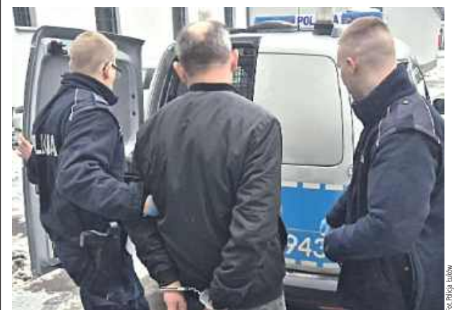
48-latek został zatrzymany!

Policjanci z Adamowa otrzymali zgłoszenie o poważnej awanturze w jednym z domów. Agresorem okazał się 48-latek, który fizycznie i psychicznie znęcał się nad żoną i córkami.