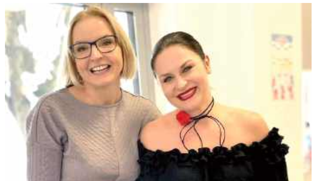
Olibabki w przedszkolu w Łęcznej