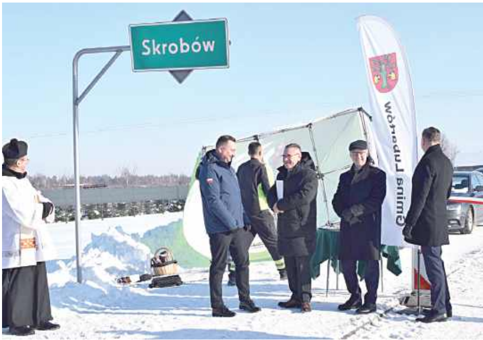
W trakcie uroczystości namiot gminy Lubartów odleciał

Drogę gminną w Skrobowie Kolonii wybudowano za ponad 5,5 mln zł, w tym blisko 2,8 mln zł to dofinansowanie z Rządowego Funduszu Rozwoju Dróg.