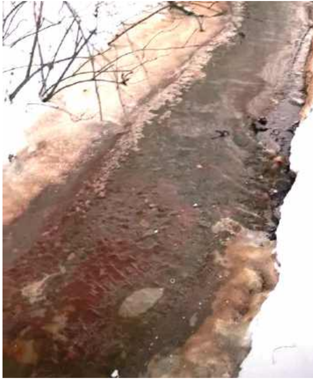
Taki widok zastali kilka dni temu mieszkańcy Końskowoli w rowie melioracyjnym niedaleko zakładów mięsnych

Do incydentu doszło w miniony wtorek 20 stycznia. Mieszkańcy zauważyli, że woda w rowie melioracyjnym ma czerwony kolor. Tym bardziej rzucało się to w oczy, że wokół leży śnieg, co z jego bielą dało silny kontrast. Woda z rowu trafia wprost do lokalnej rzeki Kurówki. Mieszkańcy nauczeni doświadczeniem sprzed kilku lat, natychmiast zaalarmowali władze gminy. W lutym 2018 r. w tym samym rowie także płynęła krwista substancja. Wtedy również interweniowały służby. Na miejscu stawili się m.in. policjanci, którzy szybko skierowali do prokuratury wniosek o wszczęcie śledztwa. Przedstawiciele wówczas zakładów Pini Beef tłumaczyli, że „nagły spadek temperatury spowodował rozszczelnienie układu zabezpieczającego kanalizację, co z kolei sprawiło, że doszło do przesącze-