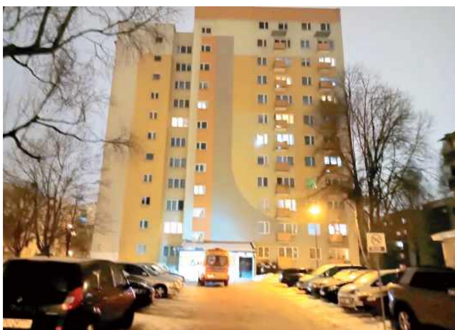
To właśnie w tym wieżowcu doszło do tragedii

Co się stało? Czy doszło do dramatycznego wypadku? Czy ktoś przyczynił się do jego