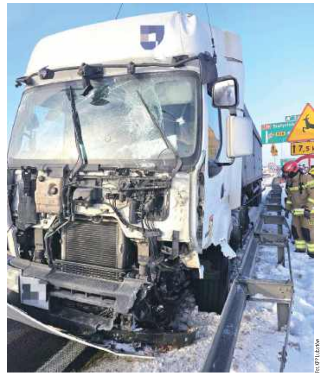
Ciężarówka kierowana przez 48-letniego mężczyznę uderzyła w barierki ochronne

Do zdarzenia doszło 22 stycznia tuż przed godziną 12. Jako miejsce zdarzenia policja podaje Wólkę Rozwadowską, według OSP Firlej doszło do niego w Bykowszczyźnie.