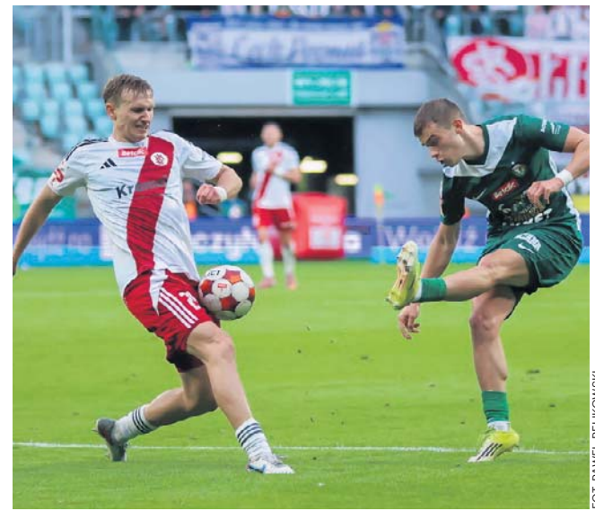
Piłkarze Wieczystej Kraków, Polonii Warszawa, Chrobrego Głogów i ŁKS-u Łódź zawalczą w barażach

Wieczysta Kraków - Polonia Warszawa 28 maja (czwartek), godz. 20.30. ©