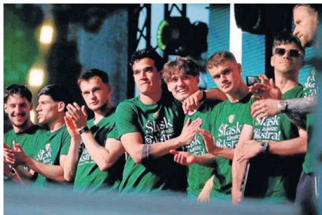
Około 20:30 drużyna pojawiła się na Placu Wolności