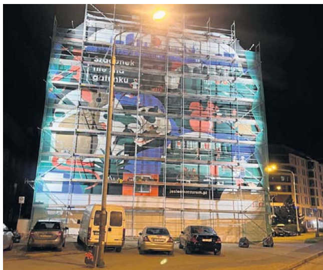
Mural kampanii „Jestem szczurem” powstaje na jednym z nadodrzańskich podwórek, które zmagają się z problemem z gryzoniami od dawna.

„Taki mural to dla nas jak splunięcie prosto w twarz. Praktycznie ciągle zgłaszamy problem, niejednokrotnie sami podejmujemy kroki na własny koszt. Szczury jakie miłe by nie