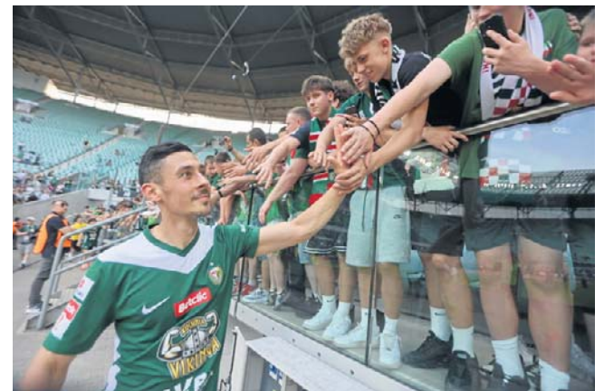
Po meczu piłkarze jeszcze długo zbijali piątki z kibicami