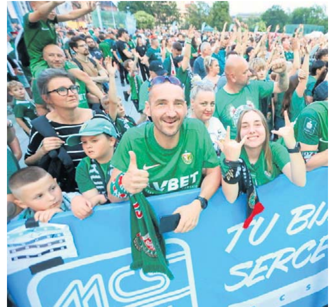
Pod sceną ustawioną przed Narodowym Forum Muzyki przez cały wieczór przewinęło się kilka tysięcy fanów