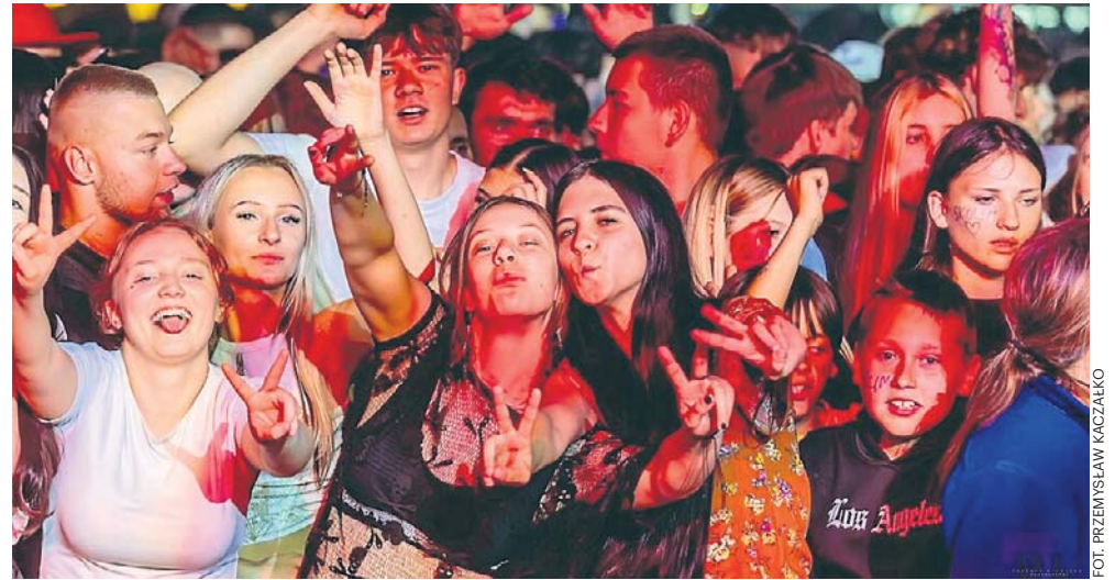
FOT. PRZEMYSŁAW KACZAKO

Artysta spóźnił się ponad godzinę, ale o świetne nastroje w oczekiwaniu na gwiazdę wieczoru zadbał DJ Maciej Wowk. Po północy Konrad Skolimowski porwał publiczność największymi hitami, a wspólne śpiewy i zabawa trwały do późnych godzin nocnych. PKACZ