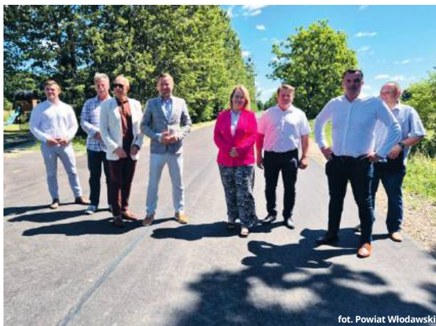
fol. Powiat Włodawski

W Orchówku zrealizowano przebudowę fragmentu drogi prowadzącej od skrzyżowania z drogą wojewódzką do terenu byłej fabryki Sco-Pak. Odcinek o długości ponad 2,1 km został przebudowany kosztem 3 304 177,73 zł. Zadanie obejmowało kompleksową modernizację nawierzchni i dostosowanie parametrów technicznych do obowiązujących standardów. W odbiorze technicznym