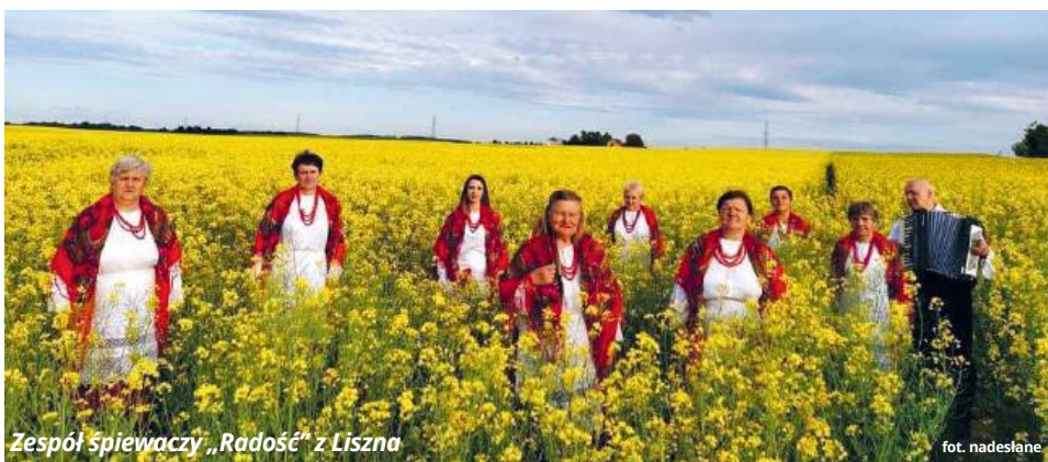
Zespół Spiewaczy „Radość” z Liszna