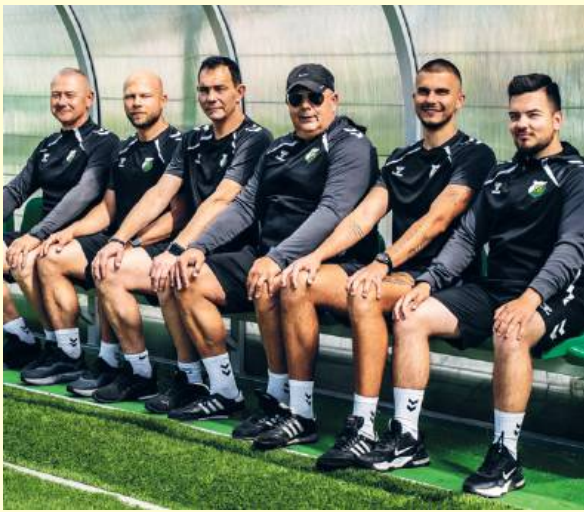
for: Chełmianka Chełm