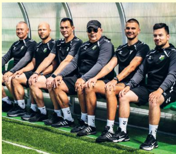
for: Chełmianka Chełm