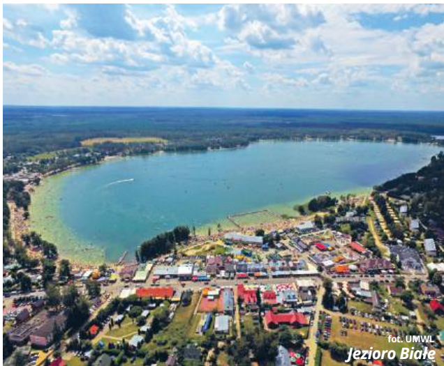
Jezioro Białe