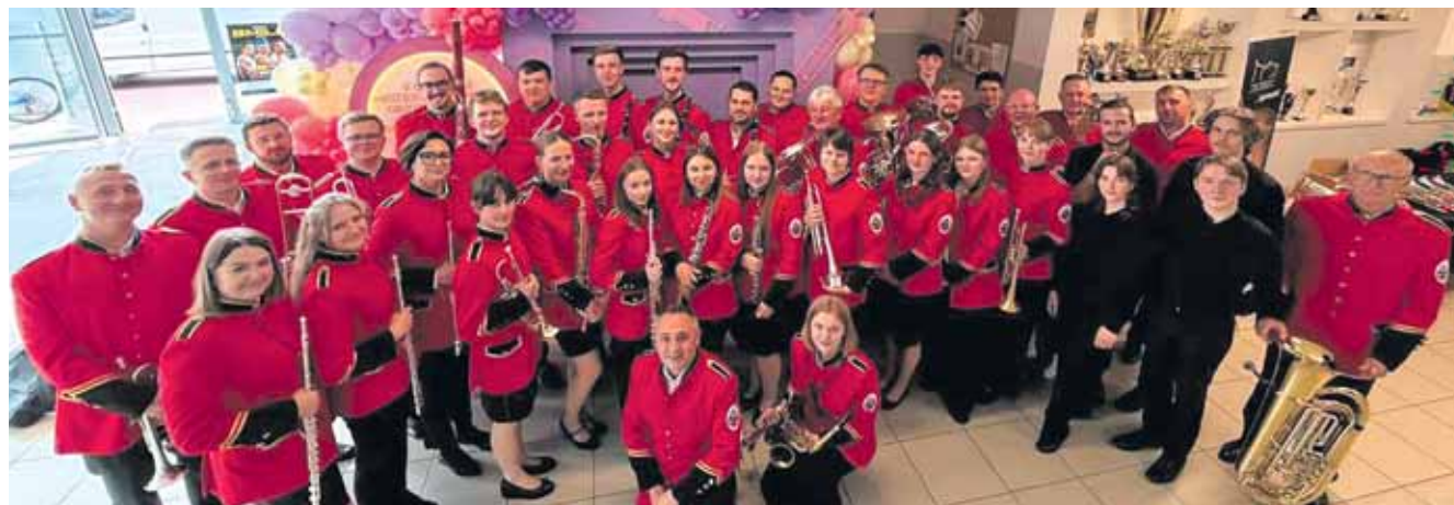
Orkiestra Reprezentacyjna Gminy Miasteczko Śląskie wywalczyła 3. miejsce i zdobyła złoty medal w kategorii koncertowej