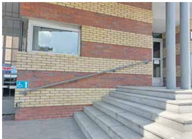
Wejście dla niepełnosprawnych jest z tyłu budynku ZUS-u

Mówi, że do głównego wejścia nie ma podjazdu dla osób niepełnosprawnych – trzeba podejść od tyłu. – Tyle że brama jest zamknięta, podobno ze względów bezpieczeństwa. Trzeba się więc znowu przemieścić, żeby nacisnąć dzwonek – aby ktoś bramę otworzył i można było skorzystać z udogodnień dla niepełnosprawnych. A jest umiejscowiony tak, że nie można po prostu pod niego podejść, opuścić szybę w samochodzie i zadzwonić. Czy ZUS ma zamiar coś z tym zrobić? – mówi zdenerwowany czytelnik (dane do wiad. red.).