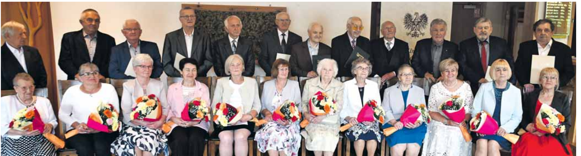
W Tworogu odbyła się uroczystość z okazji jubileuszy małżeńskich mieszkańców gminy