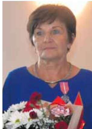
Każda z pań dostała bukiet kwiatów