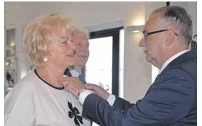
Miasto wniosek o medale z różą wystąpiło w październiku 2024 r. Przyszły teraz...