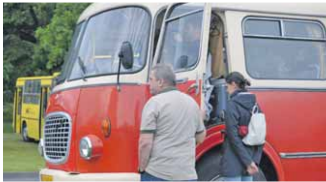
Prawdziwym hitem okazał się kultowy Jelcz „ogórek”