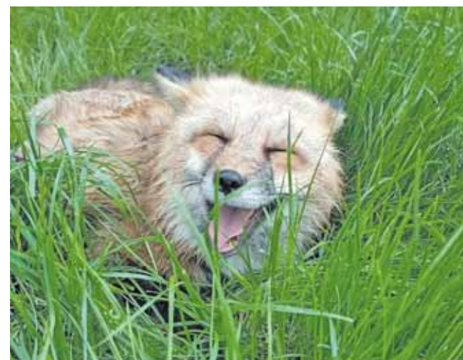
Lisy domowe wymagają fachowej opieki

Przedstawiciele TOZ w Radzionkowie przypo-