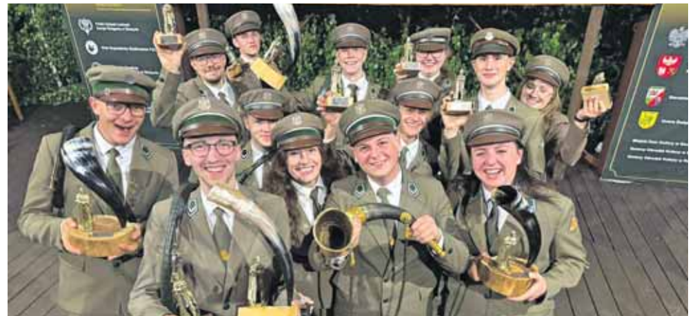
Mistrzowscy sygnaliści z Brynka