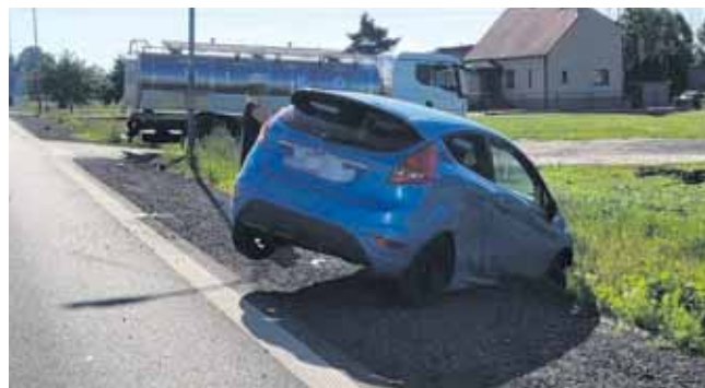
Po zderzeniu samochód osobowy uderzył jeszcze w przydrożny słup. Kierowca Forda odniósł obrażenia

Do zdarzenia doszło w poniedziałek, 8 czerwca przed godz. 7 na ul. Bytomskiej. Jak ustalili policjanci, kierujący ciężarówką samochodem marki Man z cysterną, 49-letni mieszkaniec powiatu gliwickiego,