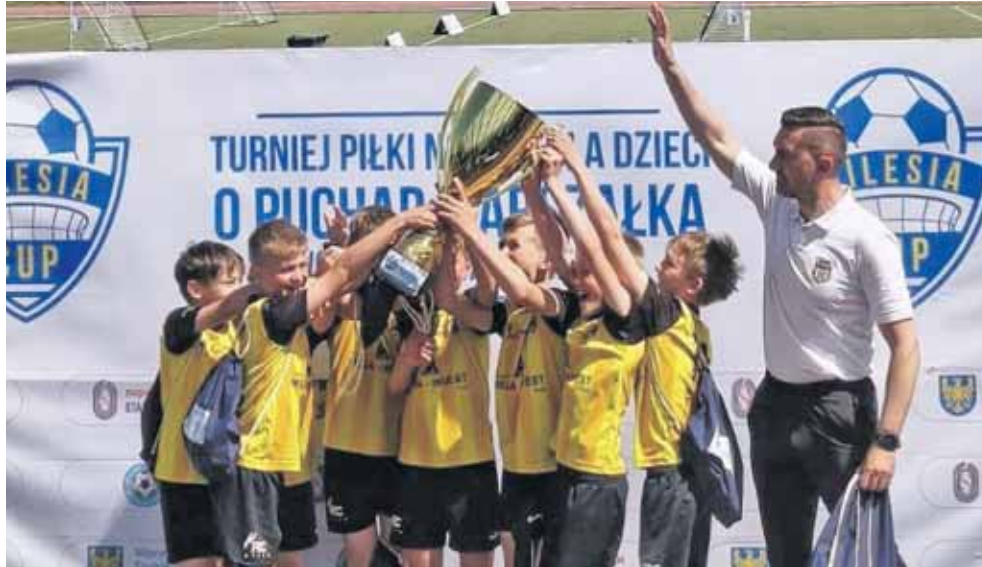
Akademia Piłkarska Ruch Radzionków zwyciężyła w prestiżowym turnieju Silesia Cup o Puchar Marszałka Województwa Śląskiego