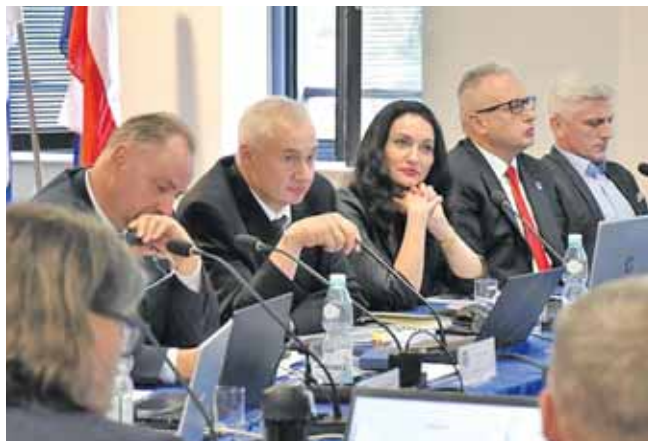
PiS głosowało przeciwko zarządowi

– Jest pan jak to ogrodzenie: duże, ozdobne, ale porastają je chwasty – mówił radny. Jak dodał, zwracał się o uporządkowanie tego elementu, jednak bez skutku. Zdaniem radnego taki brak zaangażowania władz po-