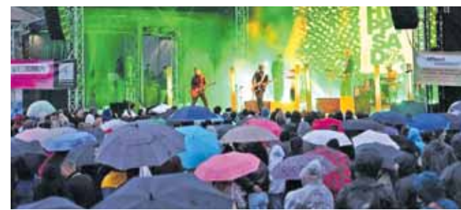
Las parasoli pod sceną to nie był rzadki widok podczas dni miasta

Mocny początek w piątkowy wieczór z koncertem zespołu Śląsk, występ Justyny Steczkowskiej, finałowy koncert grupy Bad Boys Blue oraz strefa atrakcji dla dzieci i rodzin na Eko-Rynku – tak w skrócie można podsumować tegoroczne Dni Radzionkowskie.