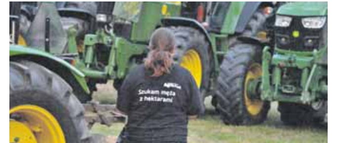
Śląski Zlot John Deere odbywa się od czterech lat