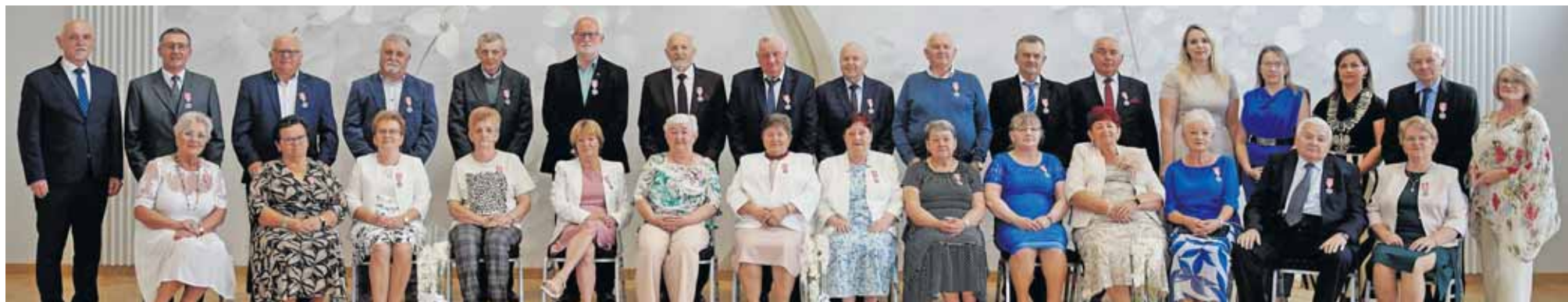
Złote małżeństwa z 50-letnim stażem