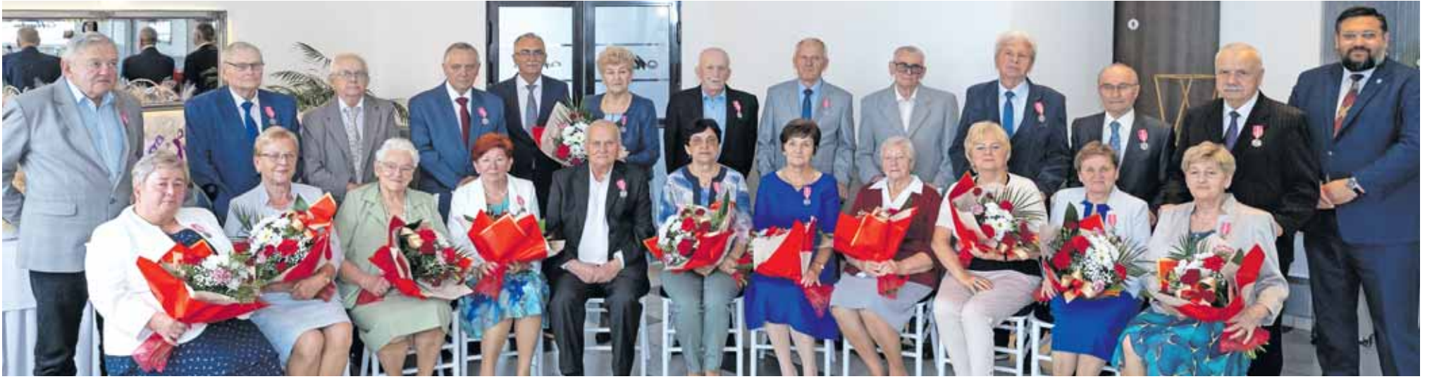
Złote i żelazne pary z Radzionkowa