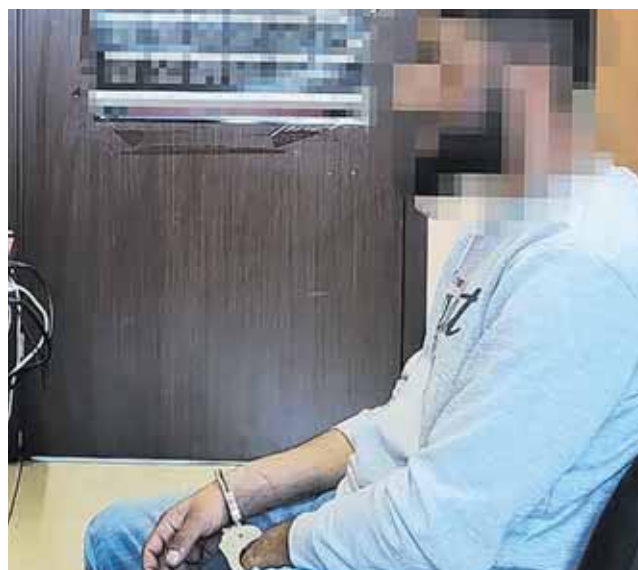
Policjanci ustalili, że mężczyźni stoją również za kradzieżami w Kluczborku i Oleśnie

W samochodzie znajdowali się mieszkańcy Bytomia w wieku od 36 do 70 lat. Szybko wyszło na jaw, że nie była to ich jedyna akcja – policjanci ustalili, że mężczyźni stoją również za kradzieżami w Kluczborku i Oleśnie. Łączne straty oszacowano na ponad 3 tysiące złotych.