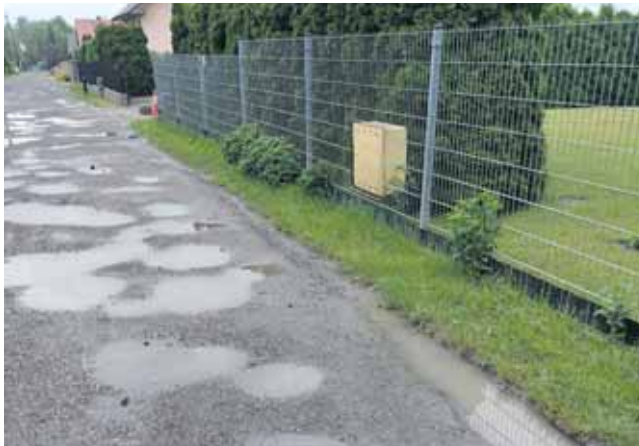
Mieszkanka ul. Wyszyńskiego w Tarnowskich Górach mówi, że stan drogi jest tak fatalny, że robi się już niebezpiecznie

– W minionych latach na tej drodze utrwalaliśmy nawierzchnię. Rozważali-