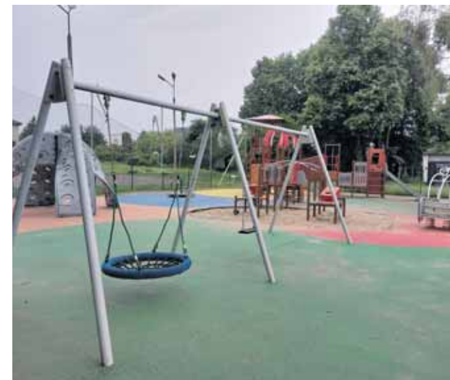
Zawiadomienie o kradzieży huśtawki zostało złożone 18 maja. Wartość strat oszacowano na około 1000 złotych

Śledczy ustalają okoliczności zdarzenia oraz sprawców kradzieży. (MIR)