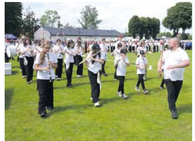
Świetnie poradzili sobie też Mali Kamilianie

com i patronom za nieustające wsparcie, które niesie nas po kolejne sukcesy. Ruszamy do dalszej pracy – czytamy w mediach społecznościowych orkiestry.