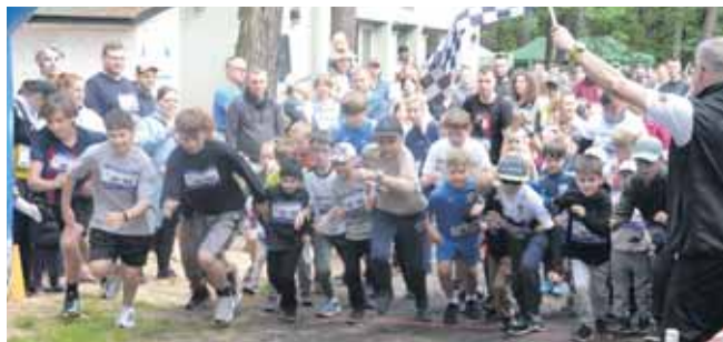
Pierwsi pobiegli chłopcy

Prawie 450 zawodników i zawodniczek stanęło w niedzielę na starcie V Charytatywnego Bartusiowego Biegu Nordicusa w Strzybnicy. To rekordowa frekwencja podczas wydarzenia, które z roku na rok przyciąga coraz więcej mieszkańców Tarnowskich Gór, powiatu tarnogórskiego i okolic. Dla porównania, podczas ubiegłorocznej edycji udział wzięło nieco ponad 300 osób.