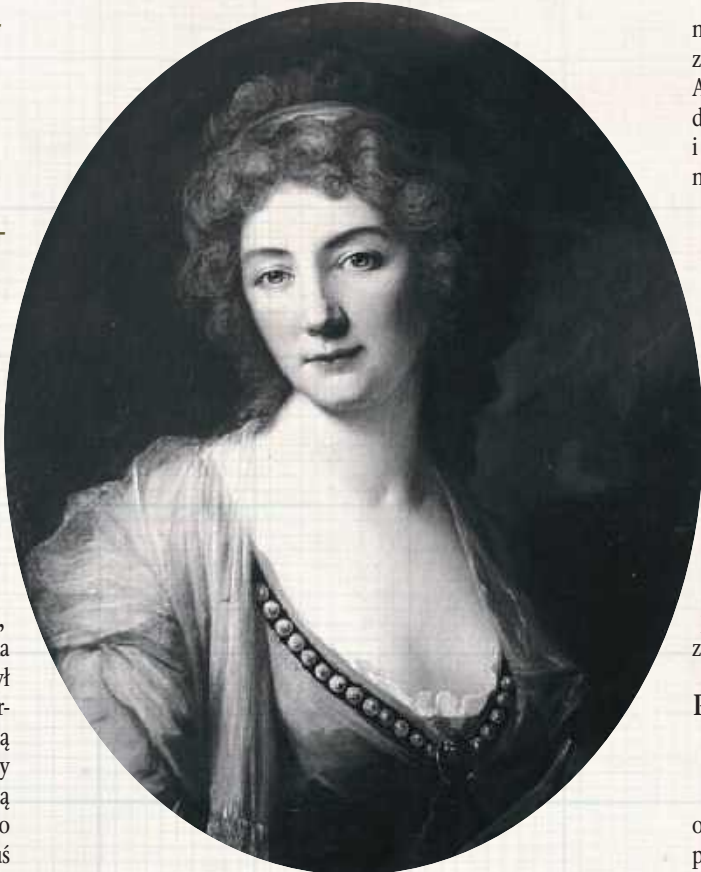
Portret Maryny Czartoryskiej (Marii Wirtemberskiej) pędzla Lampiego

Józef II-gi, będąc w Lwowie, parokrotnie rzekł publicznie do