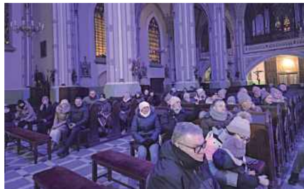
Koncert stał się pięknym zwieńczeniem okresu Bożego Narodzenia, pozostawiając słuchaczy z poczuciem radości, wspólnoty i wdzięczności za przeżyty czas.