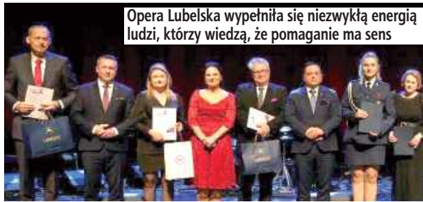
Opera Lubelska wypełniła się niezwykłą energią ludzi, którzy wiedzą, że pomaganie ma sens