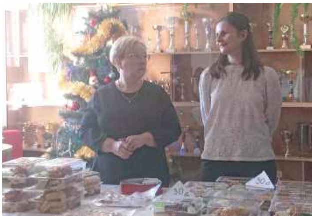
Wydarzeniu towarzyszył kiermasz ciast