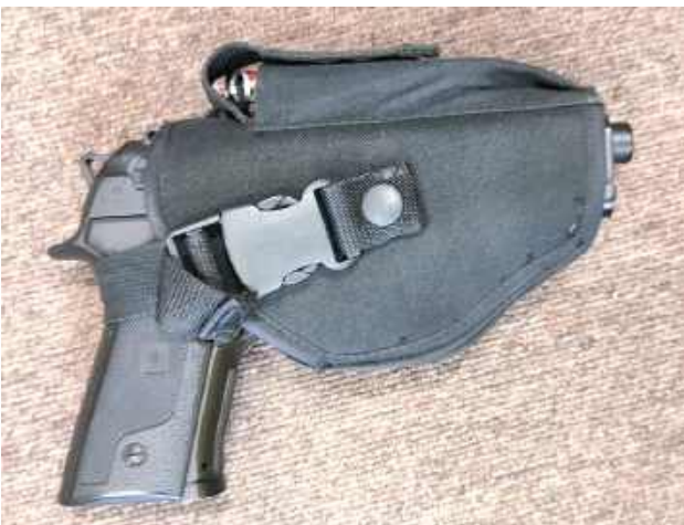
Funkcjonariusze zabezpieczyli niebezpieczny przedmiot

Jest akt oskarżenia ws. 59-latka, który kierował groźby karalne wobec swojego sąsiada. Mężczyzna trzymając w ręku broń groził zabójstwem.