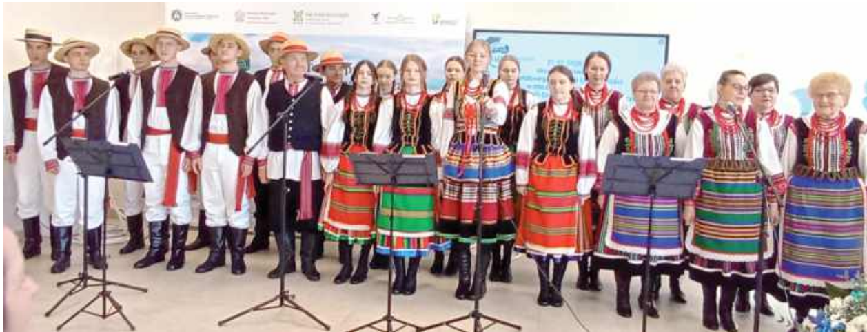
Wydarzenie uświetnił swoim występem Zespół Kalina z Jabłonia, który zaprezentował się wspólnie z zespołem młodzieżowym ZSKCR w Jabłoniu

Jabłoń: W Zespole Szkół Centrum Kształcenia Rolniczego im. Augusta Zamoyskiego w Jabłoniu otwarto Branżowe Centrum Umiejętności w Dziedzinie Energetyki Odnawialnej- Bioenergetyki. Uroczystość odbyła się 21 stycznia