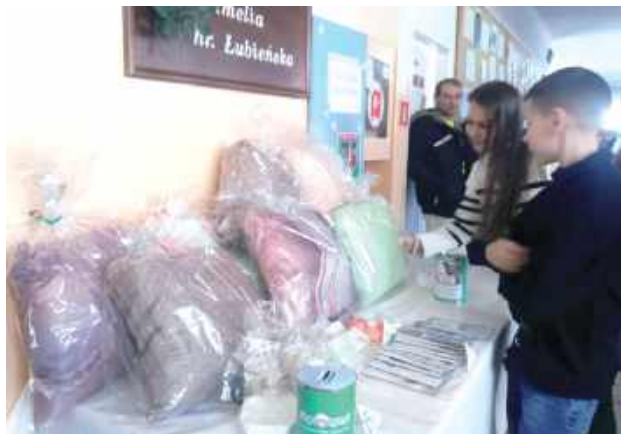
Akcja #KupJaśkaDlaAdaśka cieszy się coraz większym zainteresowaniem