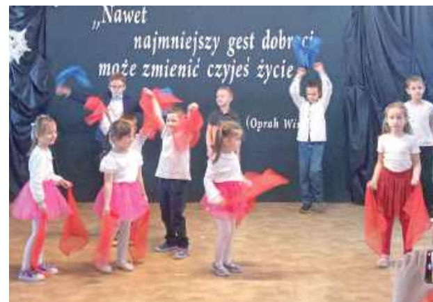
Na scenie wystąpili młodzi artyści