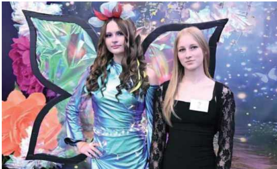
W wydarzeniu wzięły udział uczennice ZS im. Staszcica w Parczewie

- Dziewczyny zaprezentowały spektakularne, elektryzujące fryzury, idealnie wpisujące się w temat konkursu. Ich stylizacje zachwyciły odwagą, precyzją wykonania oraz kreatywnością. To były prawdzi-