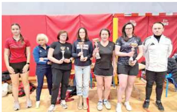
W grupie kobiet wystąpiło sześć zawodniczek