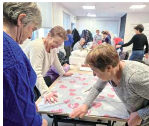
Panie i panowie z Klubu Seniora w Siemieniu ochoczo zabrali się do pracy, liczy się przecież każda pomoc i każde chętne ręce do pracy