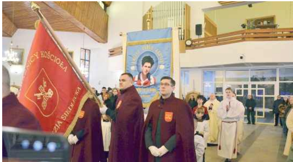
Carlo Acutis znany jest z zamiłowania do informatyki oraz z tworzenia internetowej dokumentacji cudów eucharystycznych. Jego słowa: „Odnajdziecie Boga, a znajdziecie sens waszego życia” wielokrotnie przywoływano podczas uroczystości jako aktualne i szczególnie bliskie młodzieży

Carlo Acutis znany jest z zamiłowania do informatyki oraz z tworzenia internetowej dokumentacji cudów eucharystycznych. Jego słowa: „Odnajdziecie Boga, a znajdziecie sens waszego życia” wielokrotnie przywoływano podczas uroczystości jako aktualne i szczególnie bliskie młodzieży.