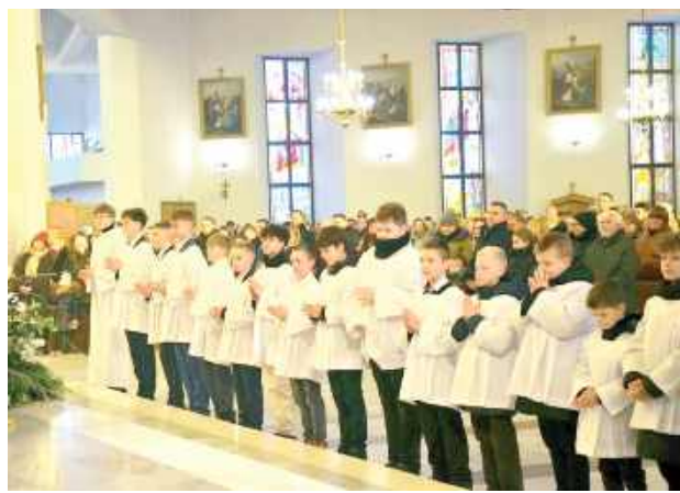
W Radzynie odbyła się uroczystość wprowadzenia relikwii św. Carlo Acutisa, jednego z najmłodszych błogosławionych Kościoła katolickiego, nazywanego „apostolem Eucharystii” i patronem młodego pokolenia wychowanego w świecie nowych technologii