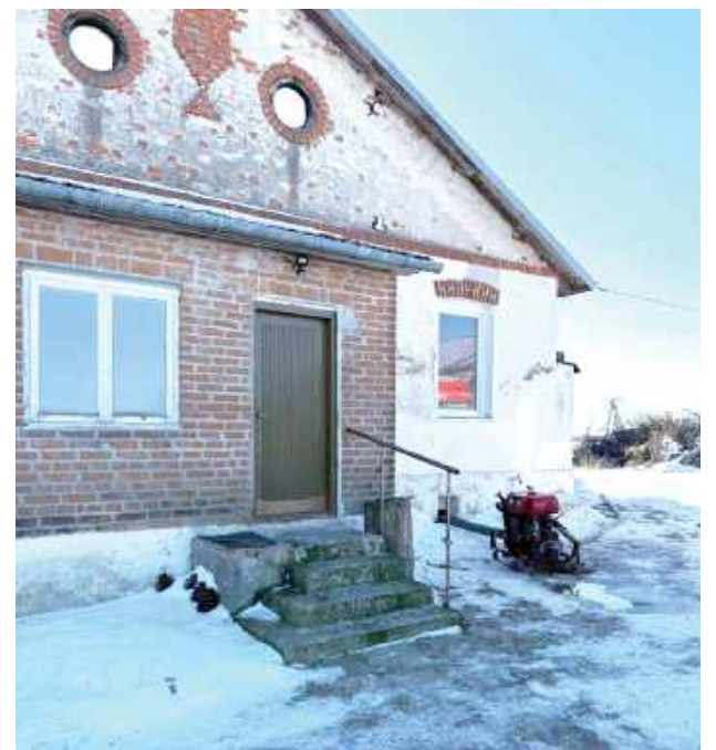
GR Do zdarzenia doszło na początku lutego

Oprócz nich interweniował zastęp OSP Paszenki.