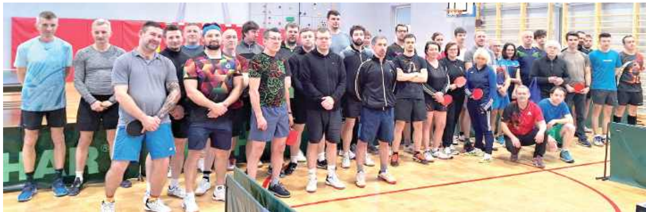
Pamiątkowe zdjęcie uczestników zmagania