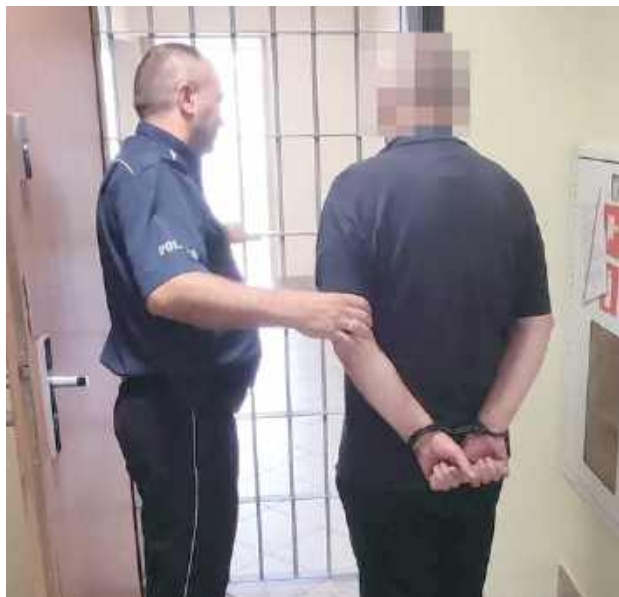
59-latek został zatrzymany w sierpniu

Funkcjonariusze zabezpieczyli niebezpieczny przedmiot, oraz potwierdzili, że 59-latek mieszkający w Radzynie kierował groźbą zabójstwa wobec swojego 36-letniego sąsiada trzymającego w ręku wiatrówkę, przypominającą replikę znanej marki broni.