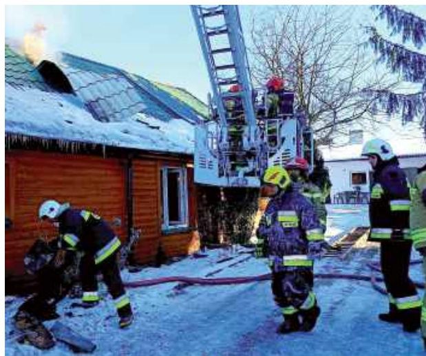
W pożarze drewnianego budynku mieszkalnego w Janowie Podlaskim brało udział 11 zastępów Państwowej i Ochotniczej Straży Pożarnej w sile 32 strażaków, w tym mundurowi z OSP KSRG Janów Podlaski oraz zespół ratownictwa medycznego. Temperatura powietrza wynosiła – 18 st. C