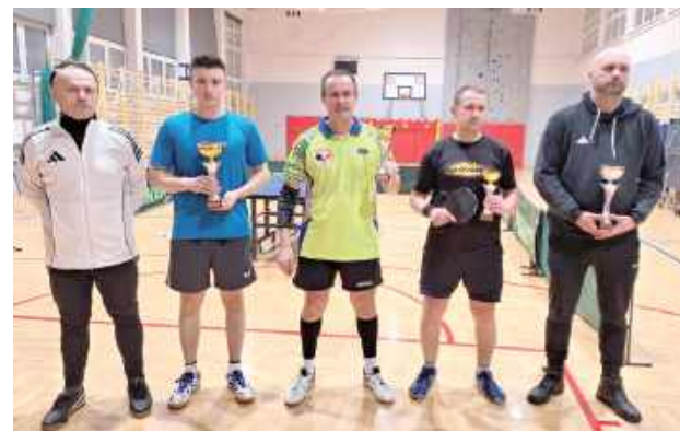
Najlepsi zawodnicy zmagania przy stołach tenisowych