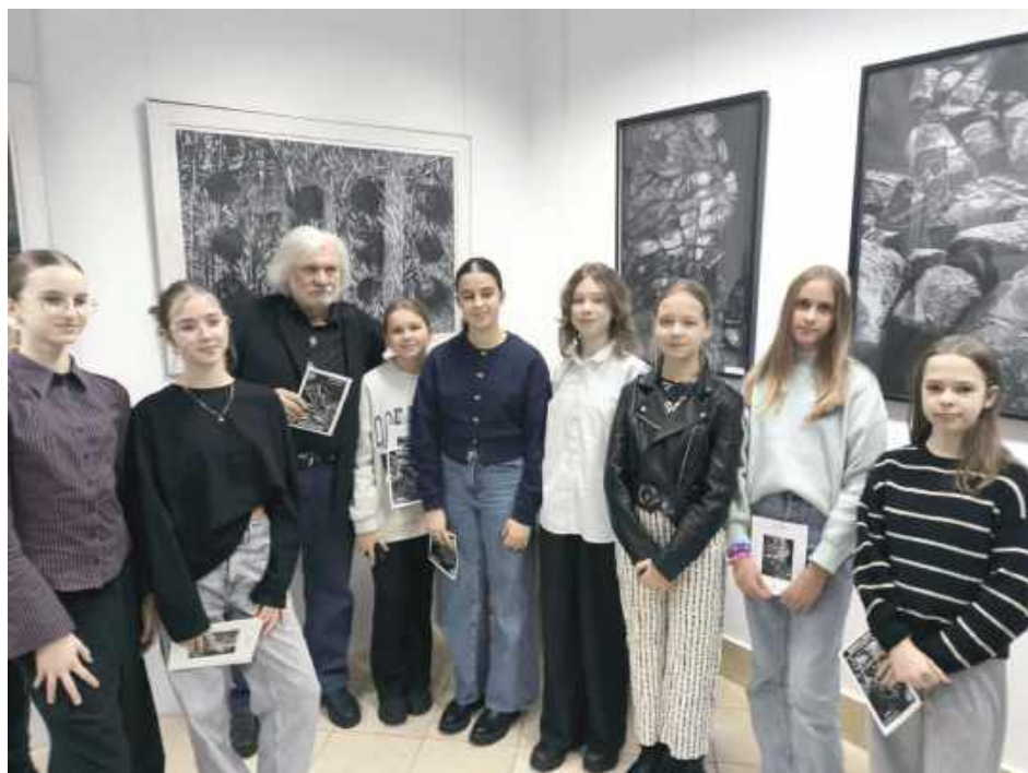
Uczniowie podziwiali wystawę grafik

- Wystawa stała się dla młodych odbiorców przestrzenią do bezpośredniego kontaktu ze sztuką oraz inspiracją do własnych poszukiwań artystycznych. Udział w wernisazu miał na celu rozwijanie wrażliwości estetycznej, kształtowanie umiejętności świadomego odbioru sztuki