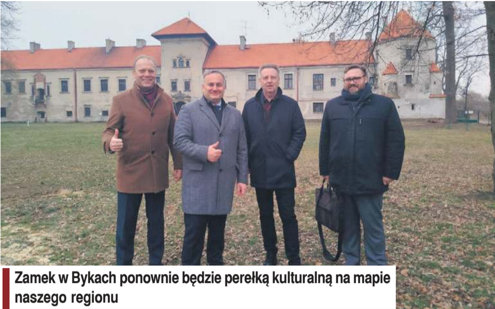
Zamek w Bykach ponownie będzie perełką kulturalną na mapie naszego regionu