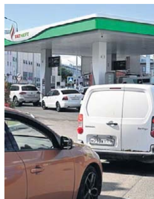
Kolejka na stacji benzynowej w Kazaniu

W Rosji, w wyniku ukraińskich ataków na rafinerie i in-