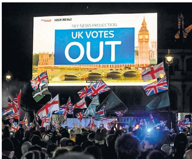
23 czerwca 2016 roku w Wielkiej Brytanii odbyło się referendum w sprawie członkostwa w Unii Europejskiej

Referendum brexitowe spowodowało także polityczne trzęsienie ziemi na Wyspach Brytyjskich. Do dymisji podał