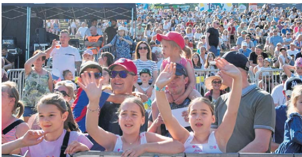
Tak publiczność bawiła się pod sceną podczas poprzedniej edycji Truskawkobrania

Od godziny 15 uczestnicy będą mogli gromadzić się pod sceną. W sobotnim programie znalazł się występ zespołu GIS,