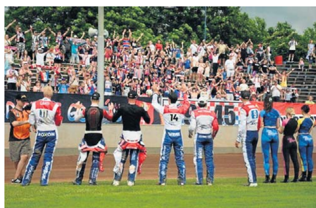
Żużlowcy Wybrzeża Gdańsk dziękują kibicom po zwycięstwie 58:32 ze Speedway'em Kraków

- Po siedmiu wyścigach prowadziliśmy jedynie czterema punktami, dlatego wiedzieliśmy, że musimy zachować pełną koncentrację i cierpliwie robić swoje. W drużynie nie było jednak nerwowości - byliśmy spokojni i pewni swoich umiejętności. Z biegiem zawodów wszystko zaczęło układać