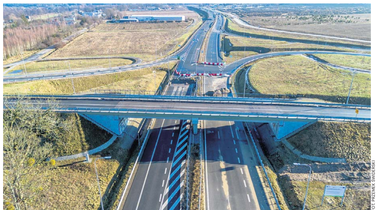
Trasa Kaszubska połączy Pomorze z Pomorzem Zachodnim nowoczesnym, wygodnym szlakiem

Wołodimir Zełenski nie przyjedzie do Gdańska na Konferencję Odbudowy Ukrainy. Na czele ukraińskiej delegacji stanie premier Julija Swyrydenko str. 8