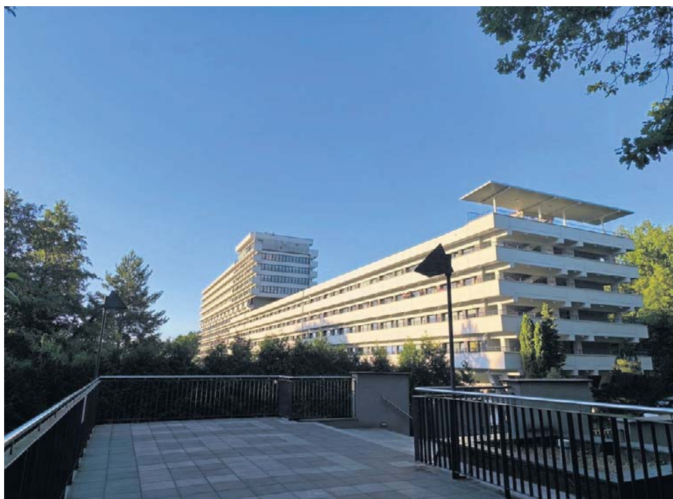
Jeśli zmagasz się z chorobą reumatyczną, odpowiednie sanatorium jest kluczowe

By wybrać najlepsze polskie sanatoria dla reumatyków, zebrałem listę do tych, które rze-