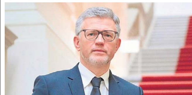
Melnyk wziął udział w posiedzeniu RB ONZ, które zostało zwołane po ostatnich atakach Rosji na Ukrainę