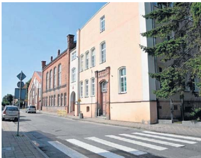
W tej sprawie są dwie wersje: rodzica ucznia i dyrekcji szkoły. Bardzo się od siebie różnią

- W środkach masowego przekazu ukazało się, że szkoła