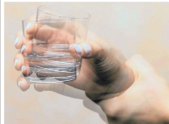
Drżenie rąk to objaw m.in. choroby Minora. Nie ma na nią lekarstwa, ale można sobie pomóc

Drżenie rąk może też być chorobą samą w sobie. To tzw. choroba Minora, czyli drżenie samoistne obejmujące najczęściej ręce, ale też twarz, wargi, język, całą głowę (ruchy jak przy potakiwaniu lub przeczeniu), a w zaawansowanym stadium także nogi.