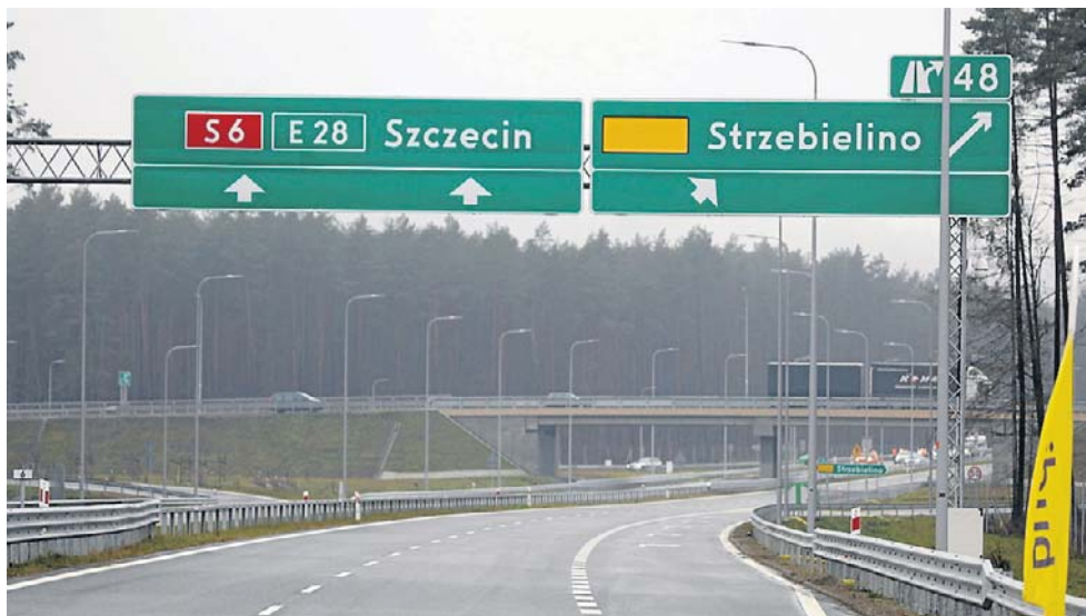
Trasa Kaszubska pozwoli pokonać trasę między Trójmiastem a Szczecinem w około 2,5 godziny.

Na piątek 26 czerwca, czyli tuż przed rozpoczęciem wakacyjnych wyjazdów, zaplanowano otwarcie około 40-kilometrowego odcinka drogi ekspresowej S6 pomiędzy miejscowością Leśnice a obwodnicą Słupska. Uruchomienie tego fragmentu