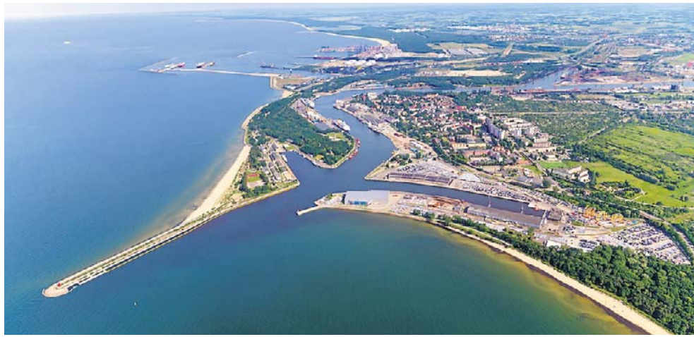
Port Gdańsk potrzebuje alternatywnego połączenia wyspy portowej z krajem

Wiceminister w przemówieniu wyliczył najważniejsze inwestycje realizowane w polskich portach morskich. Wiele