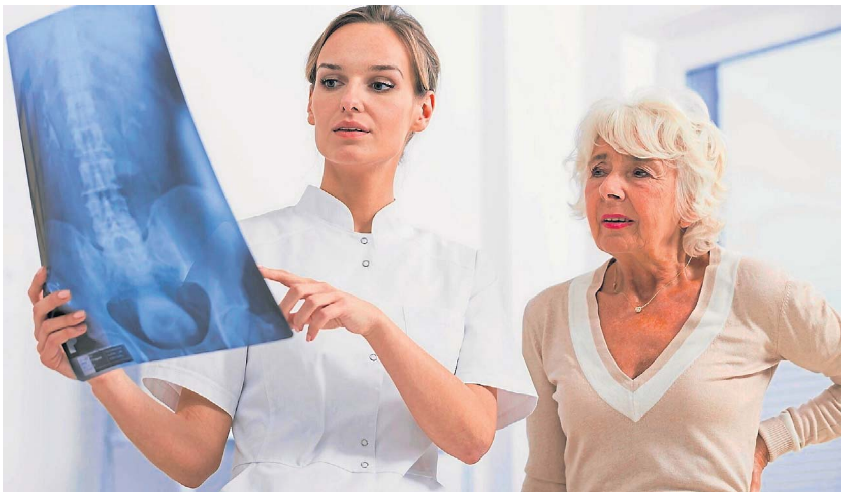
Osteoporozę można wykryć na wczesnym etapie rozwoju, co umożliwi jej skuteczniejsze leczenie i profilaktykę groźnych złamań

Przy postępującej osteoporozie dochodzi do kurczenia się ciała, tj. zmniejszenia się wzrostu. Choć zjawisko to zachodzi naturalnie z wiekiem, znaczne zmiany mogą wskazywać na złamania kompresyjne kręgow. Zwykle towarzyszy im ból w miejscu urazu, choć nie zawsze tak jest, a dolegliwości bólowe często zmniejszają się z czasem. Zaawansowana osteoporoza prowadzi do złamań kompresyjnych nawet kilku kręgow naraz,