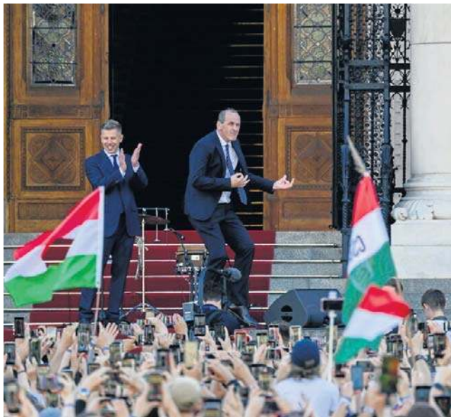
W przemówieniu po wyborze na premiera Peter Magyar podkreślił, że będzie Węgom służyć, a nie nimi rządzić

W przemówieniu po wyborze na premiera Peter Magyar podkreślił, że będzie Węgom służyć, a nie nimi rządzić. Po złożeniu przysięgi Magyar zobowiązał się do pracy „z wiarą, wolą i miłością do ojczyzny”, aby sprostac przykładowi przodków,