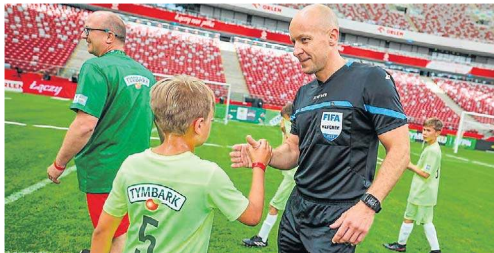
Sędzia FIFA Szymon Marciniak z chęcią prowadzi mecze Pucharu Tymbark

Od 2023 roku Puchar Tymbark i jego uczestnicy są oficjalnym partnerem piłkarskiej reprezentacji Polski, a mecze finałowe odbywają się przed meczami kadry.