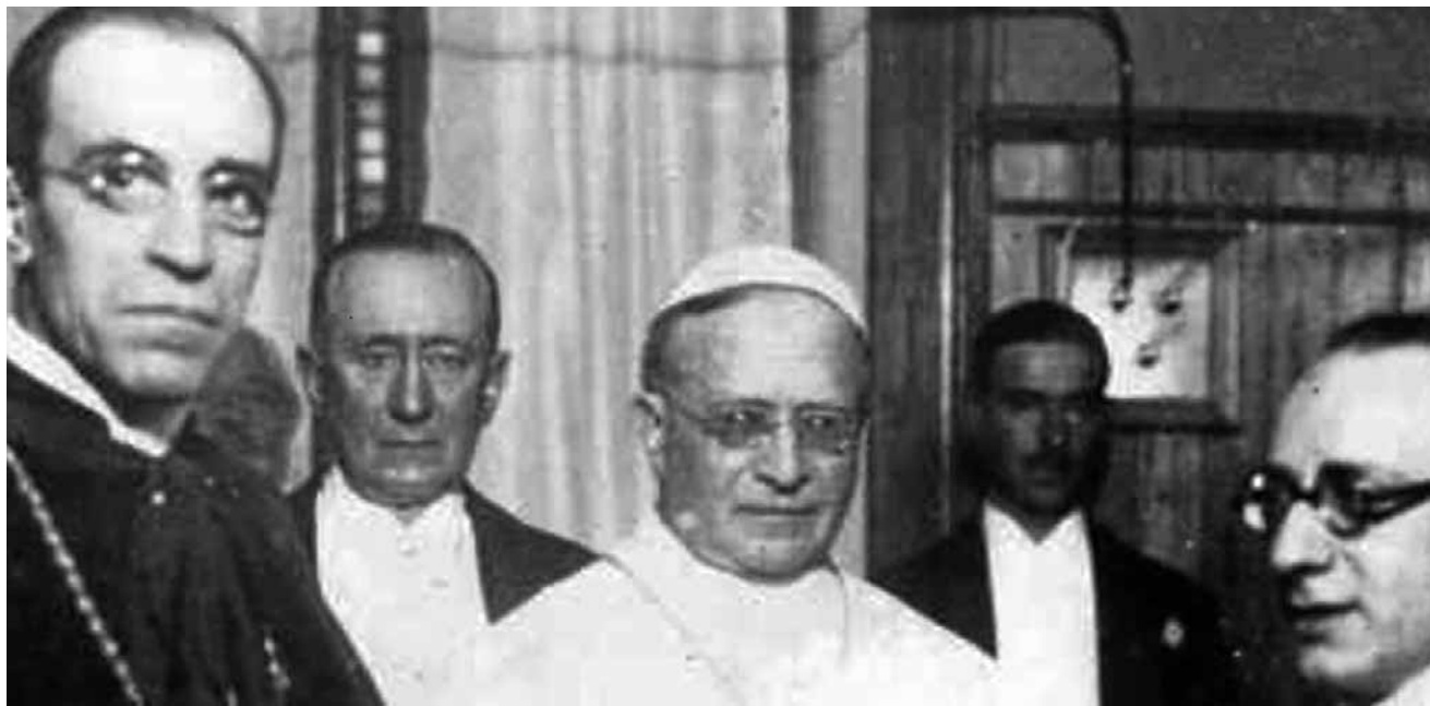
18 maja 1937 roku arcybiskup Chicago, podczas zamkniętego spotkania ze swoimi księżmi, wygłosił niezwykle ostre przemówienie wymierzone w Adolfa Hitlera

1. „W nawiązaniu do przekazanej mi informacji o prze-