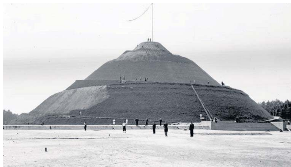
Po śmierci marszałka Józefa Piłsudskiego postanowiono kopiec nazwać jego imieniem. Sypanie zakończono 9 lipca 1937 r.