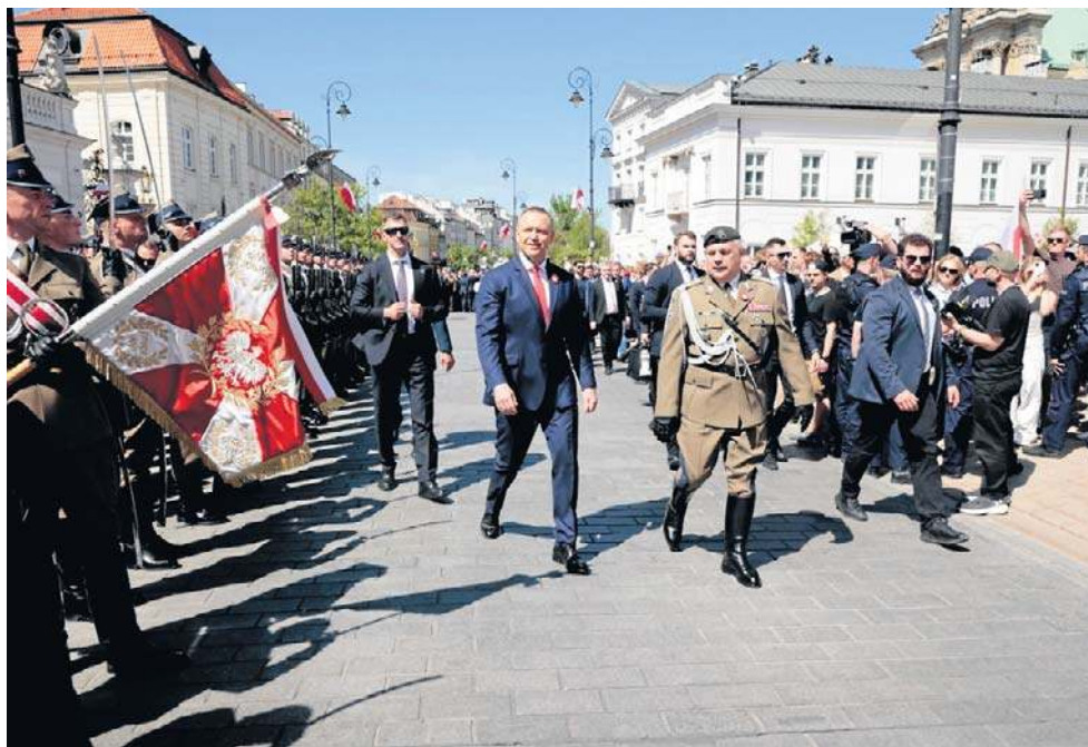
Inicjatywy, z którymi wychodzi Karol Nawrocki są, bardzo głośne, ale ich realizacja jest najdelikatniej mówiąc, wątpliwa

cie się w Pałacu Prezydenckim, aby nie łamać obecnej Konstytucji” - napisał minister cyfryzacji, wicepremier Krzysztof Gawkowski.