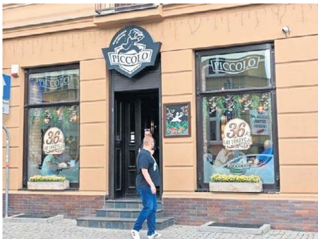
Pizzeria „Piccolo” od 36 lat serwuje ten sam kultowy zestaw: polską pizzę na grubym cieście i barszczyk