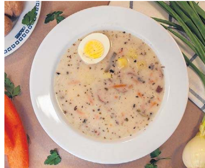
Żurek i inne zupy, placki ziemniaczane, pierogi, tradycyjne drugie dania obiadowe – to nadal w swojej ofercie ma społemowski bar „Małgoška”. Działa od ponad 60 lat