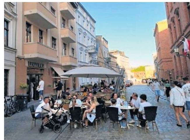
Lody od Lenkiewicza od dekad przyciągają tłumy. Tu kawiarnia przy ul. Wielkie Garbary