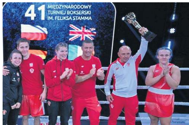
Reprezentacja Polski w boksie olimpijskim okazała się bezkonkurencyjna w 41. Memoriale Feliksa Stamma