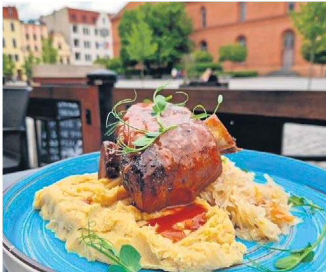
Golonka, ale też wątróbka i wielki schabowy to sztandarowe dania „Gospody Pod Modrym Fartuchem”. To jedna z najstarszych tego typu karczem w Europie

Od tych najstarszych lokali gastronomicznych w Toruniu, co zrozumiale, najwięcej się