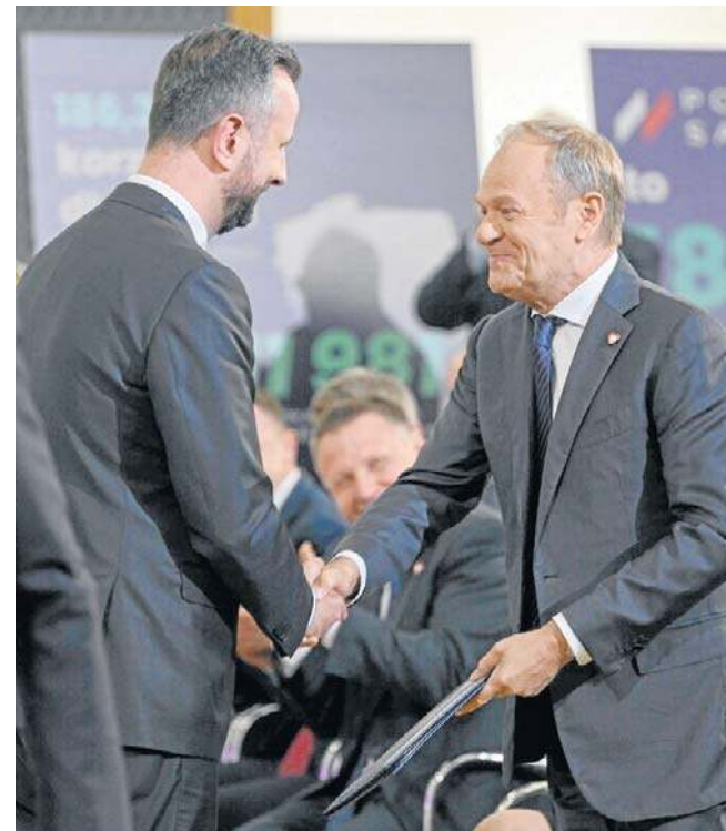
W piątek podpisano umowę dotyczącą SAFE. Podpisy złożyli przedstawiciele polskiego rządu i Komisji Europejskiej

Jest dokładnie odwrotnie. Dzięki SAFE oszczędzimy pieniądze, które wydawać będziemy na sprzęt koreański czy amerykański, np. na kolejne samoloty F35. Natomiast jesteśmy w bardzo trudnej, międzynarodowej, rzeczywistości