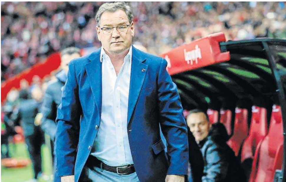
Najbliższe zgrupowanie kadry powinno być poligonem doświadczalnym dla Jana Urbana

Trzy dni po spotkaniu z Ukrainą Biało-Czerwoni za-