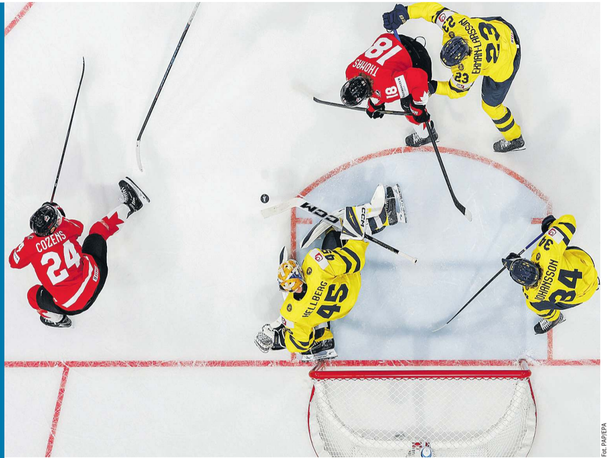
Kanadyjczycy spełnili swoje obowiązki.