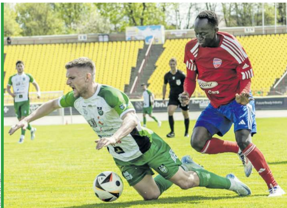
Starcia ROW-u z Rakowem II w ostatnich sezonach obfitowały w emocje.

■ GKS Jastrzębie - Rekord Bielsko-Biała 0:3 (wo)