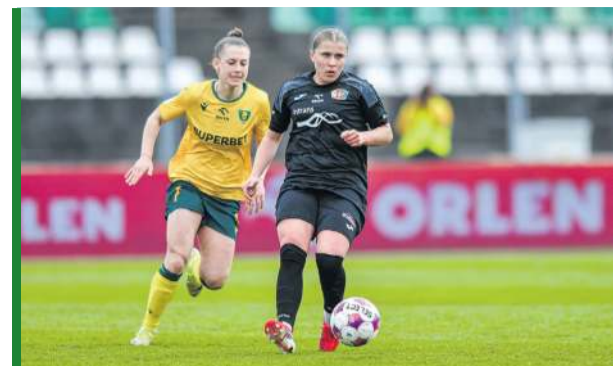
Nieco ponad miesiąc temu GieKSa grała z Czarnymi w Lidze...