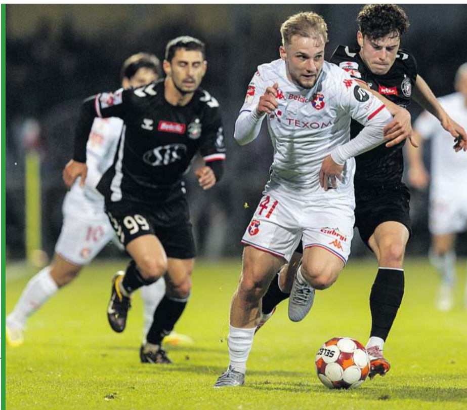
Wiślacy postanowili kończyć wygrany sezon na najwyższych obrotach.

1-2 - awans, 3-6 - baraże, 16-18 - spadek