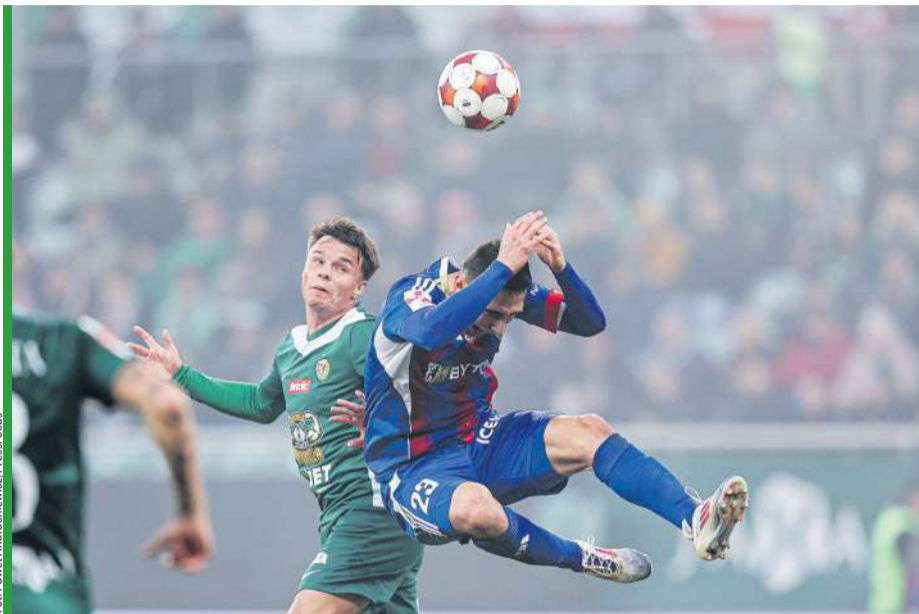
Efektownych scen w jesiennym meczu Polonii i Śląska nie brakowało. Bytomianie to jedyna w 1. lidze ekipa, która wygrała w tym sezonie we Wrocławiu!