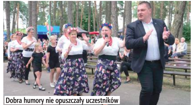
Dobra humory nie opuszczały uczestników