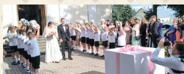
Zakochani znajdują się od przedszkola. Sympatia zaczęła się od spotkań na Orliku, a finałem są obrączki i miłość do końca życia