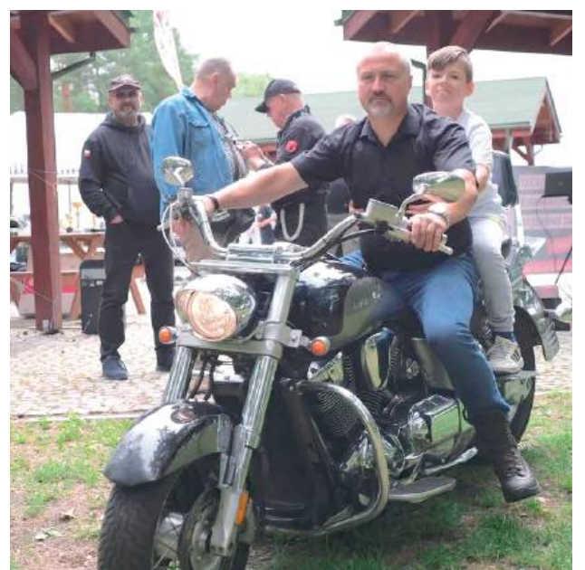
Motoweterani wsparli wydarzenie, oferując m.in. krótką przejażdżkę