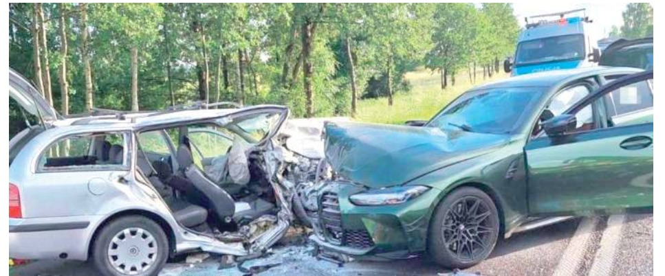
Dramat rozegrał się 1 czerwca 2024 roku około godziny 18 w Radzynie Podlaskim

Sledztwo ws. wypadku wszczęła Prokuratura Rejonowa w Radzynie. - Postawiliśmy kierowcy zarzut spowodowania wypadku ze skutkiem śmiertelnym. Mężczyzna przyznał się do winy, zastosowaliśmy wobec niego dozór policji, zakaz opuszczenia kraju oraz poręczenie majątkowe w kwocie 15 tysięcy