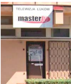
Koncesja będzie obowiązywała do 2035 roku

Lokalna stacja telewizyjna z Łukowa otrzymała koncesję na nadawanie swojego programu na terenie całego kraju. Decyzję w tej sprawie podjęła Krajowa Rada Radiofonii i Telewizji w Warszawie. To ważne wydarzenie dla lokalnej stacji, która przez lata była dostępna tylko w wybranych miastach regionu.