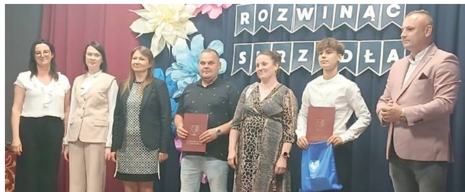
35 uczniów ze Szkoły Podstawowej w Stoczku Łukowskim otrzymało Stypendium Burmistrza Miasta