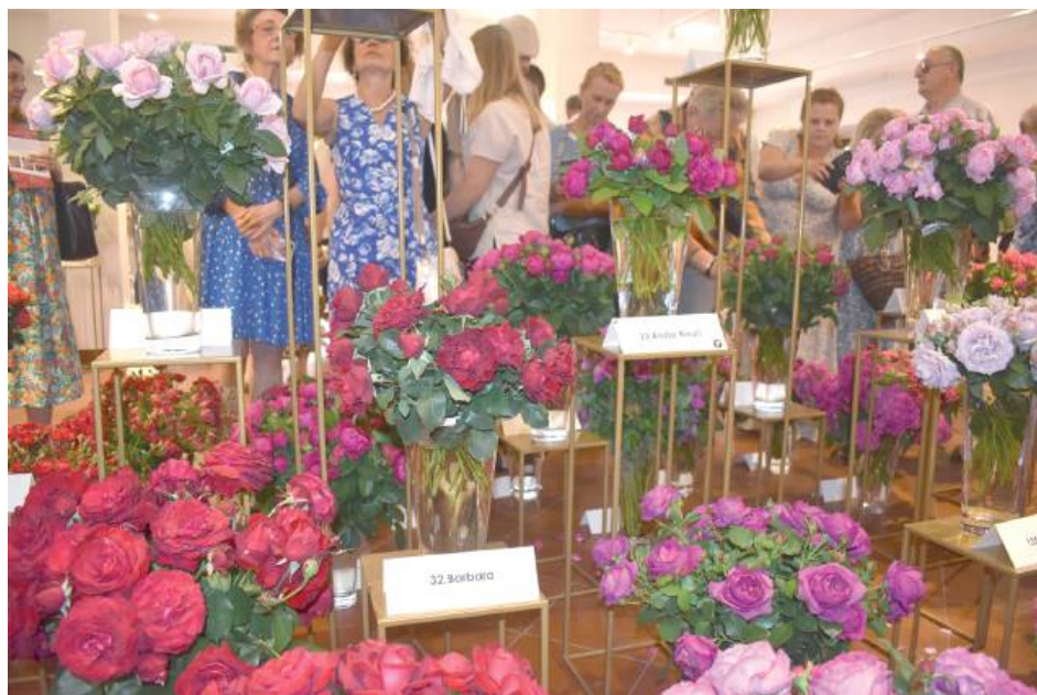
Wystawa róż w ratuszu cieszyła się ogromnym zainteresowaniem

A wiele okazów można było zakupić bezpośrednio od producentów na kiermaszu na placu przed ratuszem i mieć je w własnym ogrodzie.