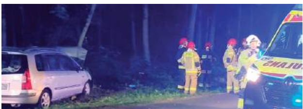
Autem podróżowała kobieta z trójką dzieci

W niedzielę, 6 lipca, o godzinie 21.18 do straży pożarnej wpłynęło zgłoszenie o zderzeniu samochodu osobowego z łosiem na drodze wojewódzkiej DW 808 w Nowinkach.