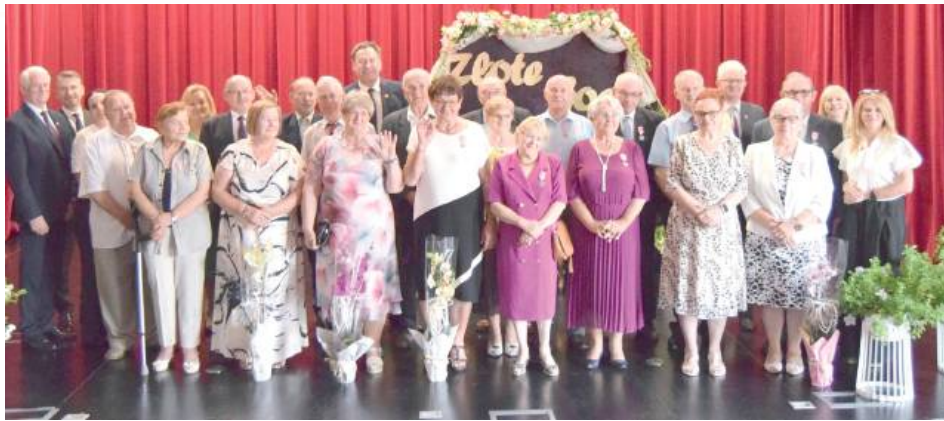
13 par z gminy Stoczek Łukowski świętowało jubileusz 50-lecia pożycia małżeńskiego