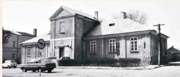
Nie udało nam się ustalić, w jaki sposób ojcowie pijarzy w Łukowie realizowali obowiązek zakwaterowania stypendystów Izdebskich. Dość prawdopodobne jest, że i oni przemieszkowali gdzieś kątkiem w konwikcie Szaniawskich

Wspomniany wcześniej zapis o podziale środków w razie likwidacji zgromadzenia pijarskiego stał się u schyłku XIX wieku przedmiotem sporów sądowych. Fundator zastrzegł, żeby w razie, gdyby pijarów spotkał taki los jak jezuitów, połowa majątku wróciła do rodziny, a połowa została