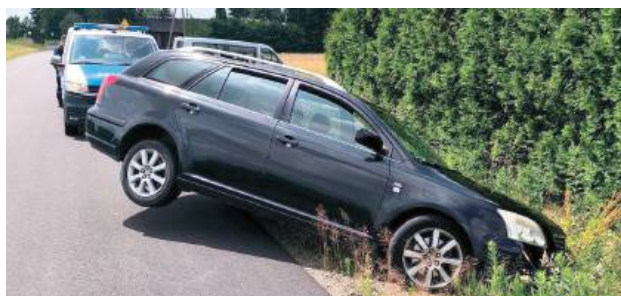
Kierowca osobowej Toyoty na terenie gminy Puławy wjechał do rowu, następnie wytoczył się z samochodu i schował się w krzakach. Myślał, że w ten sposób uniknie konsekwencji za jazdę pod wpływem alkoholu. Wydmuchał trzy promile

W takim stanie za kierownicą usiedli mieszkańcy powiatu puławskiego i zwoleńskiego. Jeden kierował Toyotą, drugi Hondą. W ręce policji wpadli jednego dnia.