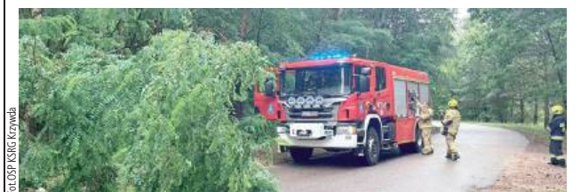
Do akcji została zadysponowana jednostka OSP KSRG z Krzywdy

9 lipca o godz. 8.30 straż pożarna została zaalarmowana o utrudnieniach na drodze w miejscowości Kożuchówka.