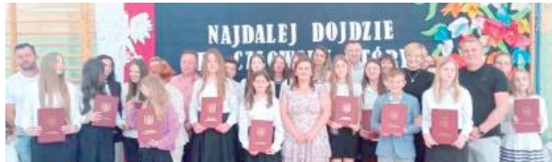
Aż 74 uczniów szkół podstawowych z terenu gminy Wola Mysłowska odebrało Stypendia Wójta

Żeby zdobyć stypendium naukowe, trzeba było uzyskać średnią co najmniej 5,0 w klasach IV-VI albo 4,75 w klasach VII-VIII.