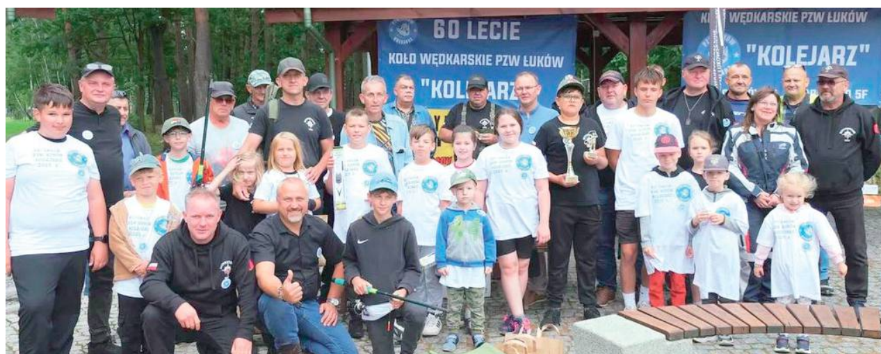
Młodzi uczestnicy byli zadowoleni z wyników i nagród

Osiem godzin trwał piknik nad Zimną wodą, zorganizowany 12 lipca pod szyldem Koła PZW Łuków „Kolarz”. Świętowali sześćdziesiąt lat działalności tej organizacji. Już od godziny 8.30 przy wiatkach grillowych zaczęły się gromadzić rodziny, gotowe spróbować sił w łowieniu ryb oraz dołączyć do motocyklowej przygody w towarzystwie Motoweteranów Łuków.