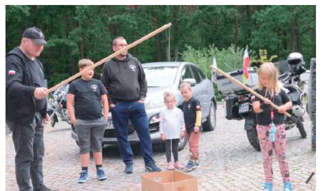
Zawodom towarzyszyły zabawy i atrakcje