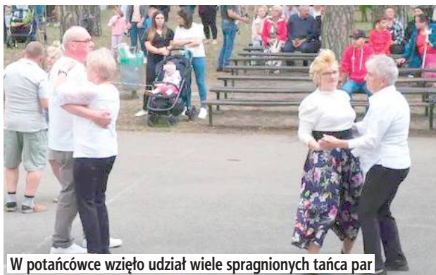
W potańcówce wzięło udział wiele spragnionych tańca par

Organizatorami wydarzenia były Gmina Krzywda, OSP Podosie oraz Koła Gospodyń Wiejskich z Huty Dąbrowy i Podosia, które zadbały o sprawną organizację wszystkich atrakcji. Sprzyjająca let-