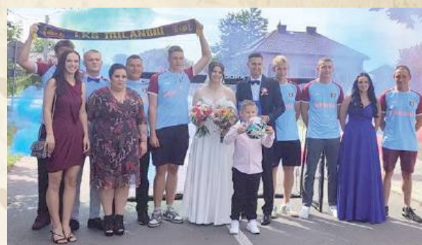
Nie mogło obyć się bez tradycyjnej „bramy”