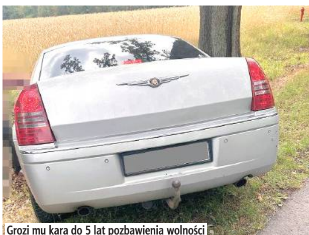
Grozi mu kara do 5 lat pozbawienia wolności

- Międzyrzecy kryminalni w trakcie pełnionej służby zwrócili uwagę na Chryslera, którego kierowca nie trzymał toru jazdy. Z uwagi na podejrzenie, że mężczyzna może znajdować się na „podwójnym gazie”, natychmiast ruszyli w pościg, dając kierowcy sygnały świetlne i dźwiękowe do zatrzymania. Jednak kierowca osobówki ani myślał zatrzymać się. Przyspieszył, kontynuując jazdę. Po chwili stracił panowanie nad autem. Zjechał