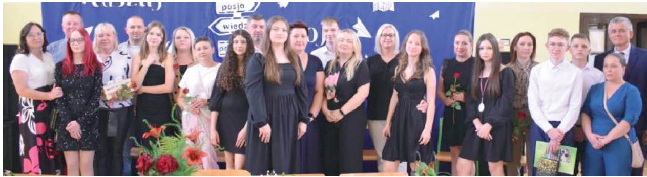
Uczniowie SP w Starej Prawdzie osiągnęli najlepsze wyniki egzaminu ósmoklasisty w całym powiecie łukowskim!

GMINA STOCZEK ŁUKOWSKI: Uczniowie Szkoły Podstawowej w Starej Prawdzie osiągnęli najlepsze wyniki egzaminu ósmoklasisty w całym powiecie łukowskim! W każdej z trzech części egzaminu – języku polskim, matematyce i języku angielskim – ich średnie znacznie przewyższyły średnie powiatowe.