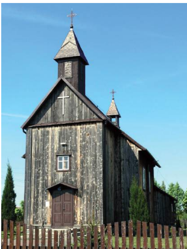
Zabytkowa kaplica w Zakępiu przejdzie remont

1. Remont i konserwacja budynku: uzupełnienie i wymiana obróbek blacharskich, rynien i rur spustowych, oczyszczenie i impregnacja więźby dachowej, wymiana elementów konstrukcyjnych sygnaturki i wieżyczki nad chórem, oczyszczenie z zabrudzeń i starych powłok ścian zewnętrznych oraz elementów dekoracyjnych, wymiana drzwi wejściowych i przedsińkowych, odtworzenie detali architektonicznych na elewacji frontowej (nad drzwiami i oknami), impregnacja i zabezpieczenie drewnianych elementów elewacji.