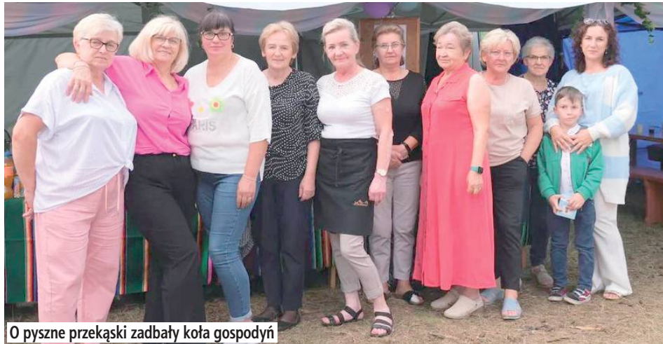
O pyszne przekąski zadbały koła gospodyń

Popisy taneczne dzieci i młodzieży, przygotowane przez grupy działające przy Gminnej Bibliotece Publicznej w Krzywdzie, przyciągały wielu widzów. Radosne układy pełne energii – odzwierciedlające młodzieńczą pasję – wypełniły scenę, stanowiąc preludium do głównych występów. W dalszej części wieczoru Klub Seniora „Życzenie” i formacja „Siódme Niebo” wzruszyły publiczność nostalgicznymi i melodyjnymi piosenkami, co podkreślało niepowtarzalny charakter tej imprezy.