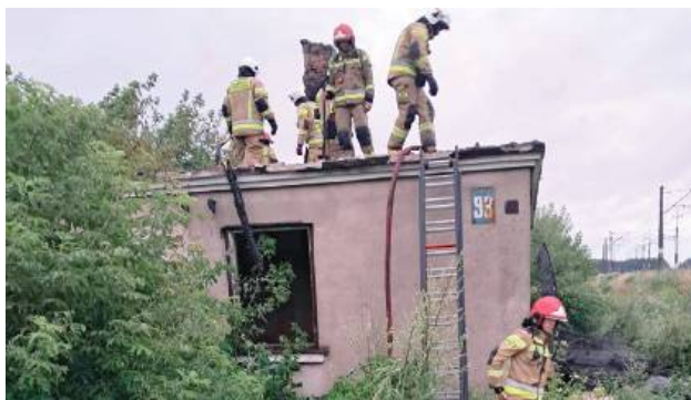
Pożar wybuchł 11 lipca około godziny 4 nad ranem

Działania straży rozpoczęły się o godzinie 4 rano. Na miejsce zadysponowano jednostki z JRG Łuków, OSP Jeleniec, OSP Stanin, OSP Tuchowicz oraz OSP Świderki. Strażacy zabezpieczyli teren zdarzenia i podali dwa