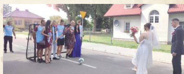
Zakochani musieli strzelać rzuty karne