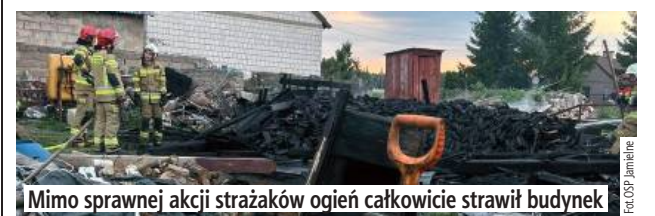
Mimo sprawniej akcji strażaków ogień całkowicie strawił budynek

W niedzielę, 6 lipca wybuchła pożar budynku gospodarczego w miejscowości Jagodne.