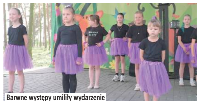
Barwne występy umiliły wydarzenie