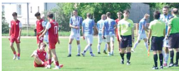
Na kibiców czeka aż 21 pasjonujących spotkań, które zainaugurują tegoroczne rozgrywki w regionie

Start Gózd - ŁKS Łazy Unia Krzywda - Orkan Wojcieszaków Olimpia Okrzeja - Sokół Adamów Janovia Janów Podlaski - KS Drelów Bizon Jeleniec - Dwernicki Stoczek Łukowski Agrosport Leśna Podlaska - Victoria Parczew Bystrzyca Borki - AZ-BUD I Komarówka Podlaska Armata Stoczek Łukowski - Orłęta II Radzyń Podlaski Lesovia Trzebieszów - Kujawiak Stanin Podlasie II Biała Podlaska - Orzeł Czemierniki Niwa Łomazy - Grom Kąkolwnica Polesie Serokomla - Absolwent Domaszewnica Bór Dąbie - Orłęta Gołyszyn Gręzovia Gręzówka - Bad Boys Zastawie Podlasie Biała Podlaska U-17 - Red Sielczyk