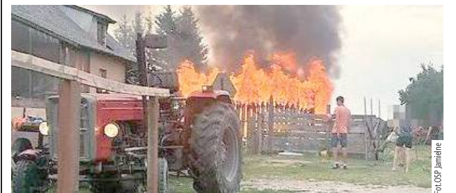
Zgłoszenie o pożarze do Stanowiska Kierowania KP PSP w Łukowie wpłynęło 6 lipca o godzinie 19.23