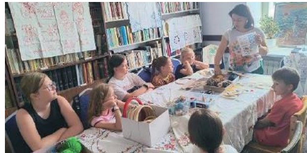
Warsztaty z haftu w Muzeum Regionalnym

Muzeum Regionalne w Łukowie przygotowało na tegoroczne lato warsztaty plastyczne i rękodzielnicze oraz rzeźbiarskie dla dzieci i młodzieży.