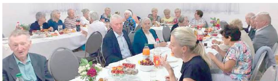
Spotkanie było również okazją do zacieśnienia więzi sąsiedzkich i wymiany doświadczeń

GMINA ŁUKÓW: W sobotnie popołudnie, 28 czerwca Koło Gospodyń Wiejskich „Stokrotki” w Aleksandrowie przygotowało już drugie spotkanie dla seniorów w ramach programu Danie Wspólnych Chwil z Fundacją Biedronki.