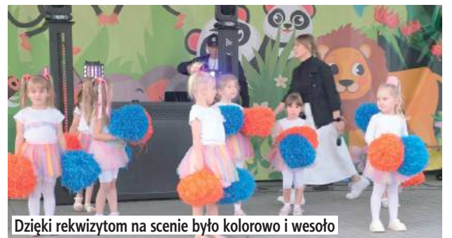
Dzięki rekwizytm na scenie było kolorowo i wesoło