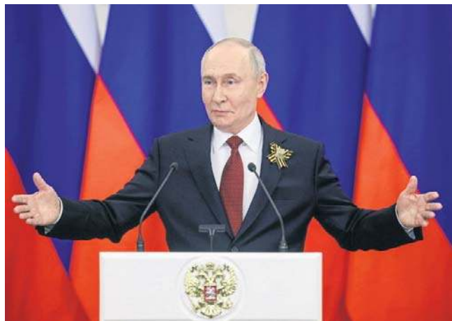
Putin powiedział, że jego zdaniem „specjalna operacja wojskowa”, czyli wojna w Ukrainie, ma się ku końcowi

Rosyjski dyktator został także zapytany o możliwość negocjacji z Europą. Tu wskazał na potencjalnego mediatora - miałby nim być były kanclerz Niemiec Gerhard Schröder.