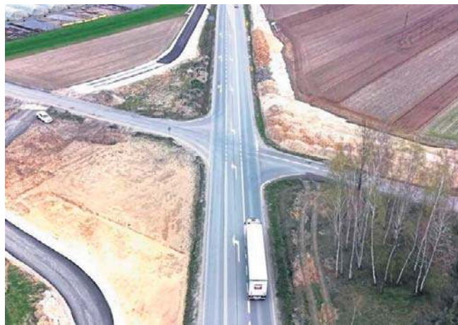
Wykonawcą zadania za kwotę ponad 98 mln zł jest firma Duna Polska, która zakończy prace w 2027 roku.