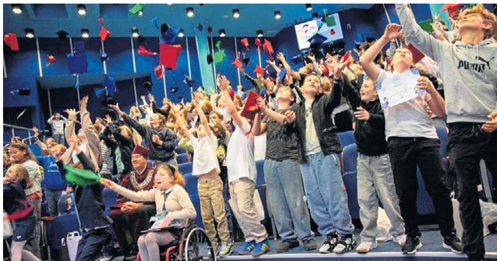
Dzieci Politechniki Opolska od 18 lat pokazuje najmłodszym mieszkańcom regionu, że nauka może być fascynującą przygodą.

Finałowy wykład pt. „Super Menedżer: zostań mistrzem zarządzania” poprowadziła dr