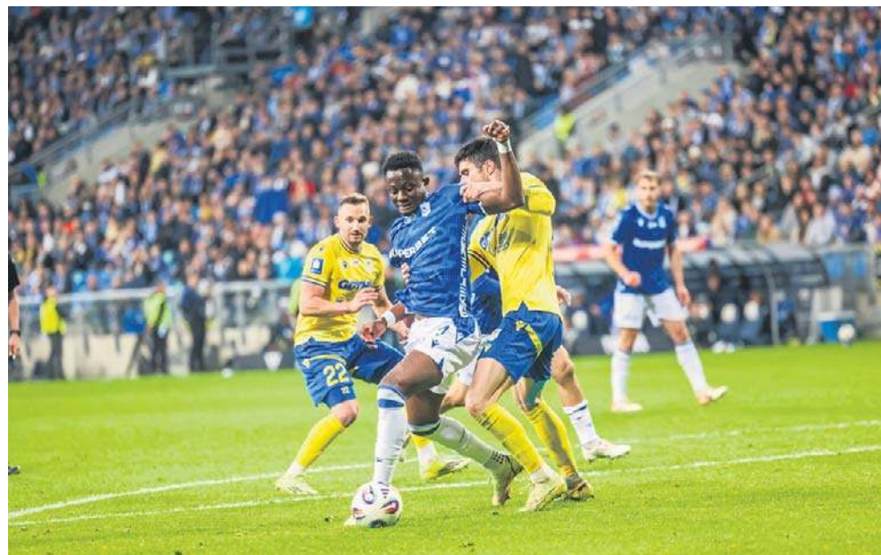
Przewodzący tabeli Lech niespodziewanie tylko zremisował z zagrożoną spadkiem Arką

Niebywały przebieg miał drugi piątkowy mecz. Przewodzący tabeli Lech Poznań dopingowany przez rekordową liczbę widzów (ponad 41 tysięcy) niespodziewanie tylko zremisował z zajmującą miejsce w strefie spadkowej Arką Gdynia. Trudno racjonalnie wytłumaczyć ten rezultat, skoro faworyt miał przytłaczającą przewagę, która przejawiała się przez 25 oddanych strzałów i aż 80