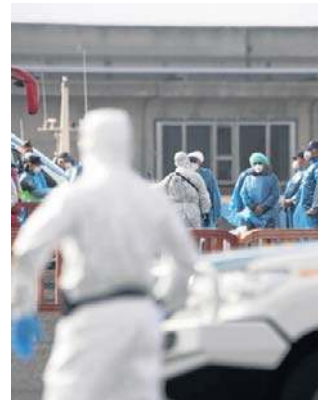
Pierwszego statku opuścili Hiszpanie

Na statku należącym do holenderskiej firmy Oceanwide Expeditions znajduje się około 150 osób z ponad 20 krajów. Proces zejścia na ląd będzie nadzorowany przez trzech hiszpańskich ministrów, w tym minister zdrowia Monikę Garcíę i ministra spraw wewnętrznych Fernando Grande-Marlasque, a także szefa Światowej Organizacji Zdrowia (WHO) Tedrosa Adhanoma Ghebreyesusa. W nocy z soboty na niedzielę Garcia ponownie zapewniła, że