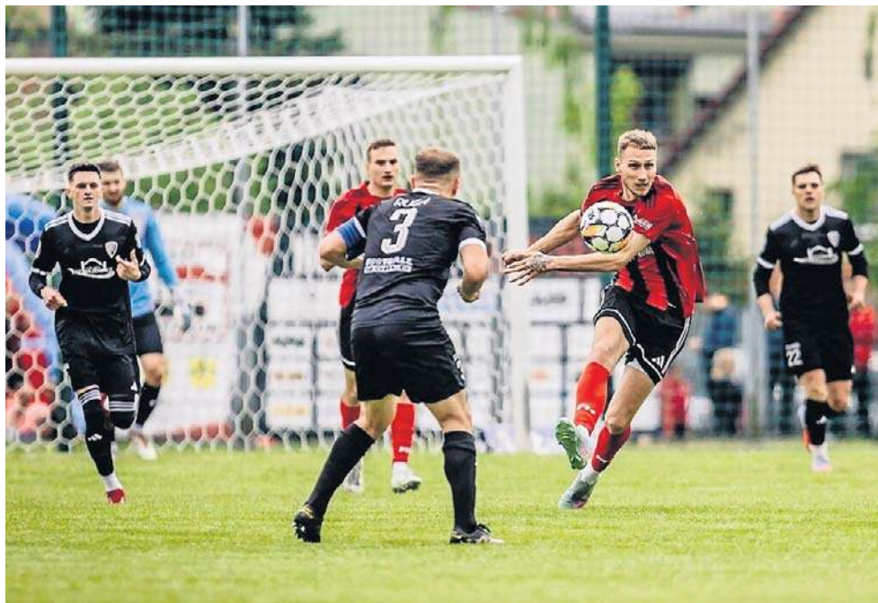
Start Namysłów nie był w stanie sprostać wiceliderowi tabeli - Ruchowi Zdzeszowice

Zamykająca podium Corotop Małapanew Ozimek ograła w sobie 2-0 Polonię Karłowice.