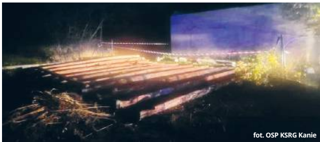
fol. OSP KSRG Kanie

● REGION Silny wiatr, który w czwartek wieczorem przeszedł nad regionem, powalił dużo drzew. Zerwał też dach z jednego z budynków we wsi Kanie i porwał blaszany garaż. Strażacy z powiatu chełmskiego i włodawskiego interweniowali w sumie 24 razy. Najgroźniejsze zdarzenie miało miejsce w Pobołowicach-Kolonii, gdzie konar drzewa spadł na samochód. Na szczęście nikt nie odniósł poważnych obrażeń.