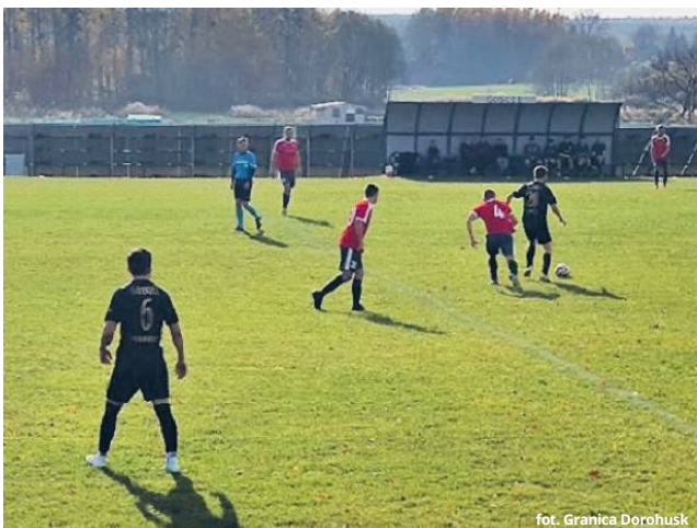
foto: Granica Dorohusk

- Miejsce lidera cieszy, tym bardziej że po spadku z ligi okręgowej praktycznie budowaliśmy zespół od początku.