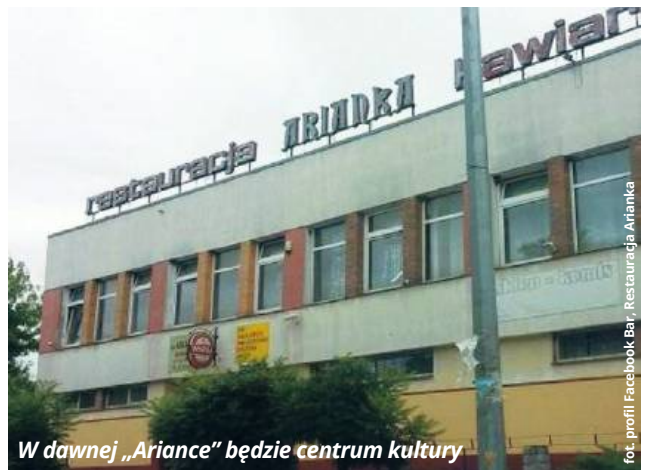
W dawnej „Ariance” będzie centrum kultury

aby w przyszłej nazwie zachować słowo „Arianka”. Władze uważają z kolei, że nazwa powinna zostać zbudowana wokół słowa „biblioteka”, ponieważ to na bazie tej instytucji utworzona zostanie w istocie nowa jednostka.