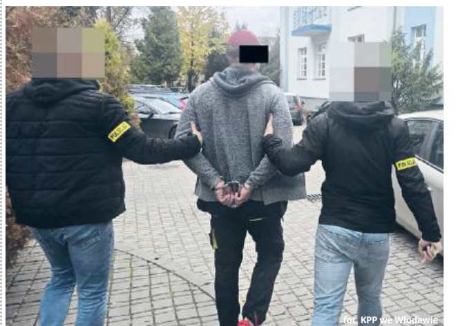
fol. KPP we Włodawie

● GM. WŁODAWA Włodawscy policjanci zatrzymali 39-letniego mieszkańca gminy Włodawa, który od miesiąca nękał swoją byłą partnerkę. Mężczyzna nachodził kobietę, wysyłał jej znieważające wiadomości, groził i wzbudzał w niej poczucie zagrożenia. Sąd Rejonowy we Włodawie, na wniosek policji i prokuratury, zastosował wobec niego tymczasowy areszt na trzy miesiące.