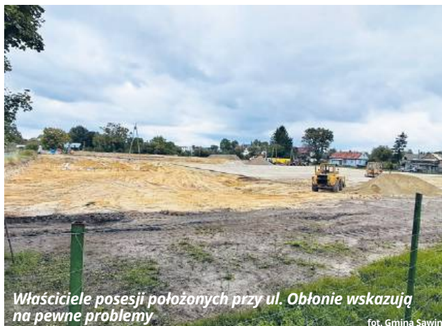
Właściciele posesji położonych przy ul. Obłonie wskazują na pewne problemy

- Chciałabym podkreślić, że dojazd do wskazanych posesji pozostał bez zmian. Prowadzone w pobliżu roboty budowlane nie obejmują swoim zasięgiem