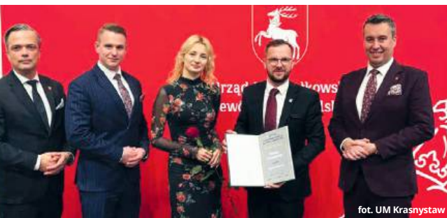
fol. UM Krasnostaw

produkt turystyczny województwa lubelskiego. Serdecznie dziękuję też za ofiarną pomoc wolontariuszom i współorganizatorom przy organizacji Dni Jakuba Wędrowczya. To tylko świadczy, że organizacja wydarzenia jest na bardzo wysokim poziomie i doceniana w całym województwie lubelskim i nie tylko - napisał w mediach spo-