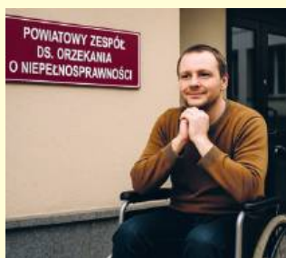
POWIATOWY ZESPÓŁ DS. ORZEKANIA O NIEPEŁNOSPRAWNOŚCI

- Orzekanie w Powiatowym Zespole ds. Orzekania o Niepełnosprawności zostało wstrzymane od listopada 2025 roku, o czym został poinformowany wojewoda lubelski pismem z dnia 15 października 2025 roku. Należy bowiem podkre-