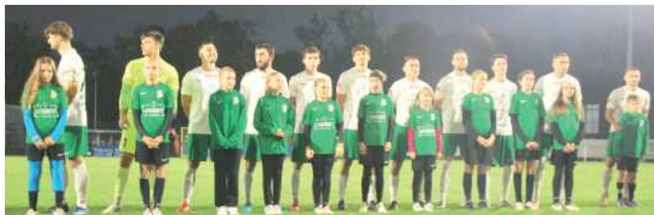
Piłkarze Podlasia nie mieli argumentów w meczu z Pogonią-Sokołem

Druga połowa nie przyniosła poprawy dla białczan. Pogoń nie zwalniała tempa, a w 60. minucie Majda wykorzystał błąd Jarosława Kosieradzkiego, zdobywając trzecią bramkę dla przyjezdnych.