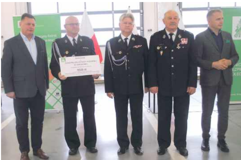
Dotacja dla OSP Serokomla