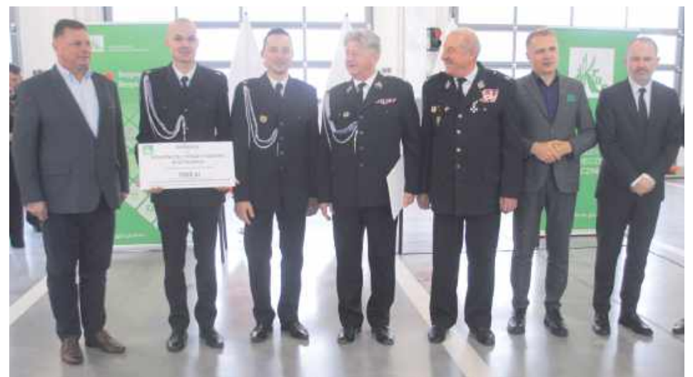
Dotacja dla OSP Szyszki