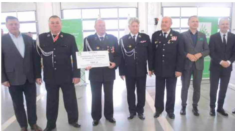
Dotacja dla OSP Popławy - Rogale