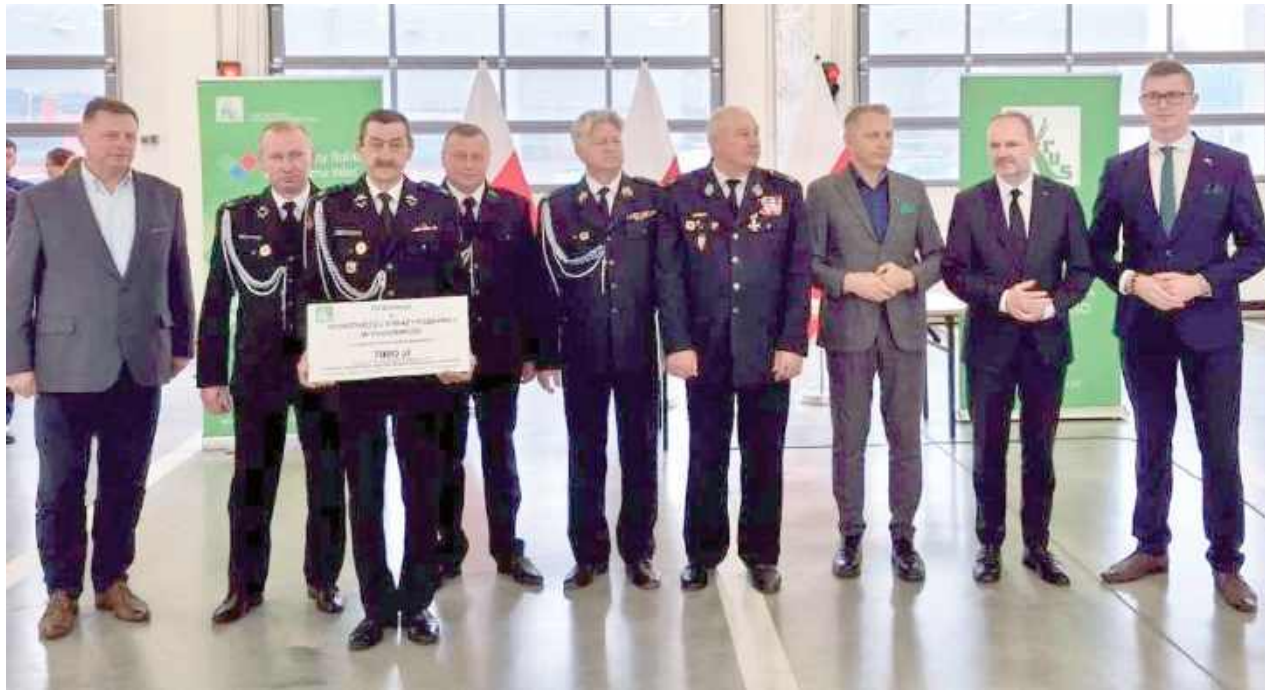
Środki w wysokości 7 tys. zł zostaną przeznaczone na zakup nowego sprzętu dla OSP KSRG Tuchowicz

Jednostki OSP otrzymują dofinansowania ze środków Funduszu Składkowego Ubezpieczenia Społecznego Rolników na zakup sprzętu, wyposażenia, umundurowania. Jak mówił prezes Zarządu Wojewódzkiego ZOSP RP Marian Starownik, około 90 proc. OSP działa na wsi, dlatego KRUS adresuje do nich