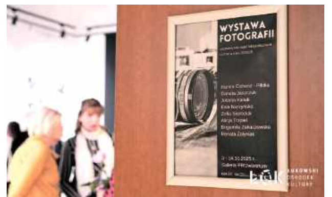
Wystawę można obejrzeć do 14 października 2025 r.

Ekspozycja obejmuje prace w trzech obszarach: portret, martwa natura oraz reportaży.