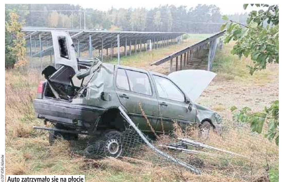
Auto zatrzymało się na płocie

pieczeniu miejsca zdarzenia oraz odłączeniu instalacji elektrycznej w podjeździe” - czytamy. Na miejscu interweniowały policja, pogotowie ratunkowe oraz OSP KSRG Adamów, OSP KSRG Krzywdy i JRG Łuków. Na miejscu występowały małe utrudnienia, ale szybko udało się je zniwelować.