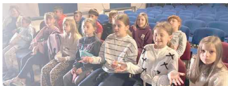
Po części edukacyjnej uczniowie obejrzeli film „Lars jest LOL”, który w piękny sposób opowiadał o akceptacji, empatii, tolerancji i sile przyjaźni

Temat spotkania brzmiał: „Sztuczna inteligencja. Sprzymierzeniec czy wróg?”.