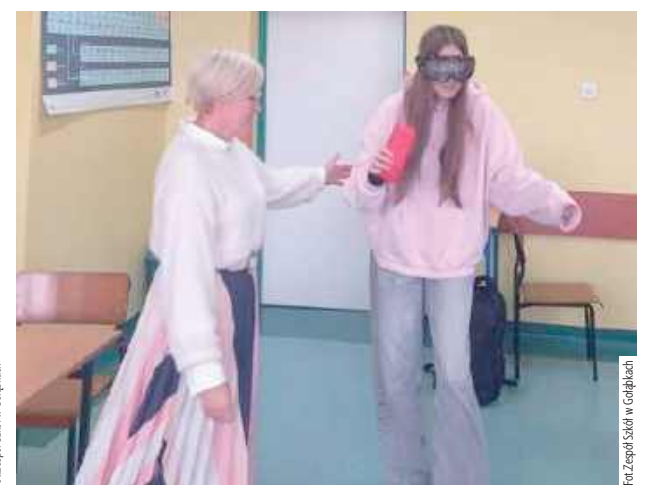
W czasie spotkania była możliwość przymierzenia narkogogli i alkogogli, specjalnych okularów symulujących efekty działania środków odurzających oraz alkoholu

kształcenia obrazu, a także problemy z oceną odległości i kierunków. Zajęcia miały na celu zwiększenie świadomości młodzieży na temat skutków