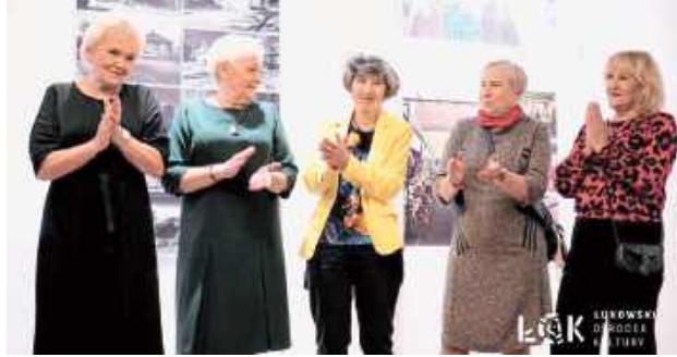
Wystawa jest efektem rocznej, regularnej działalności grupy fotograficznej, uczącej się pod przewodnictwem Bartosza Leśkiewicza