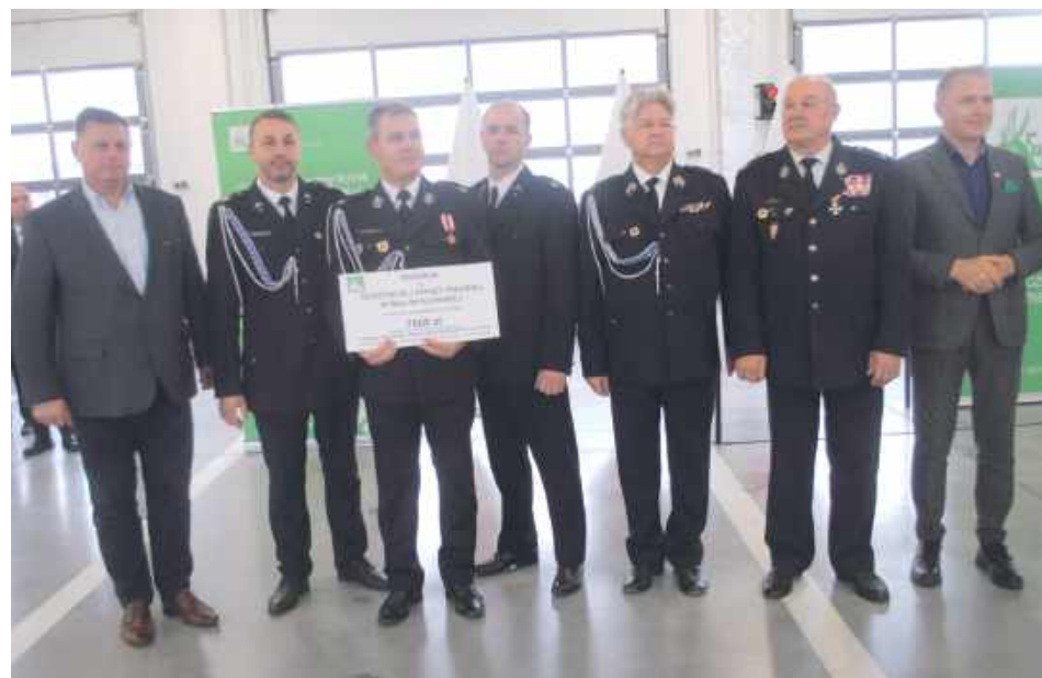
Dotacja dla OSP Wola Mysłowska