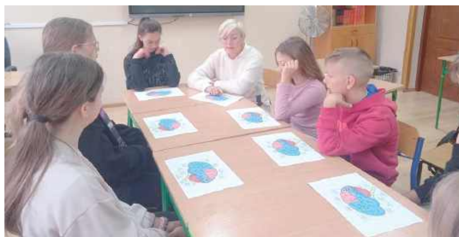
Podczas zajęć uczniowie zapoznali się z definicją uzależnień, ich rodzajami oraz skutkami zdrowotnymi i społecznymi

Ważnym elementem spotkania była możliwość przy-