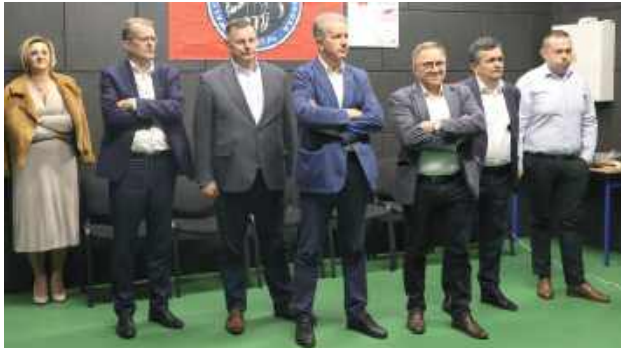
Podczas obrad omawiano bieżące sprawy związane z funkcjonowaniem powiatu, a także plany dalszego rozwoju infrastruktury sportowej

8 października odbyło się posiedzenie Zarządu Powiatu Łukowskiego. Spotkanie zorganizowano w Powiatowym Centrum Sportu w Radoryżu Smolany, gdzie mieści się nowoczesna Strzelnica Smolany, jeden z najlepiej wyposażonych obiektów strzeleckich w Polsce.