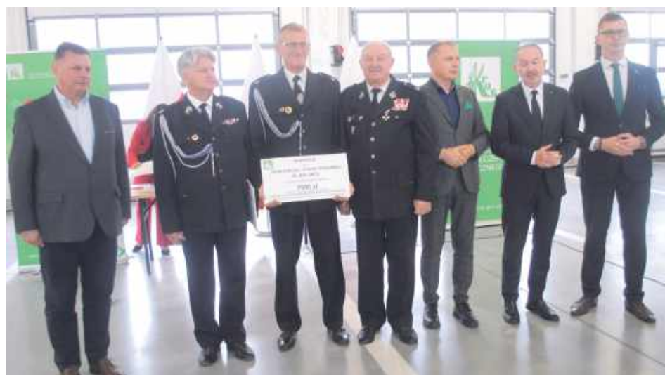
Dotacja dla OSP Jedlanka