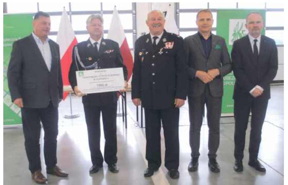
Dotacja dla OSP Zgórznica