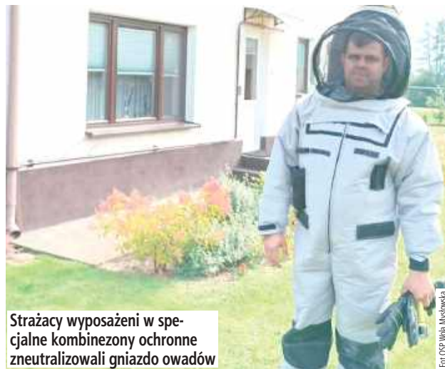
Strażacy wyposażeni w specjalne kombinezony ochronne zneutralizowali gniazdo owadów

W piątek, 3 października, o godzinie 13.00 strażacy z Ochotniczej Straży Pożarnej w Woli Mysławskiej zostali wezwani do interwencji w miejscowości Mysłów. Zgłoszenie dotyczyło usunięcia gniazda szerszeni znajdującego się na