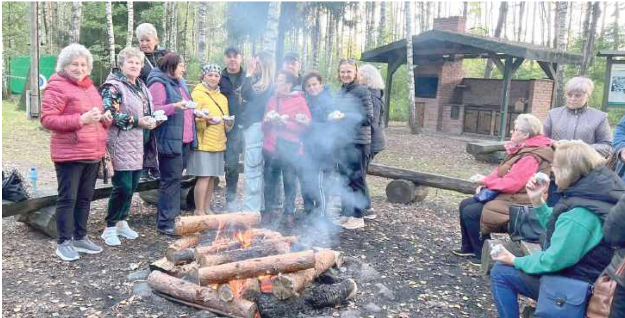
Przy ognisku były śmiechy, tańce, wspomnienia i ciepła atmosfera