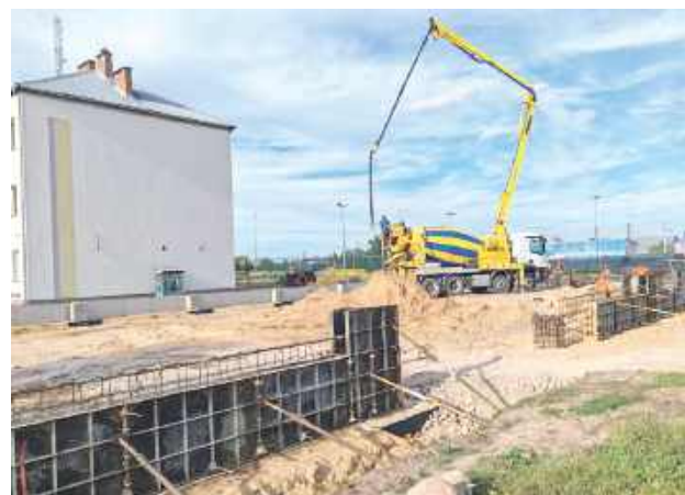
Gmina pozyskała dodatkowe dofinansowanie w wysokości 600 tys. zł w ramach rządowego programu „Olimpia - Program budowy przyszłolnych hal sportowych”