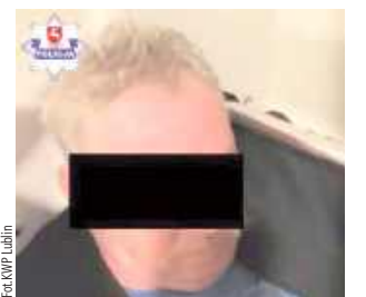
62-latek próbował ukryć się w szafie

„Łowcy głów” z Komendy Wojewódzkiej Policji w Lublinie odnaleźli 62-latkę poszukiwanego za włamanie. Mężczyzna próbował przechytrzyć policjantów i ukrył się w szafie.