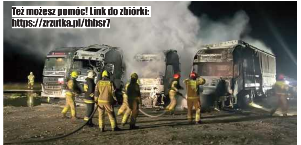
W pożarze zostały zniszczone wszystkie pojazdy należące do firmy