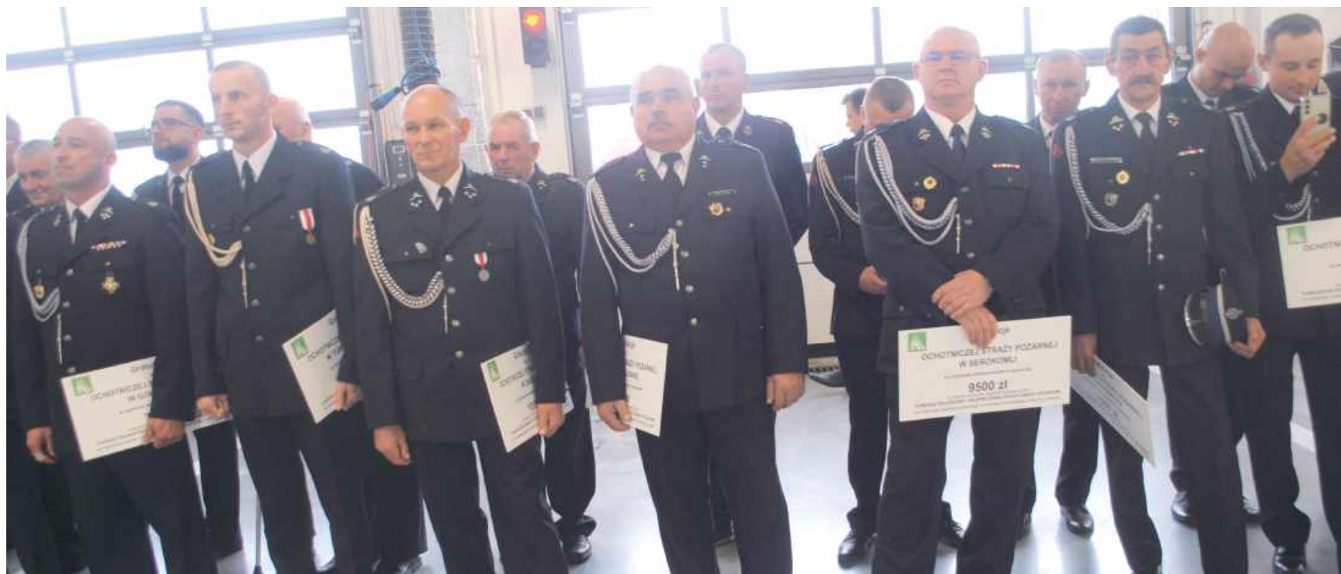
Drużyny z powiatu łukowskiego