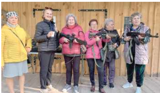
Niektórzy po raz pierwszy trzymali łuk w ręku i takie rekwizyty

Wielu uczestników po raz pierwszy miało okazję spróbować swoich sił w strzelaniu z łuku. Dużym zainteresowaniem cieszyła się również wy-