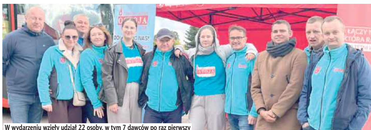
W wydarzeniu wzięły udział 22 osoby, w tym 7 dawców po raz pierwszy