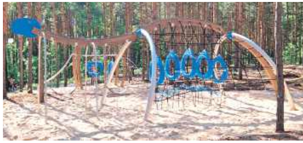
Całkowity koszt inwestycji to ponad 750 tys. zł., z czego blisko 640 tys. zł pochodzi z funduszy europejskich

W Klimkach w gminie Łuków trwa przygotowanie do drugiego etapu rozbudowy Leśnego Zespołu Rekreacyjno-Edukacyjnego Amonit. Inwestycja ma na celu rozbudowę istniejącej infrastruktury i wyposażenie kompleksu w nowoczesne urządzenia rekreacyjne oraz edukacyjne.