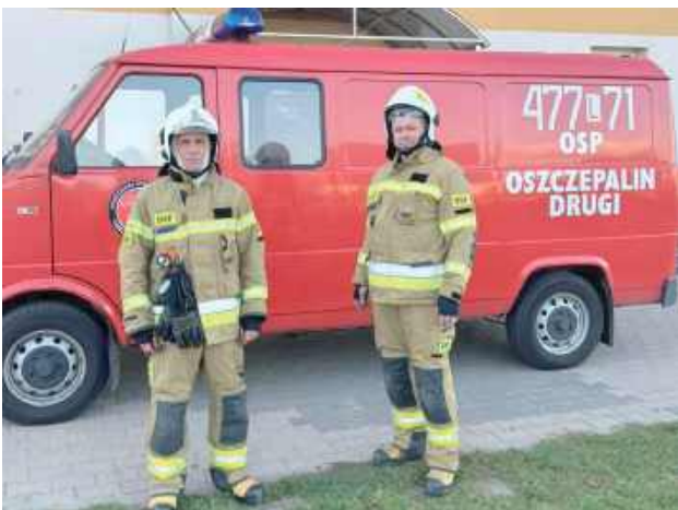
Powodem zgłoszenia było gniazdo os, które stanowiło potencjalne zagrożenie dla uczniów i pracowników placówki

Następnie, z wykorzystaniem środków ochrony in-