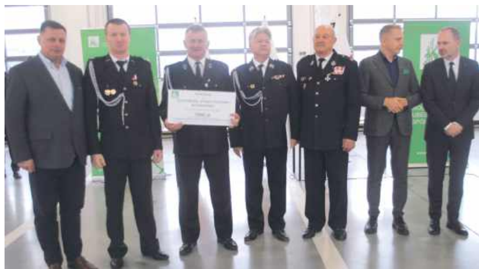
Dotacja dla OSP Karwów