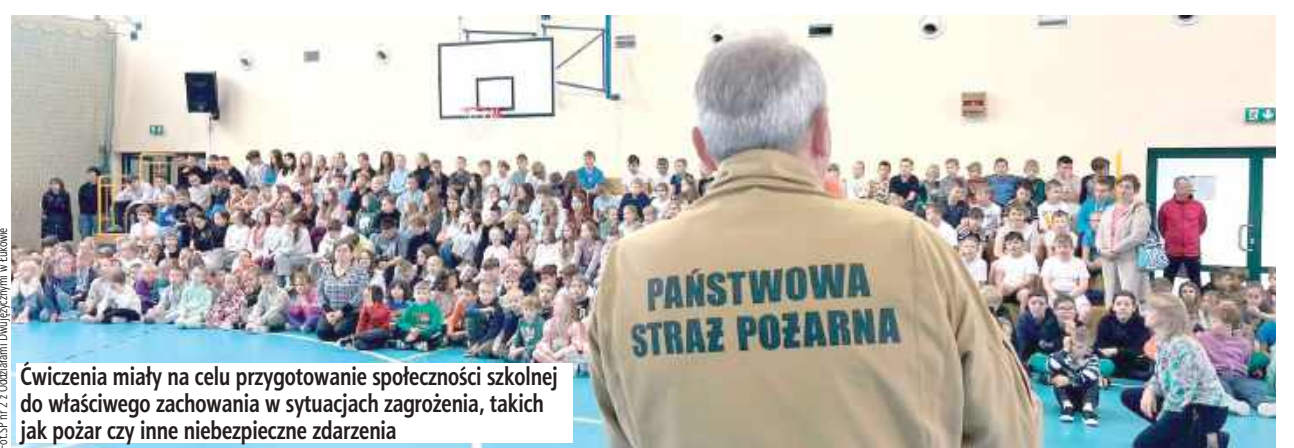
Ćwiczenia miały na celu przygotowanie społeczności szkolnej do właściwego zachowania w sytuacjach zagrożenia, takich jak pożar czy inne niebezpieczne zdarzenia