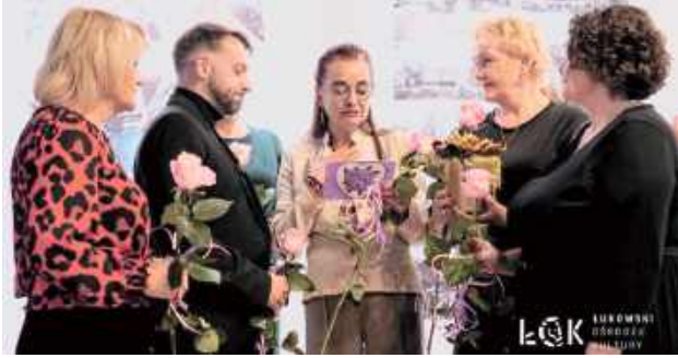
Panie zmierzyły się z trudnymi zadaniami portretu, martwej natury, a także reportaży