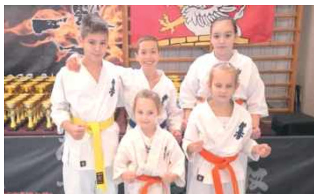
Wydarzenie okazało się dużym sukcesem dla reprezentantów Łukowskiego Klubu Karate Kyokushin, którzy pokazali świetną formę i ducha walki, zdobywając liczne miejsca na podium

W Żdanowie odbył się Ogólnopolski Turniej Karate Kyokushin o Puchar Wójta Gminy Zamość, który zgromadził blisko 270 zawodników z Polski i Ukrainy. Wydarzenie okazało się dużym sukcesem dla reprezentantów Łukowskiego Klubu Karate Kyokushin, którzy pokazali świetną formę i ducha walki, zdobywając liczne miejsca na podium.