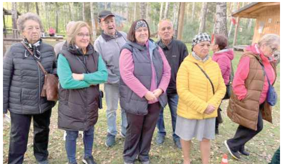
Wydarzenie to, zostało zorganizowane po raz pierwszy dla Klubów Seniora