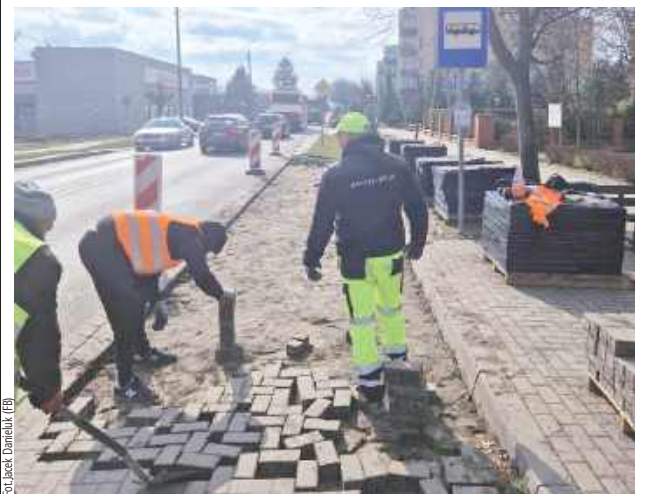
Trwa budowa ścieżki pieszo-rowerowej w ul. Wojska Polskiego

W Terespole zaczęła się budowa prawie 600-metrowego ciągu pieszo-rowerowego przy ul. Wojska Polskiego. To wspólne przedsięwzięcie Zarządu Województwa Lubelskiego oraz miasta Terespol wykonywane jest przez Rejon Dróg Wojewódzkich w Białej Polsce.