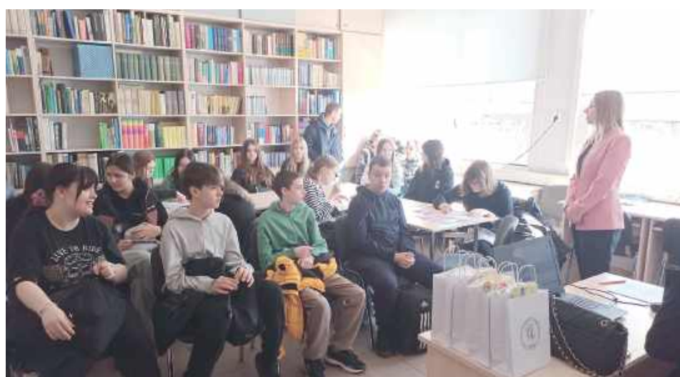
Ósmoklasiści mogli zapoznać się z ofertą edukacyjną międzyrzeckiego „Ekonomika”

W Zespole Szkół Ekonomicznych im. Marii Dąbrowskiej w Międzyrzeczu Podlaskim 21 marca odbył się Dzień Otwarty dla uczniów klas ósmych szkół podstawowych. Młodzież miała okazję zapoznać się z ofertą edukacyjną szkoły, zwiedzić budynek i porozmawiać z nauczycielami oraz starszymi kolegami.