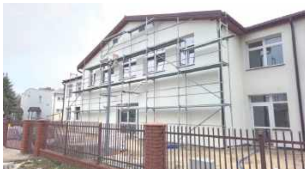
Samorząd planuje, by placówka mogła przyjąć 40 dzieci w żłobku oraz 95 dzieci w przedszkolu

Kiedyś była to szkoła, teraz powstaną tu żłobek i przedszkole. Modernizacja budynku w Jelnicy idzie pełną parą. Inwestycję realizują władze gminy Międzyrzec Podlaski, a większość pieniędzy na ten cel pochodzi z funduszy zewnętrznych.