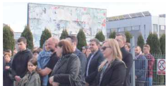
Wielu białczan przyszło na uroczystość przy wejściu na teren kampusu.

Podczas dobrze przygotowanej i sprawnej uroczystości z okazji nadania nazwy ulicy prof. Józefa Bergiera zaskakiwał w niedalekim tle szpetny widok. „Zgrzyt” wizualny stanowiła obdarta tablica reklamowa ze śladami antyreklamy „Żabki”. Przecież wcześniej wystarczyło powiadomić właściciela tej tablicy o konieczności jej wyczyszczenia lub zalepiania nowymi reklamami.