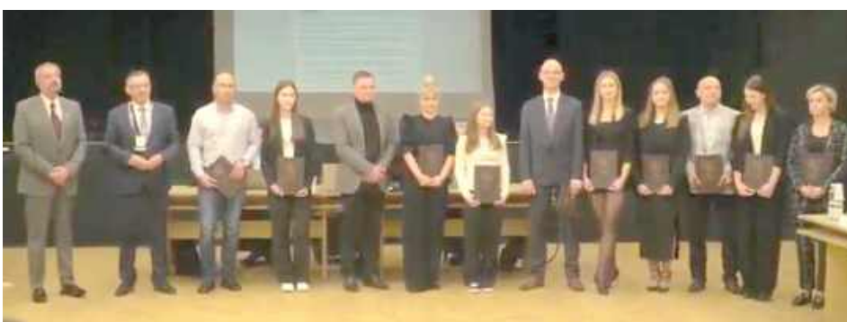
Stypendystki w dziedzinie twórczości artystycznej z rodzicami i władzami powiatu.

Tuż po rozpoczęciu sesji Rady Powiatu w Białej Podlaskiej uroczysto wręczono stypendia sportowe oraz stypendia w dziedzinie twórczości artystycznej dzieci i młodzieży z powiatu białskiego.