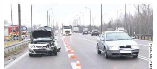
W trakcie prowadzonych czynności funkcjonariusze ustalili, że 40-letni kierowca Seata nie posiadał uprawnień do kierowania

Biała Podlaska: Kierujący Seatem 40-latek zderzył się z osobowym Oplem. Skręcając w lewo, prawdopodobnie nie ustąpił pierwszeństwa osobówce.