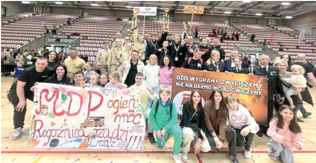
Mistrzowie Polski pochodzą z powiatu bialskiego! MDP Rogoźnica, MDP Chotyłów - kawał dobrej roboty!

I Ogólnopolskie Halowe Zawody Młodzieżowych Drużyn Pożarniczych rozegrano 22 marca w Grodzisku Mazowieckim. Na podium stanęły drużyny z powiatu bialskiego – MDP Chotyłów i MDP Rogoźnica zdobyły tytuły mistrzów Polski w swoich kategoriach.