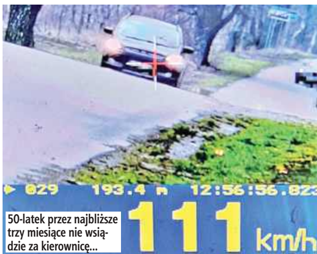
50-latek przez najbliższe trzy miesiące nie wsiaździe za kierownicę...

- Którego prędkość była wyższa niż ta, która obowiązuje na