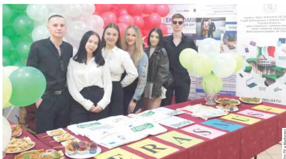
Uczniowie ZSE przygotowali stoiska informacyjne. Jedno z nich dotyczyło programu Erasmus+

Spotkanie rozpoczęło się o godzinie 8.30 w sali gimnastycznej. Gości powitała dyrekcja szkoły, nauczyciele i uczniowie, którzy przygotowali krótką prezentację kierunków kształcenia. Kandydaci mogli poznać zawody, do których przygotowuje ZSE: technik informatyk, programi-