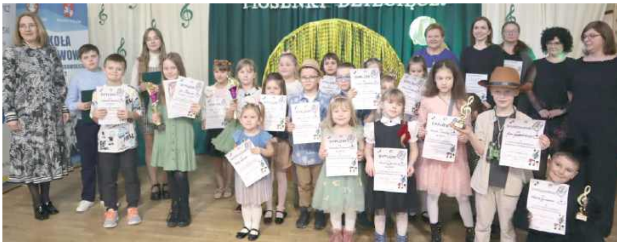
Uczestnicy rywalizowali w dwóch kategoriach wiekowych: „Śpiewający Przedszkolak” oraz „Śpiewający Starszak”

To już III edycja Międzygminnego Konkursu Piosenki Dziecięcej „O Złoty Mikrofon”. 4 marca na scenie w Drelowie zaprezentowało się 28 młodych wykonawców z gmin Drelów i Międzyrzec Podlaski. Po raz pierwszy wydarzenie odbyło się pod honorowym patronatem wójtów obu gmin.