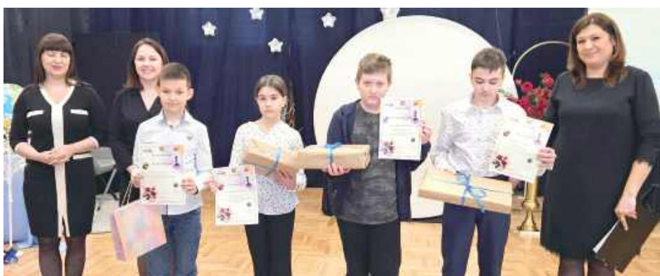
Organizatorzy podkreślali wysoki poziom prezentacji oraz ich oryginalność. Na zdjęciu laureaci konkursu w kategorii klas 4-6