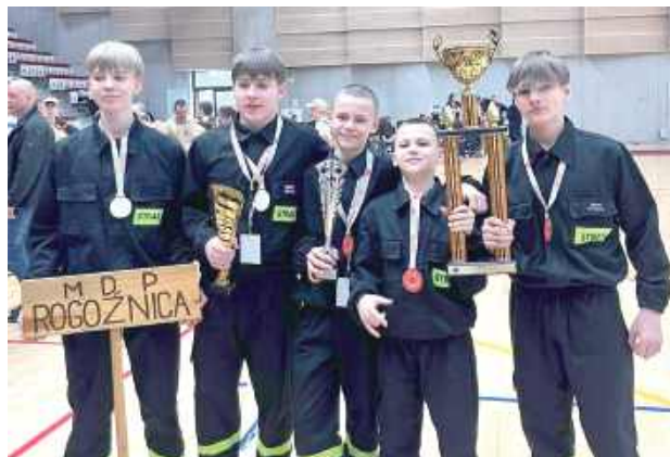
Zwycięcy z Młodzieżowej Drużyny Pożarniczej w Rogoźnicy

Chłopcy z MDP Rogoźnica wywalczyli tytuł mistrzów Polski z czasem 95,48 sekundy. Zawody były wymagające, emocje towarzyszyły im do ostatnich sekund. Jak zaznacza drużyna – był to