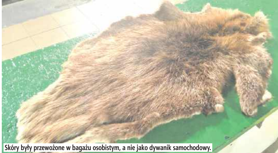
Skóry były przewożone w bagażu osobistym, a nie jako dywanik samochodowy.

- Skóry przewoził na własny użytek. Miały posłużyć jako dywaniki w samochodzie. Tłuma-