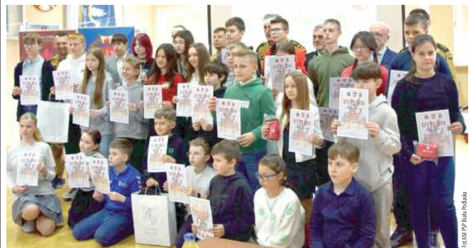
Każdy uczestnik etapu powiatowego otrzymał pamiątkowy dyplom. Najlepsi będą reprezentować nasz region w etapie wojewódzkim

To już XLVII edycja Ogólnopolskiego Turnieju Wiedzy Pożarniczej „Młodzież zapobiega pożarom”. 27 marca w siedzibie Komendy Miejskiej PSP w Białej Podlaskiej odbyły się eliminacje powiatowe. W konkursie rywalizowało 30 uczniów z całego powiatu bialskiego.