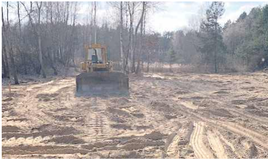
Pod koniec marca zasypano dawne mokradła, które w obecnym suchym roku już nie były zalane wodą. Trwa rozbudowa strzelnicy.

Część mieszkańców Kobylan pod Terespołem twierdzi, że przed kilkoma dniami obok bardzo głośnej strzelnicy zasypano niemal metrową warstwą ziemi działkę z mokradłami, w których przed rokiem zgłoszono miejsce bytowania kumaka nizinnego. Nadleśnictwo Chotyłów odpowiada, że ten teren nie jest siedliskiem płaza objętego ścisłą ochroną.