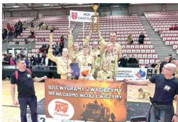
Bezkonkurencyjna drużyna z Chotyłowa

najtrudniejszy start w ich historii, ale jednocześnie najbardziej udany.