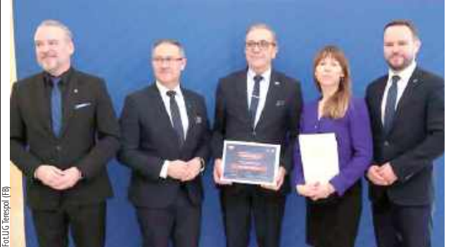
Gmina otrzyma wsparcie w ramach Rządowego Funduszu Rozwoju Dróg w wysokości 1,3 mln zł, co stanowi prawie połowę wartości inwestycji

W miniony wtorek w Lublinie została zawarta umowa pomiędzy wojewodą lubelskim i gminą Terespol na dofinansowanie rozbudowy odcinka drogi gminnej Koroszczyn - Lechuty Małe.