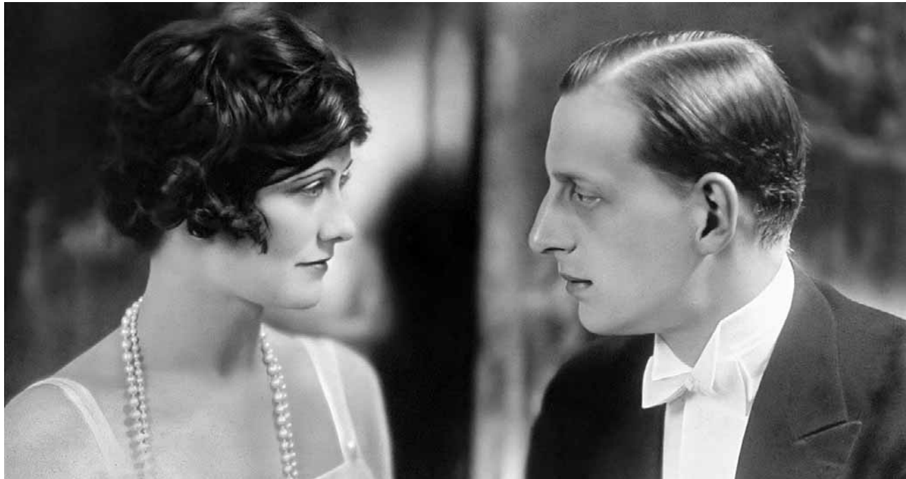
Ponoć pomysłodawcą flakonu Chanel 5 był już w 1920 r. wielki książę Dymitr Pawłowicz Romanow, a inspiracją były butelki wódki noszone przez rosyjskie wojska

Warto dodać, że ową Katarzyną od bukietu była caryca Katarzyna II Aleksiejewna Wielka i że w 1913 r. przypadało 300-lecie dynastii Romanowów. Beaux