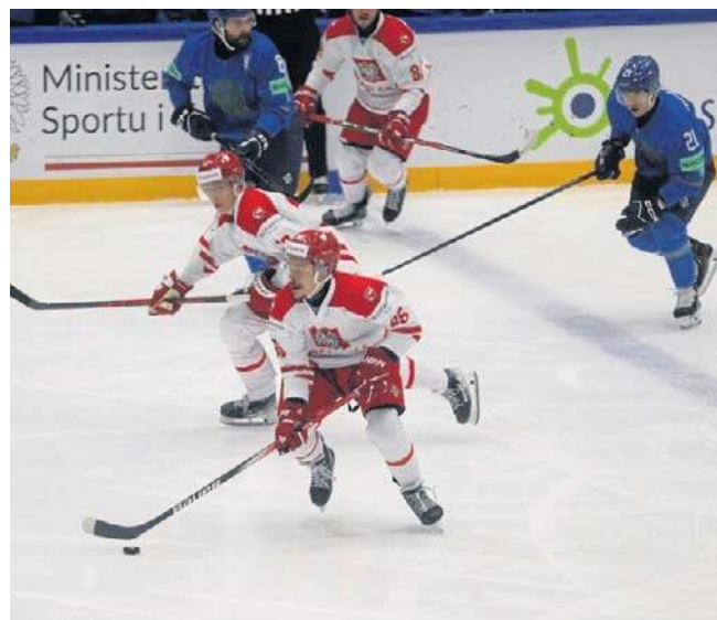
Hokeiści Polski po emocjonującym meczu przegrali z Kazachstanem 2:3

Dzisiaj w MŚ: Francja - Litwa (12.30), Ukraina - Kazachstan (16), Japonia - POLSKA (19.30). ©