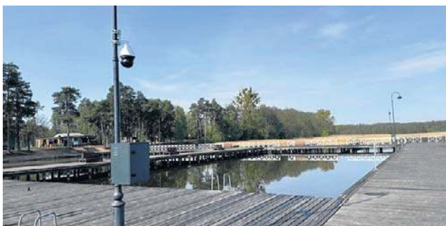
Pierwsze kamery już wiszą w kluczowych punktach miasta

W Augustowie rozpoczęła się instalacja nowoczesnego systemu monitoringu. Pierwsze urządzenia pojawiają się w kluczowych punktach miasta, a część z nich ma zacząć działać już w lipcu. To efekt wieloletnich przygotowań i inwestycji w poprawę bezpieczeństwa mieszkańców i turystów.