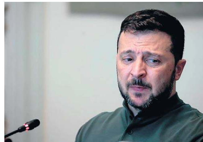
Prezydent Zełenski zaproponował podzielenie się doświadczeniem w walce z dronami

Ukraiński przywódca odwiedził w ciągu ostatnich dwóch miesięcy kilka państw Bliskiego Wschodu, w tym dwukrotnie Arabię Saudyjską, Zjednoczone Emiraty Arabskie, Katar czy Syrię. Zełenski informował wcześniej, że Ukraina rozpoczęła współpracę z państwami tej części świata, dzieląc się z nimi doświadczeniem w walce z irańskimi dronami.