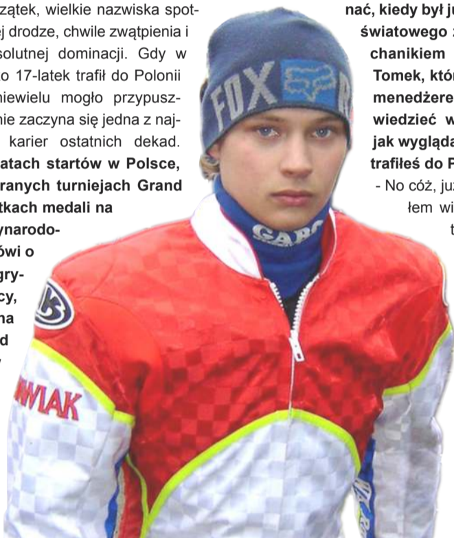
Wiele osób w Rosji mi mówiło, że to zły wybór, że mnie oszukają, że nie dostanę tego co mi obiecali, a jednak to wszystko było nie prawdą.