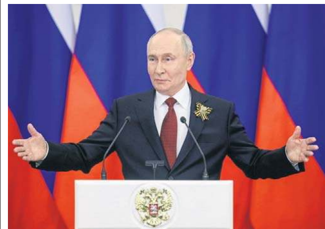
Putin powiedział, że jego zdaniem „specjalna operacja wojskowa”, czyli wojna w Ukrainie, ma się ku końcowi

Rosyjski dyktator został także zapytany o możliwość negocjacji z Europą. Tu wskazał na potencjalnego mediatora - miałby nim być były kanclerz Niemiec Gerhard Schröder.