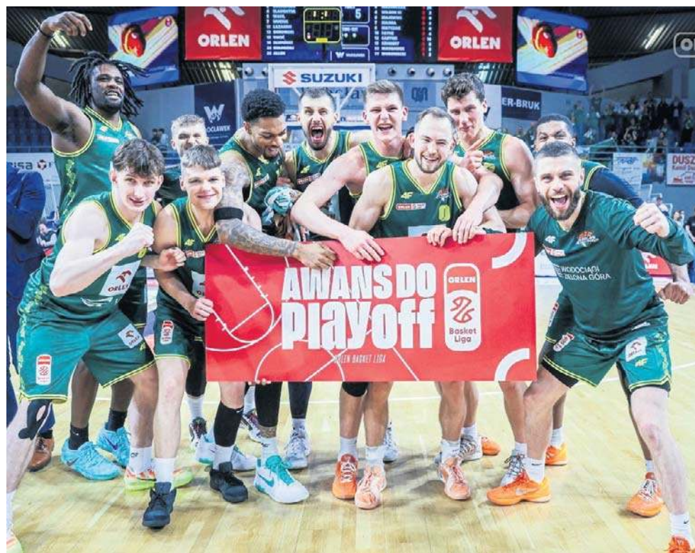
Radość zielonogórskiego zespołu po zwycięstwie we Włocławku i awansie do play off