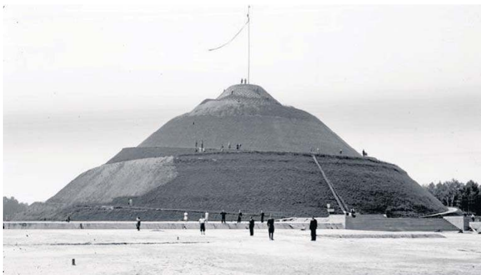
Po śmierci marszałka Józefa Piłsudskiego postanowiono kopiec nazwać jego imieniem. Sypanie zakończono 9 lipca 1937 r.