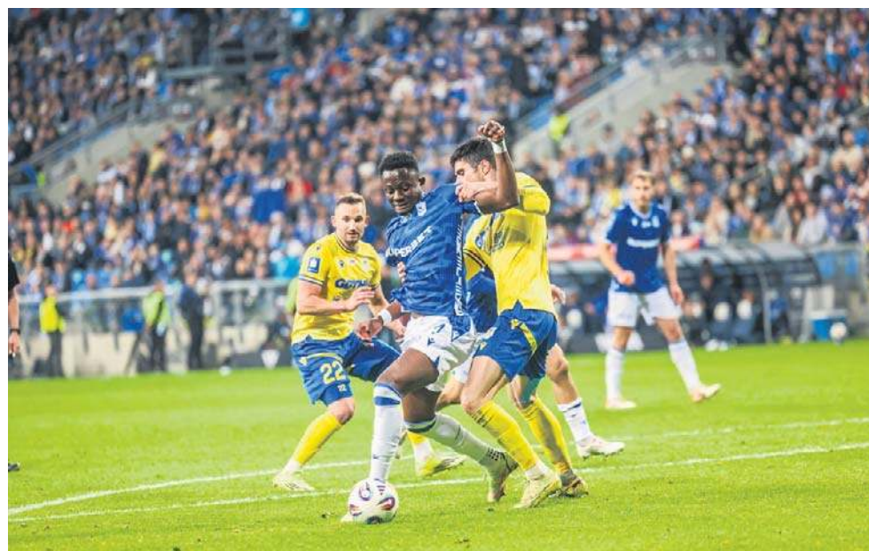
Przewodzący tabeli Lech niespodziewanie tylko zremisował z zagrożoną spadkiem Arką

Niebywały przebieg miał drugi piątkowy mecz. Przewodzący tabeli Lech Poznań dopingowany przez rekordową liczbę widzów (ponad 41 tysięcy) niespodziewanie tylko zremisował z zajmującą miejsce w strefie spadkowej Arką Gdynia. Trudno racjonalnie wytłumaczyć ten rezultat, skoro faworyt miał przytłaczającą przewagę, która przejawiała się przez 25 oddanych strzałów