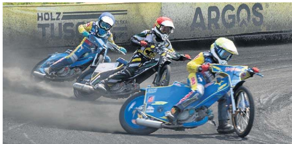
Miniżużlowcy przez dwa dni ścigali się w Wawrowie. Już w sobotę kolejne zawody

Co ciekawe, sobotnia rywalizacja drużynowa w obu turniejach zakończyła się podobnie. I w przedpołudniowych, i w popołudniowych zawodach wygrał KS Toruń przed Stalą Wawrów i Unią Leszno. Zwycięstwo młodych Torunian nie powinno dziwić. Ich drużyna składa się bowiem z zawodników, którzy żużel mają w genach. Każdy pocho-