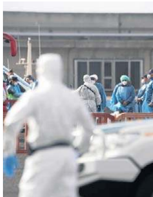
Pierwszy statek opuścili Hiszpanie

Na statku należącym do holenderskiej firmy Oceanwide Expeditions znajduje się około 150 osób z ponad 20 krajów. Proces zejścia na ląd będzie nadzorowany przez trzech hiszpańskich ministrów, w tym minister zdrowia Monikę Garcíę i ministra spraw wewnętrznych Fernando Grande-Marlasquę, a także szefa Światowej Organizacji Zdrowia (WHO) Tedrosa Adhanoma Ghebreyesusa. W nocy z soboty na niedzielę Garcia ponownie zapewniła, że