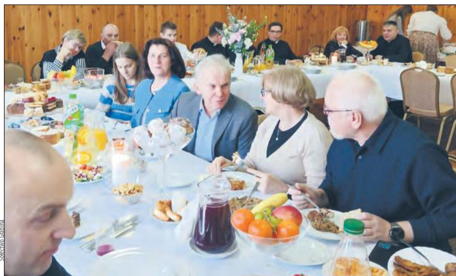
Uroczystość ofiarowania chorągwi zakończyła się wspólną biesiadą