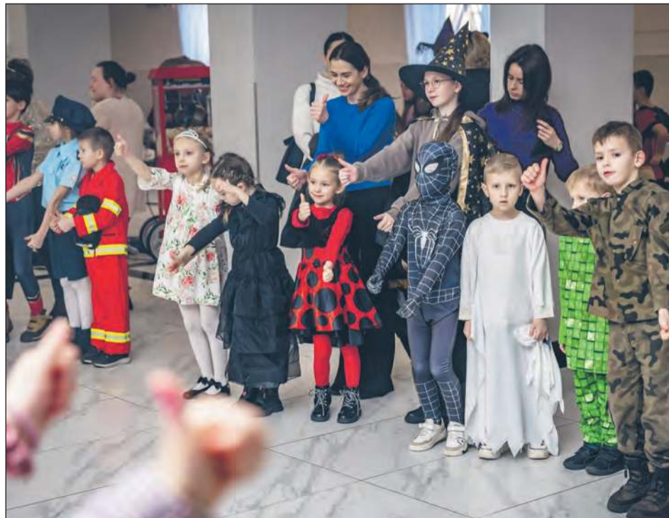
Podczas balu dzieci wzięły udział w tańcach, animacjach oraz zabawach integracyjnych