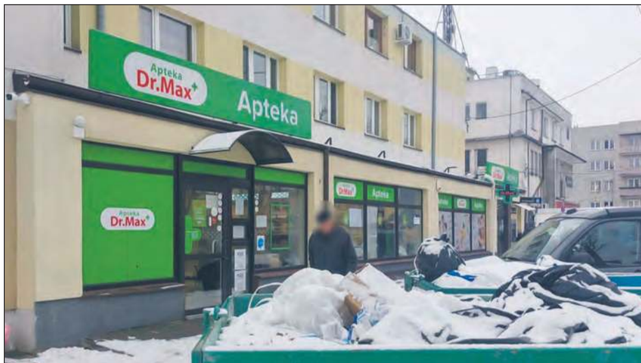
■ Z powodu trwającej modernizacji zamknięta została jedyna apteka w Garwolinie, która dotychczas była czynna w każdą niedzielę w ciągu dnia

W poniedziałek, 10 lutego, mężczyzna próbował uzyskać informacje na temat dyżurów aptek, dzwoniąc do starostwa powiatowego. Niestety, nie dowiedział się niczego konkretnego, ponieważ urzędniczka odpowiedzialna za tę kwestię przebywała na urlopie. My również skontaktowaliśmy się z urzędem we wtorek - usłyszeliśmy tę samą odpowiedź. Urzędniczka miała wrócić do pracy w czwartek.