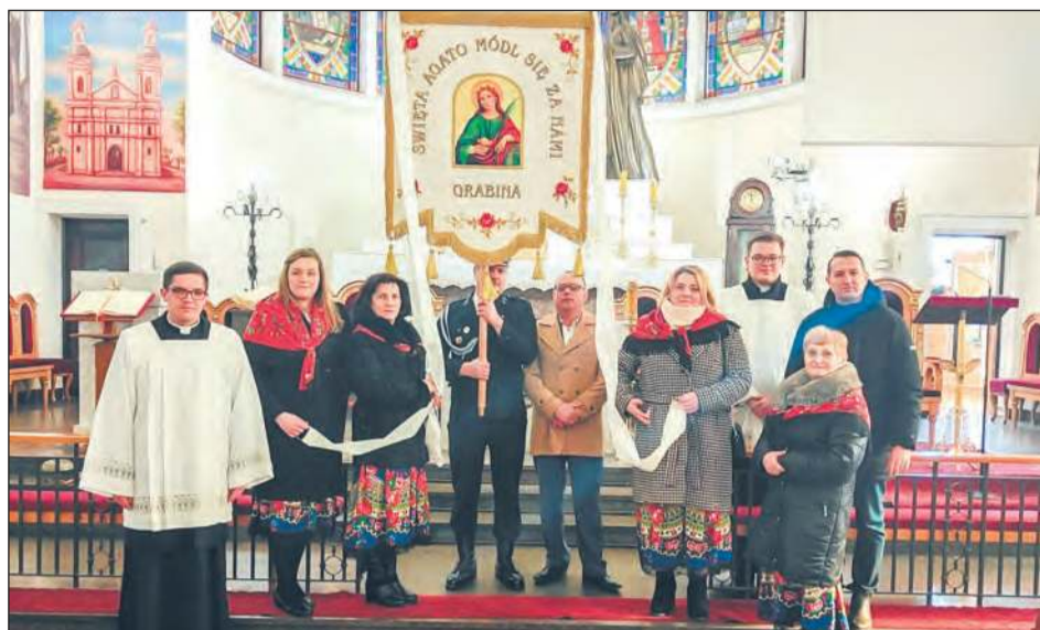
W niedzielę, 9 lutego, mieszkańcy sołectwa Grabina ofiarowali do kościoła parafialnego w Łaskarzewie chorągiew z wizerunkiem św. Agaty

» Tak jak przed laty, gdy w wiosce wybuchł ogromny pożar, tak i teraz mieszkańcy z modlitwą zwracają się do świętej Agaty