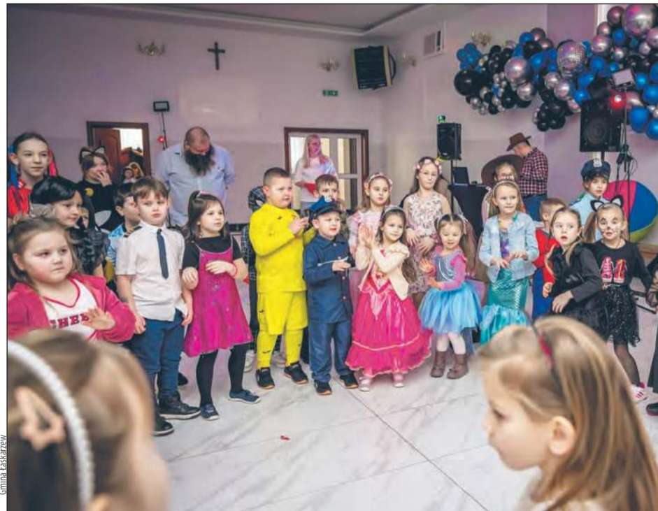
Tego dnia nie zabrakło również kolorowych strojów i bajkowych przebrań

W środę, 12 lutego, w sali OSP Melanów odbył się pierwszy w historii bal karnawałowy dla dzieci z gmi-