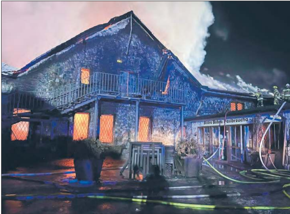
Na miejscu zdarzenia pracowało 45 zastępów straży pożarnej i 162 strażaków