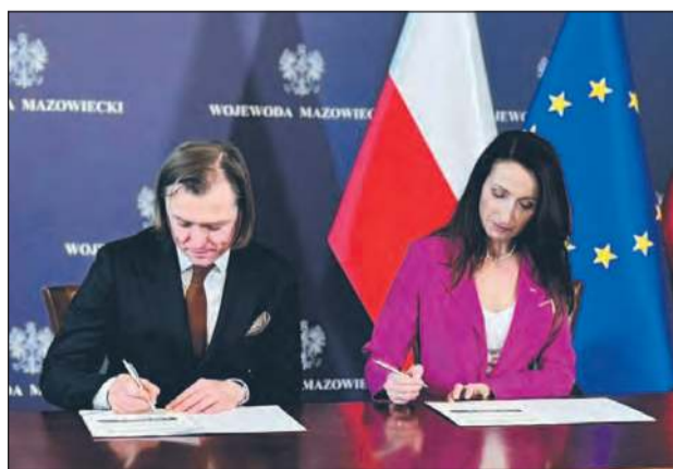
■ Umowa o dofinansowanie z Funduszu Rozwoju Przewozów Autobusowych o charakterze użyteczności publicznej została podpisana 28 stycznia w Mazowieckim Urzędzie Wojewódzkim i obowiązuje od 21 stycznia 2025 roku

Umowa o dofinansowanie z Funduszu Rozwoju Przewozów Autobusowych o charakterze użyteczności publicznej została podpisana 28 stycznia w Mazowieckim Urzędzie Wojewódzkim