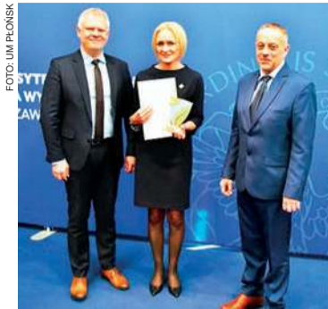
Miasto Płońsk zwyciężyło w ekologicznym plebiscycie za unijny projekt, w ramach którego wybudowano ścieżki rowerowe i obwodnice, powstała też miejska komunikacja

Powyższy wspomniany projekt miasto Płońsk zrealizowało w latach 2016-2023, w partnerstwie z powiatem płońskim i gminą Płońsk. W ramach tej inwestycji wybudowano łącznie 10 km ścieżek rowerowych, obwodnicę zachodnią - ul. Św. Jana Pawła II, obwodnicę wewnętrzną - ul. Grobickiego, ciągi pieszo-rowerowe na drogach powiatowych (ul. Młodziejowa i Kopernika oraz na odcinku od granic Płońska do Arcelina, wraz z przebudową drogi powiatowej), parkingi