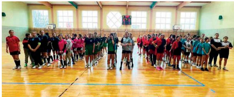
Uczestniczki zawodów na wspólnym zdjęciu

Powiat Makowski oficjalnie pogratulował wszystkim zwycięzcom za pośrednictwem mediów społecznościowych. PB