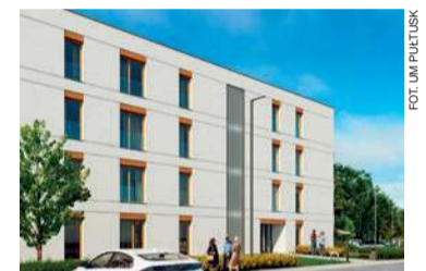
Wizualizacja budynku przy ul. Kwiatkowskiego

Trwają również prace związane z odbudową i przebudową budynku koszarowego przy Alei Tysiąclecia.