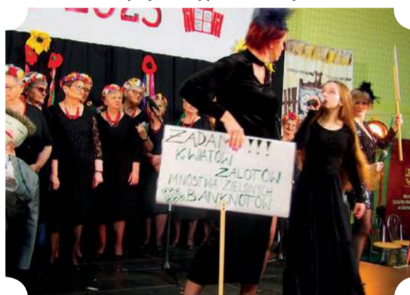
Grupa ze Szczawina Kościelnego z postulatami