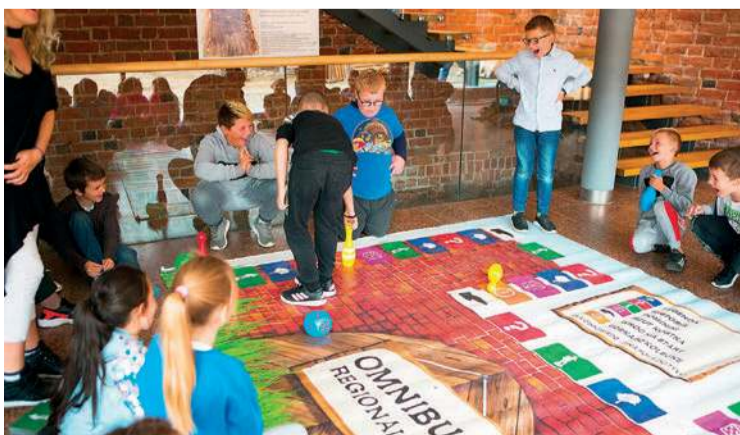
Omnibus - gra edukacyjna

Podsumowując, pierwsze szkolenie w ramach projektu „500 lat Mazowsza w Koronie” dostarczyło uczestnikom nie tylko solidnej dawki wiedzy historycznej, ale także inspiracji do prowadzenia innowacyjnych zajęć edukacyjnych. Kolejne spotkania zapowiadają się równie fascynujące, a cały projekt ma szansę na nowo rozbudzić zainteresowanie lokalną historią wśród uczniów i nauczycieli.