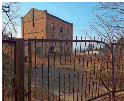
W zabytkowym młynie w Baboszewie ma powstać oddział Muzeum Mazowieckiego Obiekt, na potrzeby muzeum, przekazała samorządowi województwa mazowieckiego, gmina Baboszewo

Ciekawa historia wiąże się zresztą z samym baboszewskim młynem. Gdy wybuchła II wojna światowa, obiekt zajęli Niemcy, wyznaczyli zarządcę – Niemca. Jednakże on czuł się Polakiem, z Niemcami walczył, a jego syn jeździł do Warszawy i z Alei Szucha, w niemiec-