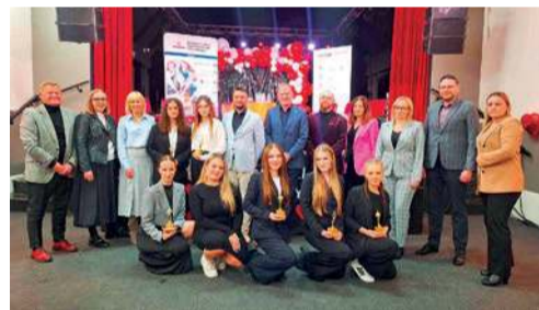
Strażacy z jednostki OSP w Idzikowicach zorganizowali zapusty, by kultywować tradycję i pomóc chorym dzieciom

- Późną jesienią ubiegłego roku narodził się pomysł, że musimy coś zorganizować na koniec karnawału i wspólnie