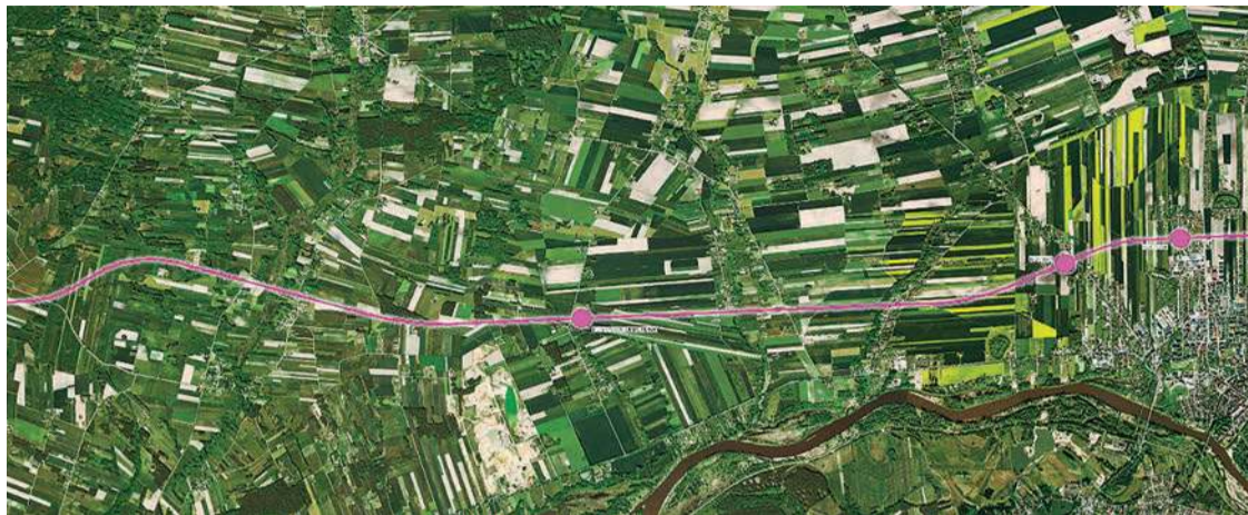
Linia kolejowa do Pułtuska

My jednak zapytaliśmy, jak konkretnie przebiegać będzie linia kolejowa, gdyż w związku z jej planowaniem dochodziło do sprzeciwu społecznego, m.in. w gminie Szelków. W odpowiedzi uszyliśmy, że wstępny wariant został przedstawiony ze względu na to, że ubiegano się o wsparcie z Rządowego Programu Uzupełniania Lokalnej i Regionalnej Infrastruktury Kolejowej - Kolej Plus do 2029 r. (i w ramach tego programu opracowanie projektowe będzie realizowane).