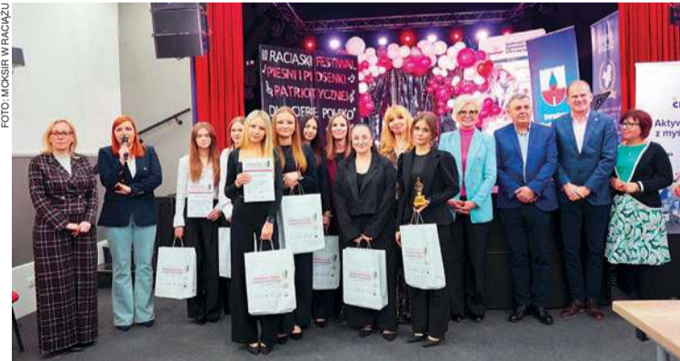
Po raz trzeci w Raciążu zorganizowano Festiwal „Dla Ciebie Polsko”.

W kategorii: zespoły klasy I-IV, pierwsze miejsce zajęła reprezentacja chóru SP w Raciążu, drugie - zespół Perelki z SP w Starym Gralewie, a trze-