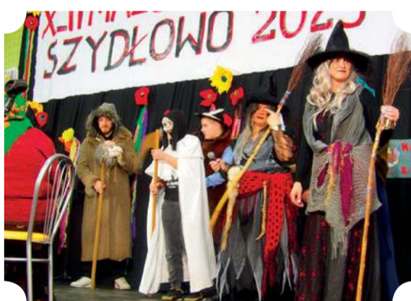
„Czarownice” z Bądkowa