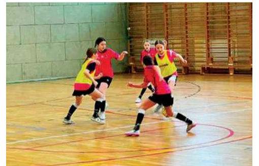
Zacięta walka o Puchar Starosty