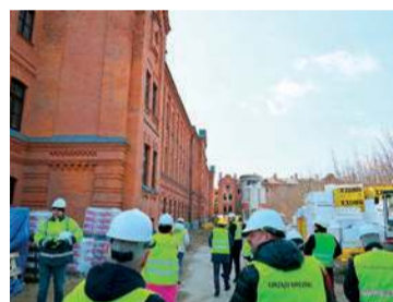
Wizytacja inwestycji w budynku koszarowym

Spółka SIM Północne Mazowsze w Ciechanowie, w której Gmina Pułtusk jest udziałowcem, powstała w celu realizacji budownictwa społecznego, skierowanego do osób i rodzin, które nie mają mieszkania własnościowego ani możliwości jego zakupu z uwagi na brak zdolności kredytowej, jednak ich stabilna sytuacja finansowa pozwala na regularne opłacenie czynszu. Wspólna inwestycja Gminy Pułtusk i SIM Północne Mazowsze w Ciechanowie to czterokondygnacyjny budynek mieszkalny, przy ul. Kwiatkowskiego w Pułtusku, posiadający trzy klatki schodowe, wyposażone w dźwig osobowy i instalację fotowoltaiczną. W budynku będą 44 mieszkania o powierzchni od 32,00m 2 do 69,00m 2 , wykonane w standardzie „pod klucz”, wyposażone w urządzenia kuchenne i przybory sanitarne. Struktura mieszkań jest nowoczesna i funkcjonalna. Pod budynkiem będzie podziemny garaż z 29 miejscami postojowymi oraz przynależnymi do lokali komórkami.