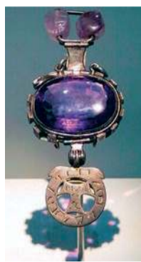
Szafir z Delhi