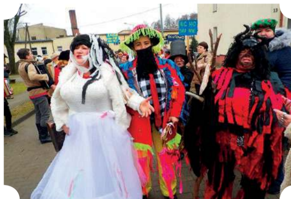
Diabeł przy młodej parze to dobry znak?