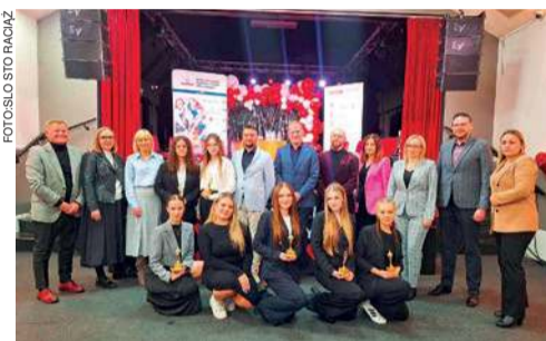
Celem projektu „Moje komórki – Twoje życie” jest zwiększenie liczby potencjalnych dawców szpiku

Piątkowe spotkanie to element projektu „Moje komórki – Twoje życie”, realizowanego przez uczniów Społecznego Liceum Ogólnokształcącego