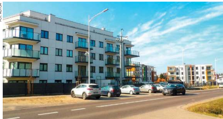
Osiedle mieszkaniowe przy al. Marszałkowskiej w Mławie, powstałe w ostatnich latach

Wydział wydał zezwolenia na budowę siedmiu dużych kurników (w 2023 r. – 21), 11 - innych obiektów inwentarskich (chlewnie, obory, stajnie), 11 – handlowo-usługowych, 11 – hal namiotowych i magazynów.