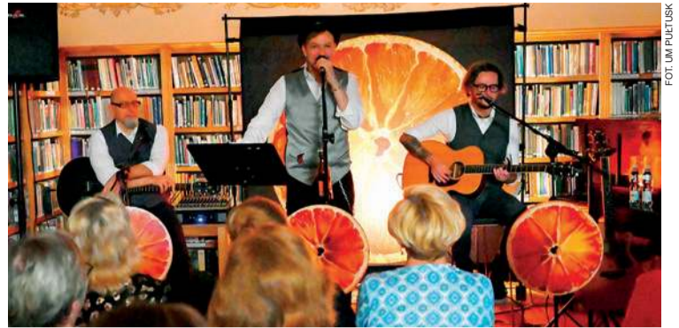
Koncert zespołu Plateau

Główną atrakcją wieczoru był koncert zespołu Plateau. W trakcie występu publiczność miała okazję wysłuchać zarówno największych przebojów zespołu, jak i utworów z albumu „Projekt Grechuta”, stanowiącego artystyczny hołd dla twórczości Marka Grechuty. Występ spotkał się z entuzjastycznym przyjęciem publiczności, która chętnie włączała się do wspólnego śpiewania. Spotkanie zakończył słodki poczęstunek przygotowany przez organizatorów. Był to miły