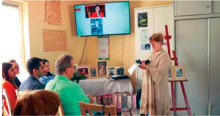
W ramach jubileuszu odbył się wykład o słynnych Polkach, zasłużonych dla polskiej historii

Oczywiście nie mogło zabraknąć jubileuszowego tortu.