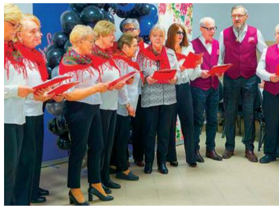
Występ Seniorów z Gąsocina

Muchowskim na czele. Światowy Dzień Organizacji Pozarządowych to bardzo dobra okazja, aby po pierwszy spotkać się w takim ogólnym zjeździe kół gospodyń wiejskich z terenu naszej gminy. To niezwykle ważna i cenna inicjatywa, bo widać, że te grupy naprawdę chcą się integrować i wymieniać doświadczenia. Znając ich zapał do pracy mogą być spokojni, że takie spotkania będą się odbywały częściej. Jako samorząd gminy oczywiście współpracujemy ściślej z tymi organiza-