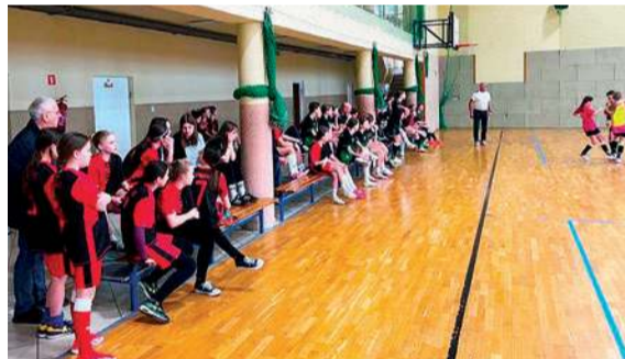
Na trybunach również nie brakowało emocji