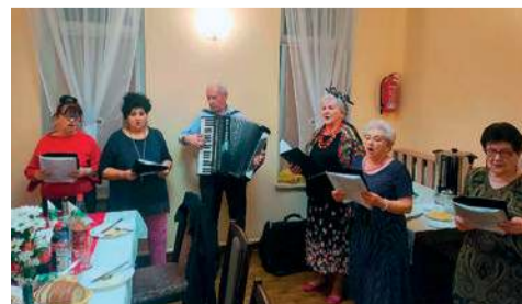
Ostatki w Chorzeliach