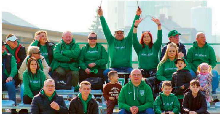
Kibice z Opinogóry głośno dopingowali swój zespół, ale Opia przegrała