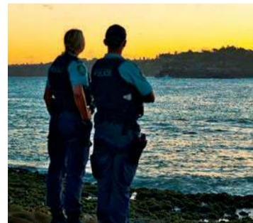
Policjanci przeszukali dokładnie okolice DPS-u i pobliskiego zalewu

Do zdarzenia doszło we wtorek, 4 marca. Policja została poinformowana o zaginięciu około godziny 22.30 przez pracowników DPS. Sprawa była poważna – mężczyzna chorował, a ponieważ tej nocy panowały niskie temperatury, pojawiły się poważne obawy o stan jego zdrowia.