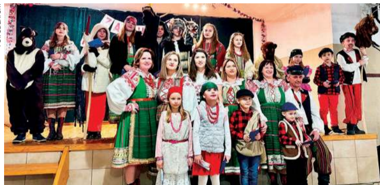
Uczestnicy „Kurpiowskich Zapustów”

Dodajmy, że 4 marca odbyła się wizytacja inwestycji z udziałem przedstawicieli gminy Pułtusk, radnych, spółki SIM Północne Mazowsze, generalnego wykonawcy oraz inwestora zastępczego. RK