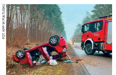
Groźne zdarzenie na trasie Pułtusk-Psary

Kobieta została zabrana do szpitala. Pułtuscy policjanci wyjaśniają okoliczności zdarzenia.