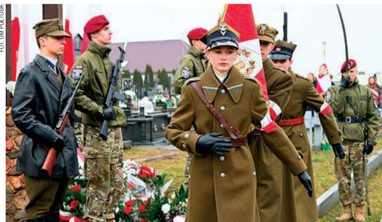
Uroczystości na I cmentarzu

Wiązanki kwiatów złożyli przedstawiciele kombatanów, powiatu, gminy, służb mundurowych, stowarzyszeń, organizacji społecznych i politycznych, instytucji, przedsiębiorstw.