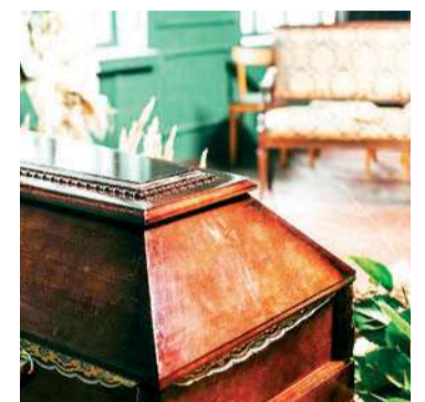
Włamanie do domu pogrzebowego zakończyło się interwencją policji

Za włamanie odpowiedzialni dwaj mężczyźni w wieku 23 i 35 lat. Wcześniej ukradli tablice rejestracyjne i zamontowali je w samochodzie, którym później pojechali „na robotę”. W trakcie śledztwa wyszło na jaw, że 23-latek kierował pojazdem, chociaż miał czynny zakaz prowadzenia pojazdów mechanicznych wydany przez sąd.