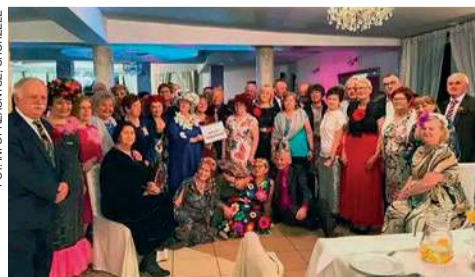
Bal kwiatowy w Przasnyszu

Radosne „ostatki” miały również miejsce w Klubie Seniora w Chorzeliach. Seniorzy zegnali karnawał 3 marca. Karnawałowa atmosfera udzieliła się wszystkim, a barwne przebrania, tańce i muzyka sprawiły, że wieczór był niezapomniany. Seniorzy prezentowali swoje umiejętności na parkiecie, ale także nie zabrakło rozmów i integracji. Na stołach pojawiły się smakowite przekąski, a dźwięki muzyki porwały do tańca. ESKA