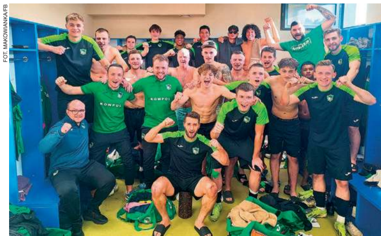
Pomęczowa radość piłkarzy Makowianki w szatni