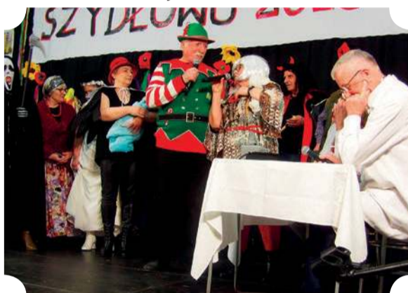
Kolejka do doktora – „Wesoła Gromadka” SEiR z Krasnego