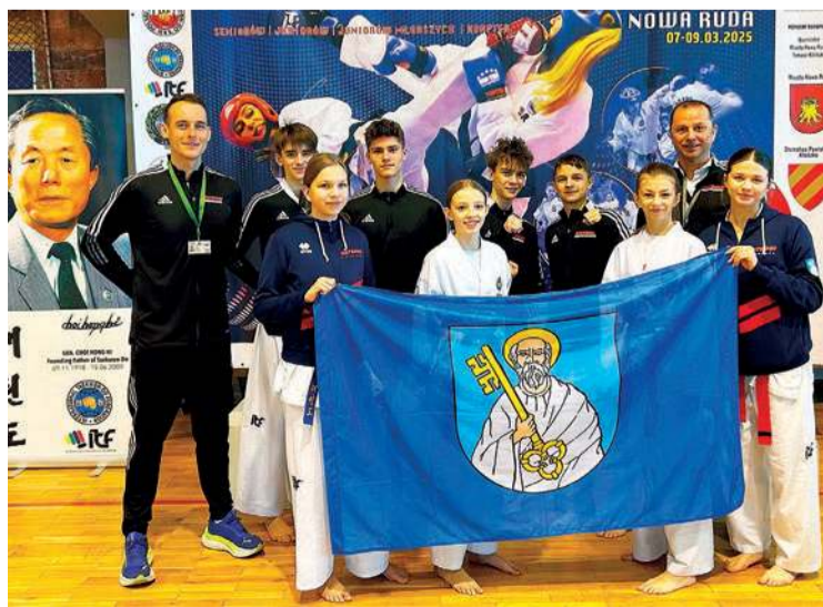
Reprezentacja Matsogi Ciechanów podczas Pucharu Polski