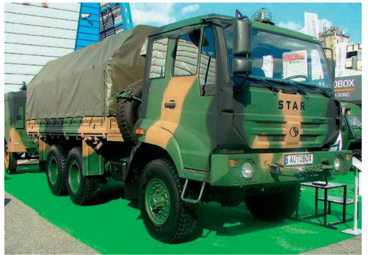
Kołowy pojazd wojskowy