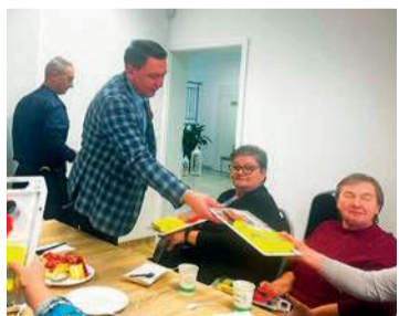
Uczestnicy spotkania otrzymali prezenty - zestawy odblaskowe

Komenda Powiatowa Policji w Makowie Mazowieckim zorganizowała spotkanie z mieszkańcami Rzewnia, dotyczące bezpieczeństwa w ruchu drogowym w ramach akcji „Seniorze – bądź bezpieczny” i „Chroń życie – noś odblaski”.