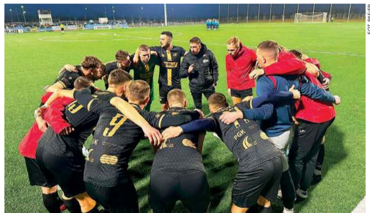
Płońska Akademia Futbolu wygrała w Serocku z Sokółem

17. kolejka (15-16 marca): Marcovia - Delta, Wkra - Łomianki, Kasztelan - Huragan, PAF - Polonia, Żbik - Drukarz, Nadnarwianka - Bug