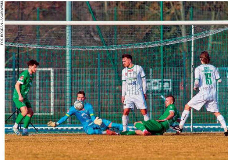
Strzelania na inaugurację