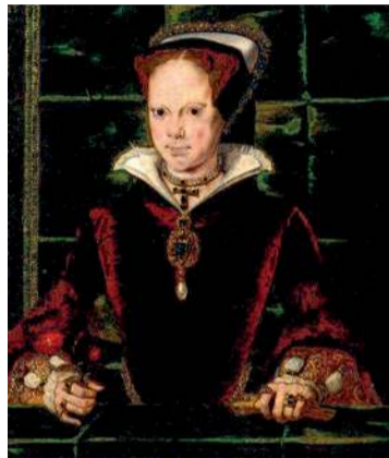
Królowa Maria Tudor z naszyjnikiem La Peregrina

La Peregrina, czyli „pielgrzymująca”, to perła z Panamy, znaleziona w połowie XVI wieku i ofiarowana królowi Filipowi II Habsburgowi. Król zlecił umieszczenie perły w naszyjniku, który podarował w prezencie zaręczynowym Marii Tudor. Maria przeszła do historii jako Krwawa, wieść niesie, że często była obecna podczas egzekucji prześladowanych protestantów i zawsze miała na sobie swój naszyjnik, który stopniowo nasycał negatywną energią. La Peregrina ma ponoć rujnować życie miłosne każdego, kto zawiesi ją na szyi. Pierwsza była królowa Maria, bez pamięci zakochana w Filipie, który ją całkowicie lekcewał. Ostatnia – siedmiokrotnie zamężna aktorka Elizabeth Taylor. Odważny anonimowy nabywca nabył La Peregrinę za 11 milionów dolarów