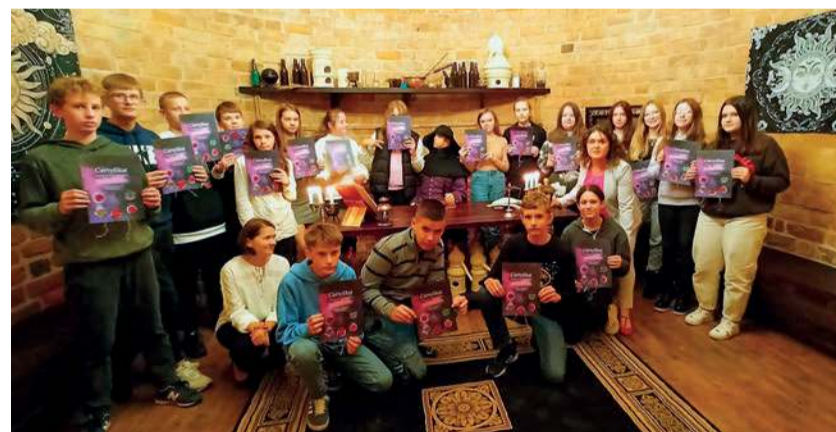
Certyfikaty adepta nauk tajemnych

sztuki wojennej, przez życie dworskie, po tajemnice ukryte w murach zamkowych.