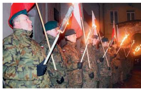
Płońskie obchody Narodowego Dnia Żołnierzy Wyklętych odbyły się 1 marca na dziedzińcu kościoła św. Michała Archanioła

- Tradycja antykomunistycznego podziemia była przez dekady przechowywana w rodzinnych domach i w