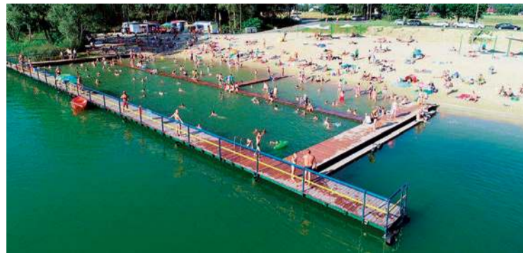
Projekt rewitalizacji kąpieliska Krubin wygrał po raz kolejny

- Spośród poddanych pod głosowanie projektów „miękkich” wybrane do realizacji mogły być trzy zadania, które uzyskały największą liczbę gło-