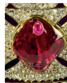
Rubin Czarnego Księcia

Szafir z Delhi nie jest szafirem, a Rubin Czarnego Księcia to wcale nie rubin, tylko spinel. Ciążąca na nim klątwa sięga korzeniami XIV wieku, kiedy to król Kastylji Piotr I, zwany Okrutnym, zabił arabskiego księcia Abū Sa'īda i przywłaszczył sobie piękny szkarłatny kamień, najwyraźniej zapominając o kilku istotnych przykazaniach.