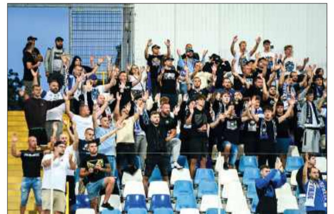
Kibice Stali zawsze z drużyną.