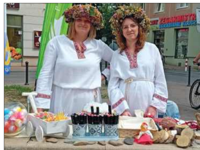
Wielkim zainteresowaniem cieszyły się warsztaty plecenia wianków.