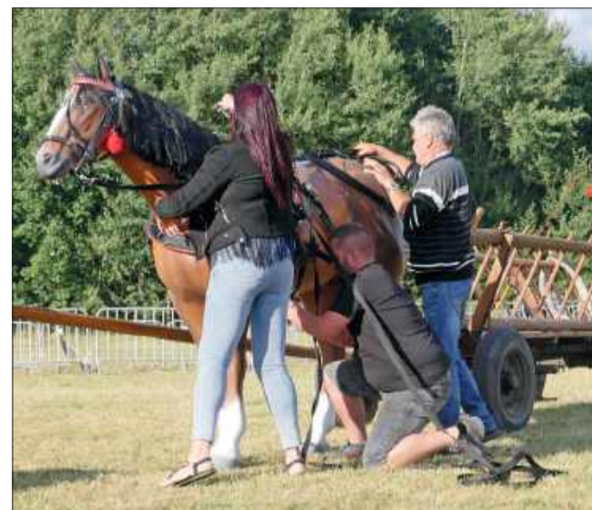
Jedną z konkurencji w konkursie dla publiczności było zaprzęganie konia do wozu.

Patronem medialnym wydarzenia było Korso i korso.pl.