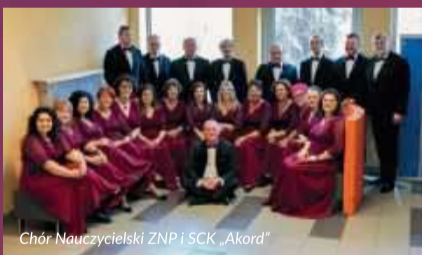
Chór Nauczycielski ZNP i SCK „Akord”