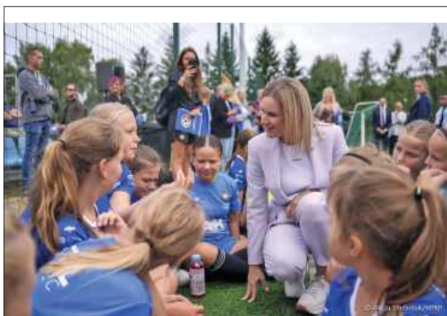
W turnieju nie zabrakło drużyny Stali Mielec.