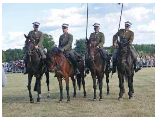
Kawaleria z Dobrynia dała popis jazdy i walki.