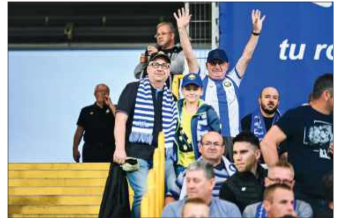
Zawsze wierni „Biało-niebieskim”!