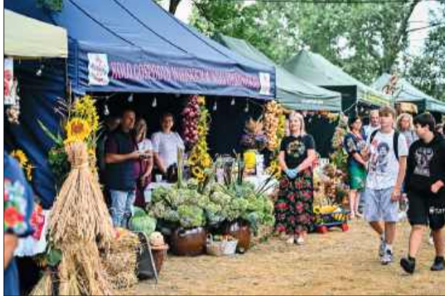
Stoiska KGW pięknie przystrojone