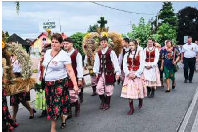
Korowód Dożynkowy był bardzo kolorowy