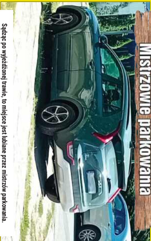
Sądząc po wyjeździej trawie, to miejsce jest lubiane przez mistrzów parkowania.