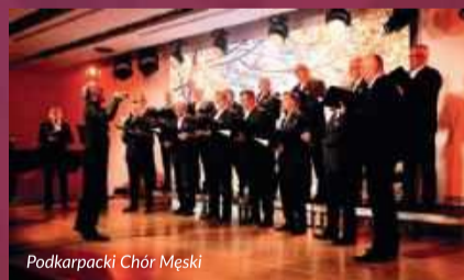
Podkarpacki Chór Męski