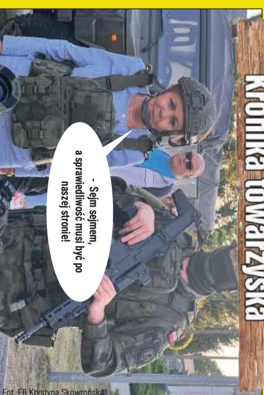
- Sejm sejmem, a sprawiedliwość musi być po naszej stronie!