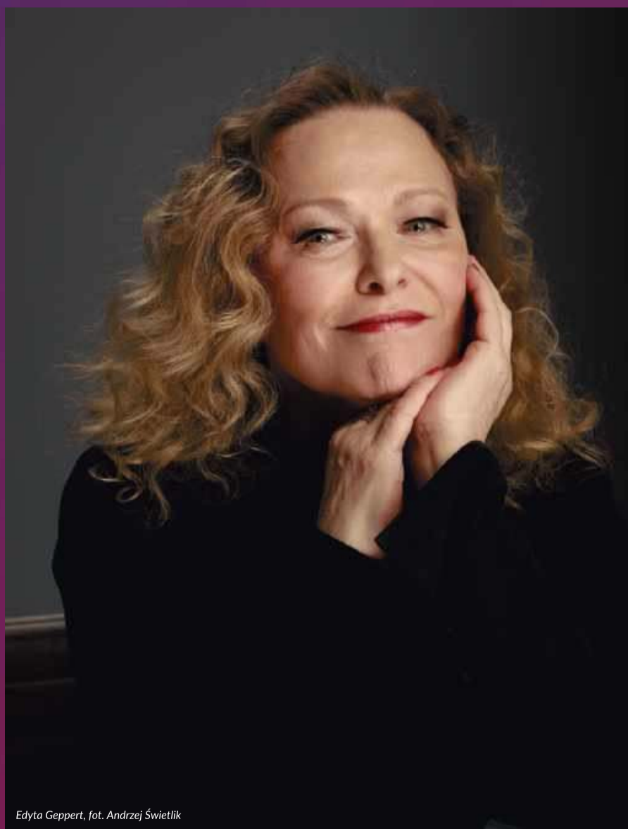
Edyta Geppert