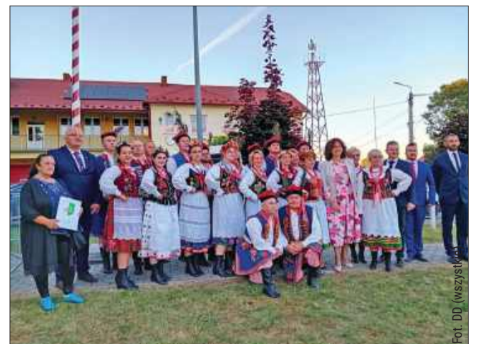
Delegacje sołectw dumnie prezentowały swoje wieńce.