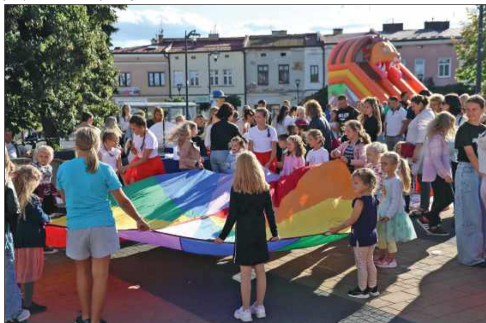
Dzieciaki wspólnie spędzili czas.