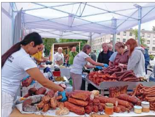
Nie zabrakło pysznych wędlin.