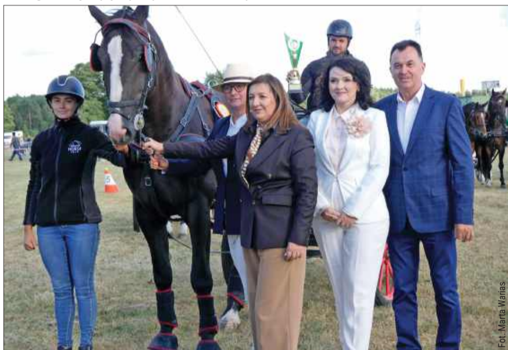
Zwycięzcy w konkursach powożenia z władzami gminy Radomyśl Wielki.