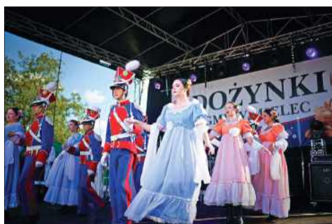
Na scenie pojawili się „Chorzelowiaczy”.