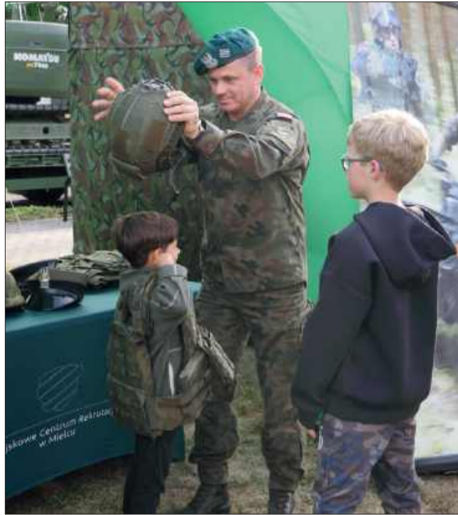
Za mundurem... chłopcy sznurem!