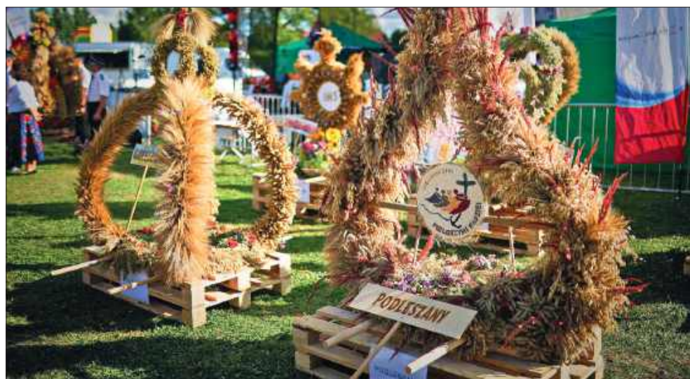
Wieńce zachwyciły misternym wykonaniem.

W niedzielę, 24 sierpnia, Chorzelów stał się sercem gminy Mielec. Na Placu Koronacyjnym przy Sanktuarium Matki Bożej Królowej Rodzin odbyły się Dożynki Gminne – jedno z najważniejszych świąt w kalendarzu lokalnych uroczystości. To czas wdzięczności za plony, pielęgnowania tradycji oraz wspólnej radości mieszkańców i gości.