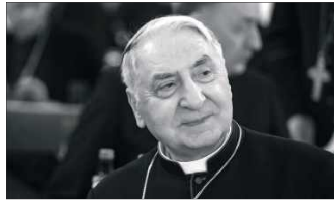
Abp senior Józef Kowalczyk, były Prymas Polski.

W nocy z 19 na 20 sierpnia 2025 roku, w wieku 86 lat, zmarł arcybiskup senior Józef Kowalczyk – nuncjusz apostolski w Polsce w latach 1989–2010 oraz arcybiskup metropolita gnieźnieński i Prymas Polski w latach 2010–2014. Zmarł w szpitalu w Tarnowie, gdzie od ponad trzech tygodni przebywał w poważnym stanie. Pochodził z parafii Jadowniki Mokre w diecezji tarnowskiej.