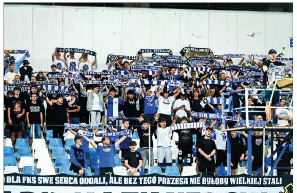
Serce meczu bije właśnie tutaj.