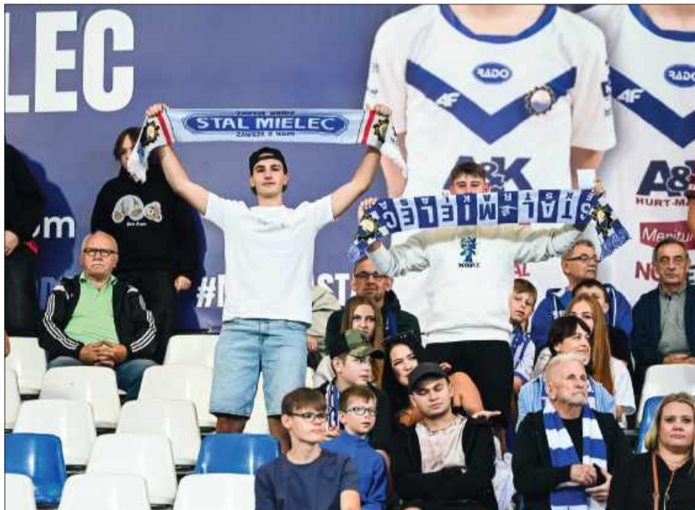
Stal, gramy razem!