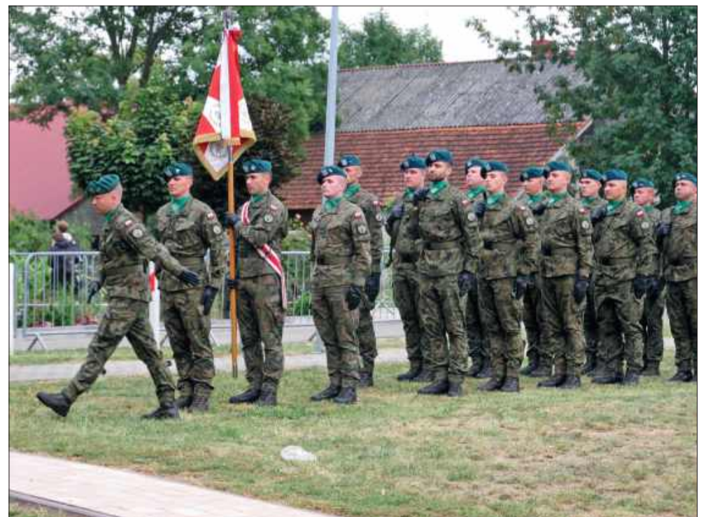
Polska armia należy do najsilniejszych w Europie.