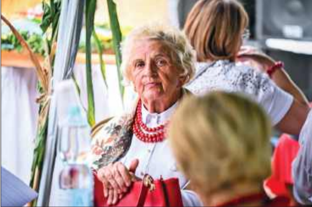
Radość i duma na twarzach uczestników korowodu.