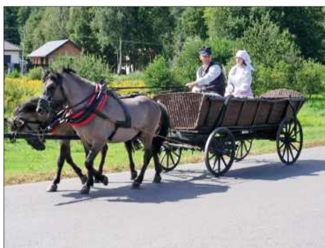
Parada zaczęła się od przejazdów zaprzęgów przez wieś.