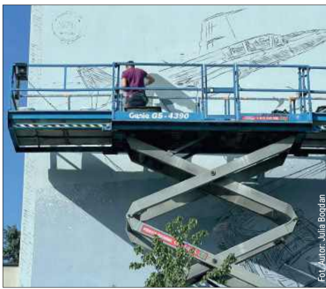
Na muralu widnieją 3 najważniejsze elementy mieleckiego lotnictwa.