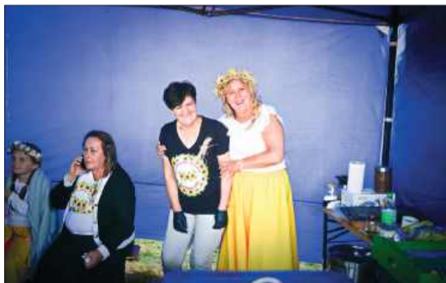
Delegacje kół gospodyń wiejskich z dumą prezentowały swoje wypieki i przysmaki.