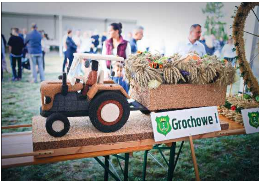
Wieńce były bardzo pomysłowe.

Stadion sportowy w Jaślanach w niedzielne popołudnie tętnił życiem. Mieszkańcy gminy Tuszów Narodowy oraz goście z całego regionu spotkali się, by wspólnie świętować zakończenie tegorocznych zniw.