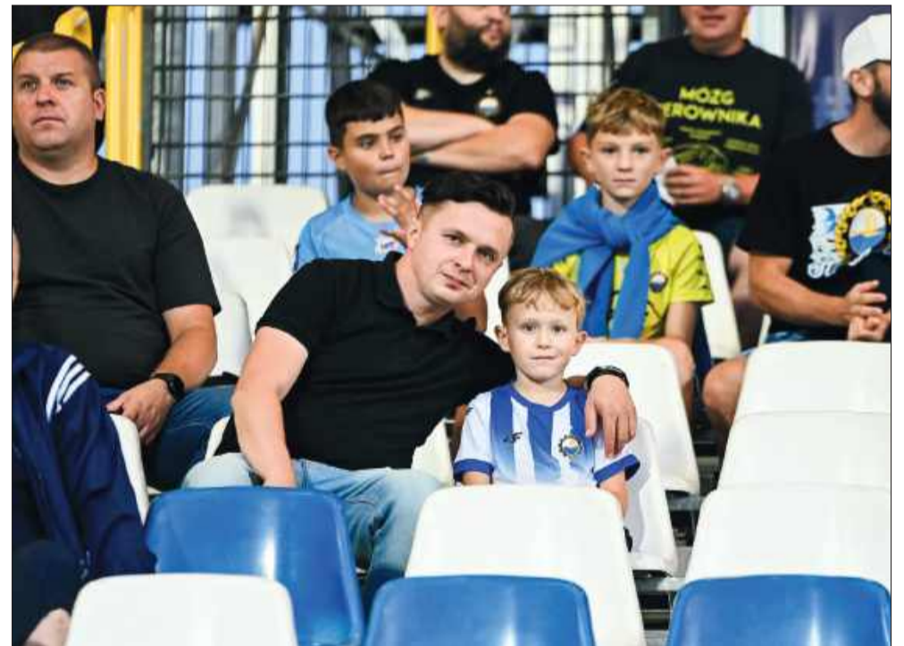
Rodzinna atmosfera – bo piłka nożna łączy pokolenia.