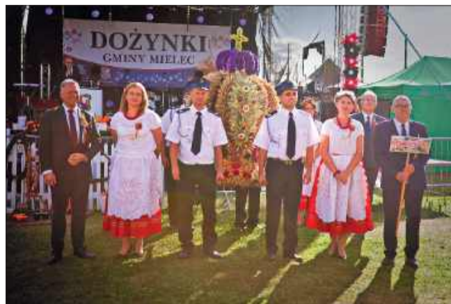
Tradycyjny korowód z wieńcami.