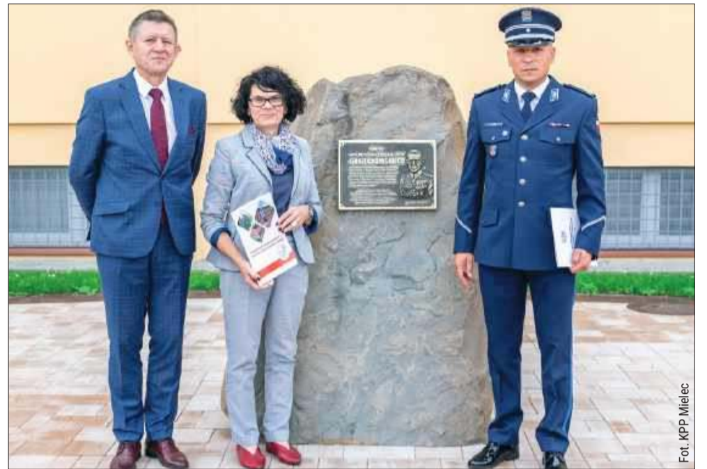
W „Ekonomiku” startuje profil mundurowy.

Podpisane porozumienie stanowi fundament pod utworzenie