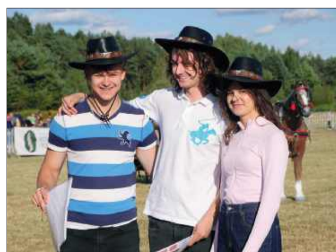
Kapelusze kowbojskie znów w modzie!