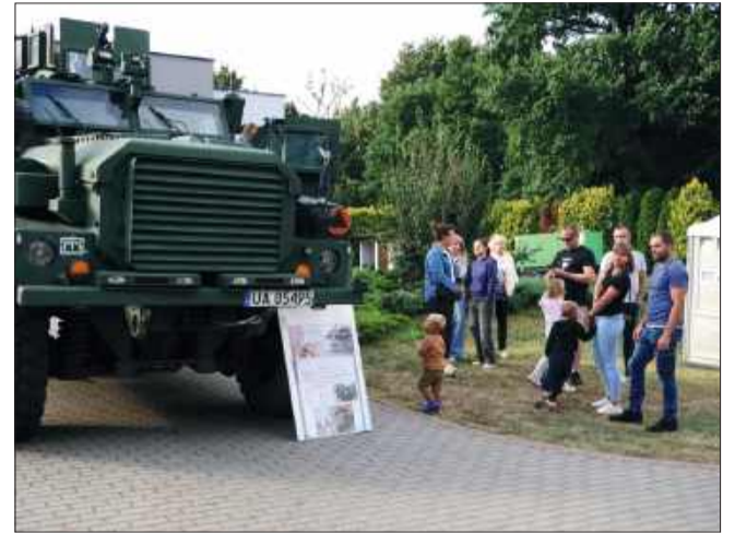
Potężne maszyny robią wielkie wrażenie.