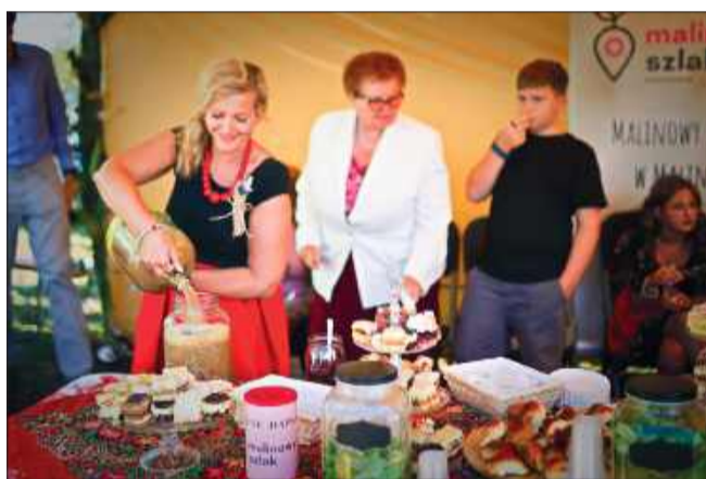
Uśmiechy i kolorowe stroje ludowe wypełniły stadion w Jaślanach.

Dożynki w Jaślanach to nie tylko muzyka i tradycja, ale także mnóstwo atrakcji. Na stadionie stanęły stoiska wystawiennicze i gastronomiczne, można było spróbować lokalnych potraw przygotowanych przez Koła Gospodyń Wiejskich, a także skosztować waty cukrowej, popcornu czy lodów. Najmłodszy bawili się na darmowych dmuchańcach,