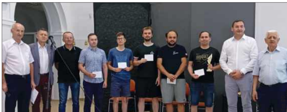
Turniej od 31 lat łączy pokolenia.