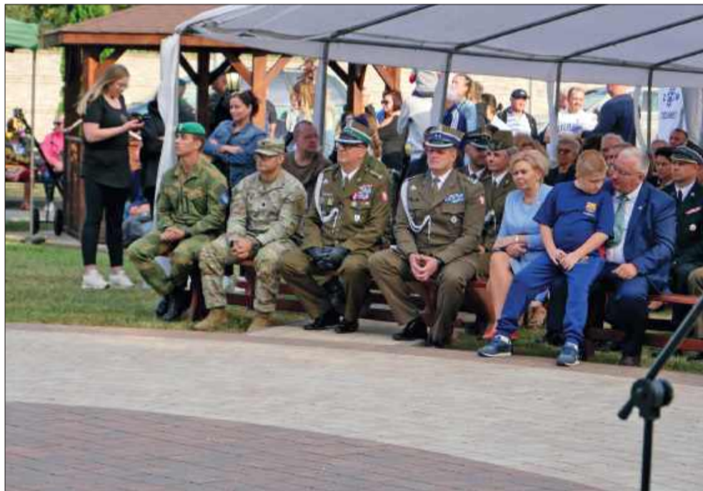
Do Czermina przybyli przedstawiciele wojsk polskich, amerykańskich i norweskich.