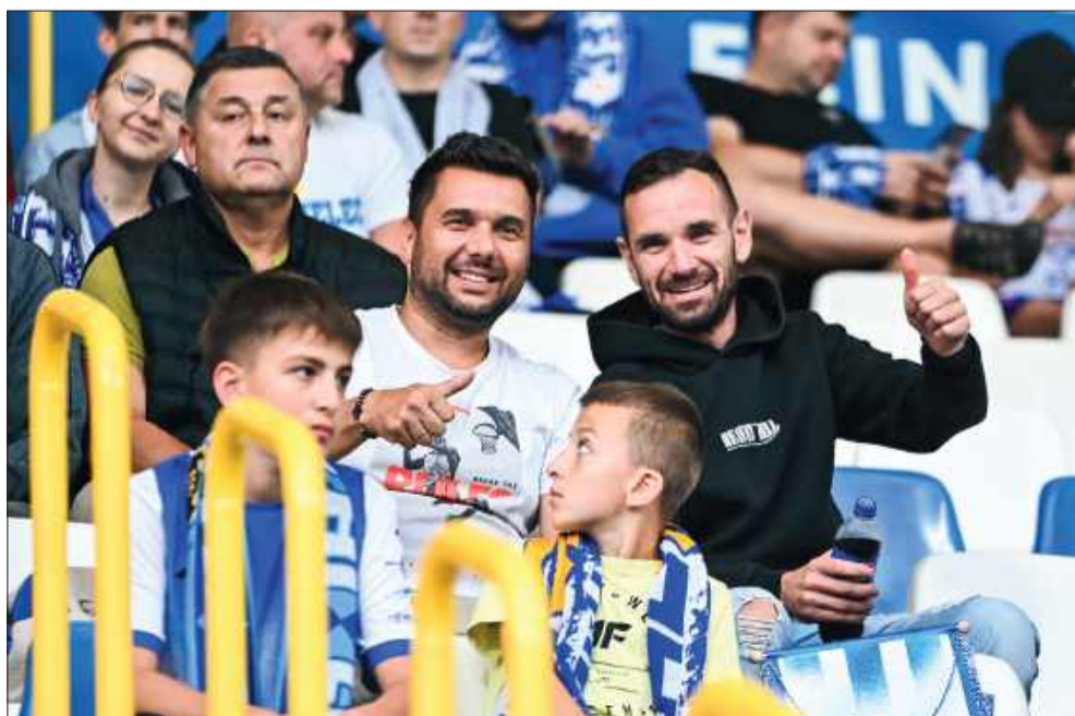
Kibice jak dwunasty zawodnik.