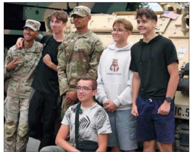
Żołnierze chętnie pozowali do zdjęć.