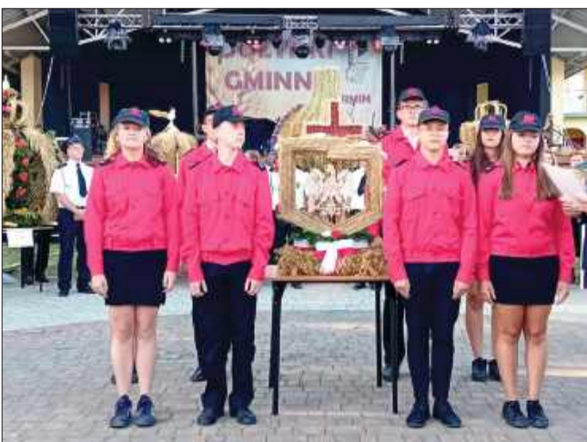
Prezentacje wieńców pokazały bogactwo tradycji regionu.