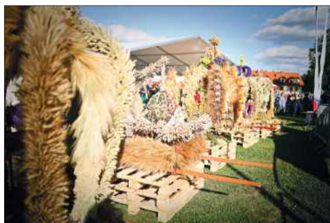
Barwne wieńce dożynkowe – symbol wdzięczności za plony.