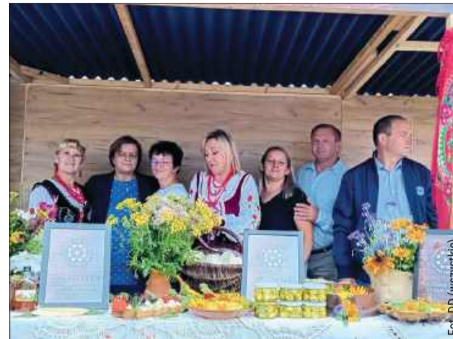
Stoły uginały się pod smakołykami.