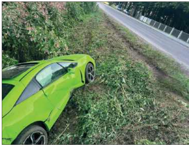
Na szczęście, w wyniku zdarzenia nikt nie odniósł obrażeń.

Na miejsce szybko przybyli funkcjonariusze policji, którzy