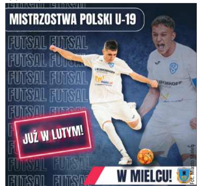
Mielec będzie gospodarzem Mistrzostw Polski w futasu!