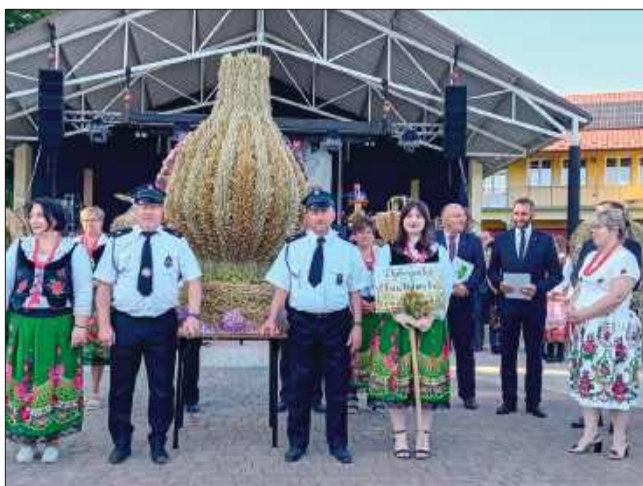
Kolorowe stroje ludowe nadały uroczystości wyjątkowy charakter.