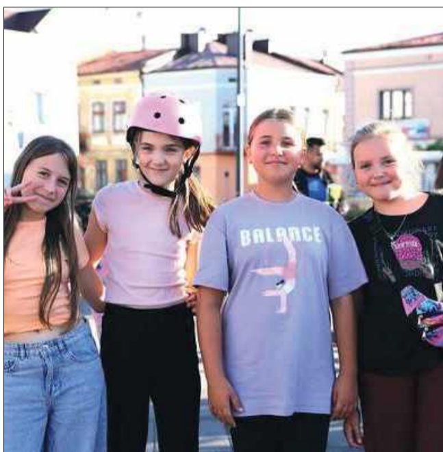
Zabawa była przednia!