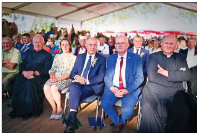
Dożynki to czas spotkań i rozmów.

a wielbiciele koni korzystali z przejażdżek przygotowanych przez Klub Jeździecki Przedświt. Sporą popularnością cieszyły się również stoisko Koła Łowieckiego Przepiórka.