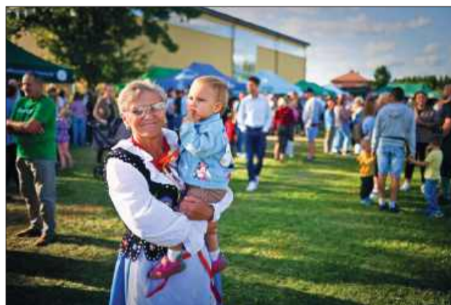
Tradycyjny korowód przeszedł ulicami