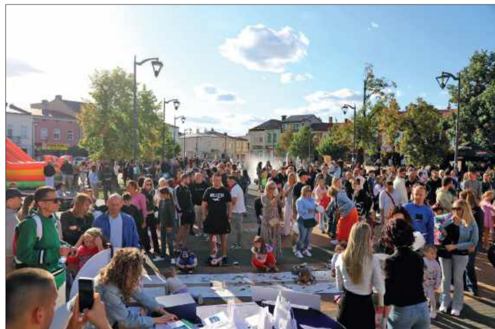
Tłumy na rynku starego miasta pokazują, że takie imprezy mają sens!