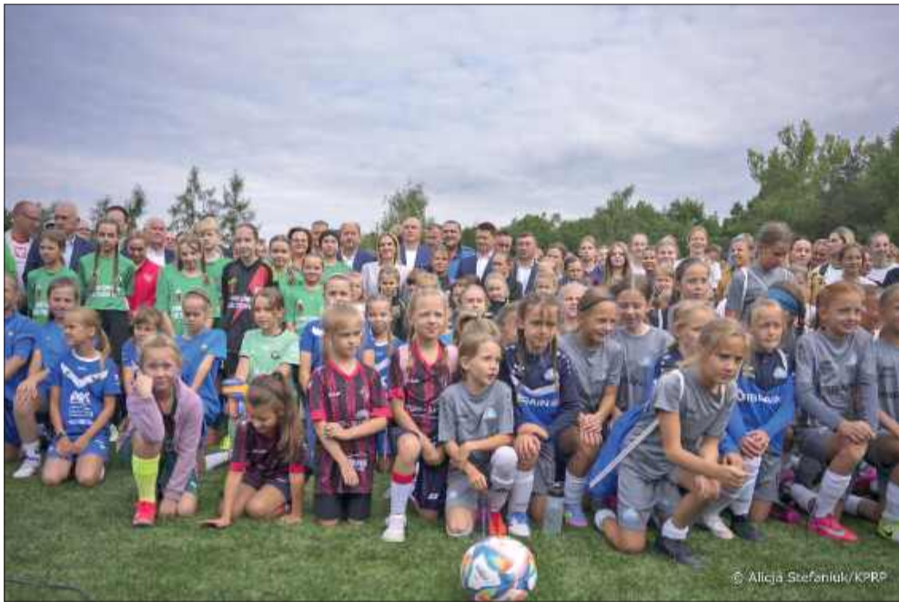
Marta Nawrocka z zawodniczkami.

W Tarnobrzegu Marta Nawrocka obserwowała zmagania zawodniczek w IV Podkarpackim Festiwalu Piłki Nożnej Kobiecej. To największy w Polsce turniej piłkarski kobiet z honorowym patronatem Pierwszej Damy. Wzięły w nim udział drużyny z Mielca i Wadowic Górnych.