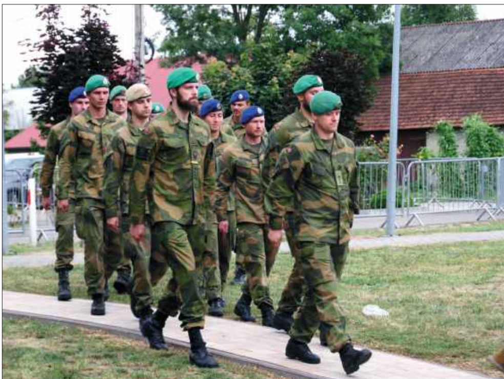
Armia norweska niedawno zaczęła stacjonować na Podkarpaciu.