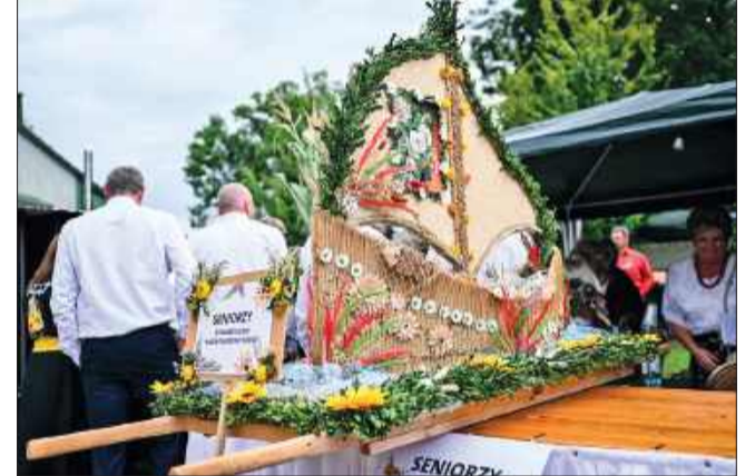
Wieniec przygotowany przez Grupę Seniorów z Brzyźcia