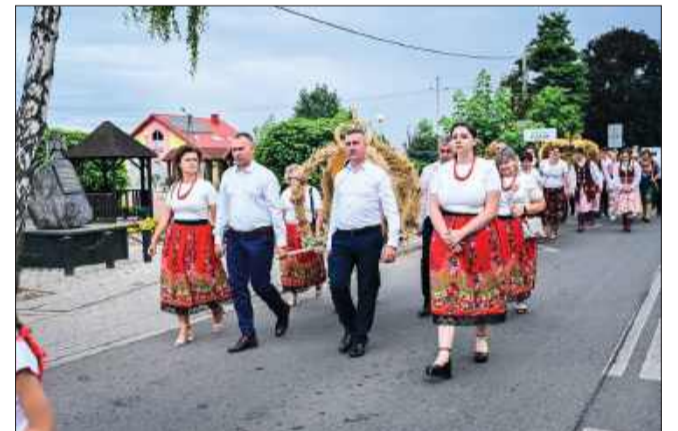
Piękne stroje oddawały klimat dożynek