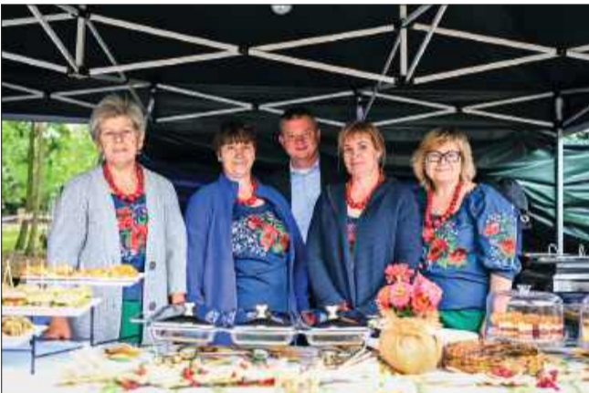
KGW przygotowały mnóstwo tradycyjnych pyszności