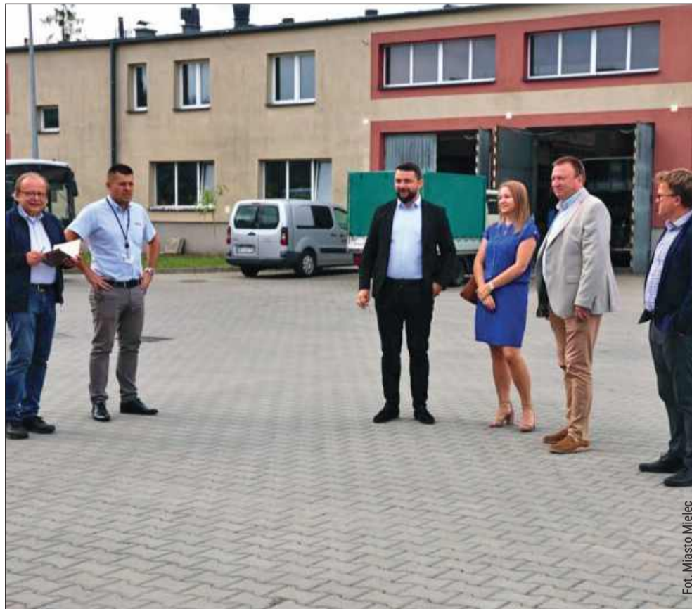
Mielec zainwestował prawie 45 mln zł z funduszy europejskich

Dzięki unijnemu wsparciu Mielec zyskał m.in.: