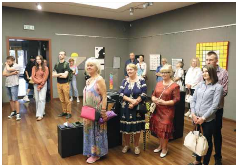
Wystawę „Harmonia nieuchwytna” od 22 sierpnia można oglądać w Galerii ESCEK Domu Kultury SCK.