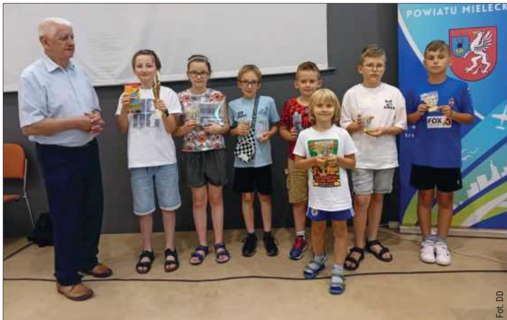
Może w tym gronie są przyszli arcymistrzowie?

W sali wystawienniczej SCK w Mielcu został rozegrany XXXI Międzynarodowy Solidarnościowy turniej szachowy „Sierpień 2025” pod patronatem Starosty Powiatu Mieleckiego Kazimierza Gacka. Partnerem wydarzenia było Województwo Podkarpackie.