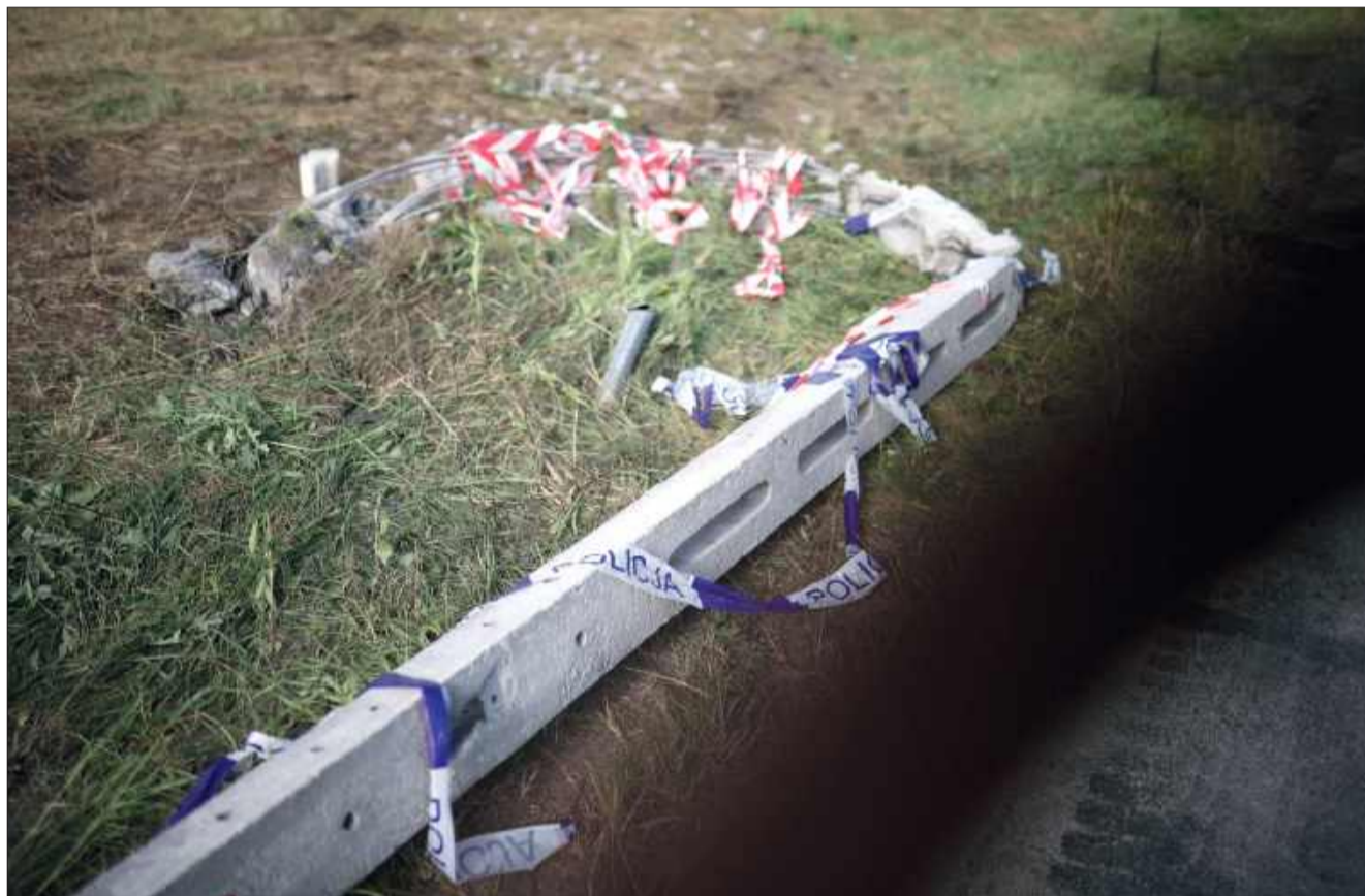
W miejscu wypadku pojawiają się pierwsze zniszczenia.