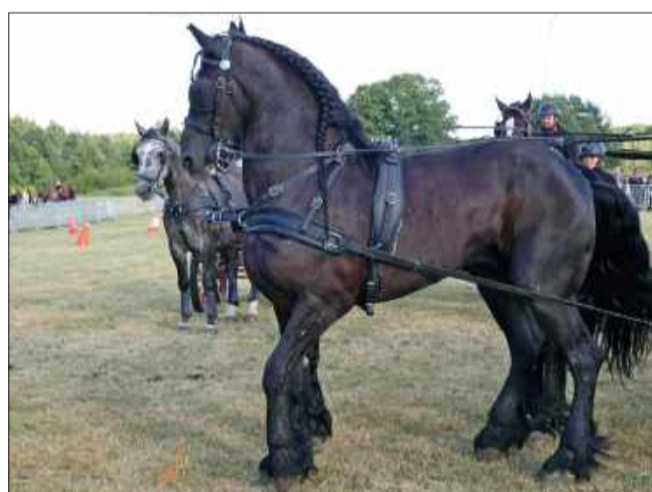
Konie na Paradzie były wyjątkowo piękne.