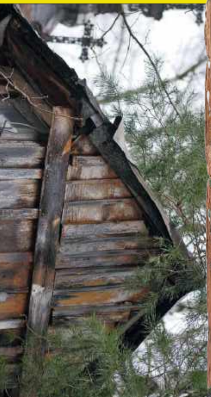
Mamy w powiecie wiele ciekawych miejsc. Jednym z nich jest „kościółek” w Wampierzowie.