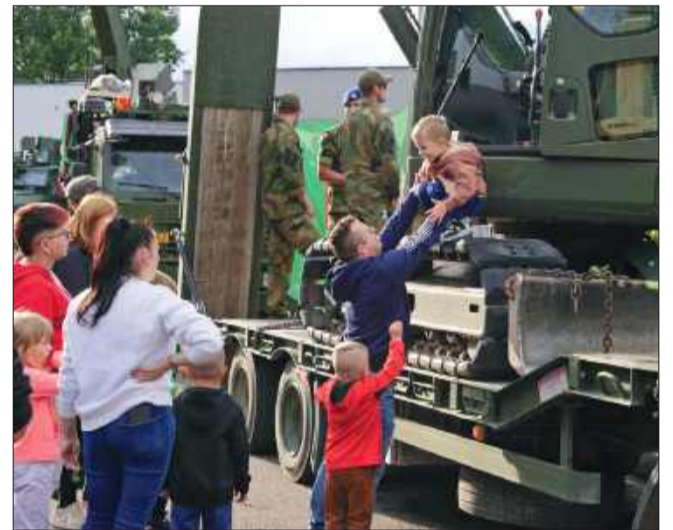
Wojskowe pojazdy wzbudziły podziw najmłodszych i nie tylko.