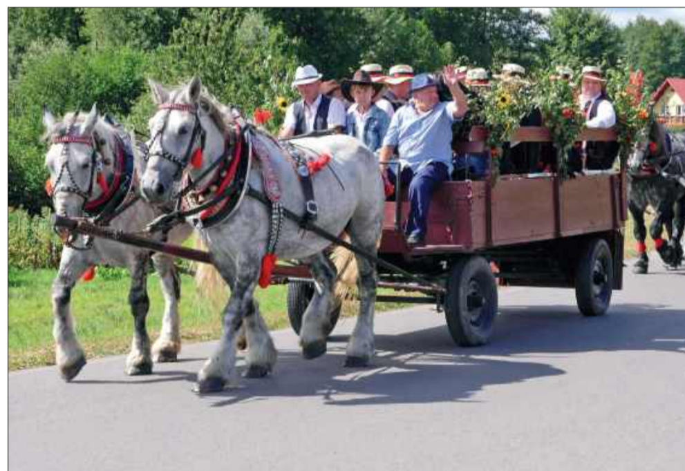
Pięknie udekorowane wozy zachwycały.