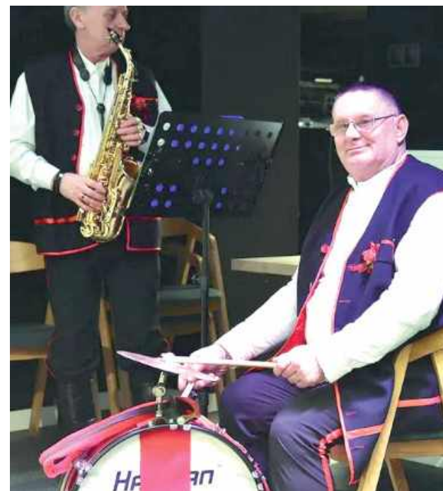
Panowie dawali czadu na bębnie i saksofonie