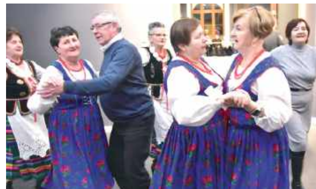
Goście i wykonawcy ruszyli do tańca