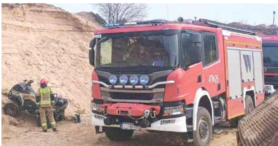
Strażacy prowadzący ćwiczenia na sąsiedniej żwirowni udzielili chłopcu pierwszej pomocy kwalifikowanej

W tym samym czasie w Biardach odbywały się ćwiczenia strażaków z jazdy w trudnym terenie. Strażacy zostali poinformowani przez postronnie osoby, że w wyrobisku na sąsiedniej żwirowni doszło do wypadku z udziałem quada, gdzie jedna osoba została poszkodowana. Na miejsce skierowano trzy zastępy straży pożarnej. Ratownicy udzielili chłopcu pierwszej pomocy, stabilizując odcinek kręgosłupa i kończyny. Następnie dziecko zostało przekazane zespołowi ratownictwa medycznego i przewiezione do szpitala.