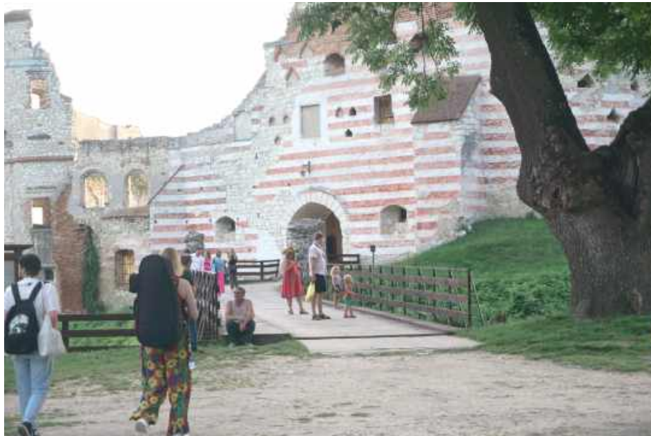
W roku 2024 Zamek w Janowcu odwiedziło przeszło 60 tysięcy osób, co pokazuje liczba sprzedanych biletów, a turystów odwiedzających park i skansen było kilka razy więcej