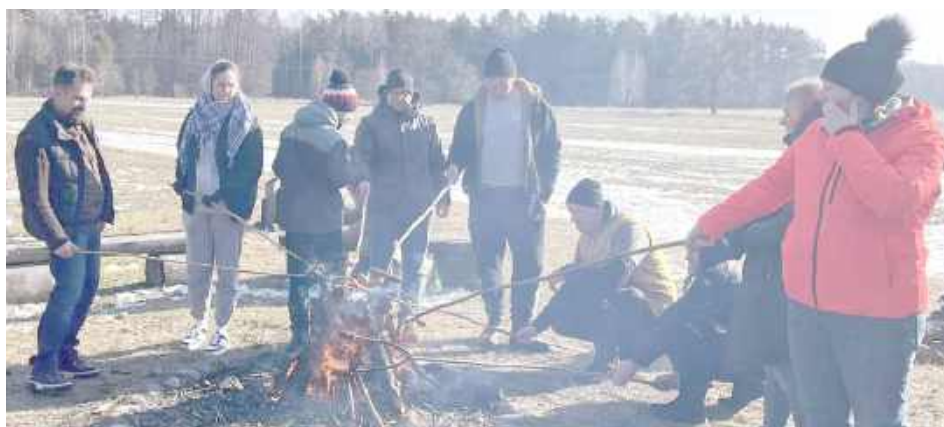
Po zakończeniu spaceru wszyscy mogli ogrzać się przy ognisku i usmażyć kiełbasę

Organizatorem wyprawy był Klub Honorowych Dawców Krwi Ostoja. Uczestnicy spotkali się o godzinie 12:00 na parkingu w Żdźarach, skąd wyruszyli w kierunku pomnika upamiętniającego partyzantów walczących na tych terenach.