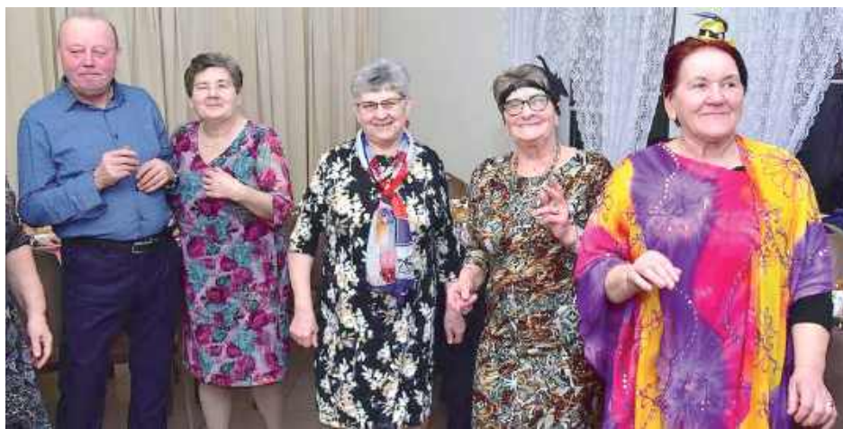
Wydarzenie przebiegło w radosnej atmosferze, pełnej tańca, muzyki i uśmiechów