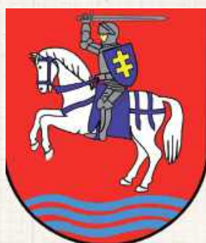
Pierwotna wersja herbu powiatu puławskiego, funkcjonująca w latach 2001-2009

Pierwotnie Wisła zaznaczona była nie jako jeden gruby pas koloru niebieskiego, a trzy węższe.