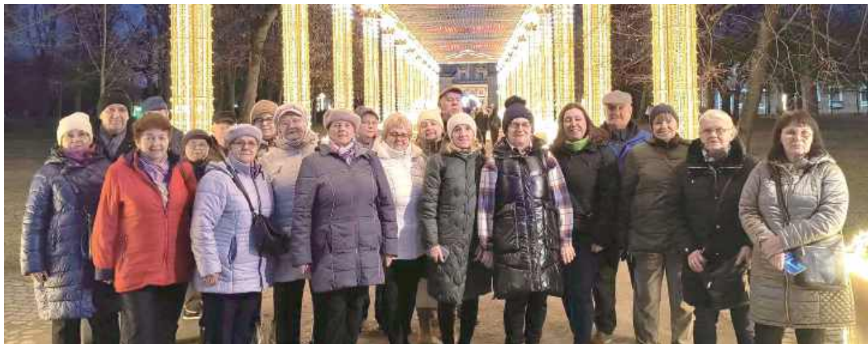
Seniorzy wędrowali wśród magicznych świateł w Wilanowie

Członkowie Klubu Seniora Gminy Łuków „Teraz pora na Seniora” wybrali się na wyjątkową wycieczkę do Warszawy i Wilanowa.