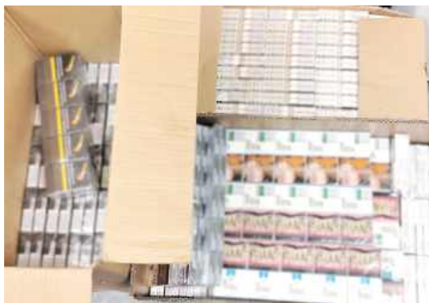
Ukryte na strychu papierosy nie trafią na rynek

Z informacji jakie mieli funkcjonariusze wynikało, że mieszkający tam 48-latek przechowuje w swoim mieszkaniu