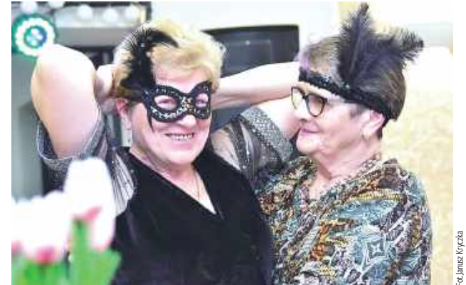
Seniorki dały się ponieść muzyce i zaprezentowały swoje najlepsze taneczne kroki