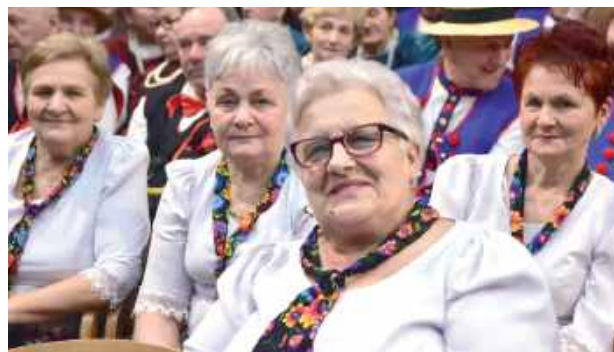
Fajnie było wystąpić i obejrzeć występy koleżanek i kolegów z innych zespołów

To wydarzenie na długo pozostanie w pamięci uczestników, a jego pierwsza edycja zapowiada, że stanie się nową tradycją w kalendarzu kulturalnym gminy Adamów.