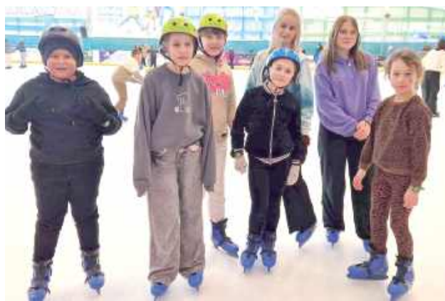
Niezapomniane chwile na lodowisku