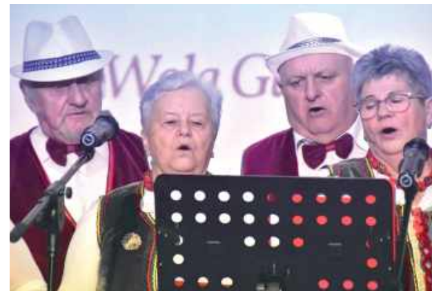
Zabrzmiały ludowe pieśni kusakowe