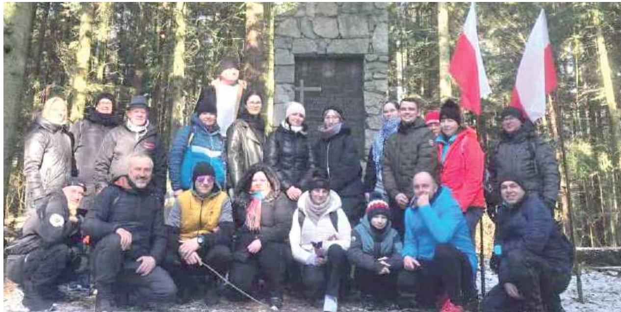
Organizatorem wyprawy był Klub Honorowych Dawców Krwi Ostoja