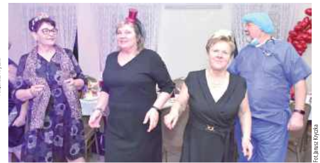
Seniorzy świetnie bawili się przy muzyce, nie schodząc z parkietu. Przybył nawet pan doktor z Leśnej Góry