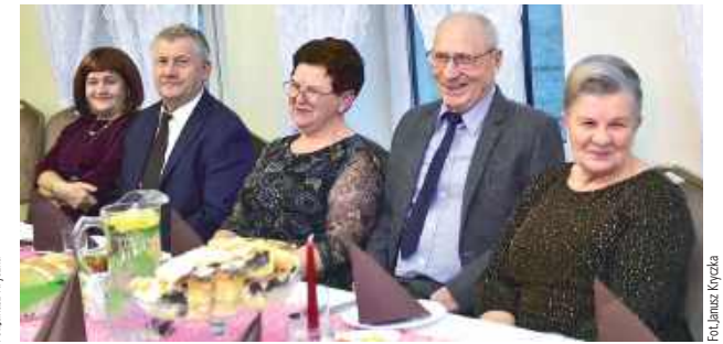
Pyszne dania i wspólne biesiadowanie umiliły wieczór wszystkim gościom