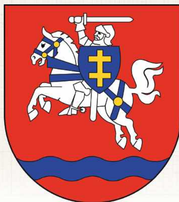
Herb ustalony w roku 2009