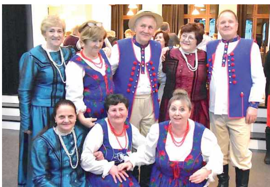
Spotkanie było okazją do integracji artystów

Organizatorami wydarzenia byli Dom Kultury-Pomnik Czynu Bojowego