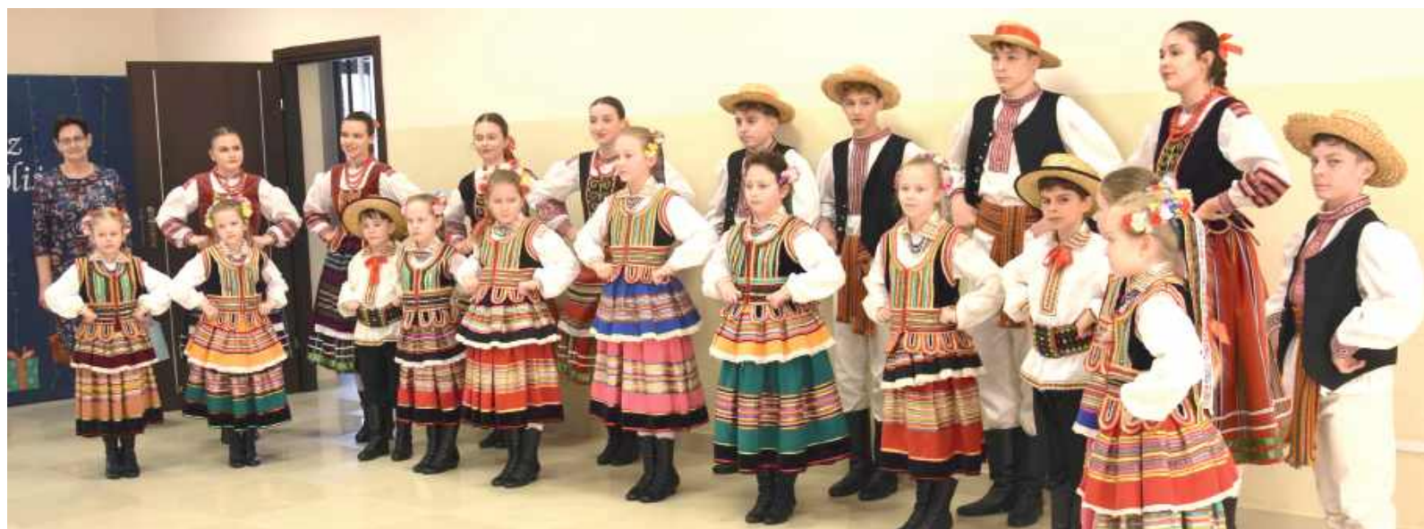
Dziecięcy Zespół Regionalny „Łuków” wystąpił dla Sekcji Emerytów i Rencistów Związku Nauczycielstwa Polskiego w Staninie