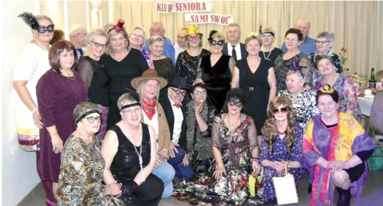
Kolorowe przebrania dodały uroku i wprowadziły wyjątkowy klimat balu

GMINA STOCZEK ŁUKOWSKI W Starych Kobiątkach odbył się 24 lutego Karnawałowy Bal Seniora, który zgromadził licznych członków Klubu Seniora Sami Swoi oraz sympatyków aktywnego spędzania czasu.