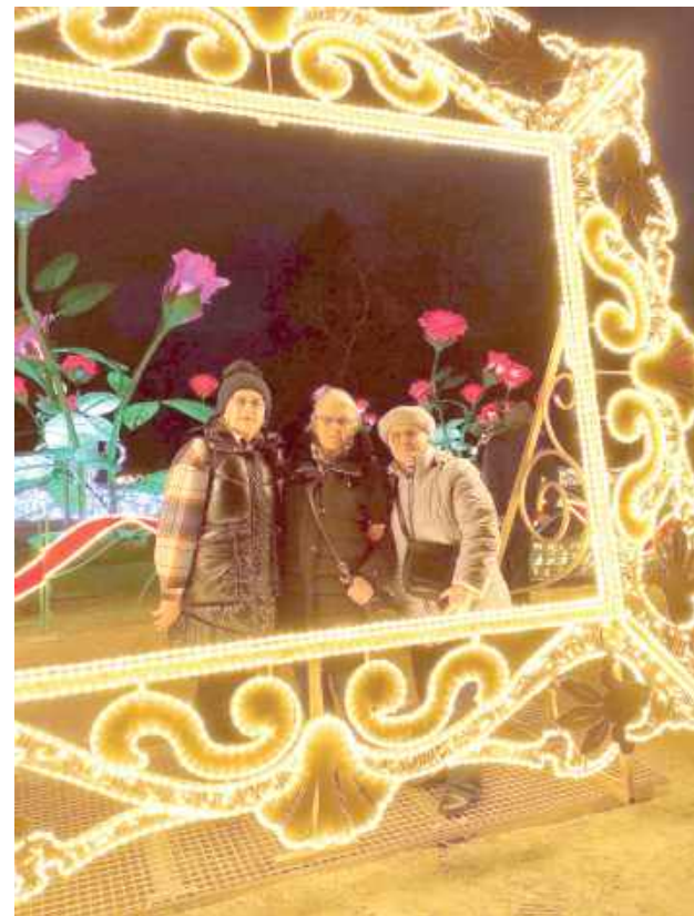
Na wycieczce powstały niezwykle fotografie