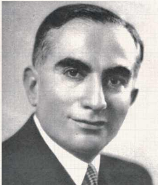
4 czerwca 1941 r. Moryc Edelstein, kongresmen urodzony nad Krzną, wygłosił płomienną mowę, w której ostro potraktował deputowanego z Mississippi Rankina, będącego zwolennikiem pokoju z Niemcami i ewidentnym antysemitą, który powiedział m.in. kilka zdań na temat „żydowskiego spisku”. W chwilę potem polsko-żydowsko-amerykański polityk zmarł na zawał

- Panie Przewodniczący - Wall Street i mała grupa naszych tajnych zrzeszeń żydowskich wciąż próbują naciskać na prezydenta Stanów Zjednoczonych, by wciągnął nas w wojnę w Europie, a w tym samym czasie elementy komunistyczne w całym kraju pod-