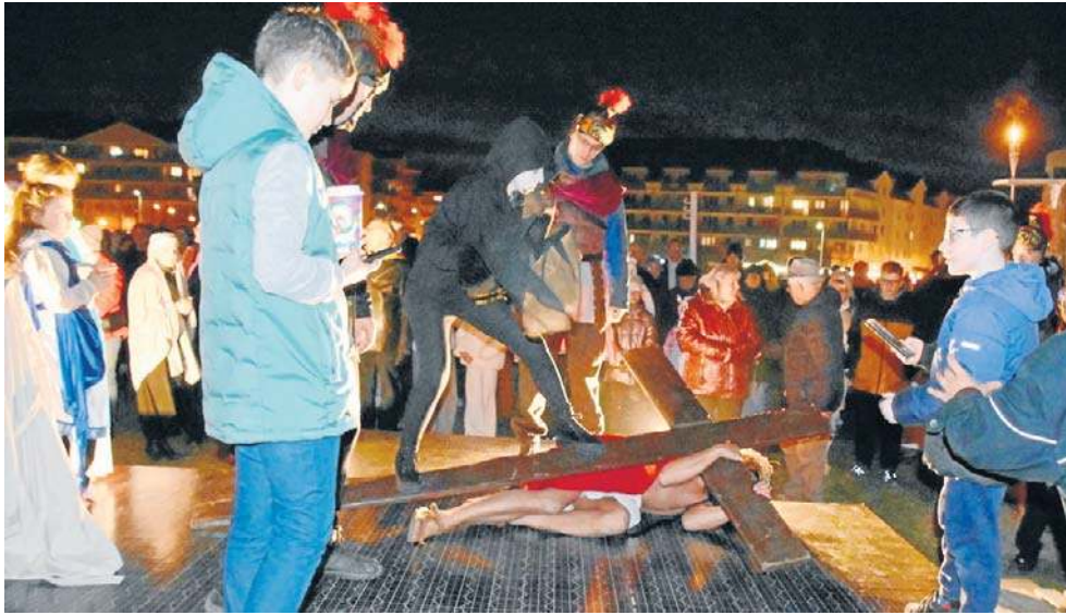
W wystawieniu tegorocznego Misterium brała udział grupa około sześćdziesięciu osób

W wystawieniu tegorocznego Misterium brała udział