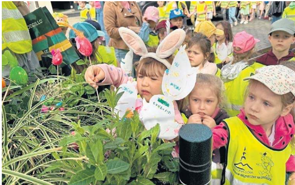
Tak w ubiegłym roku wyglądały poszukiwania świątecznego zajęczka na zielonogórskim deptaku