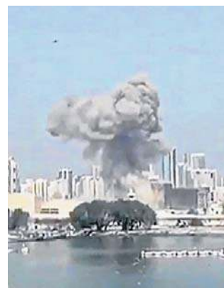
Wojna na Bliskim Wschodzie rozpoczęła się 28 lutego

W niedzielę nad ranem izraelska armia przekazała oficjalnie, że w walkach w południowym Libanie zginął jeden z jej żołnierzy. To już piąty woj-