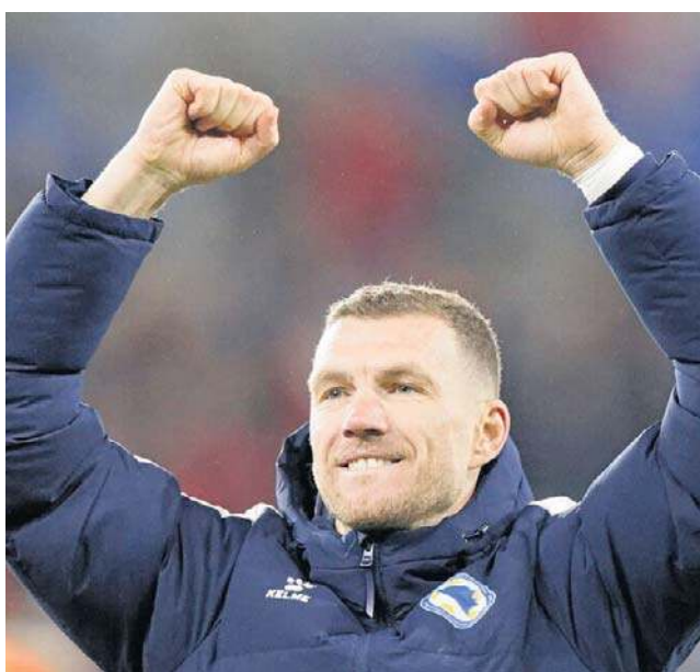
Edin Dzeko wciąż odczuwa niedosyt, związany z grą w narodowych barwach. Marzy o dużym turnieju