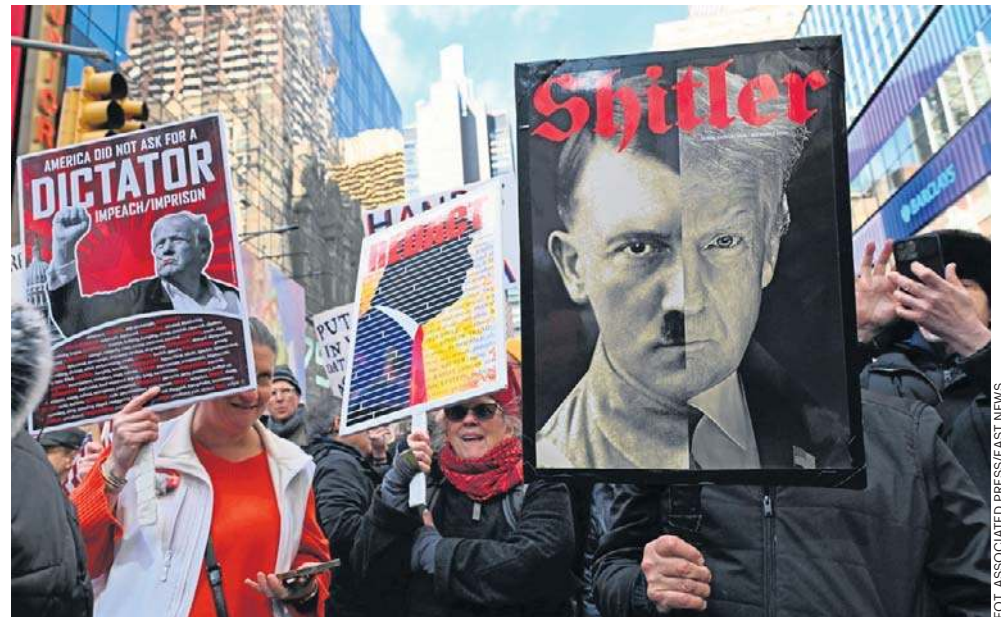
Przeciwnicy Trumpa wyszli na ulice m.in. Nowego Jorku (na zdjęciu), Chicago i Houston. Ale demonstracje odbywały się także w wielu mniejszych miejscowościach

Tak jak w przypadku poprzednich manifestacji w ra-