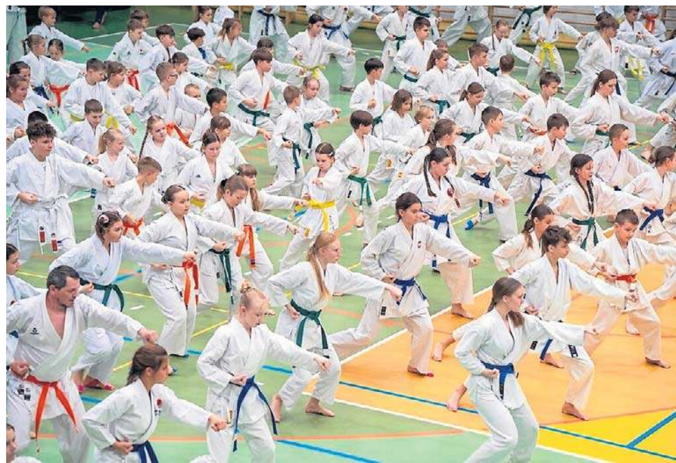
Hala sportowa w sobotnie popołudnie pękała w szwach

- To spełnienie marzeń, nie można sobie wyobrazić lepszego sposobu na trening, jak zaproszenie najlepszych. A to są prawdziwi mistrzowie. Długo dojrzewaliśmy do tego, bo to są ogromne koszty. To nie byłoby możliwe bez naszych klubowiczów, rodziców, sponsorów, wsparcia władz miasta. Zawodnicy z naszego klubu i przyjeźdźni z całej Polski, ale też z Niemiec, Litwy, Czech mieli okazję uczyć się od najlepszych. Różnice kulturowe są ogromne, Japończycy są otwarci, ale z drugiej strony bardzo skrupulatni,