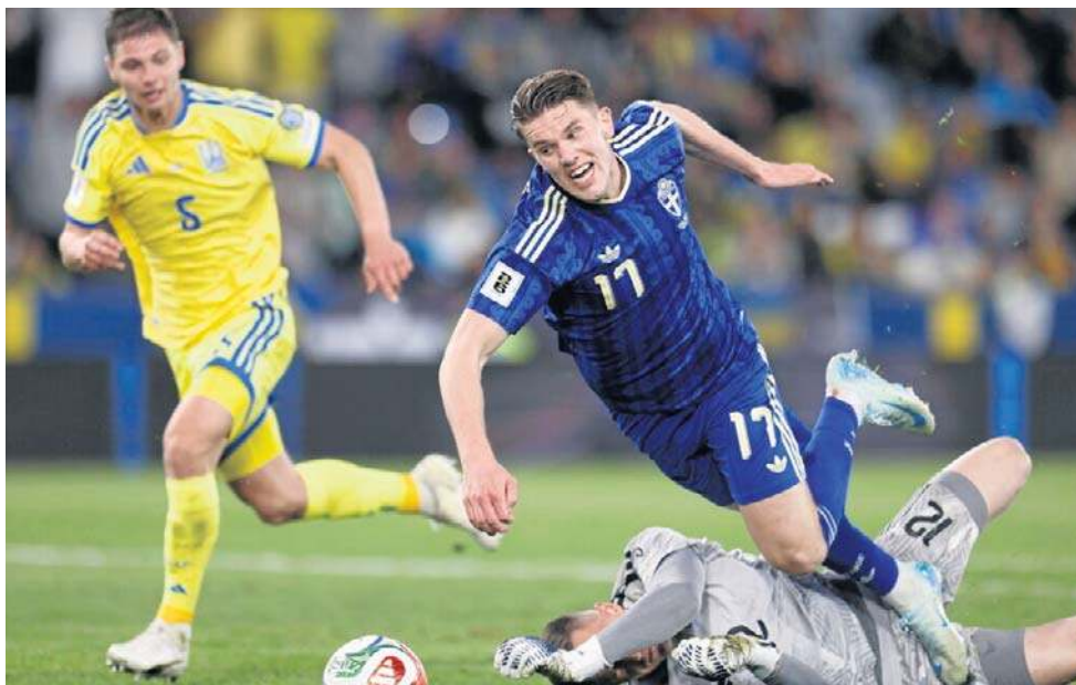
Potwór Gyök Ness, czyli Viktor Gyökeres, będzie straszył Polaków w Sztokholmie

„Widać, że nasz nowy przywódca Graham Potter, który