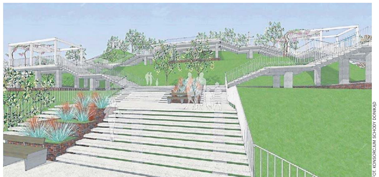
Schody Donikąd na koncepcji, która została przedstawiona rok temu

W ramach konkursu rozdysponowano 94,4 mln zł. Na liście samorządów, które dostały pieniądze, jest dziesięć gmin. Wśród nich dziewięć jest z południa i jedna z północy.