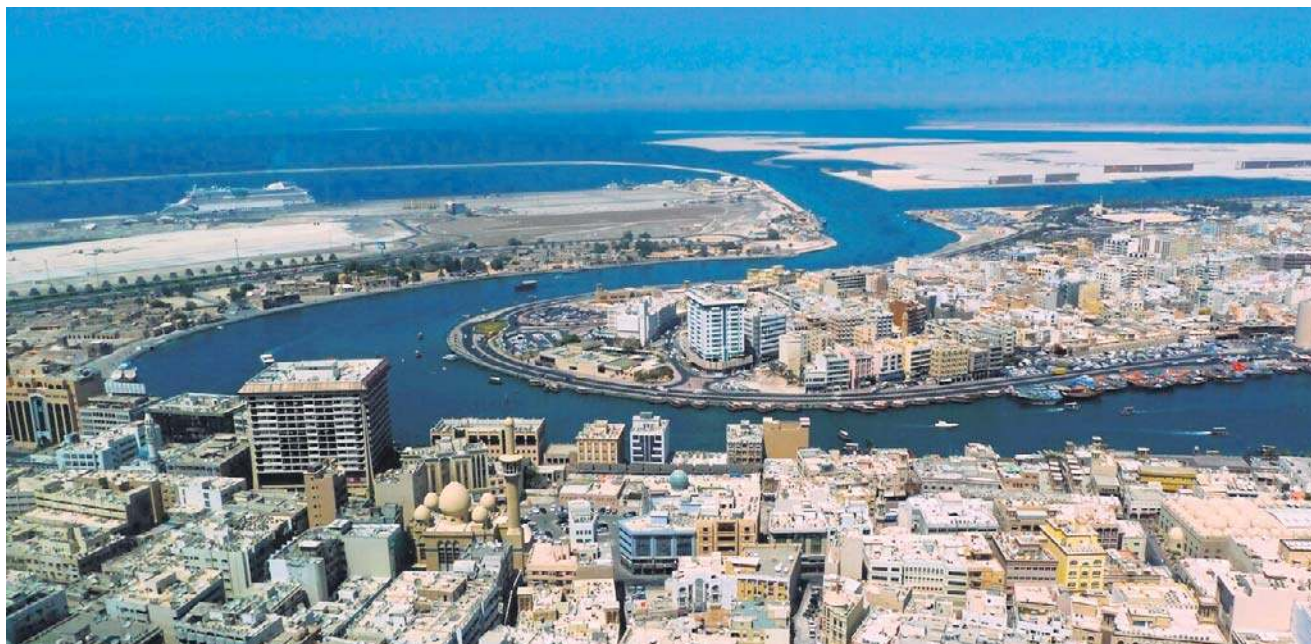
Stare miasto Creek wokół którego rozrósł się Dubaj