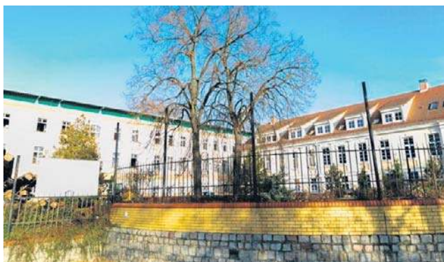
Centrum Usług Społecznych ma się mieścić przy ul. Teatralnej