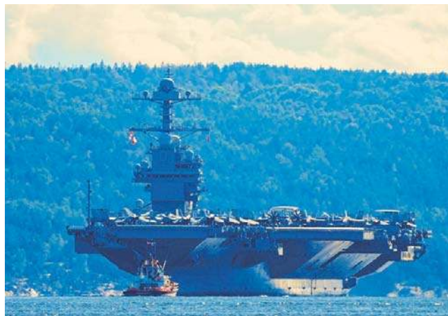
Lotniskowiec USS Gerald R. Ford to największy okręt wojenny, jaki kiedykolwiek zbudowano

Okręt ostatni raz był w Splicie w październiku 2025 roku, a po raz pierwszy - w czerwcu 2023 roku. PAP