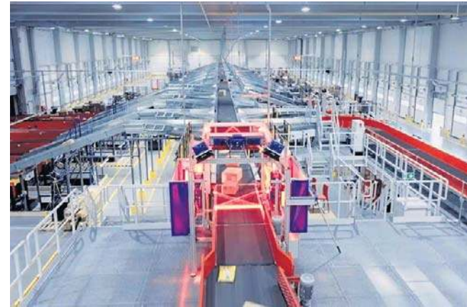
DPD w Gorzowie będzie miało nową siedzibę. Już powstaje nowoczesny magazyn

Cały kompleks, którego częścią jest nowa hala, docelowo będzie składał się z trzech budynków o łącznej powierzchni ponad sześćdziesięciu tysięcy metrów kwadratowych. Pierwszy z nich powstał już kilka lat temu. Lokalizacja inwestycji w pobliżu drogi ekspresowej zapewni dogodny dostęp do głównych szlaków transportowych.