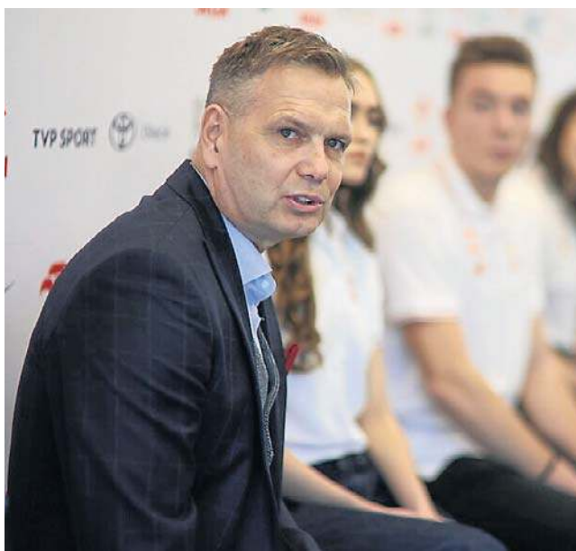
Prezes lekkoatletycznej centrali Sebastian Chmara jest jednym z sześciu polskich halowych mistrzów świata

Nie o to chodzi, aby wskazywać konkretne nazwiska i wywoływać poszczególnych zawodników do tablicy. Sportowcy potrafią wyciągać wnioski z porażek i jestem przekonany, że tak będzie i tym razem. Ci, którym się nie udało, już analizują swoje starty i planują dalsze przygotowania. Nie ma sensu oglądać się za siebie, bo sport jest przecież nieprzewidywalny, pełen emocji, zwycięstw i porażek. Widzieliśmy