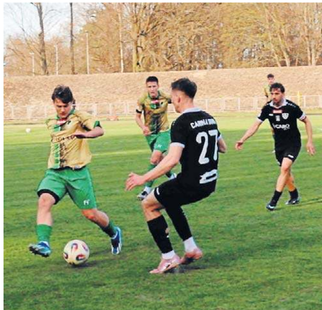
Piłkarze Cariny Gubin (w czarnych strojach) skutecznie powstrzymywali próby ataków zespołu z Pawłowice

Po zmianie stron boiska gorzowianie wciąż mieli przewagę, czego efektem była bramka z rzutu karnego. „Jedenastkę” w 69 min wykorzystał