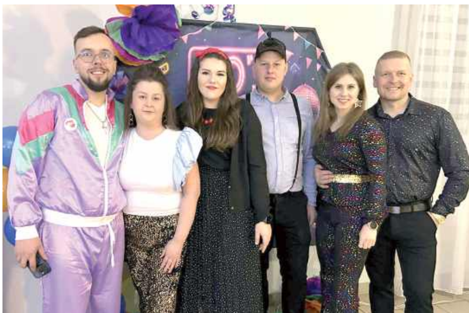
Uczestnicy balu założyli charakterystyczne stroje sprzed kilkadziesiąt lat

Nie zabrakło również kulinarnej podróży w czasie. Stoły uginęły się od tradycyjnych potraw i przekąsek, które dla wielu przywołały smaki dzieciństwa. Wśród nich znalazły się kanapki z paszтетem, serem i ogórkiem