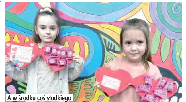
A w środku coś słodkiego