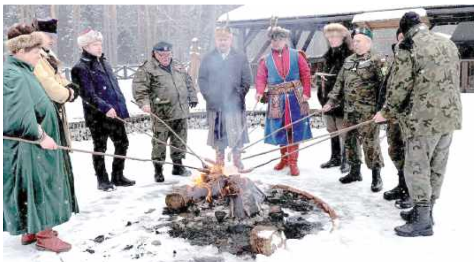
Spotkanie zakończyło się wspólnym ogniskiem

Uczestnicy, wspólnie z nadleśniczym Nadleśnictwa Łu-