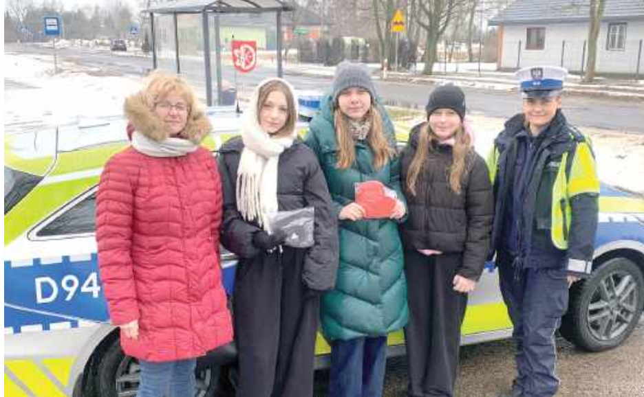
Akcja miała na celu zwrócenie uwagi na odpowiedzialność uczestników ruchu drogowego oraz promowanie bezpiecznych zachowań na drodze

Uczennice wręczały kierowcom symboliczne kartki w kształcie serc. Czerwone