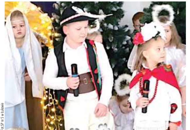
Przedszkolaki z grup „Motylki” i „Słoneczka” podczas uroczystych jasełek z okazji Dnia Babci i Dziadka