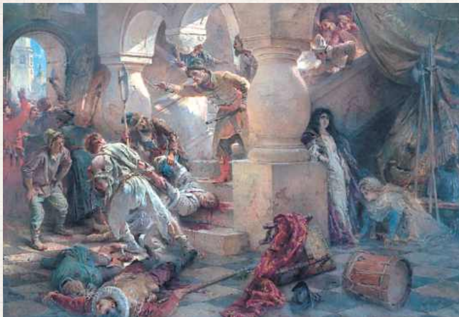
Śmierć Łędymitra.

bystrzejszy z nich, Jerzy Mniszech zdiagnozował sytuację, było już za późno. Opozycja nie próżnowała. Na jej czele stał Wasyl Szujski, jeden z najsprawniejszych polityków kraju. Początkowo wspierał Samozwańca, potem popadł z nim w konflikt i został skazany na karę śmierci. Wyrok zamieniono na wygnanie, a nawet po chwili i to odwołano. Szujski wrócił do Moskwy i natychmiast stworzył, umiejętnie grając na kilku - politycznej, społecznej, religijnej - bałajkach spisek. 27 maja nad ranem bunt eksplodował. Dobrze przygotowane grupy wdarły się do carskich komnat. Na temat okoliczności zabójstwa Dymitra mamy kilka relacji, nie ulega wątpliwości, że od początku jego los był przesadzony. Marynie udaje się wymknąć: niewysoka, bez szat, biżuterii, makijażu, wyzbyta carskiego majestatu, wymknęła się nierozpoznana między damami dworu, ponoć ukrywając się pod suknią najtejszej z nich. Potem zaboboni-