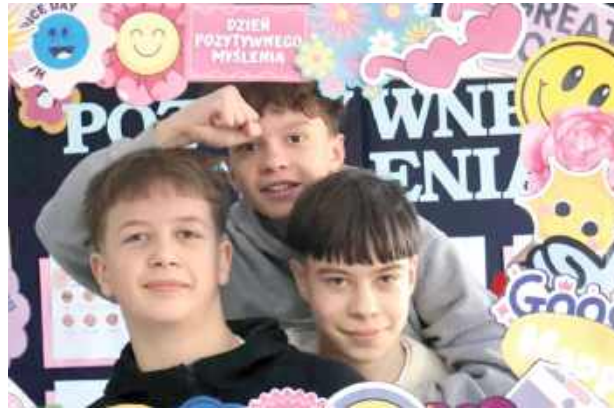
Do zdjęć chętnie pozowali również chłopcy