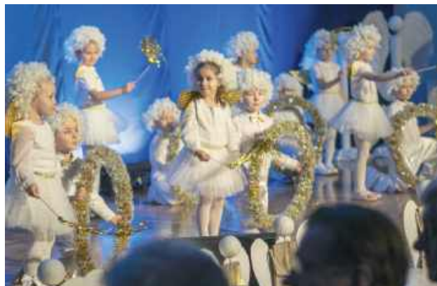
Finałowi towarzyszył koncert oraz występy dzieci