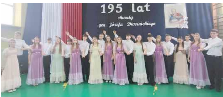
Podczas obchodów uczniowie zatańczyli poloneza

W Zespole Oświatowym w Stoczku Łukowskim odbyły się obchody Dnia Patrona poświęcone gen. Józefowi Dwernickiemu oraz 195. rocznicy Bitwy pod Stoczkiem.