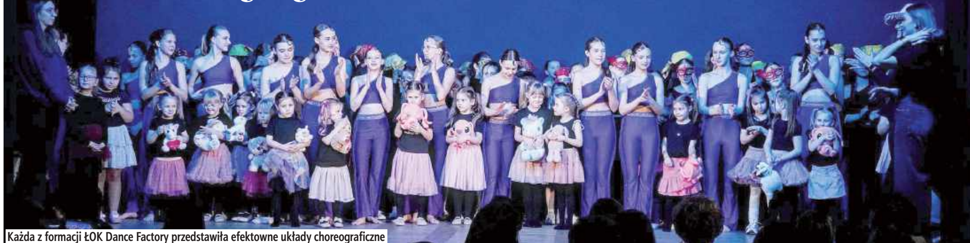
Każda z formacji ŁOK Dance Factory przedstawiła efektowne układy choreograficzne