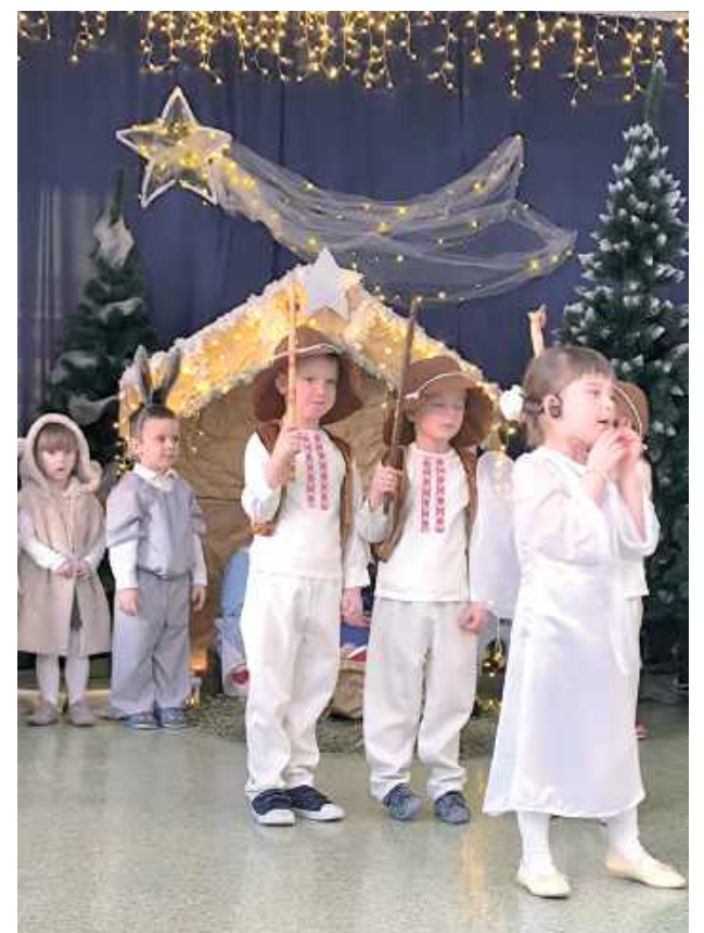
Maluchy świetnie poradziły sobie na scenie