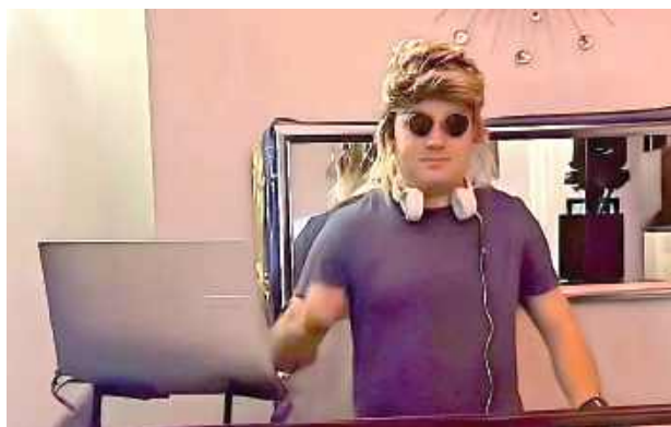
Didżej puszczał przeboje z epoki

Przy stołach toczyły się długie rozmowy o dawnych czasach, sąsiedzkich spotkaniach, pierwszych miłościach i codziennym życiu sprzed lat. Była to okazja do międzypokoleniowej wymiany doświadczeń i budowania wzajemnego zrozumienia.