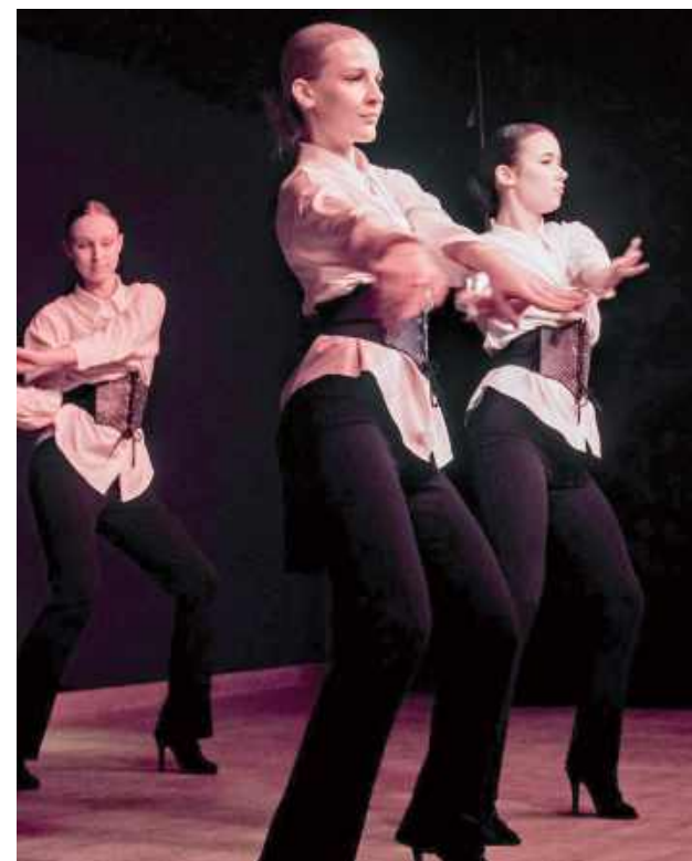
Najstarsza grupa zatańczyła na obcasach