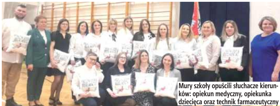
Mury szkoły opuścili słuchacze kierunków: opiekun medyczny, opiekunka dziecięca oraz technik farmaceutyczny

Podczas uroczystości wicedyrektor szkoły wraz z kierowniczką szkolenia praktycznego oraz wychowawcami wręczyły absolwentom świadectwa ukończenia szkoły, listy referencyjne oraz nagrody przyznane przez Radę Pedagogicz-