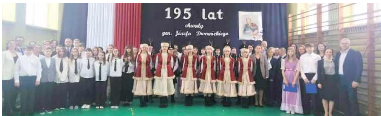
Młodzież poprzez recytację wierszy patriotycznych, śpiew pieśni oraz taniec poloneza i mazura przypomniała historię miasta