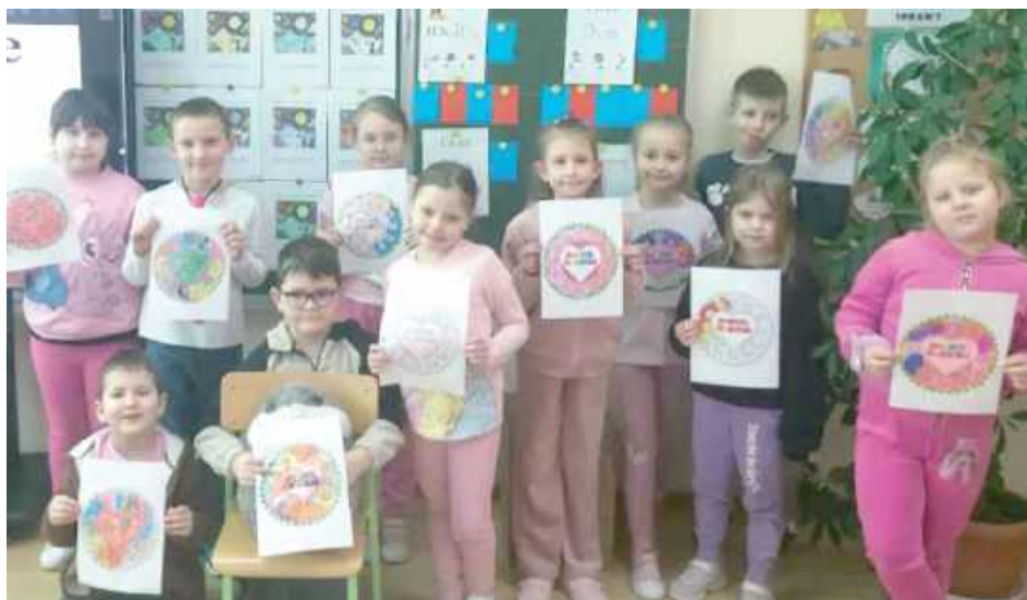
Obchody Dnia Pozytywnego Myślenia miały charakter edukacyjny i profilaktyczny, przypominając uczniom o znaczeniu dbania o dobrostan psychiczny oraz pozytywne relacje w środowisku szkolnym

W Zespole Szkół w Gołąbkach odbyły się obchody Dnia Pozytywnego Myślenia. Wydarzenie zostało zorganizowane z myślą o zwróceniu uwagi uczniów na znaczenie nastawienia psychicznego oraz wpływ myśli na codzienne funkcjonowanie, zdrowie i osiąganie celów.