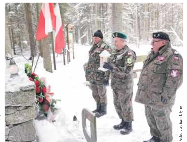
Pod pomnikami złożono kwiaty i zapalono znicze, oddając hołd osobom i wydarzeniom związanym z historią tego terenu

Spotkanie zakończyło się wspólnym ogniskiem. Część uczestników wystąpiła w strojach z epoki, co stanowiło na-