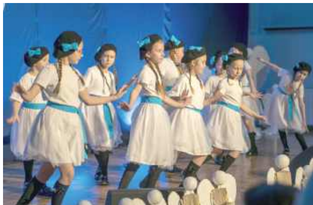
Na scenie zaprezentowały się dzieci z łukowskich szkół