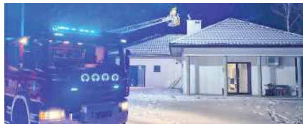
W akcji brały udział jednostki OSP KSRG Krzywda, OSP KSRG Stoczek Łukowski, OSP Podosie oraz JRG Łuków

8 lutego do Stanowiska Kierowania KP PSP wpłynęło zgłoszenie o pożarze sadzy w przewodzie kominowym w miejscowości Rozłaki. Na miejsce zdarzenia zadysponowano zastępy Państwowej i Ochotniczej Straży Pożarnej.