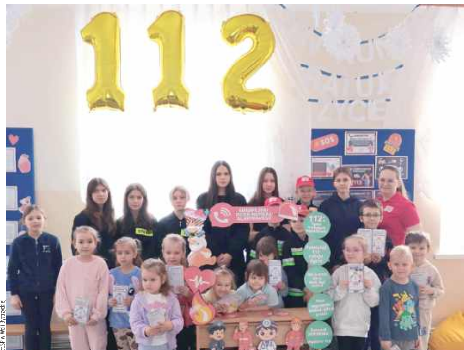
Na szkolnym korytarzu członkowie MDP stworzyli centrum wiedzy o numerze alarmowym 112

Punktem kulminacyjnym dnia były specjalne zajęcia dla