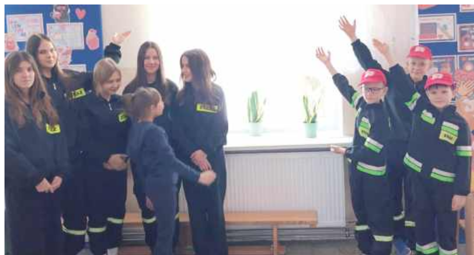
Z inicjatywy członków Młodzieżowej Drużyny Pożarniczej przygotowano akcję edukacyjną o numerze 112

W Szkole Podstawowej w Woli Bystrzyckiej obchodzono Europejski Dzień Numeru Alarmowego 112. Z inicjatywy członków Młodzieżowej Drużyny Pożarniczej przygotowano akcję edukacyjną, która przypominała jak prawidłowo wzywać pomoc i dłaczego numer 112 ratuje życie.