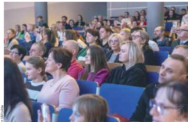
Wydarzenie po raz kolejny połączyło promocję rodzicielstwa zastępczego z konkretną pomocą dla rodzin wychowujących dzieci wymagające szczególnej troski

Pomaganie ma sens, gdy trafia tam, gdzie jest naprawdę potrzebne - tę ideę potwierdził finał jubileuszowej, dziesiątej edycji akcji „Aniołkowe Granie”, który odbył się 11 lutego w auli I Liceum Ogólnokształcącego w Łukowie.