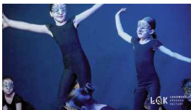
Młode artystki w pełnym ekspresji tańcu w karnawałowych maskach

W Sali Widowiskowej Łukowskiego Ośrodka Kultury odbyły się dwa widowiska taneczne „W rytmie karnawału”.