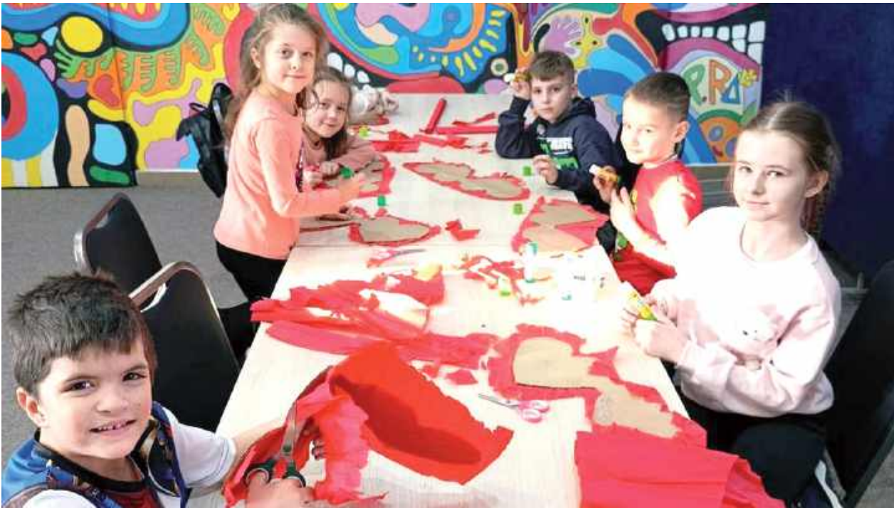
Tym razem tematem przewodnim prac były Walentynki

W Gminnym Ośrodku Kultury w Trzebieszowie odbyło się kolejne spotkanie w ramach zajęć kreatywnych dla dzieci.