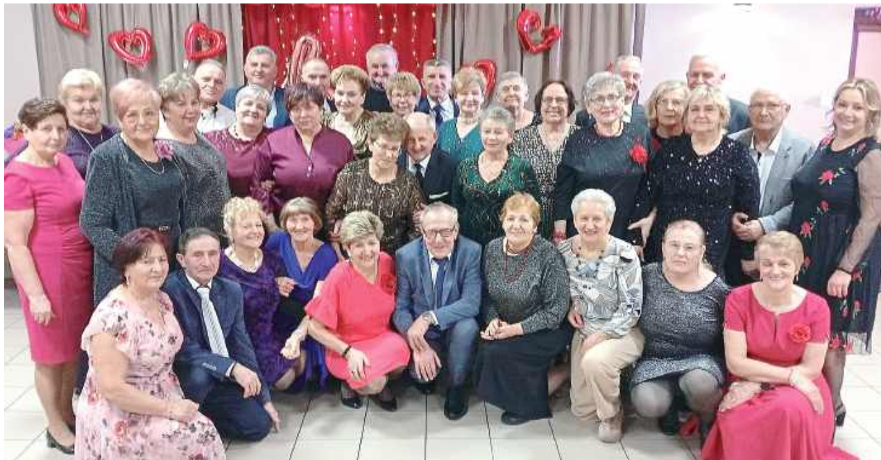
Wspólne zdjęcie uwieczniło piękne chwile balu