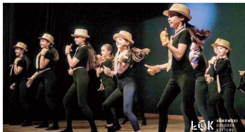
Scena była wypełniona rytmem i młodzieńczą energią