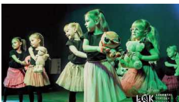
Radość i pasja tańca u najmłodszych tancerzy