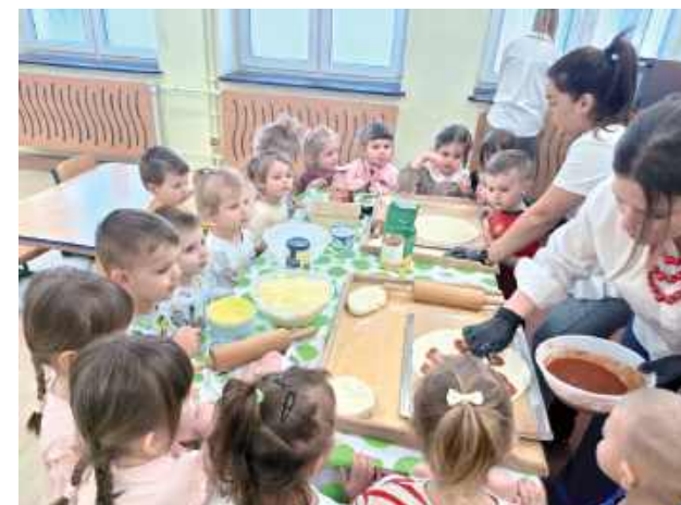
Forma warsztatowa zajęć miała na celu praktyczne zapoznanie dzieci z cyklem przygotowania pizzy od surowych składników do finalnego produktu, zgodnie z technikami stosowanymi w gastronomii

W pierwszej części zajęć przedstawiono informacje dotyczące historii potrawy, jej pochodzenia oraz podstawowych składników niezbędnych do przygotowania ciasta drożdżowego. Omówiono etapy powstawania pizzy – od przygotowania ciasta, przez nanoszenie sosu pomidorowego, po dobór dodatków i wypiek.