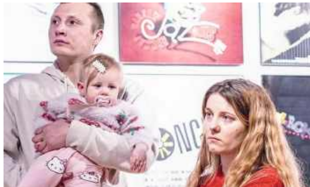
Wystawę „Gżegoż Muczke” można oglądać w Galerii PROwizorium ŁOK do 27 lutego

Jak informuje ŁOK podczas spotkania zaprezentowano