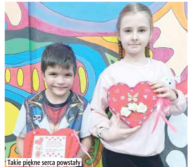
Takie piękne serca powstały