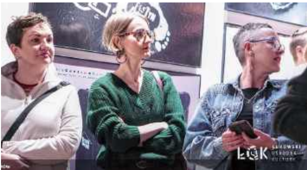
W wydarzeniu uczestniczyli mieszkańcy Łukowa, przedstawiciele środowiska kulturalnego oraz osoby zainteresowane grafiką użytkową i fotografią artystyczną

W Galerii PROwizorium Łukowskiego Ośrodka Kultury odbył się wernisaż wystawy plakatów i fotografii autorstwa „Gżegoża Muczke”.