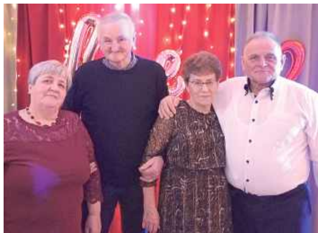
Seniorzy chętnie pozowali do zdjęć