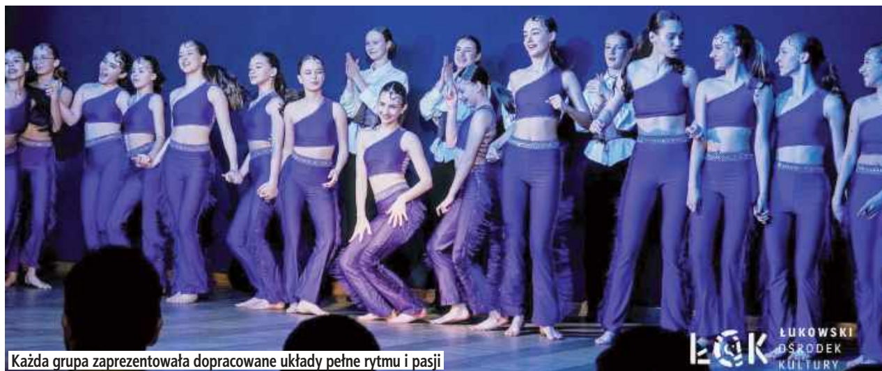
Każda grupa zaprezentowała dopracowane układy pełne rytmu i pasji