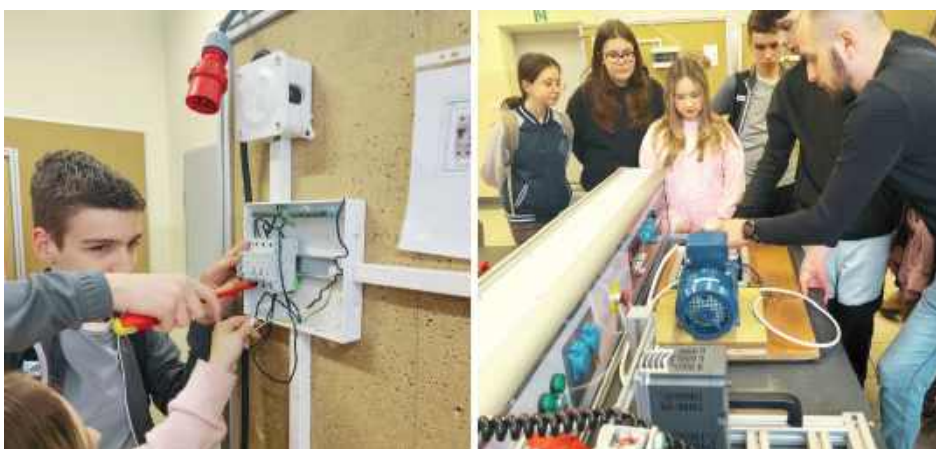
Program warsztatów pozwolił uczniom w krótkim czasie zapoznać się z zagadnieniami: elektryką, elektro-mechaniką, mechatroniką, motoryzacją, mechaniką i innymi

We wtorek, 10 lutego w ramach projektu „Technik w Akcji” 75 uczniów ze Szkół Podstawowych w Celinach, Dąbiu i Trzebieszowie Drugim uczestniczyło w warsztatach w Zespole Szkół nr 1 w Łukowie i Branżowym Centrum Umiejętności w Łukowie.