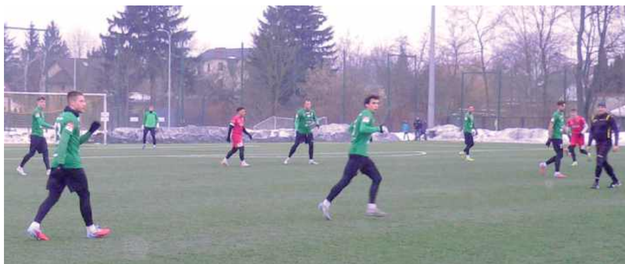
Zespół Podlasia zaliczył bezbramkowy remis z liderem IV ligi