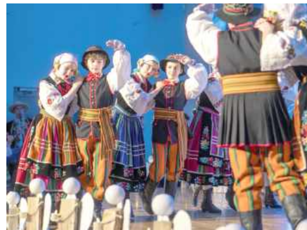
an Dzieci zaprezentowały się w pięknych ludowych strojach