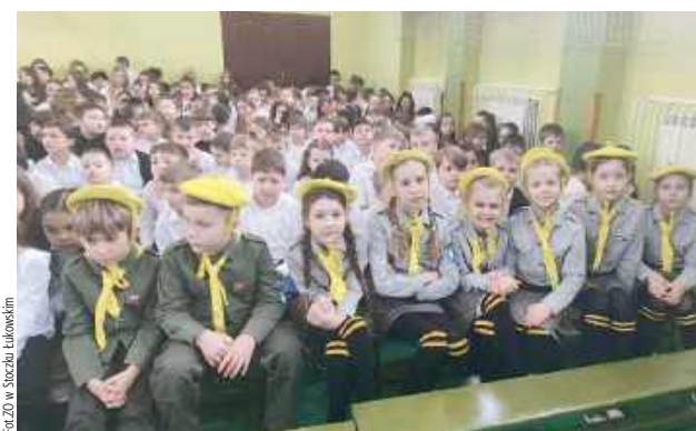
W apelu uczestniczyli zarówno młodszy, jak i starsi uczniowie