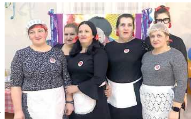
Panie kucharki przyrządziły pyszności, które królowały na stołach za czasów PRL-u

pracy, poświęcenia i dobrej woli ta wyjątkowa podróż w czasie nie byłaby możliwa.