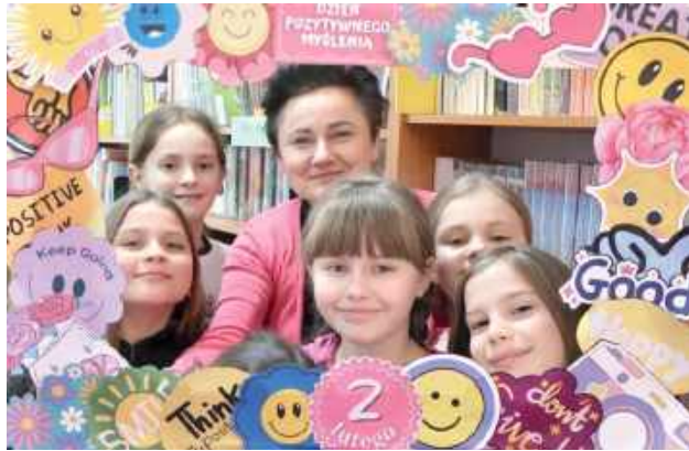
Ciekawym pomysłem była również specjalna ramka do zdjęć, przy której wykonywano pamiątkowe fotografie