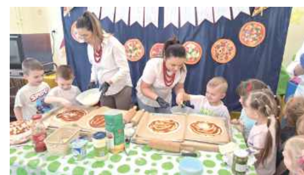
Międzynarodowy Dzień Pizzy, obchodzony 9 lutego, przypomina o globalnym znaczeniu tej potrawy wywodzącej się z Włoch. Data ta jest wykorzystywana w wielu miejscach do promowania wiedzy o pizzy oraz związanych z nią praktyk gastronomicznych