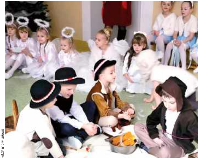
Przepiękne stroje nadały uroczystości wyjątkowy i niepowtarzalny klimat