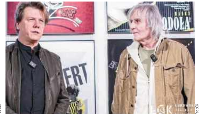
Ekspozycja obejmuje prace związane z teatrem, muzyką, kulturą i tematami społecznymi, a także realizacje o charakterze religijnym

Duże zainteresowanie wzbudził pierwszy plakat Wielkiej Orkiestry Świątecznej Pomocy z 1993 roku. Przypomniano, że po trzydziestu latach został on wystawiony na licytację wspólnie z Jerzym Owiakiem i osiągnął cenę 5300 zł.