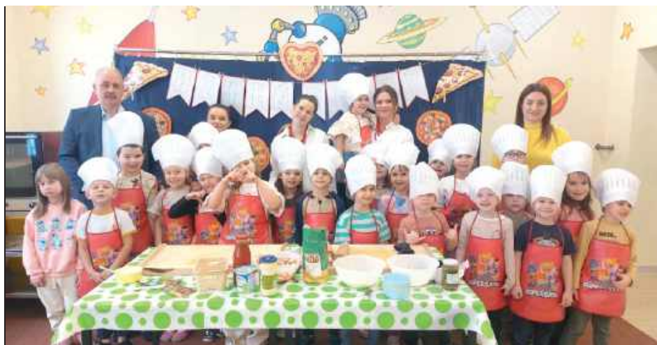
Zajęcia przeprowadzone zostały we współpracy z Kołem Gospodyń Wiejskich z Dębowicy, które prowadziło blok warsztatów kulinarnych

9 lutego w przedszkolu w Dębowicy zorganizowano obchody Międzynarodowego Dnia Pizzy. Placówka została przystosowana do przeprowadzenia warsztatów kulinarnych poświęconych przygotowaniu tradycyjnej pizzy.