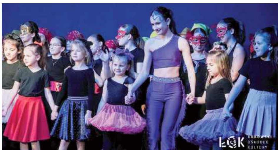
Starsze koleżanki zawsze wspierają młodsze tancerki