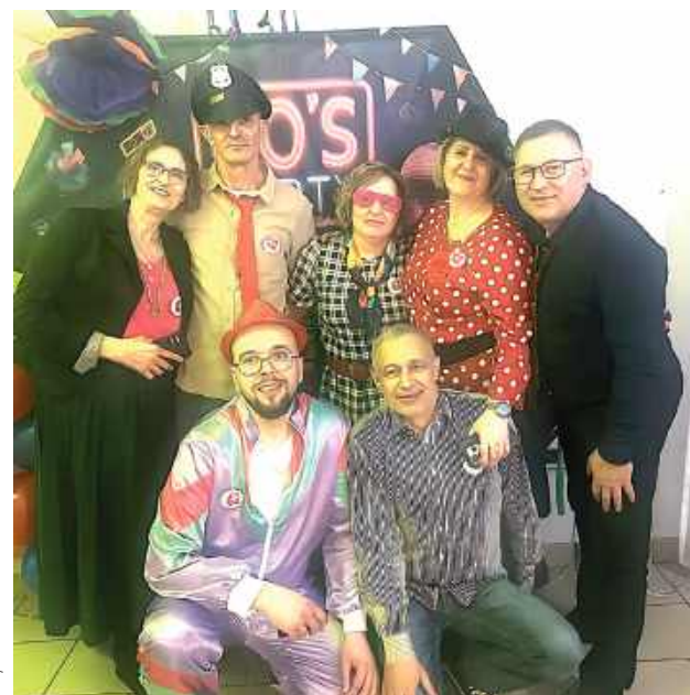
Na parkiecie królowały kolorowe sukienki i koszule, a humory dopisywały

Serdeczne podziękowania należą się wszystkim, którzy włączyli się w przygotowania – od pomysłodawców, przez kucharki, dekoratorów, aż po osoby dbające o oprawę muzyczną. Bez ich