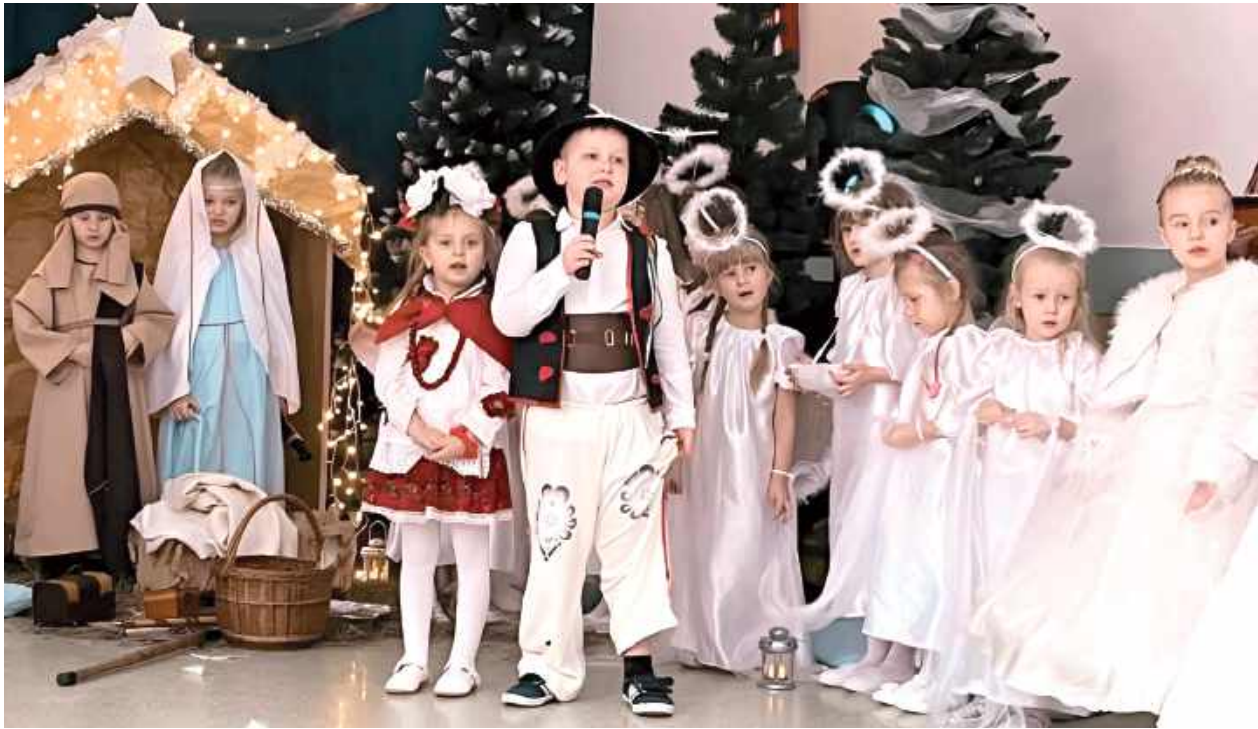
Wspólne kolędowanie przeplatane nowoczesnymi pastorałkami zachwytiło zaproszonych gości