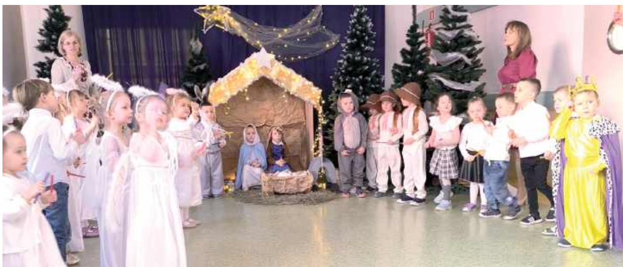
Przedszkolaki wystąpiły w części artystycznej, przedstawiając scenki z narodzin Pana Jezusa