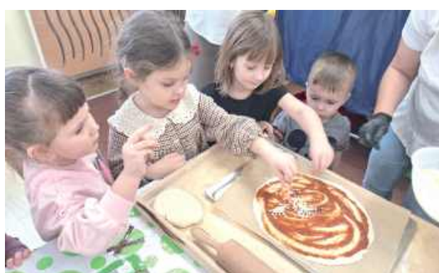
W trakcie zajęć unosił się aromat pieczonego placka. Ten aromat to standardowy proces wypieku w piecu, kluczowy dla osiągnięcia tekstury i smaku charakterystycznego dla włoskiego produktu

Warsztaty kulinarne przeprowadziło Koło Gospodyń Wiejskich z Dębowicy. Organizatorzy zapewnili produkty spożywcze oraz zaplecze techniczne umożliwiające realizację zajęć.