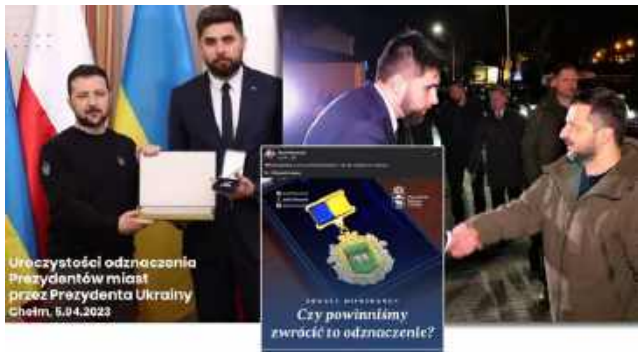
Uroczystości odznaczenia Prezydentów miast przez Prezydenta Ukrainy Chełm, 5.04.2023