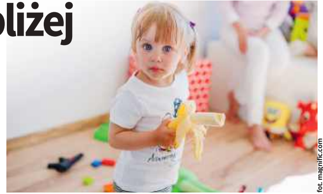
W czasie ostatniej sesji ustalono szczegóły dotyczące funkcjonowania nowego żłobka, którego budowa trwa właśnie w Żółtańcach-Kolonii.

Przedstawiciele gminy argumentowali jednak, że ustalona stawka stanowi górny limit