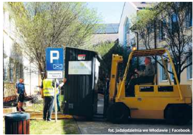
fol. Jadalnia we Włodawie | Facebook

Przenosiny społecznej lodówki na al. Józefa Piłsudskiego 41