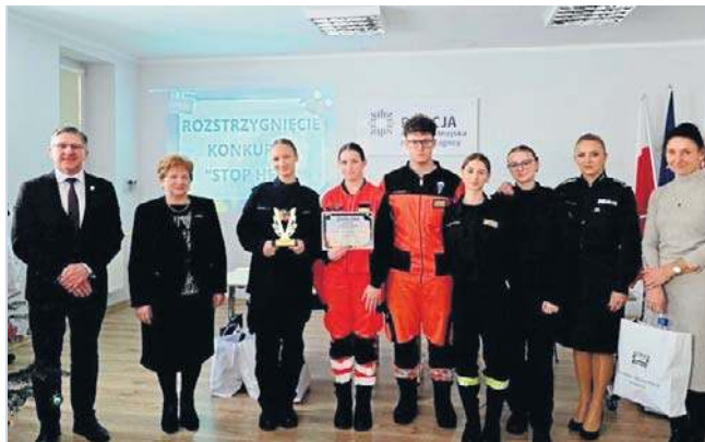
Podczas uroczystego zakończenia konkursu uczestnicy dostali puchary i nagrody