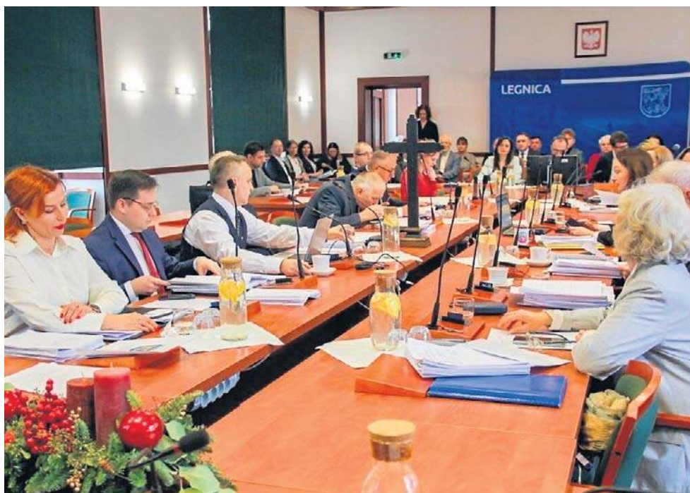
Rada przyjęła budżet 13 głosami za i 8 przeciw (radni Prawa i Sprawiedliwości)

- Miasto będzie kontynuowało remonty, budowy i przebudowy 23 dróg, będzie inwestowało w bezpieczeństwo publiczne oraz poszukiwało zewnętrznych źródeł finansowania na projekty rozwoju Legnicy. Na kontynuację remontów w ramach Legnickiego Programu Drogowego przeznaczonych jest 57 mln zł - wymienił skarbnik miasta.