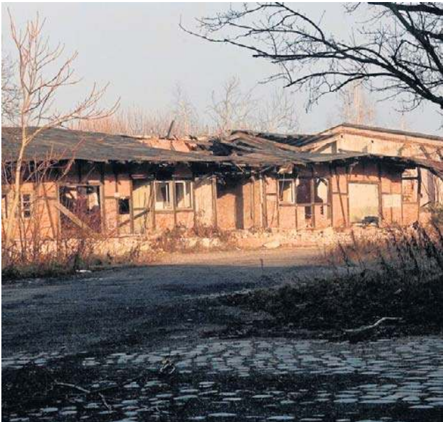
Tu jest gruzowisko, ale za dwa lata wszystko się zmieni

Do centrum dojedziemy z ulicy Kolejowej i Kartuskiej, której część zostanie przebudowana, by odsunąć ją od położonych równolegle kamienic. Przy dworcu ruch pojazdów zostanie uspokojony poprzez nadanie priorytetu komunikacji publicznej w tym rejonie. Obiekty takie jak wiaty przystankowe, które powstaną w centrum, będą nawiązywały kształtem do tych wzniesionych w latach 30. minionego wieku.