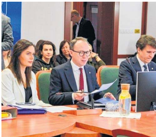
Władze najwięcej pieniędzy zaplanowały na oświatę, transport, łączność i gospodarkę komunalną