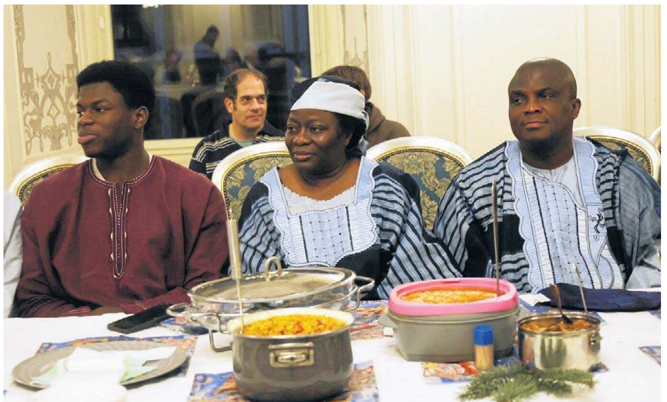
Przedstawiciele 11 narodów przynieśli swoje świąteczne potrawy i zaprezentowali tradycje swoich krajów