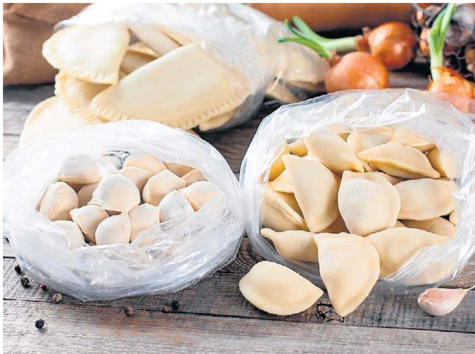
Mrożenie jedzenia to sposób, by trzymać je znacznie dłużej i w każdej chwili mieć pod ręką

Tego nie powinno się mrozić: ● Mleko i fermentowane produkty mleczne ● kremy na bazie śmietany i masła ● majonez i podobne sosy ● awokado ● surowe jajka w skorupkach ● jajka gotowane na twardo ● wodniste i delikatne warzywa, np. ogórki, pomidory ● ugotowane produkty skrobiowe, takie jak ziemniaki, makaron ● galarety ● tłuste ryby oraz nieupiecznione świeże ryby ● surowe mięso poddane działaniu wody. Niektóre produkty, jak brokuł czy kalafior, wymagają zblanszowania przed zamrożeniem.