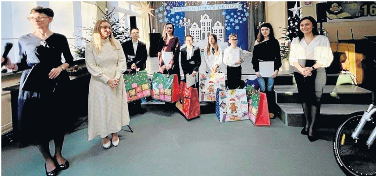
Dyktando kolejny raz potwierdziło swoją rolę w promowaniu poprawnej polszczyzny i integracji mieszkańców wokół twórczych inicjatyw edukacyjnych