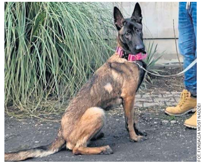
Pierniczka wygrała walkę o życie

- Kiedy Pierniczka (Ayra) trafiła pod moją opiekę, czułem strach. Nie wiedziałem, czy przeżyje pierwszą noc. Obiecałem jej, szeptając: „Będę walczył z tobą, będę walczył o ciebie, będę walczył o sprawiedliwość. Proszę, pozwól mi walczyć i nie poddawaj się, a razem zwyciężymy”. Obiecałem, słowa dotrzymałem, słowa dotrzymam i będę walczył do końca (...). Kiedy kazano uspić Pierniczkę, my postanowiliśmy inaczej. Zawsze wierzyliśmy w nadzieję na coś pięknego.