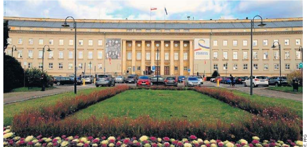
Surowo oceniono Wydział Spraw Obywatelskich we Wrocławiu, jak i Delegaturę w Legnicy

W okresie objętym kontrolą bez rozpoznania pozostawiono 6,8 tys. wniosków cudzoziemców. Pod koniec 2024 roku zaległości w rozpatrywaniu spraw dotyczyły niemal 61 tys. postępowań. W badanej próbie NIK ujawniła przypadki, w których czas oczeki-