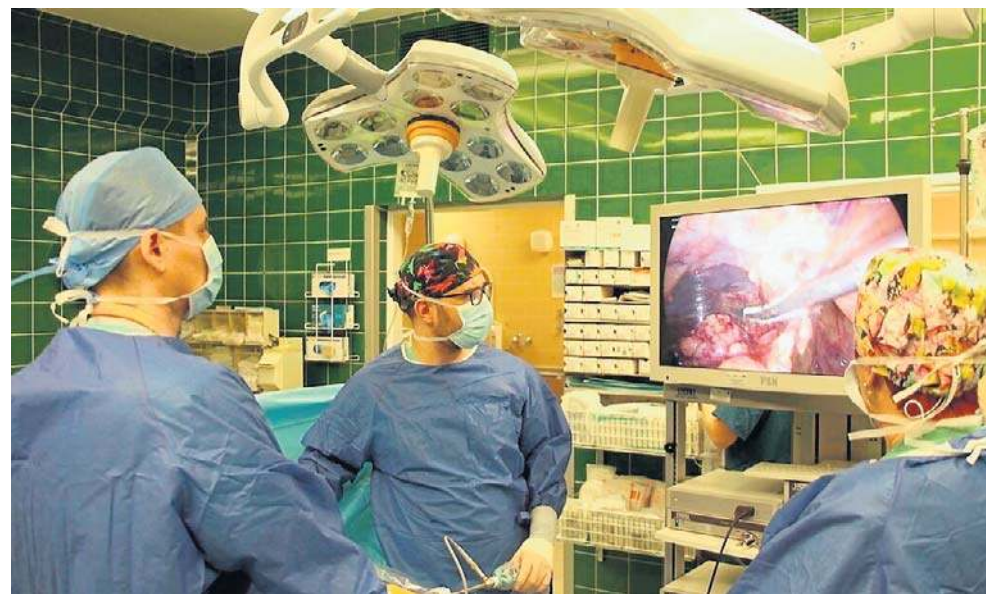
Budowa nowego bloku operacyjnego w legnickim szpitalu ma trwać trzy lata

- Chciałbym złożyć serdeczne podziękowania Zarządowi