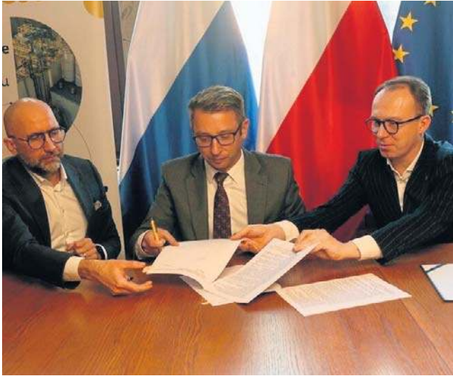
Z władzami Legnicy umowę podpisał Mostostal Kraków