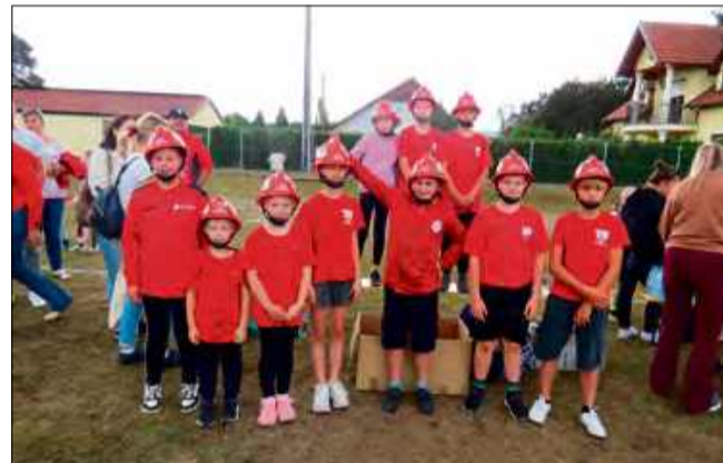
Zawody to nie tylko sportowa rywalizacja, ale także nauka współpracy i odpowiedzialności.

świeże powietrze, aktywność fizyczna i integracja z rówieśnikami. Emocje towarzyszą też nam, rodzicom – kończy. Zawody zgromadziły bardzo wielu kibiców i mieszkańców.