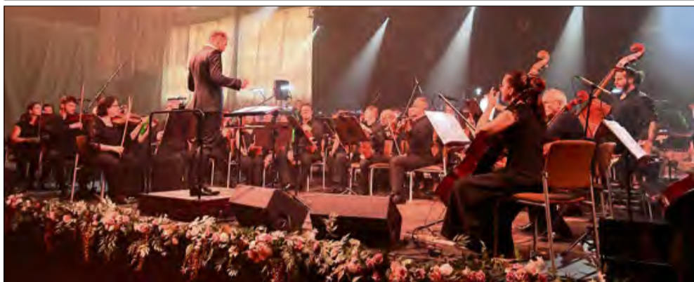
Tłumy przybyły na gogoliński koncert w wykonaniu filharmoników opolskich i solistów.

Gogolin stał się stolicą muzyki filmowej. W hali sportowej imienia B. i Z. Blautów odbył się koncert symfoniczny z udziałem orkiestry i chóru Filharmonii Opolskiej. Sala pękała w szwach.