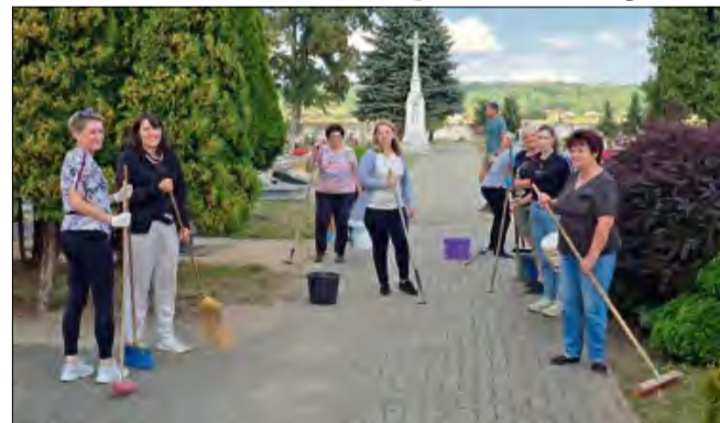
Ręk do pracy nie brakowało.

Mieszczący się dotąd w hali targowej w Gogolinie Referat Gospodarki Lokalnej zmienia swoją siedzibę. Od piątku 5 września funkcjonuje on w siedzibie Urzędu Miejskiego przy ul.