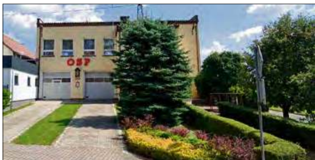
Remiza OSP w Kamieniu Śląskim prosi się o remont. Na ten cel gmina Gogolin wzięła pożyczkę.

Podczas ostatniej sesji Rady Miejskiej w Gogolinie radni wyrazili zgodę na zaciągnięcie pożyczki w wysokości 3,2 miliona złotych. Te pieniądze przeznaczone będą na ważny cel.