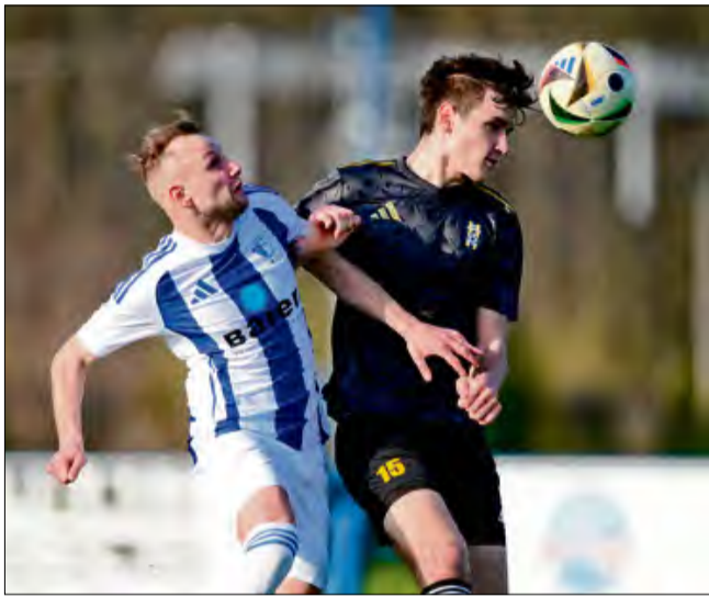
Po udanej kolejce piłkarzy z Żyrowej i Gogolina czekają teraz powiatowe derby

Zupełnie nieźle radzą sobie futboliści Victorii Żyrowa. W sobotę na własnym obiekcie podejmowali oni imienniczkę z Łanów i po dobrym widowisku zainkasowali kom-