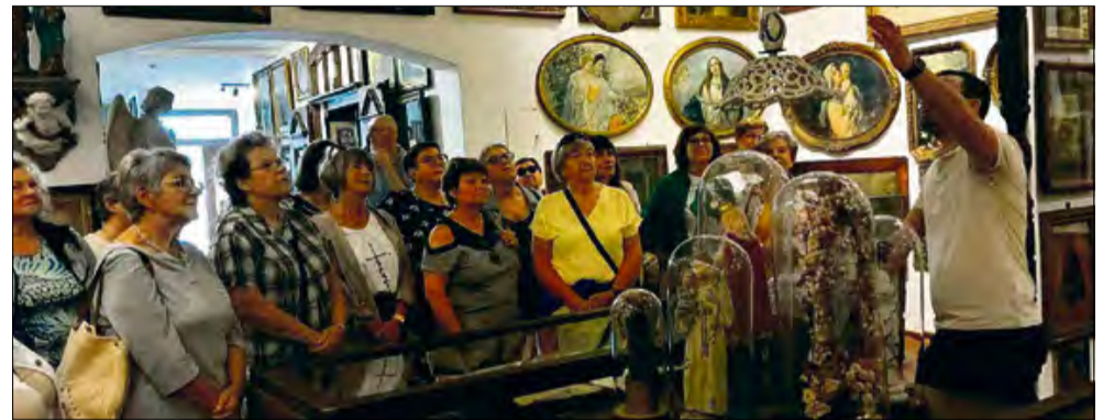
2 września seniorzy z Krapkowic zrzeszeni w UTW w Krapkowicach wyruszyli na wycieczkę do Ligoty Dolnej, Strzelce Opolskich i Jemielnicy.

Niezwykle inspirująca i pełna pozytywnych emocji podróż - tak o swojej wycieczce mówią seniorzy z Uniwersytetu III Wieku w Krapkowicach, którzy wyruszyli, by odkrywać skarby ziemi opolskiej. Ich trasa wiodła przez Ligotę Dolną, Strzelce Opolskie i Jemielnicę, oferując moc wrażeń - od unikatowych zbiorów sztuki sakralnej, przez odkrywanie burzliwej historii, po podziwianie architektonicznych perełek. Wycieczka była głębokim zanurzeniem się w duchowe i kulturowe dziedzictwo regionu.