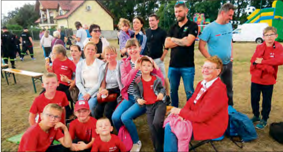
Strażacka pasja w młodym pokoleniu.