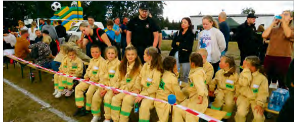
Zawody w Pietnej to połączenie tradycji strażackiej z radością dziecięcej zabawy.

Podobne opinie wyrażał również Andrzej Cieślak. – Mój syn bierze udział w