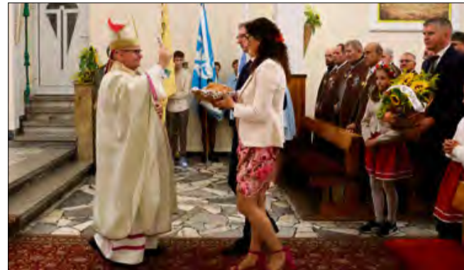
Parafianie przynieśli do świątyni dary, które pobłogosławił biskup.

Uroczystości miały miejsce w minioną niedzielę 7 września. Była to także okazja do podziękowania za tegoroczne żniwa. W liturgii uczestniczyli m.in. parafianie, diecezjanie oraz przedstawiciele Bractwa Świętego Józefa.