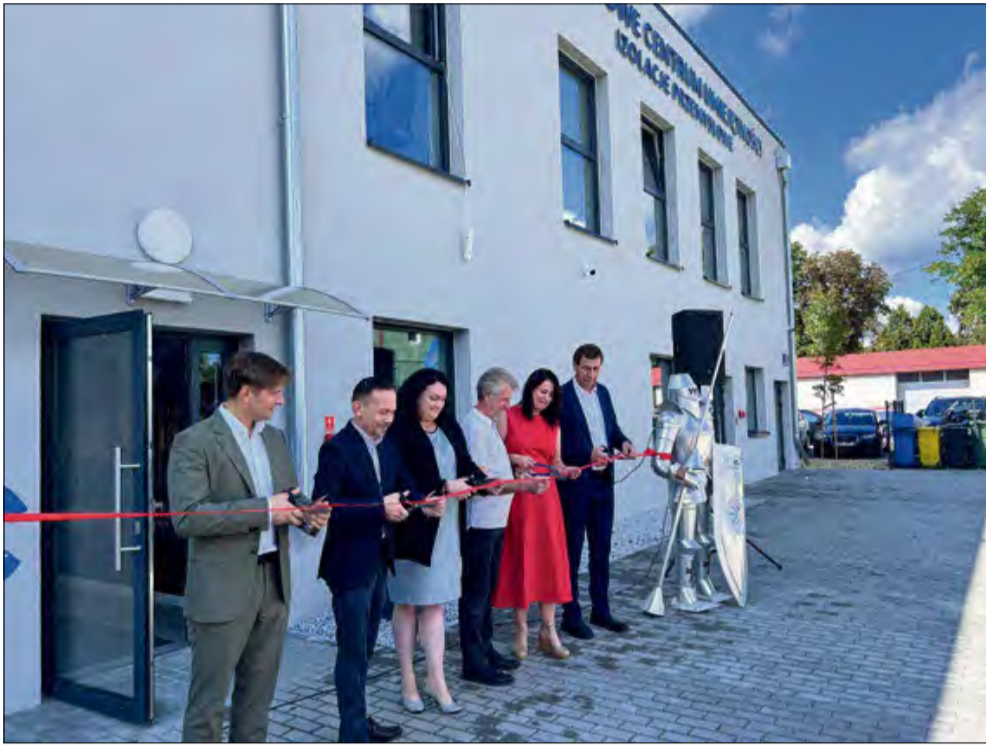
Oficjalne otwarcie obiektu odbyło się 3 września.

W Krapkowicach oficjalnie otwarto nowoczesne Branżowe Centrum Umiejętności, które ma szansę stać się krajową kuźnią kadr dla dynamicznie rozwijającego się sektora izolacji przemysłowych. Inwestycja, której wartość sięga 7 milionów złotych, została sfinansowana głównie ze środków Unii Europejskiej.