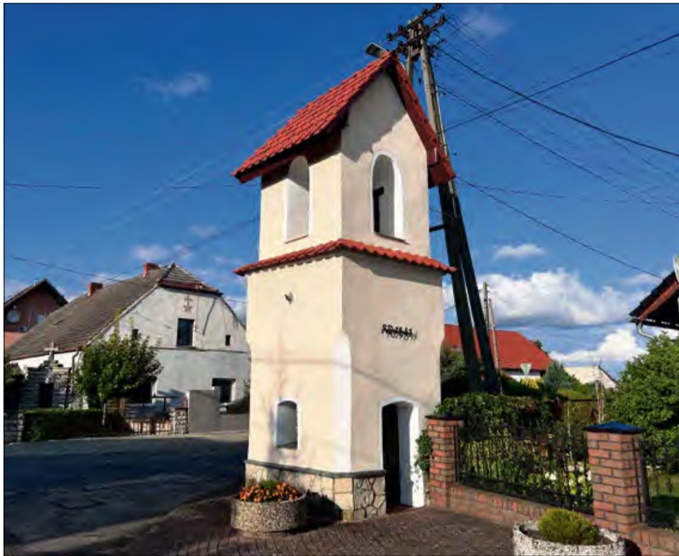
Kapliczka stoi w samym sercu wsi.

Kapliczka w Odrowążu przyciąga uwagę swoją formą. Murowana, dwukondygnacyjna budowla ze ściętymi narożnikami u dołu prezentuje styl charakterystyczny dla XIX-wiecznej architektury małomiasteczkowej i wiejskiej. Taka forma nadaje obiektowi zarazem stateczności i lekkości, czyniąc go harmonijnie wpisanym w krajobraz wsi.