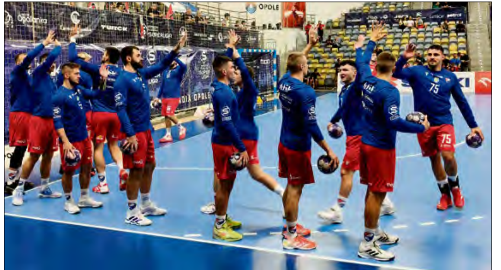
W 1. kolejce drużyna Corotop Gwardii Opole zmierzyła się z mistrzami Polski Wisłą Płock.

W drugą część spotkania obie ekipy weszły z ogromną determinacją i skupieniem. Dodatkowo wypełniona kibicami