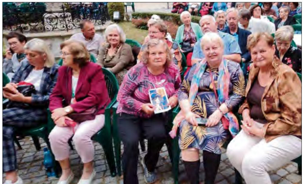
Seniorzy z Krapkowic podczas 24. edycji Pałacowego Lata Muzycznego w Pławniowicach.

Seniorzy z Krapkowic uczestniczyli w wyjątkowym wydarzeniu kulturalnym, które stanowiło uroczyste zamknięcie wakacji. 31 sierpnia wzięli udział w koncercie finałowym 24. edycji Pałacowego Lata Muzycznego w Pławniowicach, poświęconym „W krainie operetki i musicalu”.