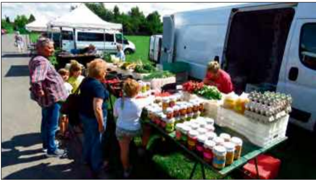
11 września mieszkańcy i goście Krapkowic spotkają się na kolejnej odsłonie „Straganka”.

Zapach świeżo upieczonych ciast, aromat kiszonych warzyw, smaczne sery, wędliny oraz miód, który lśni w słońcu niczym złoto - tak w najbliższy czwartek, 11 września, będzie wyglądał plac Eichendorffa. Od godziny 14:00 do 17:00 mieszkańcy i goście Krapkowic spotkają się na kolejnej odsłonie „Straganka”, cyklicznego bazarku z najlepszymi produktami od regionalnych wytwórców.