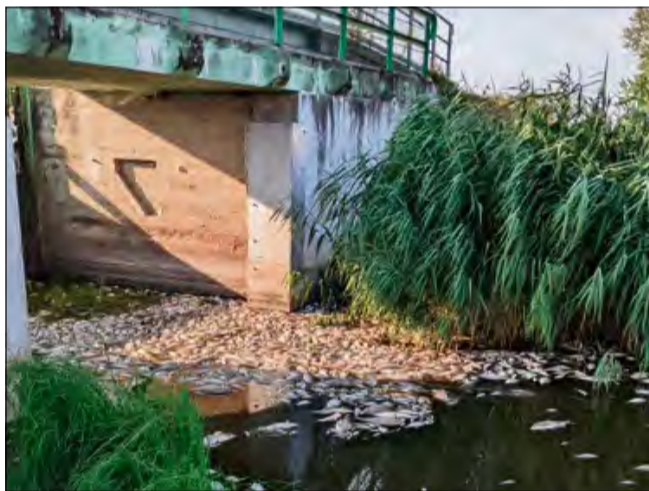
Katastrofa na Odrze na zawsze pozostanie symbolem ekologicznej tragedii w Polsce.

Katastrofą ekologiczną nazywamy zjawiska polegające na nieodwracalnym uszkodzeniu lub zniszczeniu środowiska przyrodniczego, które mogą również negatywnie wpływać na zdrowie, a często i życie ludzi. Choć dawniej takie zdarzenia były rzadsze, obecnie ich częstotliwość wzrasta, a skala niekorzystnego oddziaływania na środowisko jest trudna do oszacowania, gdyż zależy od wielu złożonych i wzajemnie powiązanych czynników. Wiele z nich wynika