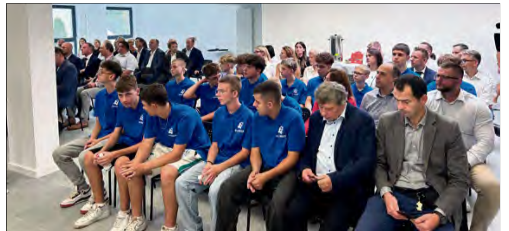
Nowe Branżowe Centrum Umiejętności w Krapkowicach to nie tylko inwestycja w infrastrukturę, ale przede wszystkim inwestycja w ludzi.

Nowe Branżowe Centrum Umiejętności w Krapkowicach to nie tylko inwestycja w infrastrukturę, ale przede wszystkim inwestycja w ludzi – realna szansa na zdobycie atrakcyjnego i poszukiwanego zawodu dla młodzieży oraz możliwość przekwalifikowania się dla dorosłych. To także wyraźny sygnał, że Krapkowice