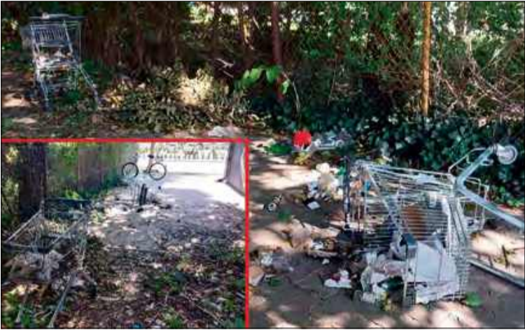
Na niewielkim skrawku ziemi pomiędzy budynkami zalegają śmieci.

Puste butelki, puszki po piwie, porzucone wózki sklepowe i wszechobecny odór moczu oraz odchodów - tak w niechlubny sposób prezentuje się teren pomiędzy sklepem Pepko a prywatnym budynkiem przy ulicy Prudnickiej. Mieszkańcy są oburzeni i zaapelowali do naszej redakcji o interwencję.