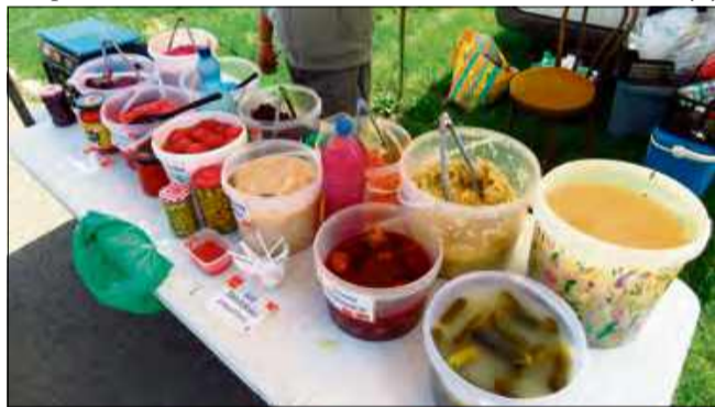
Organizatorzy zapraszają do współpracy również kolejnych producentów swojskiej i zdrowej żywności.

wiadają o swojej pracy i o tym, jak powstają ich produkty. Każde stoisko to historia – o pasji, tradycji i naturalnych recepturach.