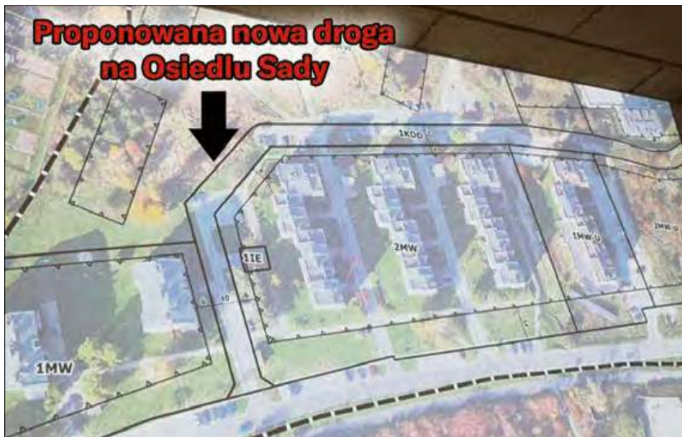
Droga ta ma się stać „buforem” pomiędzy starą a nową częścią osiedla Sady.

Według wypracowanej koncepcji, przez osiedle ma zostać poprowadzona nowa droga o szerokości pasa 10 metrów, łącząca Aleję Jana Pawła II w dwóch miejscach. Połącznie z aleją będzie