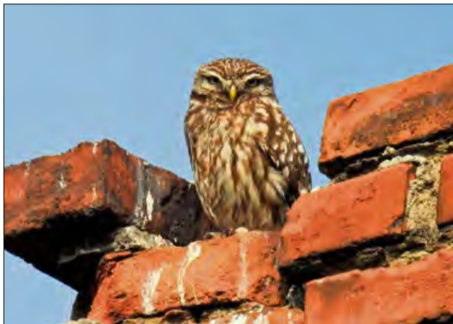
Siedliska pójdzki związane są z terenami otwartymi, rolniczymi, obrzeżami miast.

Budki chronią lęgi tych sów przed zrabowaniem przez drapieżniki naziemne, np. kuny i koty. Pójdzka ( Athene noctua ) jest niewielką i dość rzadką w skali województwa, a nawet Śląska, sową. W naszym rejonie są jeszcze jej stanowiska w okolicach Głogówka, południowej granicy gminy Krapkowice. Pójdzki polują na gryzonię, a w sezonie wiosna-lato, również na duże owady, a nawet dżdżownice. Sowom tym nie przeszkadza obecność człowieka, o ile nie stwarza on zagrożenia i ich nie niepokoi. Siedliska pójdzki związane są z terenami otwartymi, rolniczymi, obrzeżami miast. Ważne, by w okolicy była odpowiednia, tzw. niska struktura upraw, wystarczająco dużo pokarmu i miejsc lęgowych oraz czatowni, które ułatwiają pójdzkom polowanie. W ramach projektu, na który Stowarzyszenie Ochrony Sów otrzymało dofinansowanie z budżetu Województwa Opolskiego, zakupiono 10 budek lęgowych. Opracowano też folder edukacyjny z informacjami, w którym