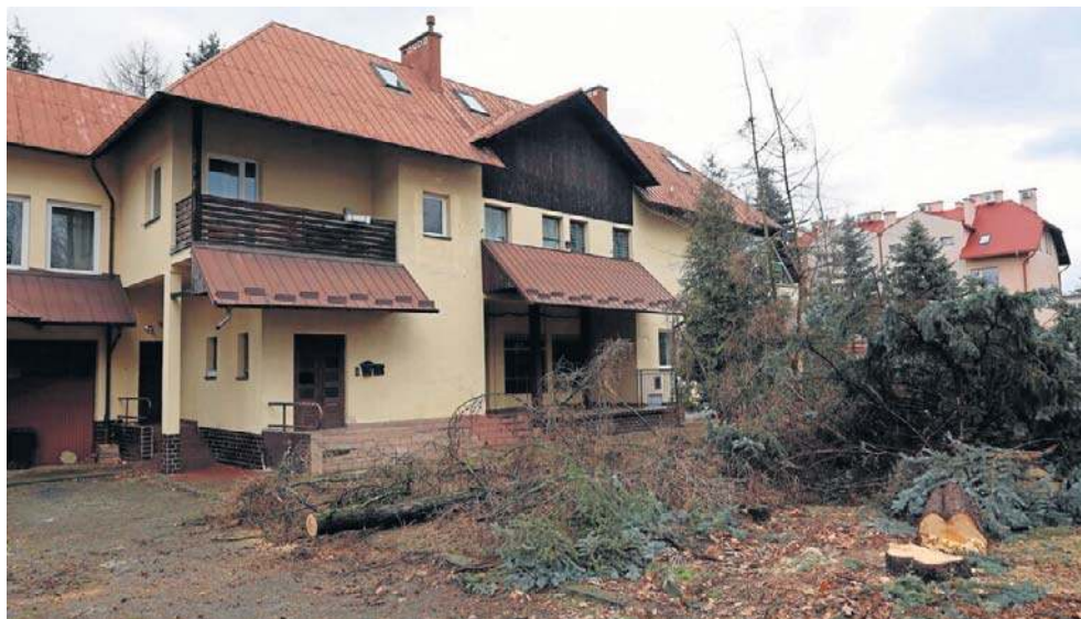
Mieszkańcy osiedla Dąbrowskiego nie chcą, aby doszło do wyburzenia willi dyrektorskiej przy ul. Niedzielskiego w Rzeszowie

Najpierw rada osiedla prosiła o interwencję Podkarpackiego Wojewódzkiego Konserwatora Zabytków. - Willa sta-