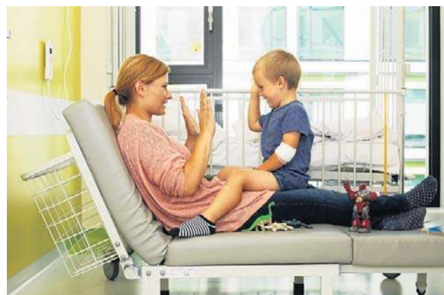
Łóżka od Fundacji Ronalda McDonalda w dzień stają się miejscem rozmów i wspólnej zabawy

Łóżka od fundacji w dzień są miejscem rozmów i chwil normalności, a nocą pozwalają rodzicom być tuż obok dziecka - gotowym przytulić i zareagować od razu.