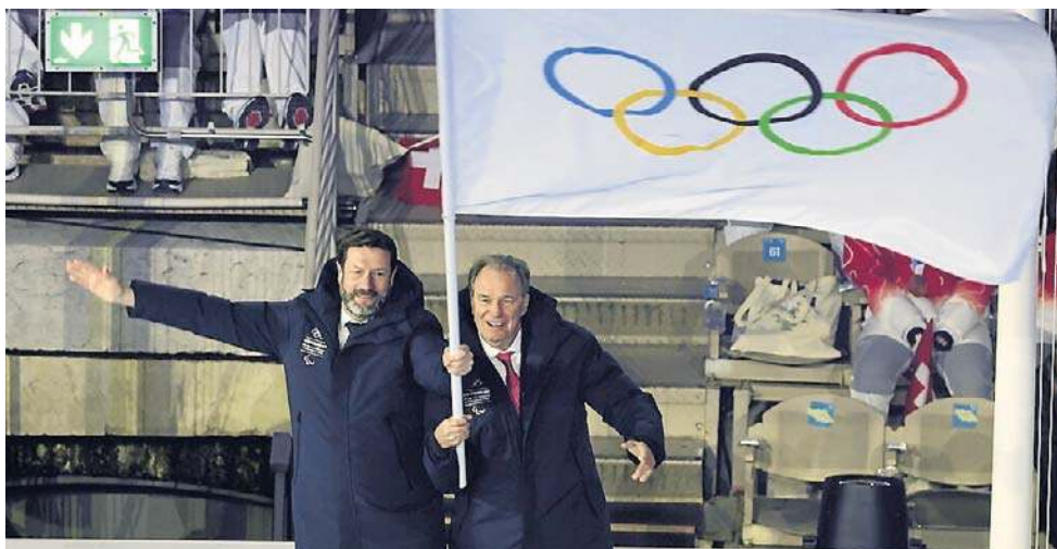
Flaga olimpijska opuściła maszt i została przekazana w ręce przedstawicieli Francji. To właśnie w tym kraju odbędą się XXVI Zimowe Igrzyska Olimpijskie

W igrzyskach Mediolan-Cortina d'Ampezzo startowało łącznie 2871 zawodników z 92 krajów w rekordowej liczbie 116 konkurencji.