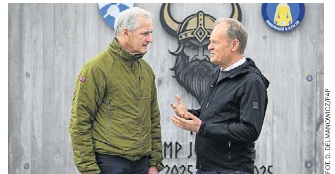
Premier Norwegii Jonas Gahr Store i premier Donald Tusk podczas spotkania w Lipie

Donald Tusk odniósł się do rocznicy ataku Rosji na Ukrainę. - Każdy człowiek, który ma zdolność rozpoznawania tego, co jest złe i co jest dobre, stoi po stronie Ukrainy - zadeklarował. Szef rządu zaznaczył, że pomoc Ukrainie nie wymaga przemilczania trudnej historii polsko-ukraińskiej. - Nie trzeba kochać Ukrainy. Można mieć różne oceny przeszłości. Polacy mieli swoje problemy z Ukrainą i nikt nie ma zamiaru tej historii zakłamywać - przyznał Tusk. Podkreślił jednak, że w obecnej sytuacji ge-