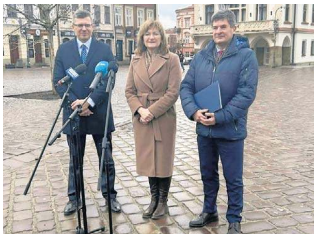
Posłowie i radny PiS mówią „nie” dla likwidacji Rzeszowskiego Bonu Żłobkowego

Według danych z ratusza z bonu żłobkowego korzysta 528 dzieci. ©