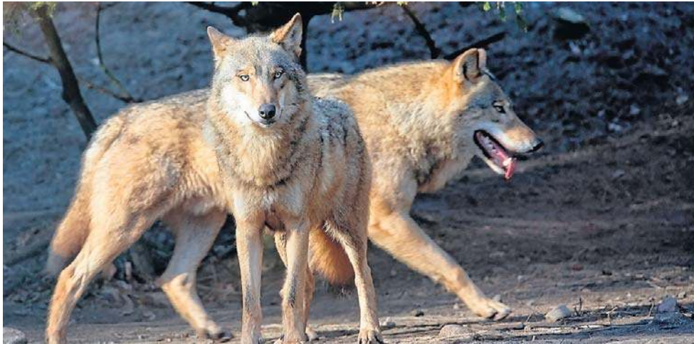
Wilki są drapieżnikami szczytowymi, nie mają naturalnych wrogów, poza człowiekiem

W całym kraju przyrost był większy, ponad siedmiokrotny. Obecnie zwierzęta te występują w każdym województwie. Tymczasem 20 lat temu w 6 województwach nie było ani