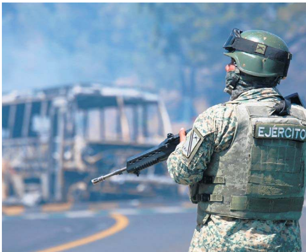
Meksyk w stanie wrzenia po zabiciu przywódcy Kartelu Nowej Generacji Jalisco, znanego jako „El Mencho”

Do aktów przemocy doszło w niedzielę czasu miejscowego w co najmniej trzynastu meksykańskich stanach. Miały one miejsce w większości w środkowo-zachodnim stanie Jalisco, a także w stanach Nayarit, Colima, Michoacan, Guana-