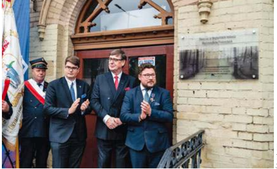
fol. mat. pras.

■ Prawo w czasach bezprawia. Stowarzyszenie Sędziowie RP i Akademia Kultury Społecznej i Medialnej w Toruniu zapraszają na konferencję naukową „Prawa człowieka w dobie kryzysu praworządności” 5 kwietnia w Auli AKSiM (ul. Droga Starotoruńska 3) w Toruniu. W programie m.in. „Prawo do prawdy”; „Bodnarzacja prawa jako zagrożenie dla praw człowieka”; „Reforma Wymiaru Sprawiedliwości lat 1989–1990 jako próba zerwania z systemem łamania praw człowieka. Sukces czy porażka?”; „Czy czeka nas kolejna dekada wstrząsów w wymiarze sprawiedliwości?”; „Czas chaosu i bezprawia. Prawa i wolności obywatelskie w świecie państwa upadłego”.