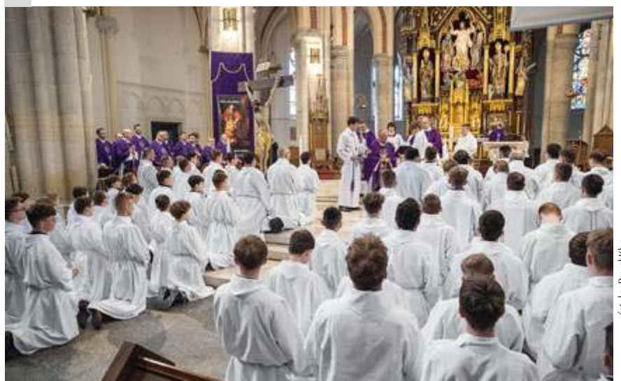
fot. ks. Paweł Kłys

lektora z wiarą i miłością, gorliwie rozważając słowo Boże i będąc świadkami Chrystusa w codziennym życiu – zwrócił się do nowych lektorów biskup pomocniczy archidiecezji łódzkiej./ ks. Paweł Kłys