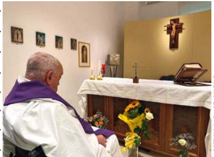
Papież koncelebrował Mszę św. w klinice Gemelli

Czytania mszalne: Oz 6, 1-6; Ps 51, 3-4. 18-21a; Łk 18, 9-14