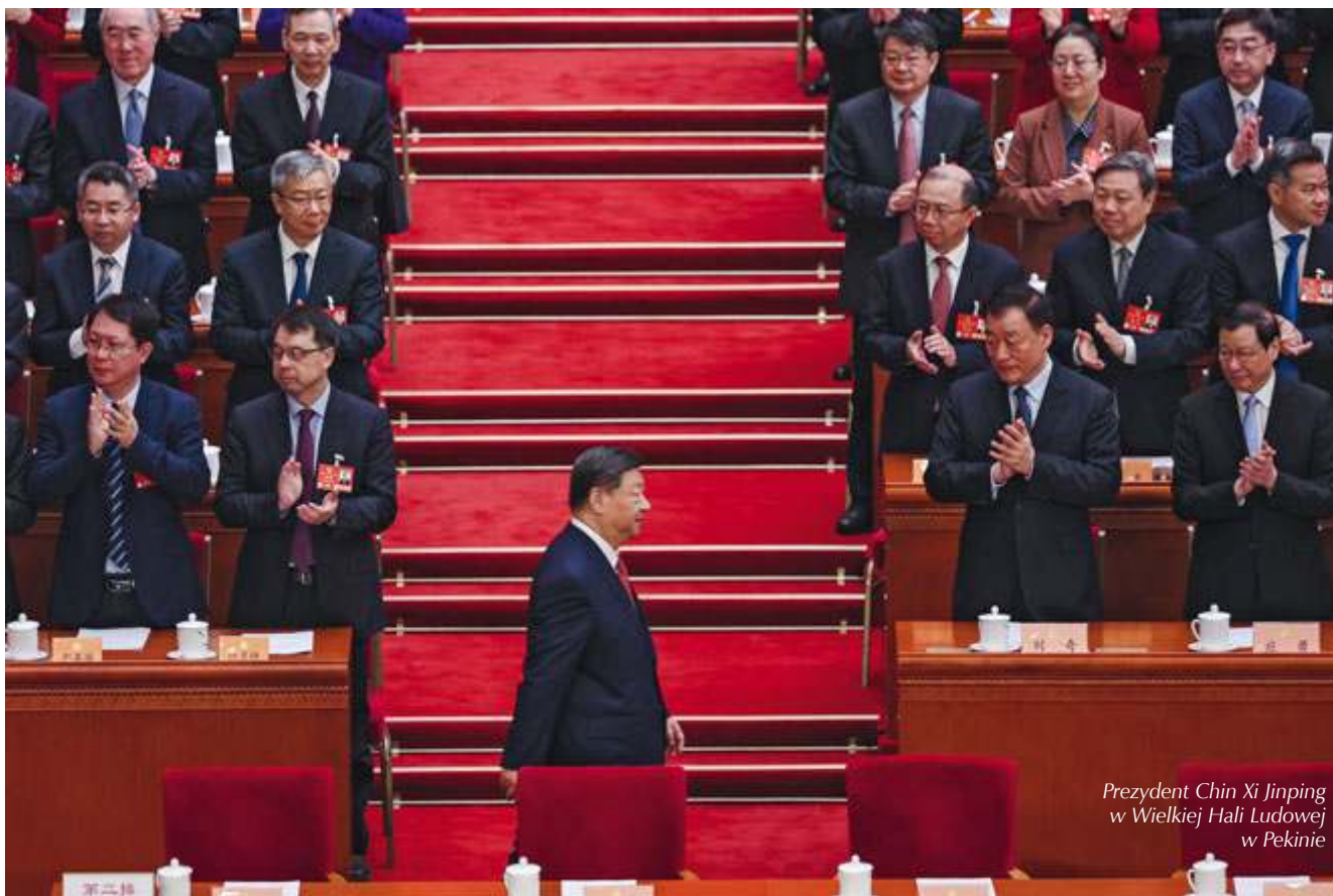
Prezydent Chin Xi Jinping w Wielkiej Hali Ludowej w Pekinie