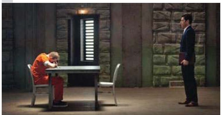
fol. mat. pras.

turze zła. Jak podkreśla ks. Martins: „Film wprowadza widza w meandry umysłu demonicznego. Zamiast pokazywać jedynie diaboliczne zjawiska, ukazuje sposób myślenia osobowego zła i jego dążenie do zduszenia nadziei w człowieku”.