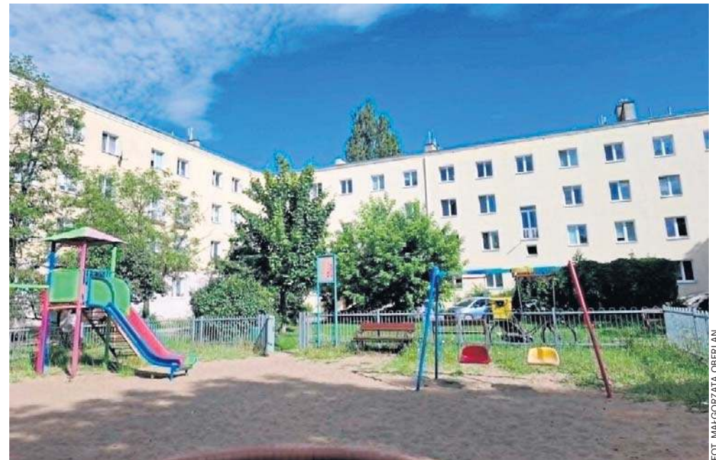
Ten plac zabaw to ważne miejsce nie tylko dla dzieci i rodziców z tych budynków, ale i okolicy, czyli także sąsiednich bloków

- Całe lato przed nami i to upalne, jak już widać. Gdzie te nasze maluchy mają się bawić? - pytają rodzice z ul. Jagiellońskiej. I dodają, że z zazdrością