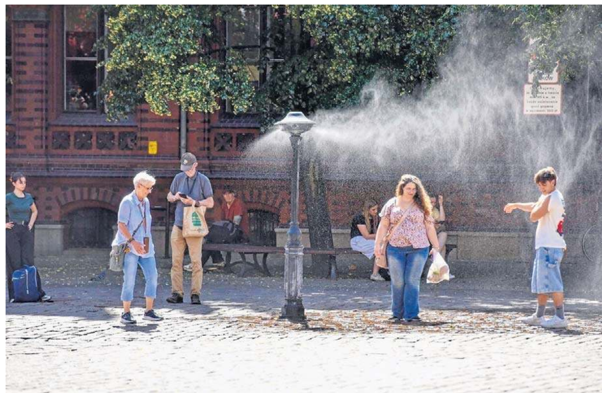
Torunianie i turyści nie podają się upałom. Szukają ochłody również w centrum miasta

Na placu zabaw Przy Kaszowniku jest tylko brudny piasek i dwie huśtawki str. 4