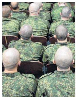
Rosyjskiej armii zaczyna brakować ludzi

– Począwszy od października wojsko będzie gotowe przyjąć na przyspieszone szkolenie dziesiątki tysięcy osób na poligonach, a następnie w takich grupach rozdzielać je do działających oddziałów – opowiadał