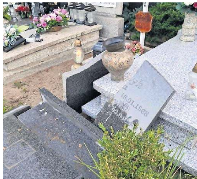
Pijany mieszkaniec Torunia zdewastował kilkadziesiąt nagrobków na cmentarzu przy ulicy Wybickiego

W nocy z ubiegłego wtorku na środę dyżurny Komisarjatu Toruń Śródmieście otrzymał zgłoszenie o dewastacji nagrobków na cmentarzu przy ulicy Wybickiego. Funkcjonariusze ruszyli do akcji i podczas interwencji zatrzymali 20-letniego mieszkańca Torunia. Młody mężczyzna był pijany.