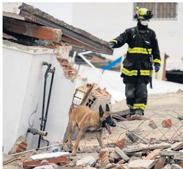
Kolumbijski ratownik i jego pies tropiący poszukują zaginionych osób na obszarze dotkniętym trzęsieniem ziemi w Catia La Mar w Wenezueli

Argentyńscy żołnierze pomagający w akcji ratunkowej