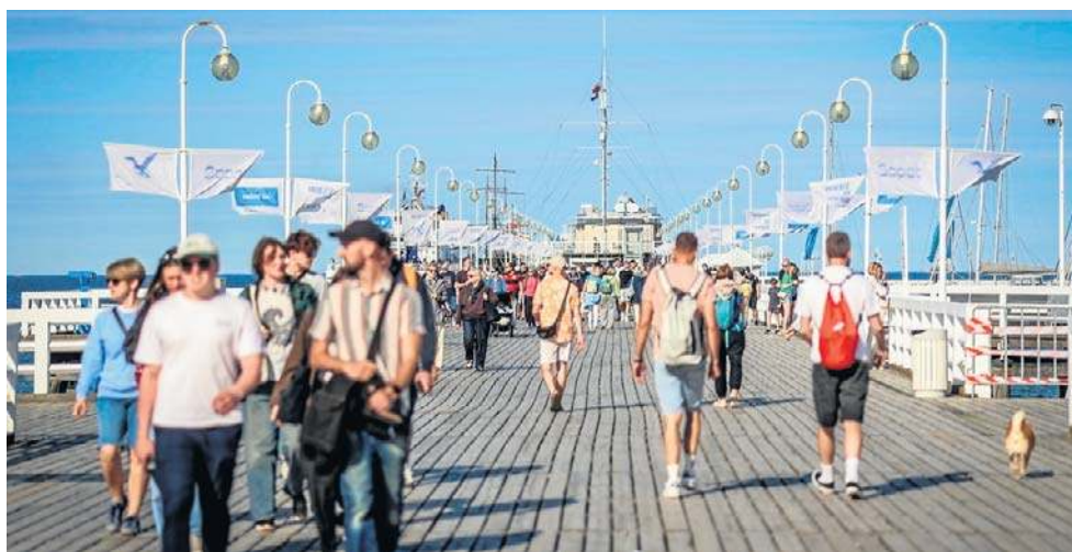
Turyści narzekają na drogie noclegi i jedzenie nad Bałtykiem, ale tam ich i tak nie brakuje

Spada zainteresowanie wypoczynkiem w kraju, w tym roku taki wyjazd planuje 53