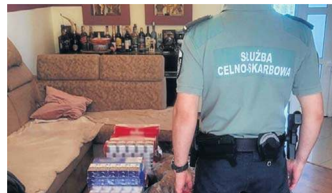
Funkcjonariusze zabezpieczyli 23 tys. szt. papierosów bez akcyzy, 1320 szt. papierosów spoza UE

Dodajmy, że kierowca usłyszał już zarzut paserstwa akcyzowego. Grozi za to kara grzywny do 720 stawek dziennych, kara pozbawienia wolności do lat 5 (lub do 5 lat w cięższych przypadkach) albo obie te kary łącznie. ©