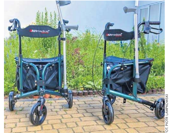
Do Domu Pomocy Społecznej w Toruniu trafiły chodziki i kule dla seniorów

W czwartek, 25 czerwca przyszedł czas, by sprzęt przekazać. W ten upalny dzień