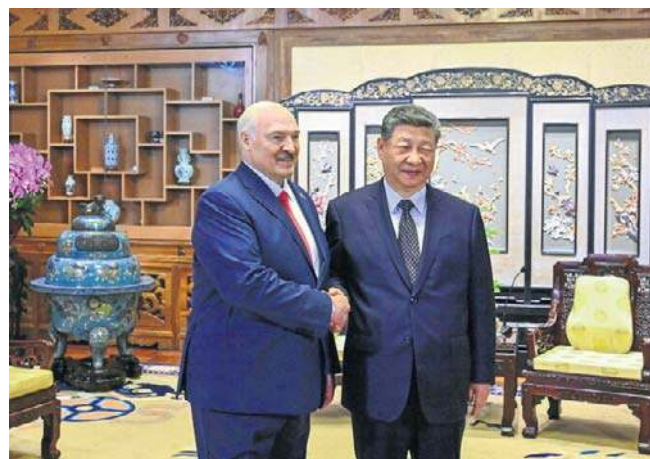
Xi Jinping i Aleksander Łukaszenko potwierdzili w Pekinie najwyższą rangę wzajemnych relacji

Według agencji Reutersa mężczyznę i chłopca uratowano po 12 godzinach żmudnych wysiłków, przeszukiwania ruin przy użyciu specjalistycznych kamer i mozołnego