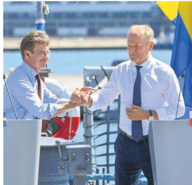
Premierzy Donald Tusk i Ulf Kristersson wzięli udział w polsko-szwedzkich konsultacjach międzyrządowych

- Szwecja jest jednym z najlepiej kooperujących państw w dziedzinie przemysłu obronnego i obrony. Mimo dość świeżego członkostwa w NATO, nasza współpraca na Bałtyku jakościowo zmieniła sytuację bezpieczeństwa. Podzielamy poglądy na temat sytuacji w całym regionie. Jesteśmy zdeterminowani we wsparciu Ukrainy wo-