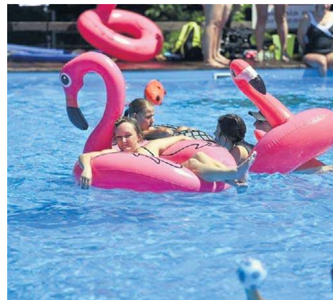
Ci, którzy nie schronili się w mieszkaniach i domach, szukali ochłody na przykład na letnich basenach

- Po kilku dniach z upałem, przejściowo rekordowym, bardzo potrzebne są opady. Popadać i zagrzmieć powinno głównie w nocy z wtorku na środę i w środę. W kolejnych dniach opadów będzie niewiele i pojawić się mogą przelotne, w pią-