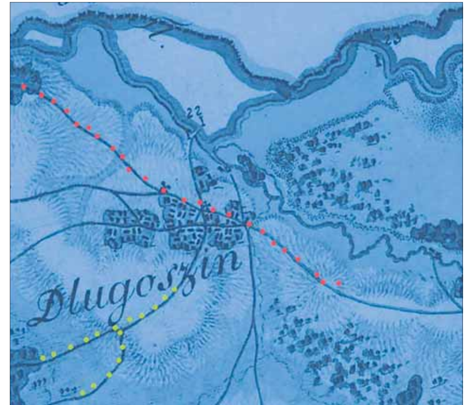
Długoszyń – droga królewska (kolor czerwony) oraz wspomniane w tekście rozwidlenie (kolor żółty)

Z mojej perspektywy dotyczy to przede wszystkim moich rodzinnych stron. I tak np. pomiędzy Długoszyńcem a Dąbrową Narodową biegnie droga, łącząca obie wsie, biegnie dziś, tak jak biegła już dwieście bądź trzysta lat temu. Nie ma w tym niczego nadzwyczajnego. W końcu ludzie komunikowali się między sobą, zajeżdżali do pobliskich wsi. Ale o wiele bardziej zdumiewającym jest to, że nieco bardziej na południowy wschód biegnie jeszcze jedna droga. Ma ona swój początek na osi starego kamieniołomu, następnie schodzi w dół, a potem niespodziewanie rozwidła się,