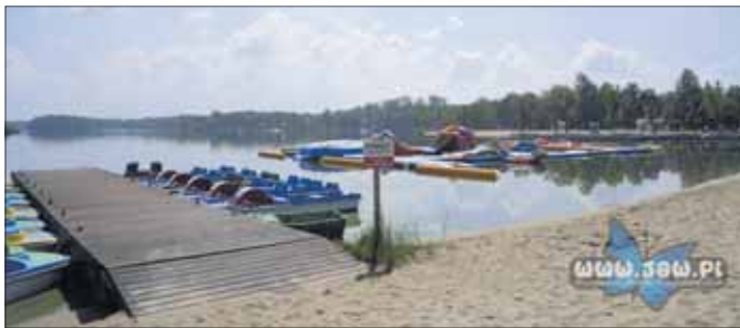
Wypożyczalnia sprzętu wodnego nad Zalewem Sosina w Jaworznie

Zgodnie z cennikiem obowiązującym na terenie OWR Sosina, samo wypożyczenie sprzętu pływającego na jedną godzinę jest bezpłatne. Dotyczy to rowerka wodnego, kajaka oraz deski SUP. Inaczej wygląda jednak kwestia kapoków, czyli kamizelek asekuracyjnych. Oto jak prezentują się ceny.