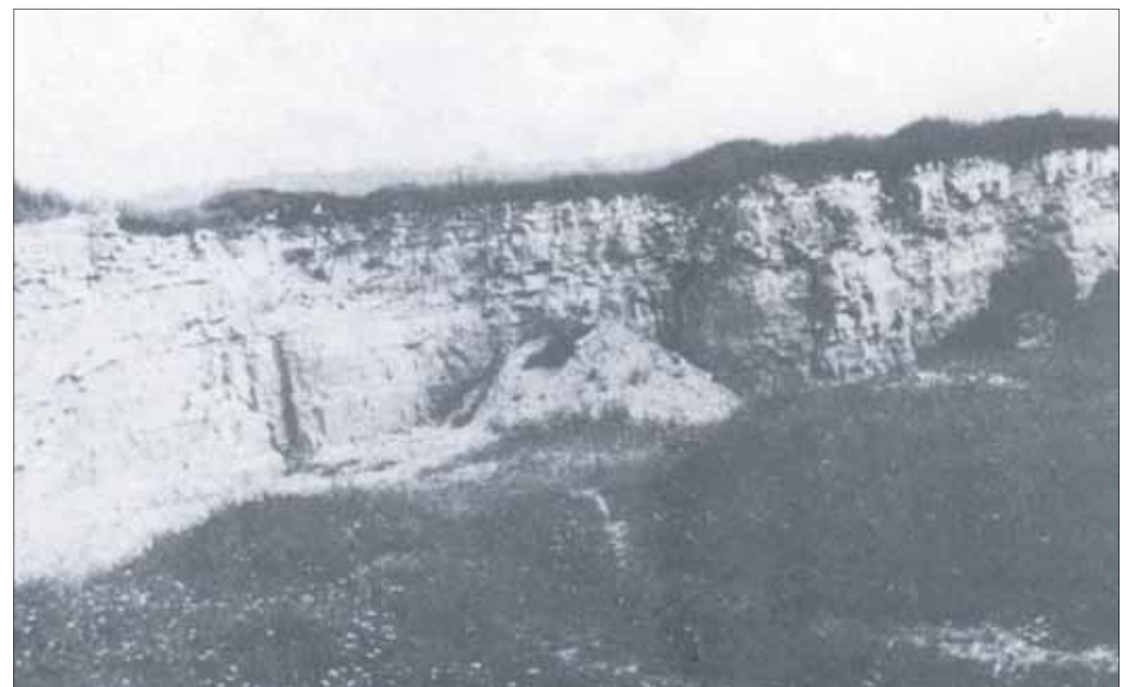
Długoszyński kamieniołom, lata 80. XX wieku

Zaś w obrębie samych kamieniołomów pozostałości starych wapienników, będących niegdyś własnością m.in. rodziny Palianów, Jachymczyków, Baranów i Wiernków. A to wszystko dziś niestety zarośnięte, po części potraktowane niegdyś jak wysypisko śmieci, które teraz obrosły trawami. Jedynym dziś plusem okolicy jest bardzo ładny widok na Osiedle Stale, ja-