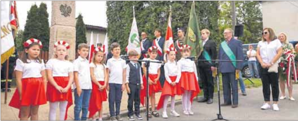
Program artystyczny wykonały przedszkolaki z PM nr 4

W tym roku minęła 86. rocznica rozstrzelania 20 Polaków w Ciężkowicach. W niedzielę, 7 czerwca, pod pomnikiem mieszkańców Ciężkowic, którzy stracili życie w czasie II wojny światowej oraz ofiar zbiorowej egzekucji przeprowadzonej przez Niemców 5 czerwca 1940 roku w Ciężkowicach odbyły się tradycyjne uroczystości rocznicowe upamiętniające bohaterów tamtych dni.