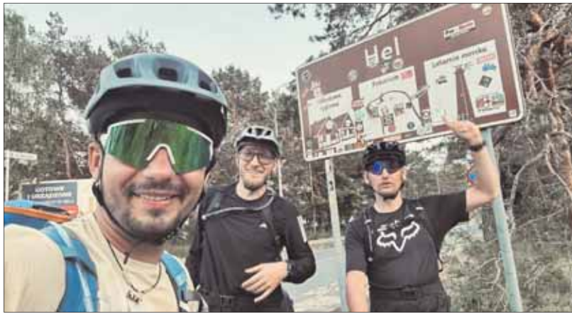
Wyprawa rowerowa z Jaworzna na Hel

Czwarty dzień rowerzyści zmierzali z trasą z Grudziądza do