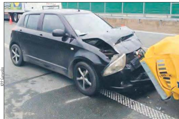
☛ Sprawca kolizji był kompletnie pijany - miał w organizmie ponad 2,5 promila alkoholu

Przeprowadzone przez policjantów badanie alkomatem wykazało, że sprawca był kompletnie pijany - miał w organizmie ponad 2,5 promila alkoholu. Mimo poważnego charakteru zda-