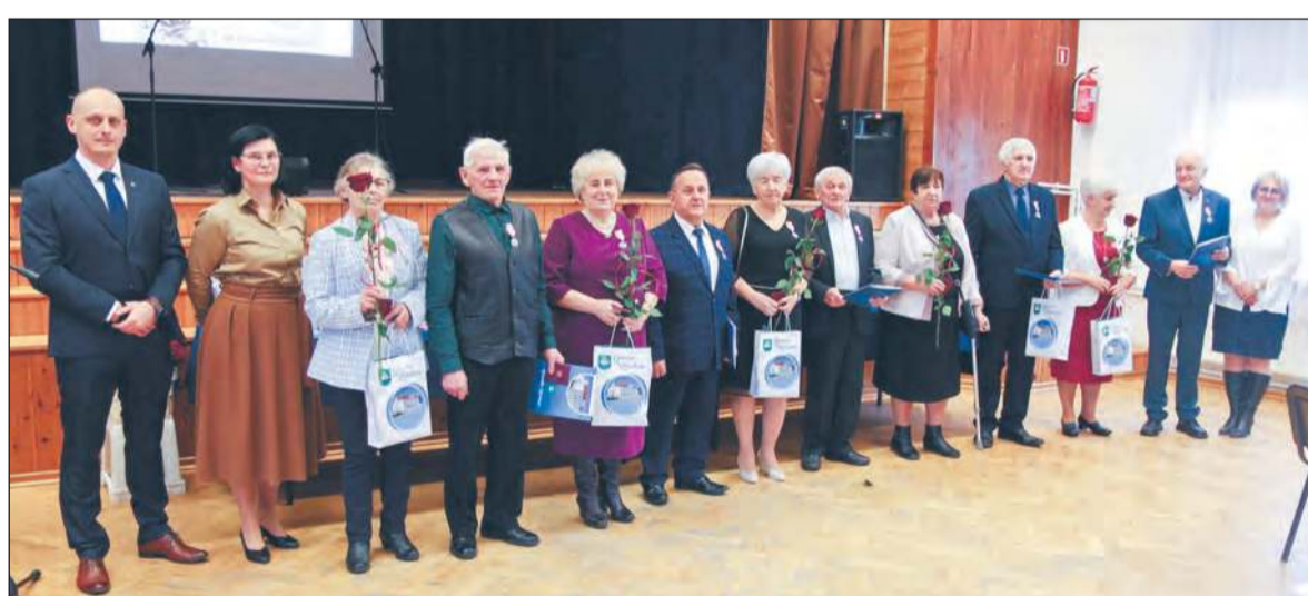
Uroczystość złotych, szmaragdowych i diamentowych godów odbyła się 27 stycznia w Miejsko-Gminnym Ośrodku Kultury w Żelechowie