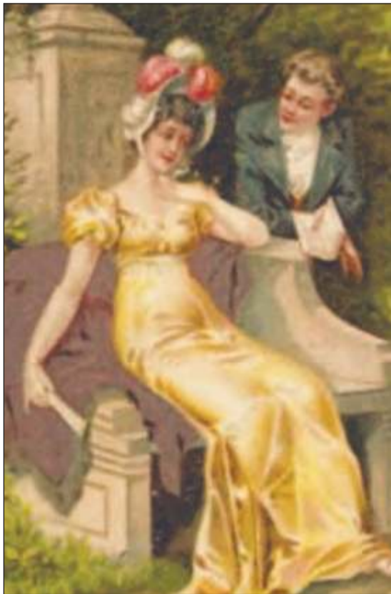
Ilustracje ukazujące zakochanych - XIX w. (okres romantyzmu) i XX w. (już fotografia) - pozy i sceneria podobne, ale pojawia się kolejny atrybut zakochanych - gołąbek!

Nieważne kiedy, gdzie i kto tworzył - starożytność, współczesność, Anglia, Polska, Zanzibar, kobieta, mężczyzna - zawsze zakochany twórca pisał o miłości. Ten temat był dominujący w jego wierszach. Nawet jeżeli przedtem pisał o doli chłopów, walce narodowowyzwoleńczej lub ochronie przyrody - zakochany, pisał o miłości! Jeszcze bardziej zadziwiający jest dobór środków stylistycznych, jakich używają zakocha-