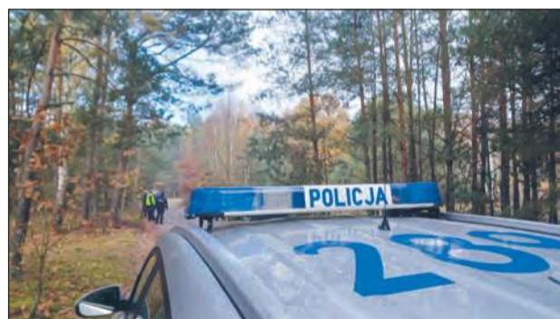
30-latek stracił orientację w terenie i nie potrafił określić swojego położenia. Tuż przed rozładowaniem telefonu zdołał jedynie poinformować, że znajduje się w lesie i potrzebuje pomocy. Natychmiast rozpoczęto szeroko zakrojone poszukiwania

W niedzielę 26 stycznia, tuż po godzinie 6:00 rano, dyżurny garwolińskiej komendy otrzymał zgłoszenie z Wojewódzkiego Centrum Powiadomienia Ratunkowego. Mężczyzna, dzwoniąc pod numer alarmowy, powiedział, że leży w lesie i nie wie, gdzie dokład-