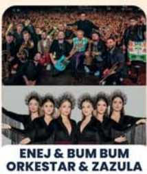
ENEJ & BUM BUM ORKESTAR & ZAZULA