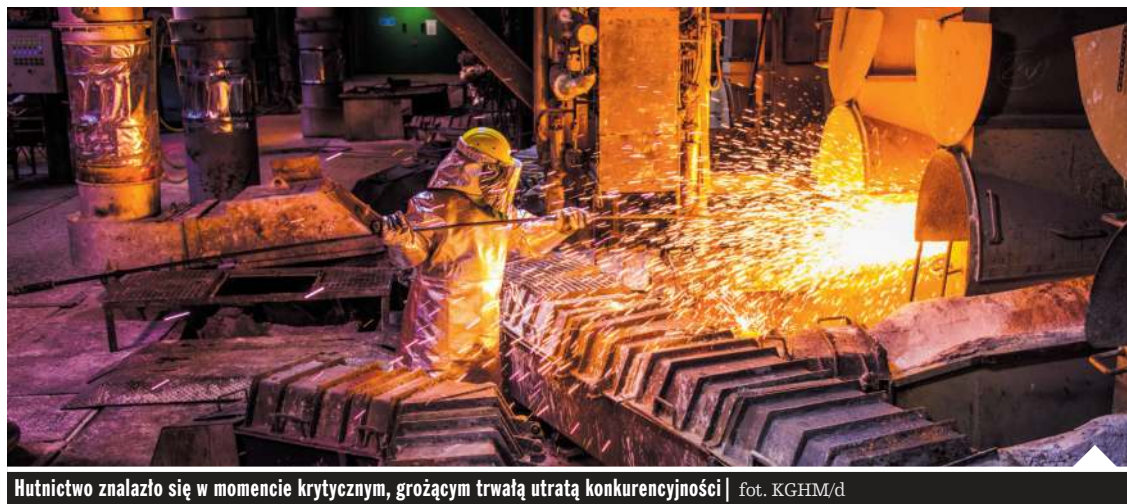
Hutnictwo znalazło się w momencie krytycznym, grożącym trwałą utratą konkurencyjności

Jednym z sektorów szczególnie dotkniętych przez wysokie koszty energii jest hutnictwo żelaza i stali – podkreśla Fede-