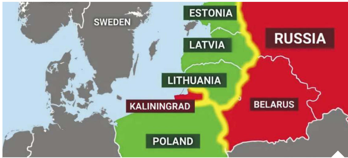
Kraje bałtyckie są najbardziej narażone na agresję ze strony neoimperialnej Rosji

Z kolei gen. broni Dariusz Parylak, dowódca Wielonarodowego Korpusu Północno-Wschodniego, oznajmił, że przekazanie dowodzenia zapewnia ciągłość, a jednocześnie pozwala jego jednostce na dalszy rozwój jej roli na Litwie i w Polsce. – Zintegrujemy dodatkowe siły, wzmocnimy naszą postawę odstraszania i obrony oraz sprawimy, że