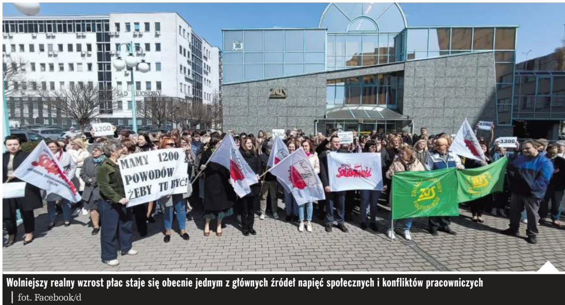
Wolniejszy realny wzrost płac staje się obecnie jednym z głównych źródeł napięć społecznych i konfliktów pracowniczych

Polska wchodzi w fazę stopniowego ochłodzenia i stabilizacji gospodarczej. Mimo korzystnych wskaźników makroekonomicznych obecny cykl koniunkturalny osiągnął już swój szczyt i coraz więcej danych wskazuje, że przed gospodarą okres wolniejszego wzrostu. Jednocześnie rosną obawy Polaków o sytuację finansową gospodarstw domowych. Konsumenci stali się znacznie bardziej ostrożni – zamiast zwiększać wydatki i napędzać sprzedaż, coraz częściej odbudowują oszczędności oraz ograniczają zakupy.