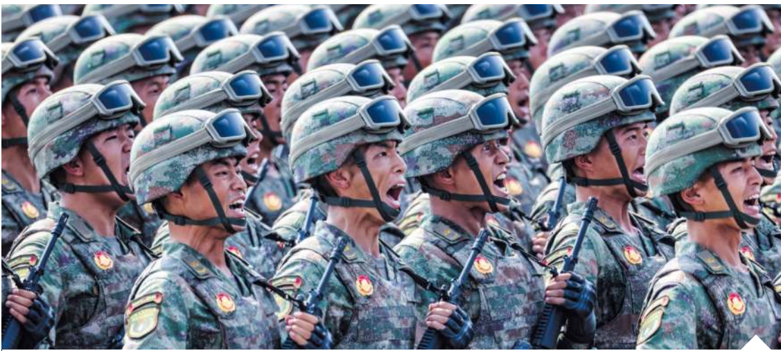
Program, który trwał od 8 kwietnia do 16 czerwca w Narodowym Uniwersytecie Obrony w prowincji Hunan, był pierwszym tego rodzaju przedsięwzięciem w historii armii Chin | fot. Yang Lei/Xinhua News Agency/Forum

Czystka trwa. 26 czerwca władze odebrały mandaty parlamentarne trzem kolejnym generałom – odpowiedzialnemu za modernizację uzbrojenia komisarzowi politycznemu Zachodniego Teatru Działań (nadzorującego granicę z Indiami, Tybet i Xinjiang) oraz komisarzowi politycznemu sił powietrznych. To pokazuje, że nieufność Xi sięga całej struk-