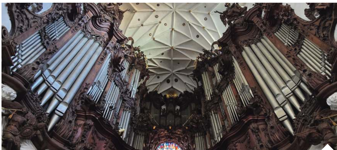
Organy w archikatedrze oliwskiej należą do najstynniejszych instrumentów tego typu w Europie i są symbolem gdańskiego festiwalu