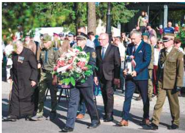
Wiele delegacji składało wieńce i kwiaty przy Miejscu Straceń