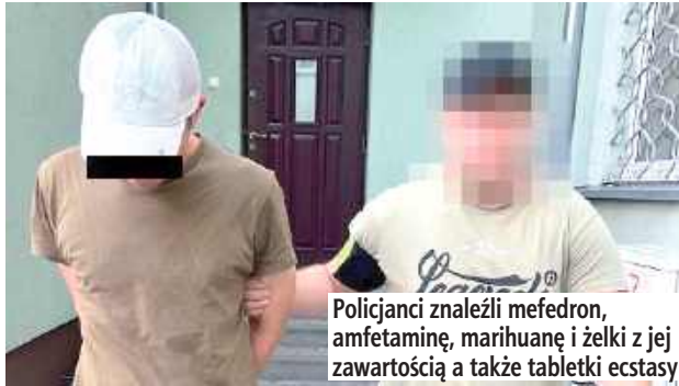
Policjanci znaleźli mefedron, amfetaminę, marihuanę i żelki z jej zawartością a także tabletki ecstasy

Biała Podlaska: Białscy policjanci znaleźli znaczne ilości narkotyków. Zatrzymanych zostało pięciu mężczyzn. W przypadku jednego z nich, sąd zastosował tymczasowe aresztowanie.