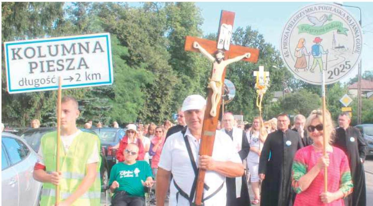
Grupa 9. na starcie 45. Pieszej Pielgrzymki Podlaskiej tuż po wyjściu z kościoła

Kilkaset osób przybyło w piątek o godz. 6 na Mszę św. w kościele Wniebowzięcia NMP (przy ul. Długiej), gdzie później nastąpił biały start 45. Pieszej Pielgrzymki Podlaskiej.