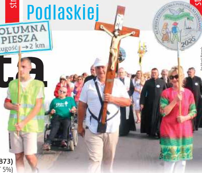
Grupa 9. na starcie 45. Pieszej Pielgrzymki Podlaskiej