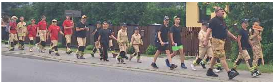
Miejscem spotkania młodych adeptów pożarnictwa była Jelnica

lokalnie „Jabłonkami”, gdzie czekały na nich liczne atrakcje i zadania.