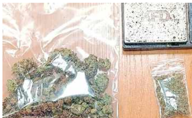
Z zabezpieczonej ilości substancji można byłoby przygotować blisko 150 porcji dilerkich marihuany

U 20-latkę z gminy Wilków policjanci znaleźli sporą ilość marihuany i elektroniczną wagę. Zarzuty już usłyszał.