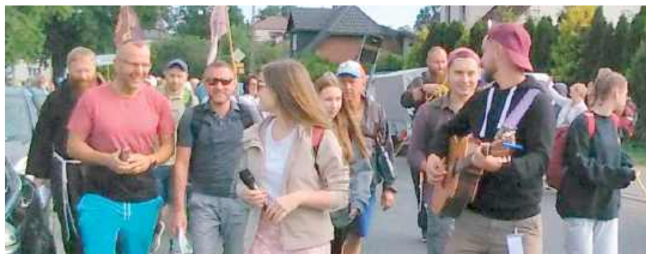
Grupa 9b, czyli franciszkańska, była bardziej rozspiewana. Gitara i śpiew oraz mocne nagłośnienie wystarczyły, żeby docenić takie pielgrzymowanie