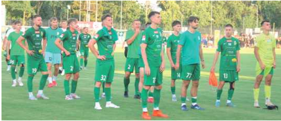
Białczanie mogli liczyć na doping swoich najwierniejszych fanów. Niestety, faworyt okazał się skuteczniejszy

Drużyna Podlasia Biała Podlaska nie może zaliczyć startu sezonu do udanych. W inauguracyjnym spotkaniu nowej rundy III ligi białczanie przegrali na własnym stadionie aż 0:3 z Chełmianką Chełm. Goście byli skuteczniejsi i lepiej zorganizowani, co przełożyło się na pewne zwycięstwo.