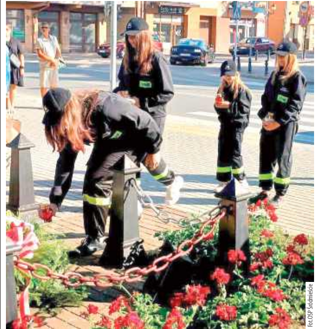
Hołd powstańcom oddali m.in. członkowie Młodzieżowej Drużyny Pożarniczej działającej przy Ochotniczej Straży Pożarnej w Śródmieściu

W godzinę „W” zawyły międzyrzeckie syreny. Ludzie zatrzymali się, aby oddać hołd bohaterom.