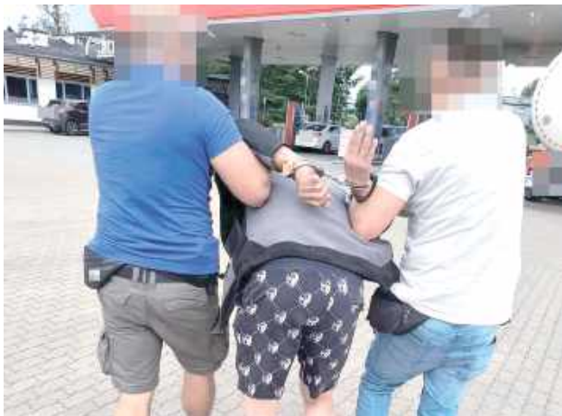
Mężczyzna był totalnie zaskoczony widokiem kryminalnych z Opola Lubelskiego. Robił wszystko, by uniknąć kary - zerwał wszelkie kontakty i często zmieniał miejsce zamieszkania

Opole Lubelskie: Kryminalni z Opola Lubelskiego zatrzymali 35-letniego mężczyznę, który był poszukiwany dwoma listami gończymi. Skutecznie ukrywał się od 2022 roku.