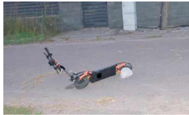
Policjanci ustalili, że 13-letni chłopiec stracił panowanie nad pojazdem i się wywrócił, przy czym uderzył głową w asfaltową nawierzchnię drogi, po której się poruszał

– Zgłoszenie dotyczyło chłopca leżącego na ziemi – był nieprzytomny, a obok niego leżała hulajnoga. Na miejsce natychmiast skierowano patrol policji, a także