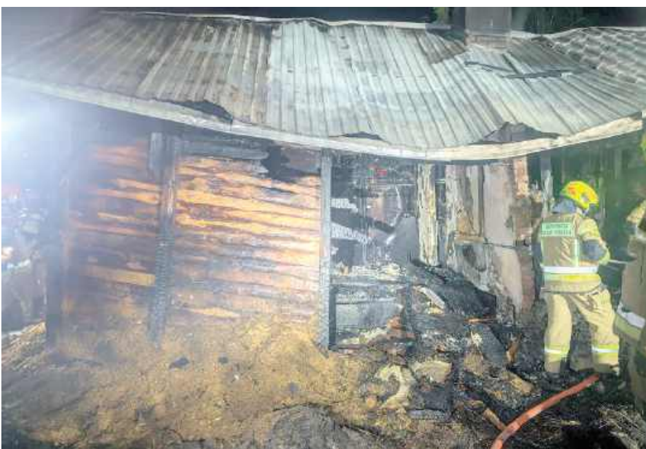
Ze wstępnych ustaleń wynika, że prawdopodobną przyczyną był wybuch gazu

- Ze wstępnych ustaleń wynika, że doszło tam do wybuchu gazu. Budynek uległ całkowitemu zniszczeniu. W chwili wybuchu, wewnątrz przebywał jedynie 49-letni właściciel posesji, który z obrażeniami ciała trafił do szpitala - informuje nadkom. Barbara Salczyńska-Pyrchła z KMP w Białej Podlaskiej.