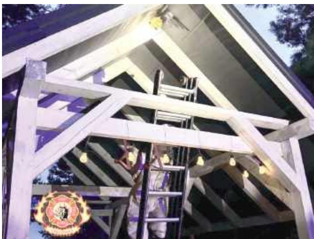
Owady błonkoskrzydłe uwiły gniazdo na placu zabaw

O godzinie 20.55 wpłynęła informacja o obecności owadów błonkoskrzydłych na