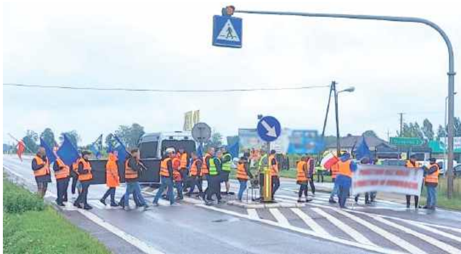
Opady komplikowały sytuację nie tylko protestującym, ale głównie kierowcom zablokowanych pojazdów

Trzydniowa akcja protestacyjna Związku Zawodowego Maszynistów Kolejowych oburzyła wielu białczan, mieszkańców powiatu i przyjezdnych. Choć ludzie często dostrzegali zasadność walki kolejarzy o miejsca pracy, to jednak nie zgadzali się na blokadę międzynarodowej drogi E-30 w Styrzynie.