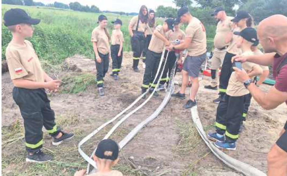
Zorganizowano aż 11 konkurencji

Zbiórka rozpoczęła się tradycyjnie pod strażnicą OSP Jelnica. Następnie uczestnicy w zwartym szyku przemarszerowali nad rzekę Krznię, do miejsca zwanego