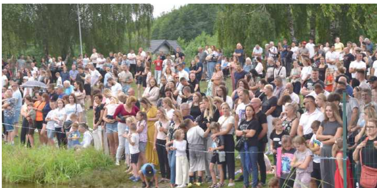
Damian Błaszczak ma ogromną rzeszę fanów!