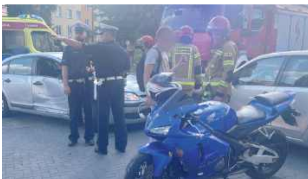
Do kolizji doszło przy ul. Wyszyńskiego

W czwartek, 31 lipca tuż przed godz. 17 na ulicy Wyszyńskiego w Radzynie Podlaskiej doszło do kolizji drogowej z udziałem motocykla marki Honda i samochodu osobowego Citroen.