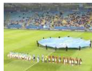
Dynamo awansowało do kolejnej rundy

Przypomnijmy, że ukraińskie zespoły nie rozgrywają meczów na arenie międzynarodowej na własnych stadionach z powodu działań wojennych, które mają miejsce za naszą wschodnią granicą. Zanim rok temu w Lublinie pojawiło się Dynamo, z obiektu przy ulicy Stadionowej w latach 2022-23 przy okazji pucharowych występów korzystała Zoria Ługańsk. Z kolei Szachtar Donieck w przeszłości