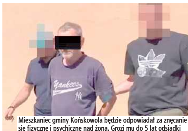
Mieszkaniec gminy Końskowola będzie odpowiadał za znęcanie się fizyczne i psychiczne nad żoną. Grozi mu do 5 lat odsiadki

I powiedział, że zabije. Najbliższe trzy miesiące w areszcie spędzi 61-latek z powiatu puławskiego. Mężczyzna będzie odpowiadał za fizyczne i psychiczne znęcanie się nad żoną. Koszmar kobiety trwał kilka lat.