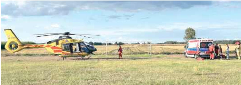
Na miejsce zadysponowano dwa zastępy straży - JRG Łuków i OSP Krynka, które zabezpieczyły lądowanie śmigłowca LPR

- Ze zgłoszenia wynikało, że uczestniczyli w nim młode osoby, które doznały obrażeń ciała. Mundurowi, którzy przyjechali we wskazane miejsce, ustalili, że 22-latek z gminy Łuków i jego 19-letnia koleżanka z gminy Wojcieszków jechali na jednej hulajnodze elektrycznej - infor-