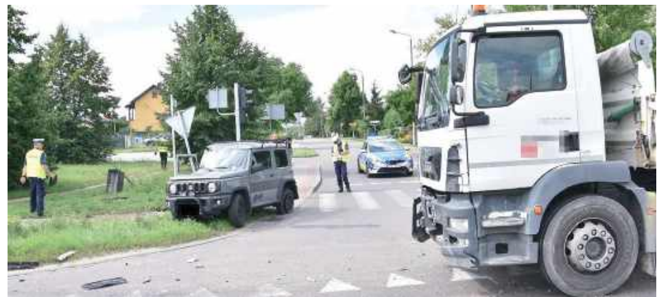
Kierowca osobówki prawdopodobnie nie zastosował się do sygnalizacji świetlnej

– Ze wstępnych ustaleń wynika, że kierujący samochodem osobowym marki Suzuki 62-latek, wykonując manewr skrętu w lewo, zderzył się z jadącym z przeciwka MAN-em. Kierowca osobówki prawdopodobnie nie zastosował