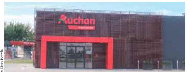
Supermarket Auchan jest już przygotowany do otwarcia

W czwartek (7 sierpnia) zostanie otwarty w Białej Podlaskiej przy ul. Sidorskiej 61A pierwszy sklep pod szyldem Auchan. Obok supermarketu ze znakiem słowika wybudowano stację paliwową.