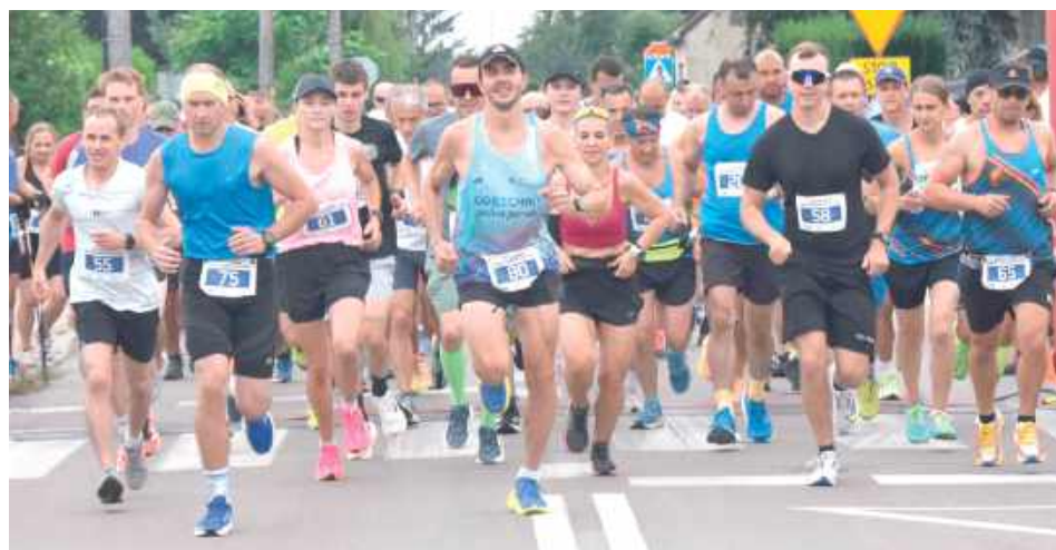
Uczestnicy biegu głównego wystartowali o godz. 11, a pięć minut później na trasę wyruszyli zawodnicy nordic walking

Dziecięce biegi rozegrano na boisku Orlik, znajdującym się tuż za miejską pływalnią. Najmłodszy rywalizowali na trzech dystansach: 100 m, 300 m i 600 m.