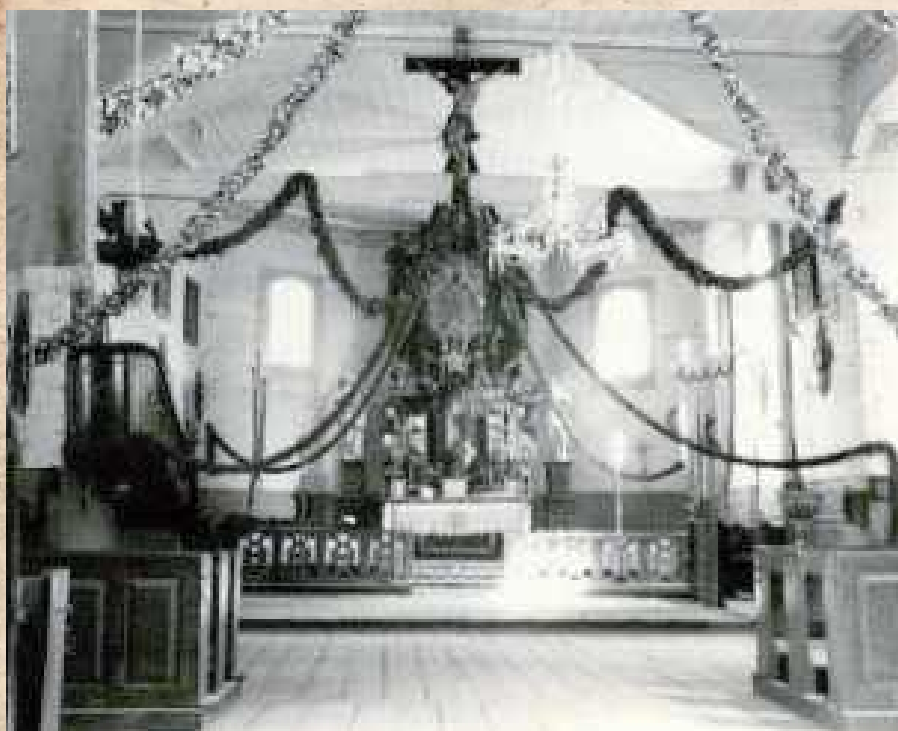
Wnętrze zabytkowego kościoła Wniebowzięcia Najświętszej Marii Panny w Żabiance (gm. Ułęż, powiat rycki) Fotografia z tzw. „karty zielonej” zabytku, sporządzonej w 1957 roku. Świątynia pochodzi z XVIII wieku. W ostatnich latach gruntownie wyremontowany. W lipcu zakończyły się prace nad renowacją elementów wyposażenia - jednego z obrazów i ołtarza bocznego.