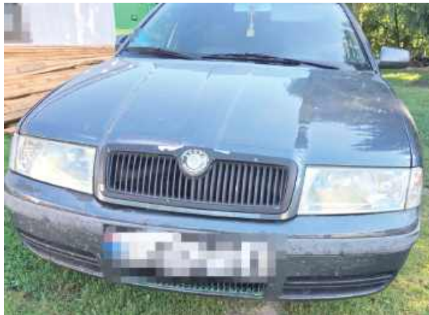
Okazało się, że 51-letni mieszkaniec gminy Karczmiska nie był trzeźwy, podczas badania wydmuchał prawie trzy promile!

POWIAT OPOLSKI: Siedząc za kierownicą Skody, najechał na rowerzystkę, po czym zwiął z miejsca zdarzenia. 51-letni mieszkaniec gminy Karczmiska jest już w rękach policjantów z Opola Lubelskiego. Będzie tłumaczył się przed sądem. Grozi mu do trzech lat odsiadki.