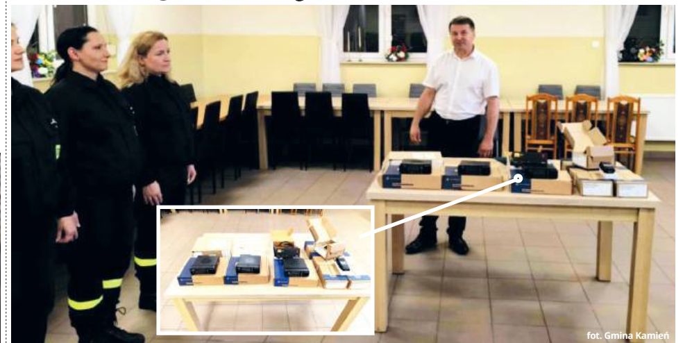
fol. Gmina Kamień

● GM. KAMIEŃ Nowe radiotelefony otrzymała właśnie jednostka Ochotniczej Straży Pożarnej w Kamieniu. Kilka rodzajów nowych urządzeń pozwoli na zachowanie odpowiedniej komunikacji pomiędzy jednostką i poszczególnymi druhami. Jak zapewniają władze gminy, w przyszłym roku na podobne nowinki mogą liczyć także inne jednostki, które działają na terenie gminy.