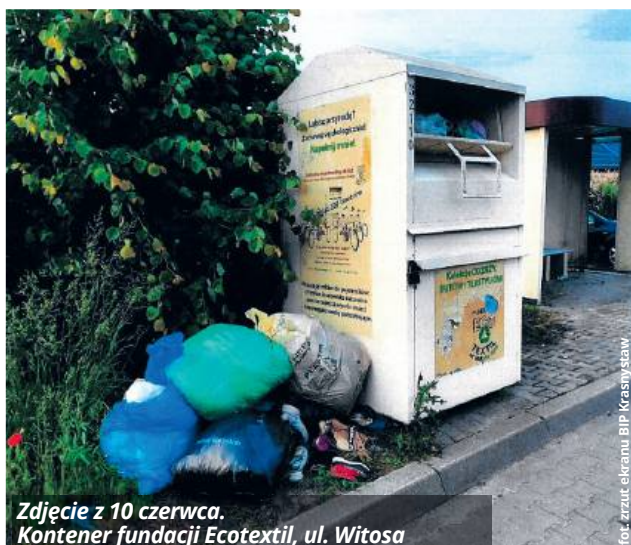
Zdjęcie z 10 czerwca. Kontener fundacji Ecotextil, ul. Witosa

Jak wskazuje radny, problem dotyczy wielu punktów w mieście, gdzie kontenery przeznaczone do zbiórki używanej odzieży są regularnie przepełnione. Mieszkańcy, nie mając innego wyjścia, zostawiają worki z ubraniami obok – często z nadzieją, że zostaną szybko zabrane. Tymczasem z dnia na dzień przybywa kolejnych toreb, a odzież wała się na chodnikach