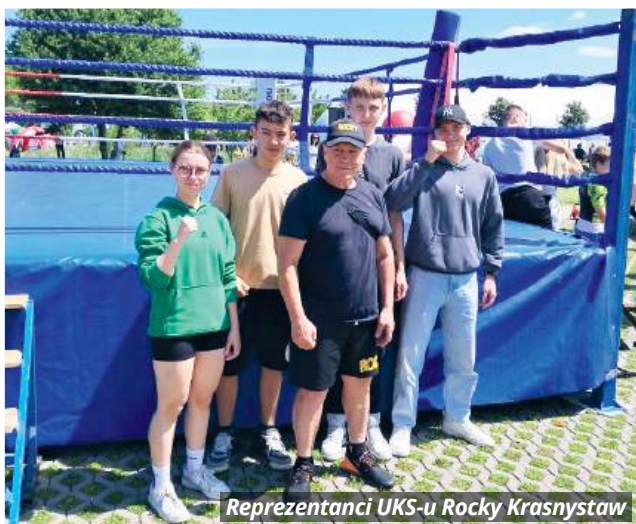
Reprezentanci UKS-u Rocky Krasnystaw

- Jestem bardzo zadowolony z występu swoich zawodników. Można powiedzieć, że nasza główna kadra robi się coraz szersza i w klubie mamy coraz więcej osób chętnych do tre-