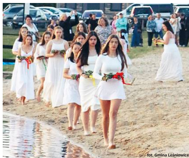
fol. Gmina Leśniowice

I to nie tylko za sprawą pięknej pogody. Przez dwa dni wyjątkowo dużo się tutaj działo. W piątek (20 czerwca) oficjalnie otwarto odnowiony Samorządowy Ośrodek Kultury w Leśniowicach. Tego samego dnia nad Zalewem Maczuley w Horodysku rozpoczęła się dwudniowy Festiwal Letniego Przesilenia - wydarzenie pełne słowiańskiej tradycji, muzyki, świętości i wspólnego świętowania najkrótszej nocy w roku.