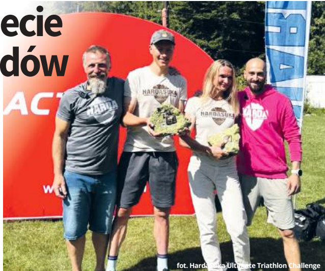
fol. Hardej Suki Ultra Triathlon Challenge