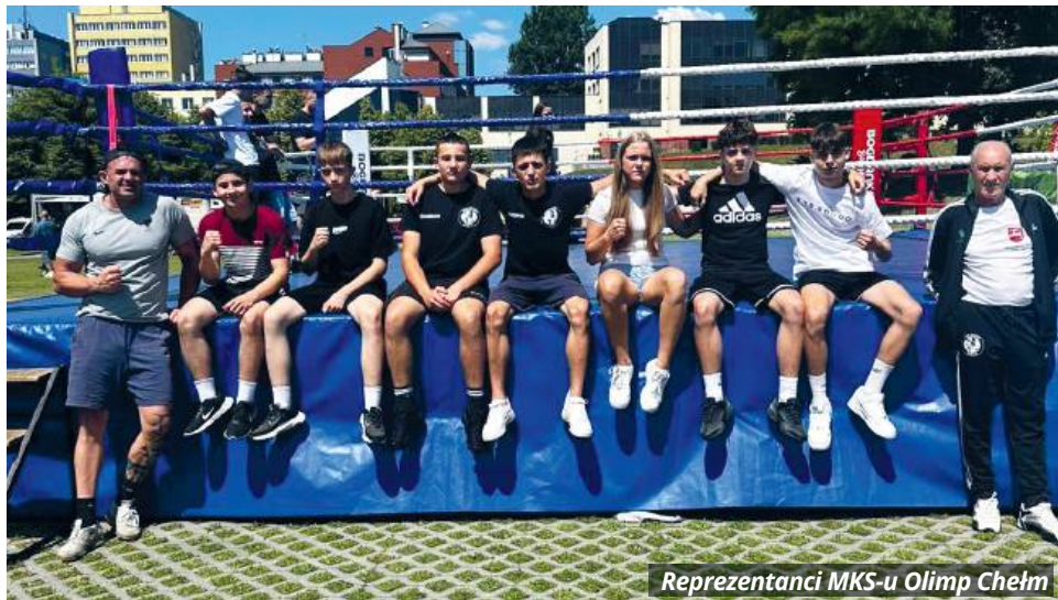
Reprezentanci MKS-u Olimp Chełm

● BOXS Memoriał Stanisława Zalewskiego w Lublinie, który był jednym z elementów obchodów Dnia Olimpijczyka, był ostatnim przedwakacyjnym startem reprezentantów MKS-u Olimp Chełm. W wydarzeniu, w którym boks promowała również medalistka igrzysk Julia Szeremeta, wzięła również udział drużyna UKS-u Rocky Krasnystaw.