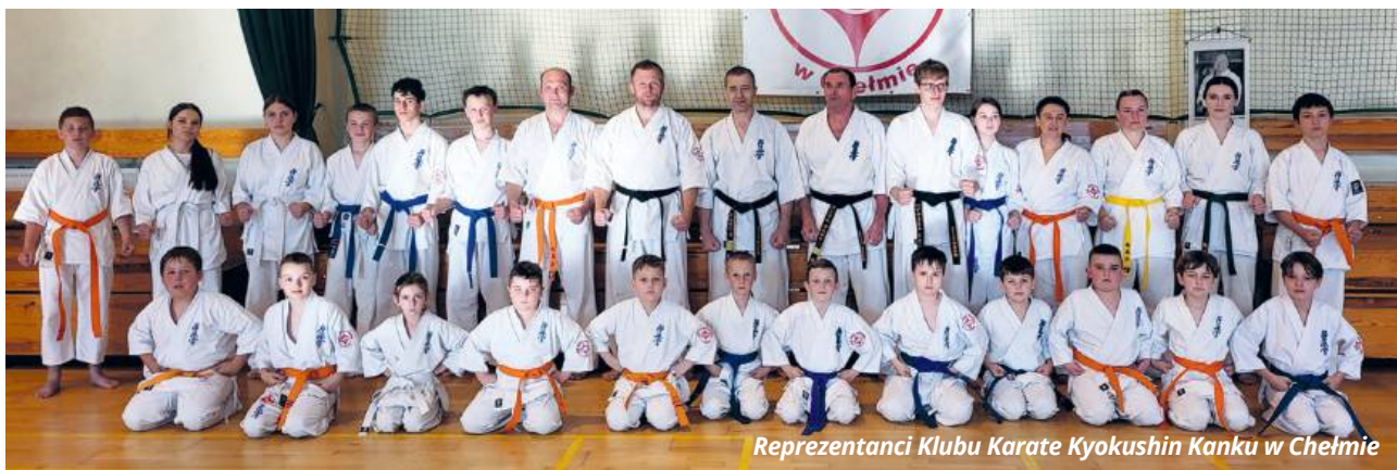
Reprezentanci Klubu Karate Kyokushin Kanku w Chełmie