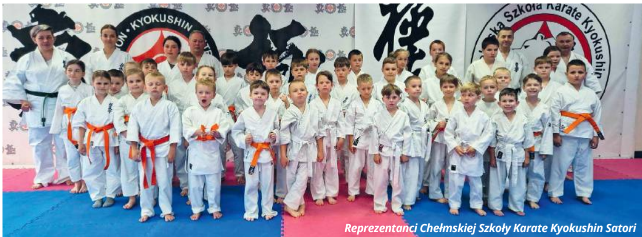
Reprezentanci Chełmskiej Szkoły Karate Kyokushin Satori