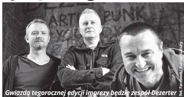
Gwiazdą tegorocznej edycji imprezy będzie zespół Dezerter

Gwiazdą wieczoru będzie Dezerter. To zespół punkrocko-