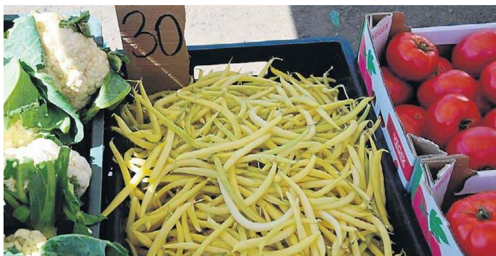
Sezon 2026 zapisze się jako jeden z najtrudniejszych dla rolnictwa w ostatnich latach

Sucha gleba oznacza nie tylko słabszy rozwój roślin, ale także większą podatność na uszkodzenia mrozowe. Rośliny osłabione niedoborem wody gorzej znoszą spadki temperatur i wolniej się regenerują.