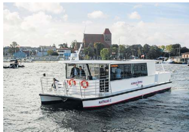
Nazwa powinna pasować do 2 jednostek - np. „Orzeł 1” i „Orzeł 2” lub się uzupełniać, np. „Jaś” i „Małgosia”

Nie trzeba być mieszkańcem powiatu puckiego, ale warto znać jego specyfikę. I zmieścić się w czasie do wtorku 12 maja.