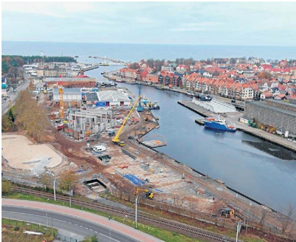
Przykładem local content jest budowa przez Doraco bazy PGE Baltica w Ustce

- W sektorze morskiej energetyki wiatrowej - do instalacji farm na Bałtyku wykorzystywane są wyłącznie jednostki zagraniczne, mimo że polskie stocznie posiadają kompetencje do budowy tego typu statków i wielokrotnie deklarowały gotowość do ich realizacji.