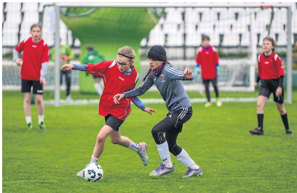
Drużyny dzielnie walczyły o zwycięstwo

- Moim zdaniem jest to jedna z najlepszych imprez, jeżeli chodzi o piłkę nożną dla dzieciaków. Bierzymy udział od dziesięciu lat i to jest najlepszy dowód na to, że jak najbardziej nam się podoba. Mam nadzieję, że zawodniczki od nas w przyszłości zrobią karierę. Za wcześniej na takie oceny, bo na razie jeszcze jest to forma zabawowa. Oczywiście z już z treningami typowo piłkarskimi. Te dziewczynki, które reprezentują naszą szkołę, chodzą do jednej klasy piłkarskiej, więc już wiedzą, co mniej więcej chcą robić w przyszłości. Naszym celem jest to umożliwić i pomóc. Obecnie mamy sześć dziewczynek powołanych do kadry wojewódzkiej na pierwszą konsultację w ich