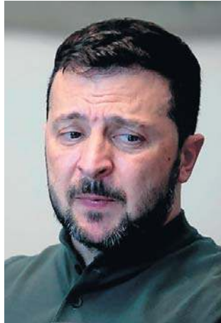
Prezydent Zelenski zaproponował podzielenie się doświadczeniem w walce z dronami

Szef państwa ukraińskiego spotkał się w Manamie z królem Bahrajnu, Hamadem ibn Isą Al Chalifą. „Rozmawialiśmy o uderzeniach z Iranu przeciwko Bahrajnowi i innym krajom oraz o sytuacji wokół Cieśniny Ormuz. Nasz kraj praktycznie codziennie (jest narażony) na podobne ataki terrorystyczne, a nasi ludzie mają odpowiednie doświadczenie w obronie w warunkach pełnowymiarowej