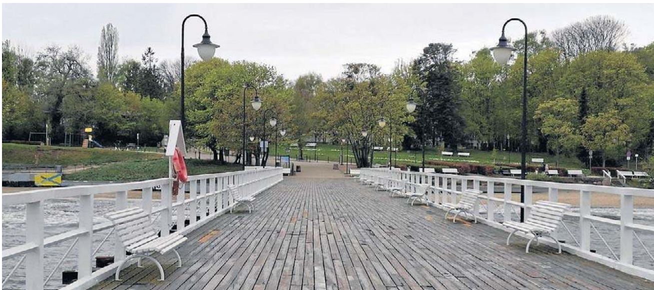
Miało być przygotowanie do nadchodzącego sezonu wakacyjnego, a może być wielomiesięczny remont

Po zdjęciu części pokładu okazało się, że należy wymie-