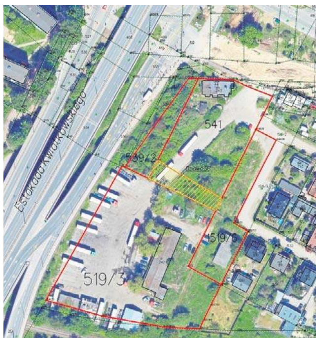
Obszar zakreślony czerwonymi liniami to teren przyszłej komendy policji

Z tą decyzją nie zgadzała się jednak Prokuratura Generalna będąca przedstawicielem Skarbu Państwa, czyli obecny właściciel nieruchomości. Ze względu na stan prawny nieruchomości, Komenda Wojewódzka w Gdańsku podjęła działania mające na celu pozyskanie innego gruntu pod budowę nowej siedziby.