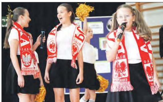
Uczniowie na cześć swojego gościa przygotowali występy artystyczne. M.in. dziewczęta zaśpiewały piosenkę Maryli Rodowicz „Futbol” - hymn radości, pasji i miłości do piłki nożnej