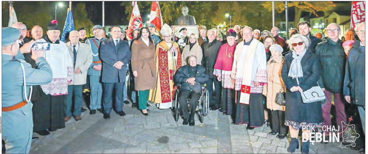
Władze kościelne, miejskie i zwykli mieszkańcy czekali na ten moment od kilku lat. 16 października poświęcony został pomnik św. Jana Pawła II