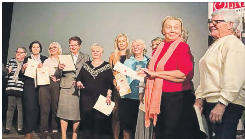
Laureaci konkursów spotkali się w kinie Renesans

- To rzeczywiście pasja mojego taty. Uprawia rododendrony, które 50 lat temu sprowadził ze Szklarskiej Poręby. Ostatnio sam je rozmnaża. Ma też mnóstwo wrzosów - mówi syn To-