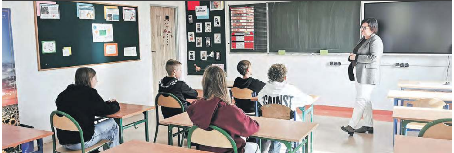
W Szkole Podstawowej w Nowej Rokitni w klasach IV-VIII jest w sumie 63 uczniów. Z edukacji zdrowotnej rodzice wypisali aż 57 uczniów. Na ten przedmiot chodzi tylko 6 uczniów z klasy VI

Ogólnokształcące Liceum Lotnicze w Dęblinie jest jedyną szkołą na terenie powiatu ryckiego, w której na edukację zdrowotną chodzi wszyscy uczniowie. Są też trzy szkoły, w których nikt nie chodzi na nowy przedmiot