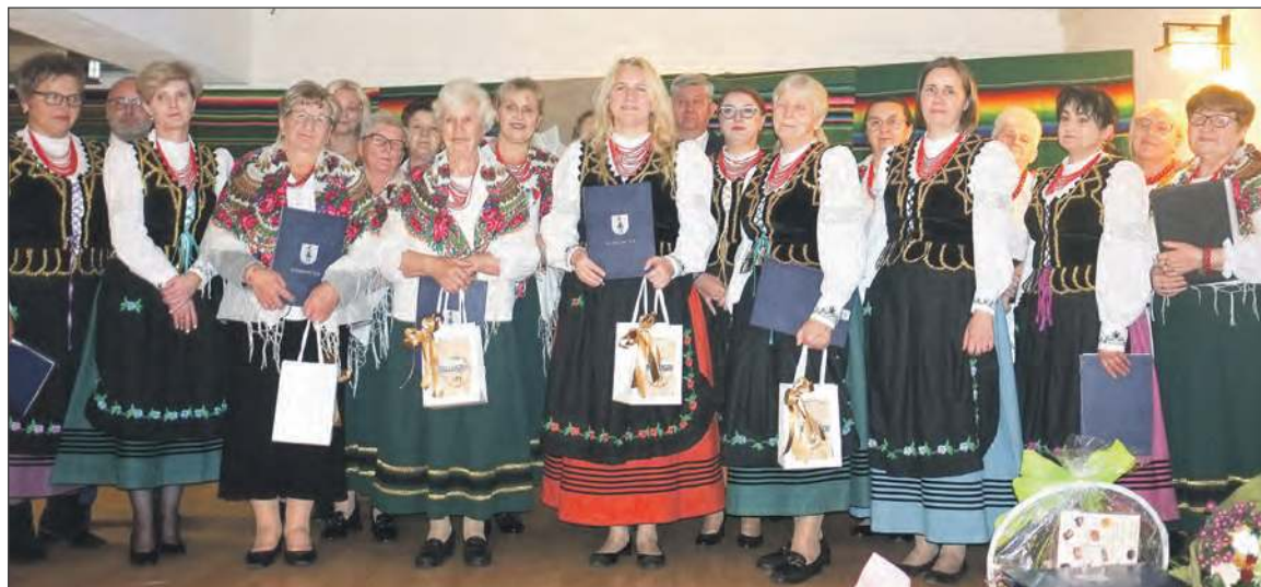
Podczas sobotniego wieczoru Koło Gospodyń w Nowej Dąbi zaprezentowało się w pełnej krasie. Panie otrzymały z okazji jubileuszu wiele prezentów i upominków

Aby podsumować dotychczasową działalność, 18 października Koło zorganizowało jubileuszową zabawę. Zanim jednak przyszła pora na radość i śpiew, gospodynie i goście spotkali się w górnej sali remizy na Mszy św. dziękczynnej. Modlono się za zmarłe i żyjące członkinie KGW oraz o pomyślność organizacji. Mszy przewodniczył proboszcz parafii Ryki,