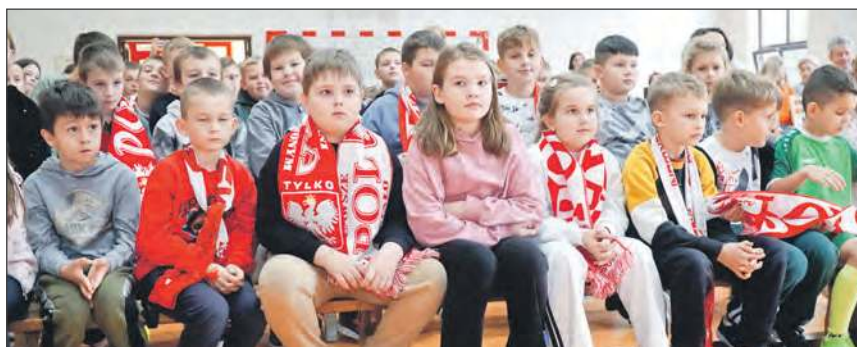
Młodzi miłośnicy piłki nożnej z wielkim przejęciem słuchali ciekawostek o pracy sędziego piłki nożnej

mecz ekstraklasy, a tydzień później mógł biegać po boisku A klasy i to w Stężycy. Czasy były zupełnie inne. 19-letni Listkiewicz na Lubelszczyznę wybrał się autobusem. Nie było bezpośredniego połączenia z Warszawy do Stężycy, więc podróż zaplanował z przesiadką w Rykach. Ostatecznie udało mu się dotrzeć na czas. Ale tu kolejne zakłopotanie. Boisko było takie, jakie było. Nie to co dzisiaj. - Pamiętam, że od FIFA dostałem sprzęt adidasa, w tym torbę i z nią podróżowałem na mecze - wspomina sędzia. Szatni nie było. Przebierać się trzeba było na jednej z ławek ustawionych przy linii bocznej. - Wrzuciłem dzinsy, kurtkę i buty do