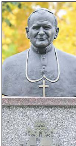
Dęblin, miasto mające patronat św. Jana Pawła II, wzbogaciło się o kolejny ważny symbol

Po Mszy św. uczestnicy, odmawiając różaniec, przeszli na skwer pod pomnik. Na czele procesji relikwie Patrona Dębina nieśli Rycerze Świętego Jana Pawła II.