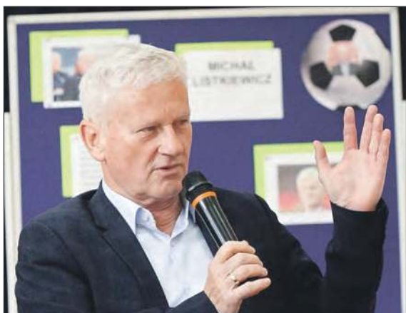
W swoim wystąpieniu Michał Listkiewicz zaapelował do zebranych o aktywność fizyczną. Młodzieży polecał uprawianie sportu i to nie koniecznie tylko piłki nożnej

Jeden z najbardziej znanych polskich sędziów piłkarskich swoją karierę rozpoczął od meczu w Stężycy. Było to na początku lat 70-tych