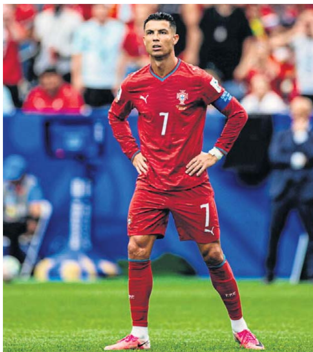
Portugalia zaczęła mistrzostwa od rozczarującego remisu z Demokratyczną Republiką Konga (1:1)

Przez portugalskie media (zwłaszcza społecznościowe) przetacza się prawdziwa burza. Drużyna wskazywana jako jeden z kandydatów do złota kompletnie zawiódła na inaugurację. Nie znalazła bowiem sposobu na Demokratyczną Republikę Konga, remisując z nią 1:1. Wynik odebrano niemal jak porażkę. Słów krytyki nie oszczędzono nikomu, a już zwłaszcza Cristiano Ronaldo. 41-letni lider nie był w końcu w stanie zrobić różnicy na boisku, chociaż przebywał na nim - ku zaskoczeniu kibiców - do ostatniego gwizdka. Oburzenie wywołały nawet wypowiedzi piłkarzy - o kapitanie. Oberwało się Joao Nevesowi za słowa, że Ronaldo „to kolejny zawodnik (...), który nie jest inny od nas, jest jednym z nas”. Gdy ogień już nieco przygasł, wtedy paliwa dołączył Francisco Conceicao. Tuż przed kolejnym występem powiedział bowiem, że oni i koledzy „nie czują potrzeby ani obowiązku podawania piłki do Ronaldo”. Sam CR7 niezmiennie wysłał pozytywne przekazy. Na swoim koncie na Instagramie, śledzonym przez 667 mln osób z całego świata, opubli-