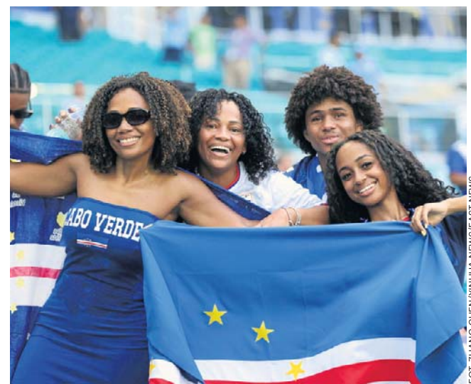
Kibice skandują w językach portugalskim i kriolskim, tzw. kriolu, „do boju!”, czyli „Vamos!” oraz „Nubai!”

W ostatniej kolejce, 26 czerwca (piątek), Republika Zielonego Przylądka zagra z Arabią Saudyjską. ©