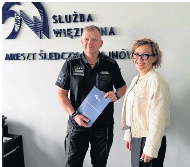
FOT. ARESZT ŚLED CZY HAJNÓWKA

Areszt Śledczy w Hajnówce przystąpił do pilotażowego programu Ministerstwa Sprawiedliwości, zakładającego tworzenie minischronisk dla psów. Jego partnerem w tym zadaniu będzie Schronisko dla Bezdomnych Zwierząt „Zwierzaki do wzięcia” w miejscowości Gózd w województwie lubelskim. W ramach projektu areszt wybuduje pięć domków, w których docelowo zamieszkać czworonogi, nad którymi opiekę będą sprawować osadzeni.