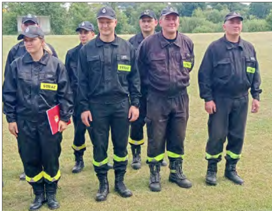
✚ Druhowie z Sobieszyna trzeci rok z rzędu okazali się najlepsi w swojej gminie