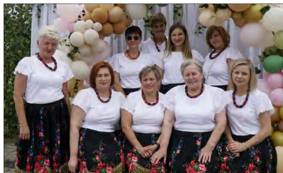
Na gościnne występy do Brzezin przyjechały przedstawicielki KGW Piotrowice