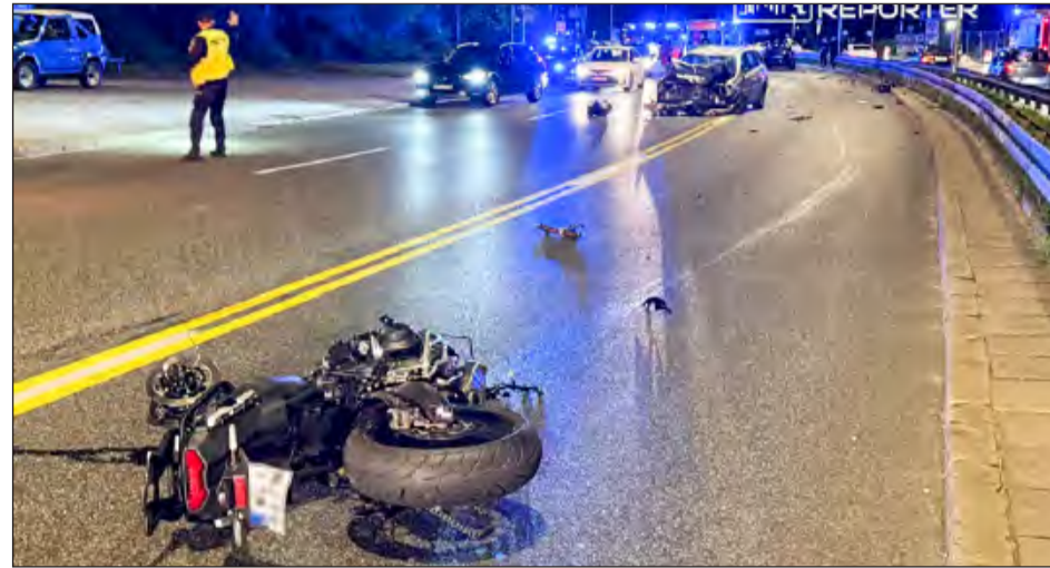
W wypadku spowodowanym przez młodego kierowcę zginął pochodzący z Ryk 45-letni Norbert i jego 13-letni syn. Wracali motocyklem do domu w powiecie legionowskim

W wypadku spowodowanym przez młodego kierowcę zginął pochodzący z Ryk 45-letni Norbert i jego 13-letni syn. Sprawca, który miał sądowy zakaz prowadzenia pojazdów, uciekł z miejsca zdarzenia