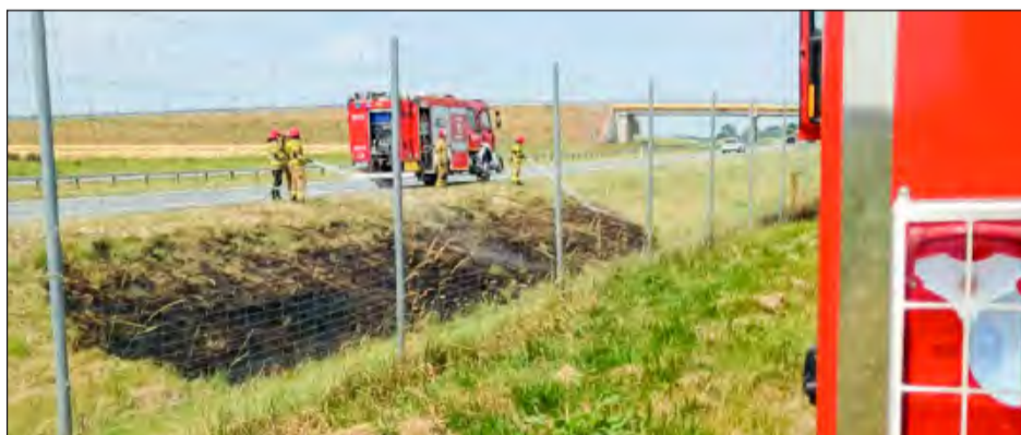
Strażacy z Ryk zostali wezwani do pożaru na poboczu drogi ekspresowej S-17 w miejscowości Stara Dąbia

Na miejsce natychmiast skierowano zastępy z OSP Dęblin-Masów oraz PJRG Dęblin-Masów. Strażacy zabezpieczyli teren i podali prąd wody, gasząc ogień dosłownie kilka metrów od płotów posesji. Dzięki ich szybkiej i sprawnej akcji udało się zapobiec rozprzestrzenieniu się pożaru na budynki.