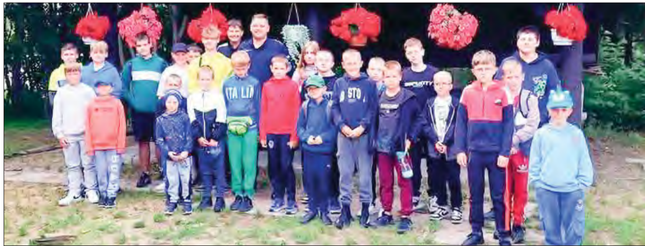
Wakacyjna Szkołka Wędkarska jak co roku cieszy się dużą popularnością wśród młodych adeptów tej możliwości aktywnego spędzania czasu na wolnym powietrzu