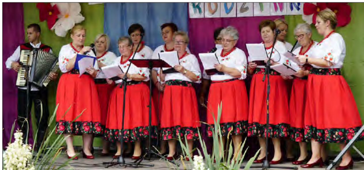
Festyn rodzinny rozpoczął występ jego organizatorek, czyli KGW Brzezin