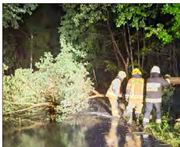
■ Powalone drzewo na drogę. Działania strażaków w Grabowie Szlacheckim

W poniedziałek strażacy interweniowali w Żabiance (gm. Ułęż), gdzie nadłamana konar blokuje jeden pas