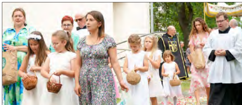
➤ Wszyscy zadbali o to, aby procesja odpustowa dobrze się zaprezentowała. Nie zabrakło dziewczyniak syjących płatkami kwiatów przed eucharystycznym Jezusem