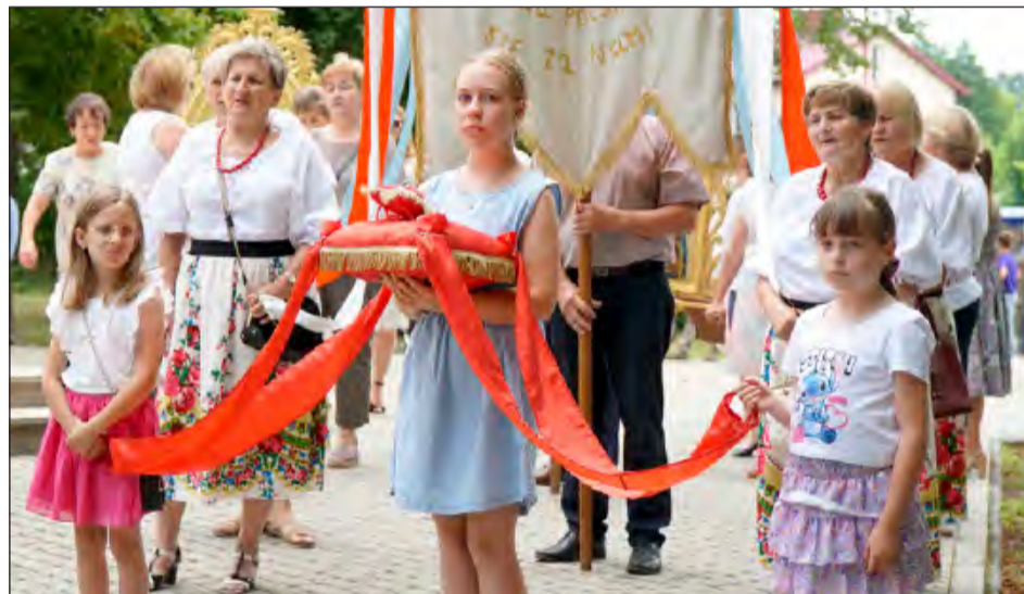
➤ Kulminacyjnym punktem odpustu była barwna procesja eucharystyczna wokół świątyni, po niej wszyscy wspólnie odśpiewali hymn Te Deum

21 lipca, poniedziałek WSPOMNIENIE ŚW. WAWRZYŃCA Z BRINDISI, PREZBITERA I DOKTORA KOŚCIOŁA ALBO WSPOMNIENIE ŚW. APOLINAREGO, BISKUPA I MĘCZENNIKA - FUNKCJONARIUSZE SB WYŁAMALI BRAMĘ I PRZEPROWADZILI REWIZJĘ INSTYTUTU PRYMASOWSKIEGO NA JASNEJ GÓRZE (1958 R.)