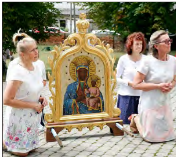
➤ Między Mszą św. a procesją wierni modlili się do Matki Bożej