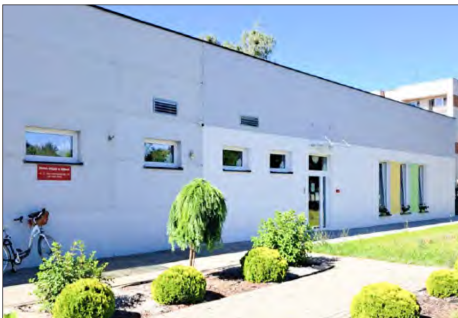
Całkowita powierzchnia rozbudowanej części żłobka zajmuje 217 m 2 . Udało się w niej rozlokować aż 11 pomieszczeń

Wszystkie sale, zarówno ta dla dzieci, jak i dla personelu są gotowe. Pozostało tylko urządzenie gabinetu dyrektora. Ten zostawiliśmy na sam koniec - mówi Małgorzata Olszak, dyrektor żłobka. Na zakup wyposażenia przeznaczono 100 tys. zł z budżetu placówki. Roz-