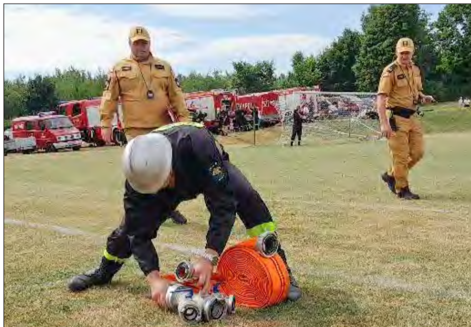
✚ W konkurencjach strażackich oprócz szybkości bardzo ważna jest także precyzja oraz poprawne wykonanie zadania nad czym czuwają sędziowie zawodów