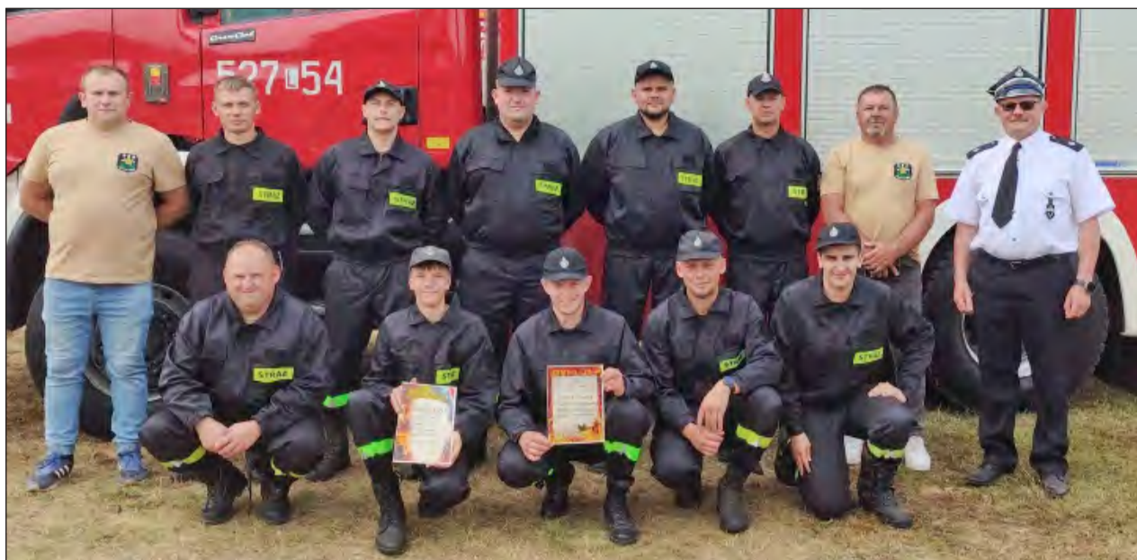
✚ Drużyna OSP Trzcianki wygrała nie tylko konkurencję gminną, ale okazała się również najlepsza w rywalizacji międzygminnej