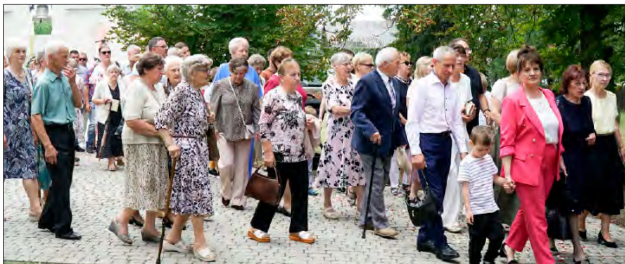
➤ W uroczystości odpustowej licznie udział wzięli parafianie ze Stężycy i ich goście