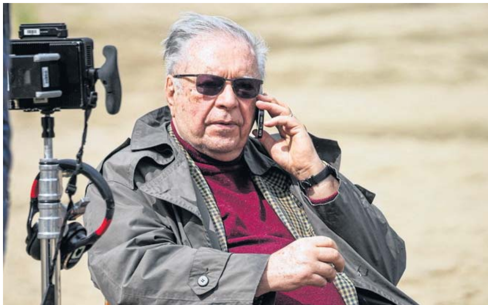
Krzysztof Zanussi pojawił się na planie filmu „Całopalenie” w pierwszy dzień zdjęciowy

Praca ze szpitalnego łóżka Przez większość zdjęciowych dni w Toruniu Krzysztofa Zanussiego nie było na planie „Całopalenia”, chociaż przebywał w mieście. W pierwszy