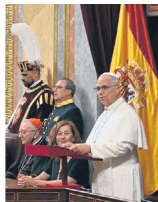
Parlamentarzyści zgotowali papieżowi owację

Papież gościł w niższej izbie parlamentu królestwa Hiszpanii, noszącego nazwę Kortezy Generalne. Przemawiał jednak do członków obu izb. Na sali zabrakło parlamentarzystów lewicowego ugrupowania Podemos i lewicowo-nacjonalistycznego bloku galicyjskiego BGN, którzy zaprotestowali w ten sposób przeciwko obecności przywódcy religijnego w parlamencie świeckiego państwa. Na wstępie zadeklarował: - Staję przed wami jako biskup Rzymu i pasterz Kościoła katolickiego świadomy, że misja powierzona Następcy apostoła Piotra