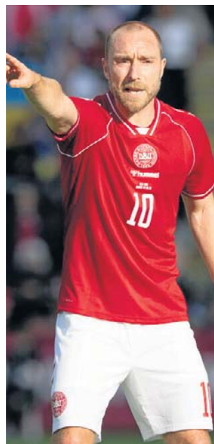
Możliwe, że po drugim takim zajściu, Christian Eriksen zakończy sportową karierę...

- To może być dla danej osoby bardzo gwałtowne doświadczenie, ponieważ przypomina porażenie prądem z zwykłego defibrylatora. Człó-