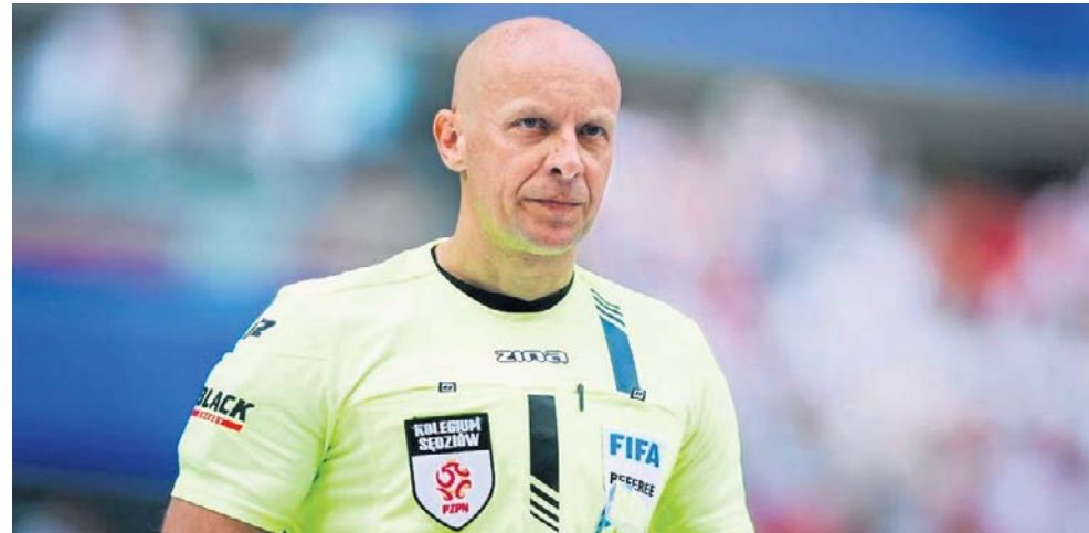
Szymon Marciniak jako sędzia był już na dwóch mundialach: w 2018 oraz 2022 roku. Prowadził w nich w sumie pięć meczów, w tym finał Argentyna - Francja na MŚ w Katarze

11 dni, by dzień w dzień po parę godzin oglądać tysiące klipów, żeby sytuacje boiskowe były oceniane podobnie. Kiedy kibic będzie siedział przed telewizorem, to będzie widział, że nieważne czy sędzia jest z Europy czy z Afryki, ale ocenia zdarzenie podobnie. Wtedy każdy sobie pomyśli, no okej, mogą się trochę nie zgadzać, ale każdy z nich ocenia podobnie i to jest zarówno dla piłkarzy, jak i dla kibiców najważniejsze. Te 11 dni będzie niezbyt miłe. W temperaturze 35-36 stopni i ogromnej wilgotności 90-93 procent będziemy dzień w dzień po 2-3 godziny na boisku, a potem po 4-5 godzin w salce, gdzie będziemy oglądali klipy, ale lepiej te dwa tygodnie poświęcić i jeszcze raz sobie przypomnieć pewne rzeczy po to, żeby potem podczas turnieju, podczas tych najważniejszych meczów, spijać tę śmietankę.