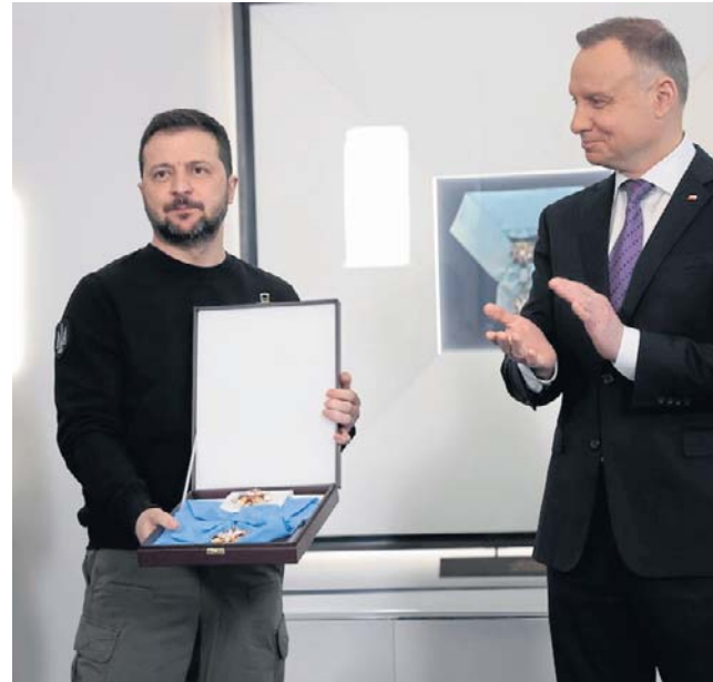
Zeleski został odznaczony Orderem Orła Białego w kwietniu 2023 roku przez prezydenta Andrzeja Dudę

„Ponieważ dyplomacja nie przyniosła żadnych efektów, zwracam się publicznie do Prezydentów Karola Nawrockiego i Wołodymyra Zeleskiego o bezpośrednią i szczerą rozmowę. Zanim emocje zrujnują naszą solidarność, która narodziła się w obliczu rosyjskiego zagrożenia” - napisał premier. Podkreślił, że „współpraca leży w interesie obu naszych państw i narodów, a konflikt w interesie Mo-