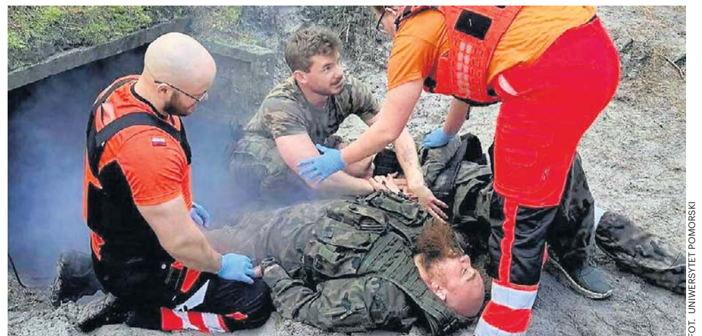
Uczestnikom zaprezentowano najróżniejsze scenariusze i objaśnione były kroki w celu uratowania ludzkiego życia

W Manewrach Ratowniczych 2026 wzięli udział studenci Uniwersytetu Pomorskiego, pracownicy oraz goście zainteresowani nowoczesnym ratownictwem medycznym i symulacją medyczną.