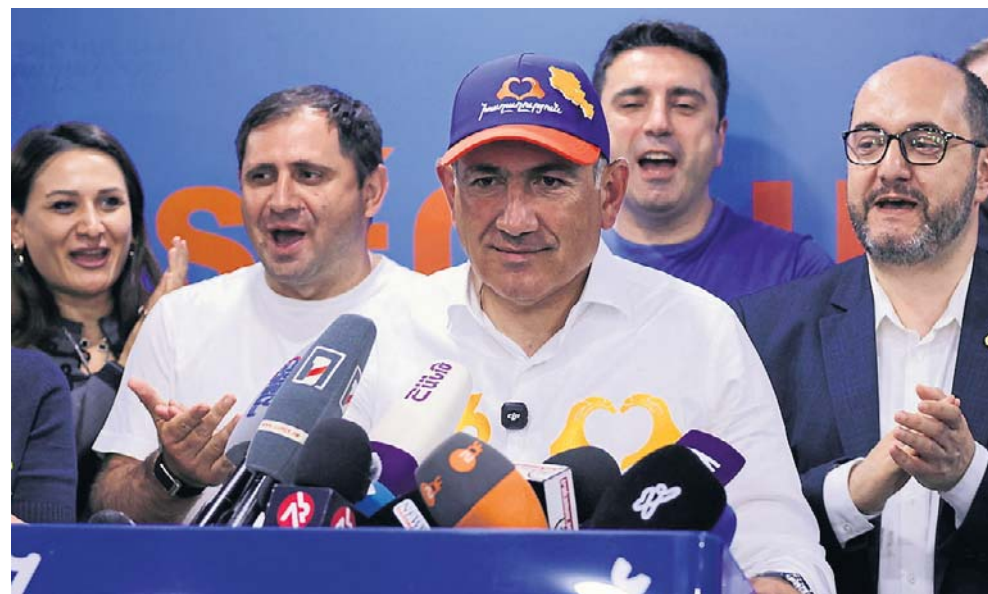
Premier Armenii Nikol Paszynian przemawiał w siedzibie swojej partii Umowa Społeczna po wygranych wyborach parlamentarnych w Erywanu

Paszynian oświadczył, że „trójgłowa partia wojny została zmiądzdzona”. Paszynian od lat przedstawia opozycję jako siłę, która dąży do ponownego rozpoczęcia wojny z Azerbejdżanem.