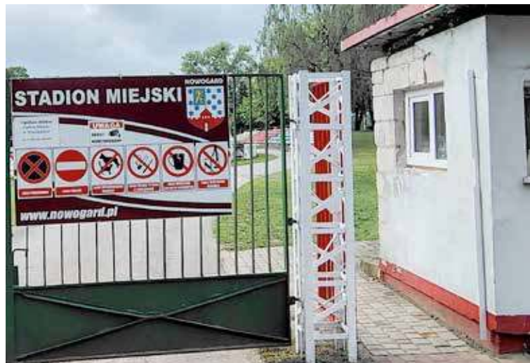
Wjazd na stadion, póki co, pozostanie reglamentowany