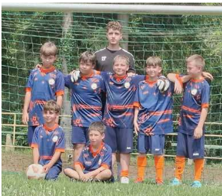
Pierwsza Piłka w Golczewie