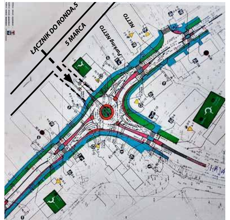
Szkic połączenia ul. 5 Marca z rondem

wien niewielki (także nieistotny finansowo) zabieg, a to rondo mogłoby mieć pewien pozytywny wpływ na drożność ruchu w jego okolicy i w konsekwencji w całym układzie komunikacyjnym miasta. O co chodzi? Otóż aż się prosiło, aby do ronda o jedynie trzech wlotach doliczyć czwarty wlot, czyli krótki (60–70 metrów) łącznik z ulicą 5 Marca — patrz załączony rysunek z naniesioną koncepcją takiego połączenia ronda z ulicą 5 Marca. Nie miałbym szacunku dla inteligen-