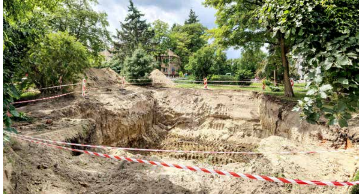
Dół przy parkingu Netto: Wszyscy czekają na „wielką” przepompownię, która ma tu stanąć