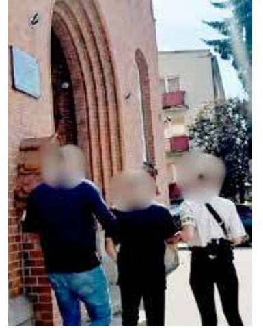
30-latek został doprowadzony przed goleniowski sąd

Mężczyzna był już wcześniej karany za kierowanie pojazdem pomimo obowiązującego zakazu prowadzenia, dlatego odpowie za ten czyn w warunkach recydywy. Niewykluczone jest również przedstawienie mu