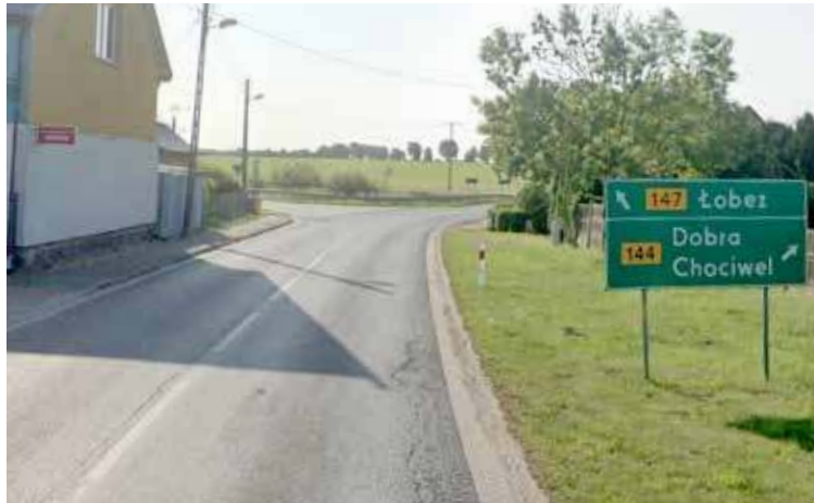
Skrzyżowanie DW w Wierzbęcino. Prace planowane są od tego miejsca

szerszy program „Pomorzanie Zachodnie na Dobrej Drodze”, obejmujący 36 zadań o łącznym budżecie 269 mln zł. Program zakłada poprawę stanu technicznego dróg