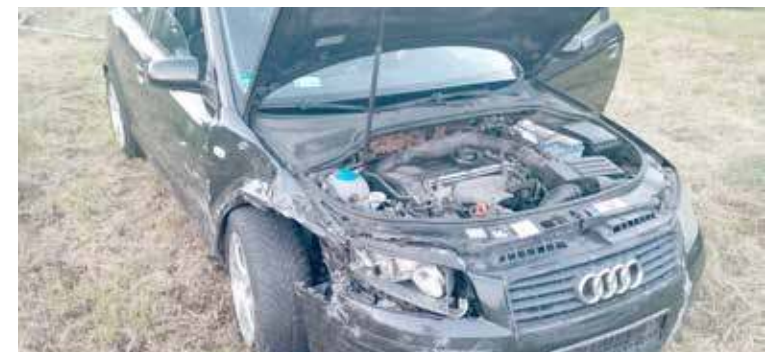
W Kliniskach Wielkich sprawca wysiadł z rozbitego pojazdu i podjął próbę ucieczki pieszo