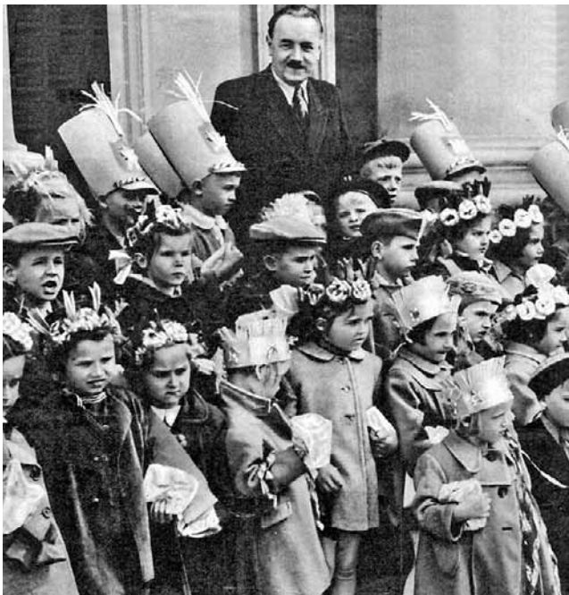
Bolesław Bierut wśród dzieci, kwiecień 1951 r.

Po zajęciu Polski przez Armię Czerwoną jako przewodniczący KRN pełnił funkcję nieformalnej głowy państwa. Po sfałszowanych wyborach do Sejmu Ustawodawczego z 1947 r. Bolesław Bieruta wybrano prezydentem Rzeczypospolitej. Towarzyszył temu ceremoniał znany z czasów II RP. Bierut deklarował się jako ateista, lecz gdy składał ślubowanie jako prezydent RP zakończył je słowami „Tak mi dopomóż Bóg”. W latach czterdziestych uczestniczył w wielu uroczystościach państwowych, którym z reguły towarzyszyły nabożeństwa. Zachowały się fotografie przedstawiające Bieruta klęczącego podczas mszy. Były to jednak wyłącznie gesty pokaz. Po włączeniu PPS do PPR w grudniu 1948 r. został sekretarzem Komitetu Centralnego Polskiej Zjednoczonej Partii Robotniczej. W swoich rękach skupił właściwie całą władzę w państwie. Odpowiadał za represje polityczne lat czterdziestych i pięćdziesiątych oraz budowę