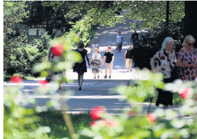
Ogród Saski zajmuje 12,5 hektara powierzchni i jest najczęściej odwiedzany przez lublinian parkiem

- Po kilkunastu latach eksploatacji kilka elementów należy poprawić - mówi Tomasz