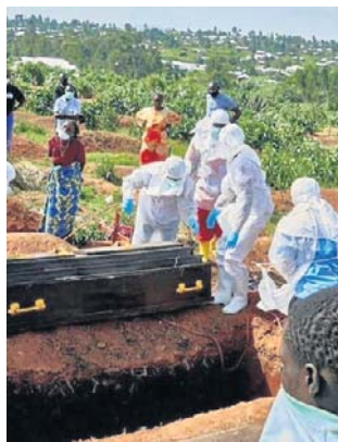
WHO ogłosiła epidemię w DR Konga i Ugandzie

Lokalni lekarze twierdzą, że pacjent zero przybył do szpitala pod koniec stycznia i zmarł w lutym. „The Telegraph” donosi, że pacjent zaraził następ-