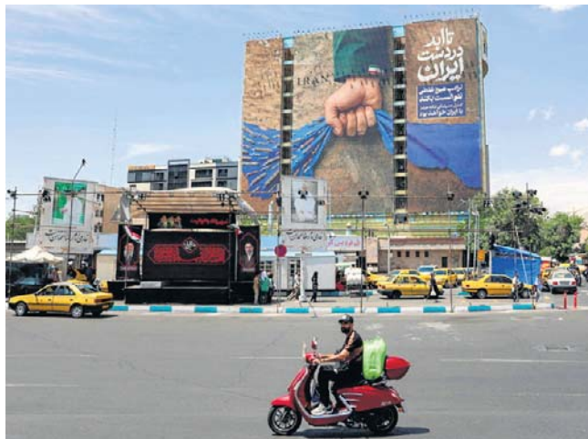
Billboard w Teheranie z napisem „Cieśnina Ormuz na zawsze w rękach Iranu”

Irańscy urzędnicy przedstawiają to żądanie jako test wiarygodności, a nie ustępstwo. W tym samym raporcie podkreślono, że wcześniejsze doświadczenia – zwłaszcza porozumienia dotyczące zamrożonych irańskich aktywów w Korei Południowej i Katarze – sprawiły, że Teheran obawia się opóźnień lub niepełnych transferów. „Biorąc pod uwagę dotychczasową niewiarygodność