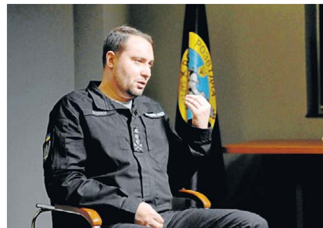
Kyrył Budanow powiedział, że Ukraina spodziewa się niebawem wizyty amerykańskiej delegacji w Kijowie