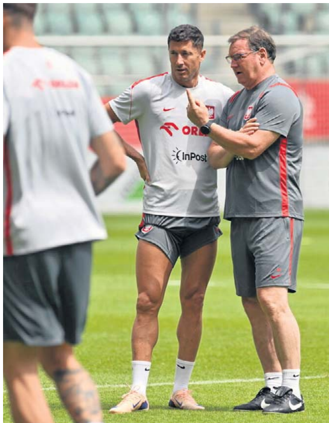
Selekcjoner Jan Urban dokona roszad w składzie, ale Robert Lewandowski przeciw Nigerii powinien zagrać

- Straciliśmy dwóch zawodników. Osimhen prawdopodobnie zmieni klub, więc wolałbym, żeby został w domu, jeśli miałby nie zagrać na 100 procent. Jeśli chodzi o Lookmana, jest bardzo zmęczony i Atletico prosiło nas o jego zwolnienie - wyjaśniał Chelle absencję swoich dwóch najjaśniejszych gwiazd w reprezentacji, z którą w ostatnim Pu-